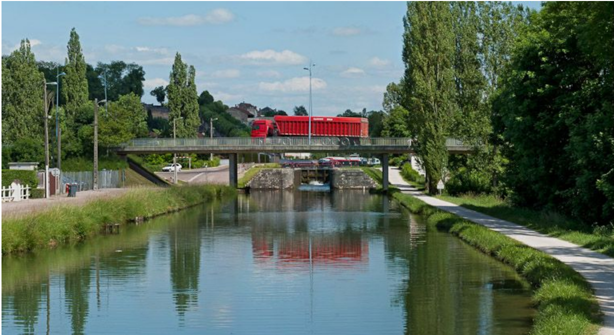
Le pont avec le site d'écluse en arrière-plan.

21, Montbard, lieudit : bief 66 du versant Yonne