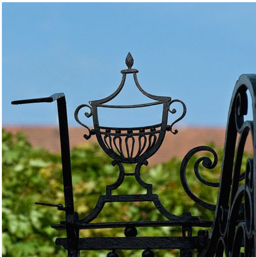
Cour d'angle sur rue : détail du portail en fer forgé.