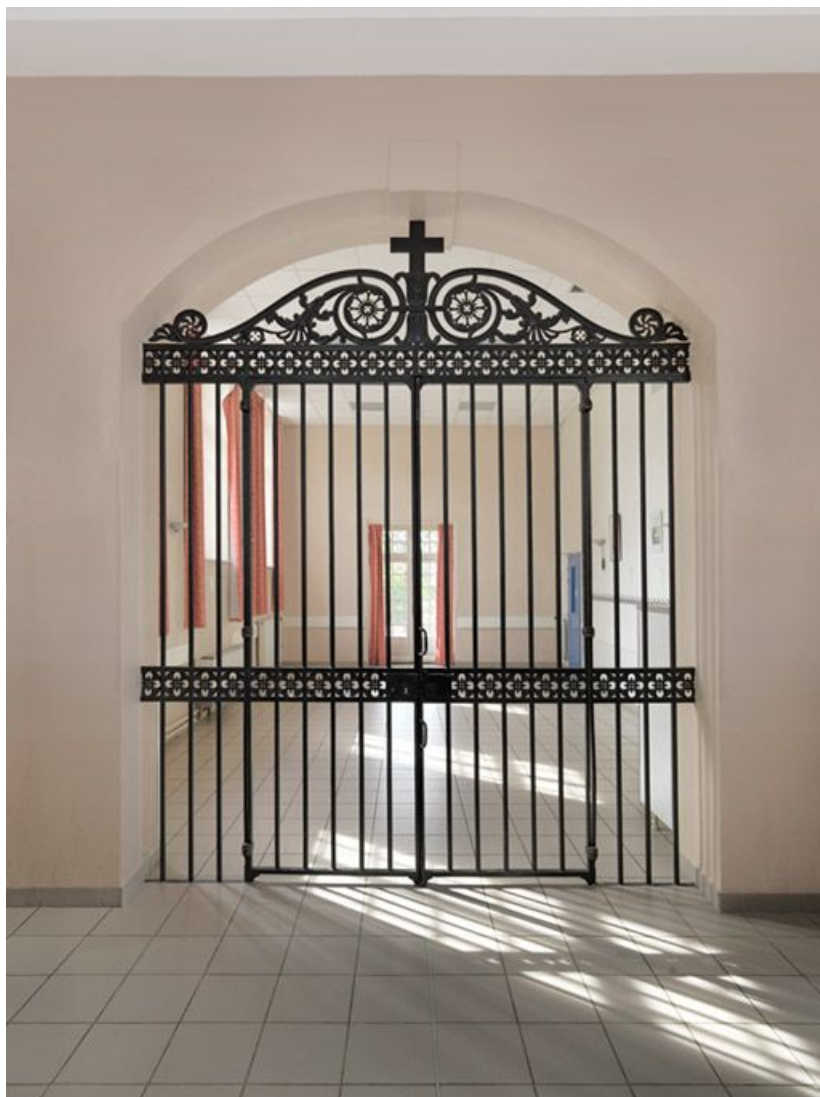
Grille entre l'ancienne salle des femmes et celle des hommes.