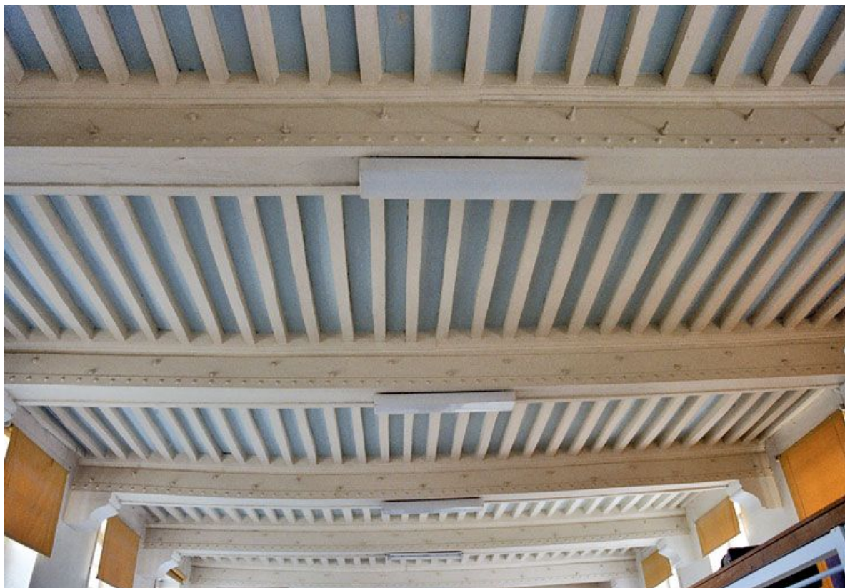
Bâtiment de plan en U : plafond d'une salle de malades, avant travaux. 21, Saint-Jean-de-Losne place d' Armes