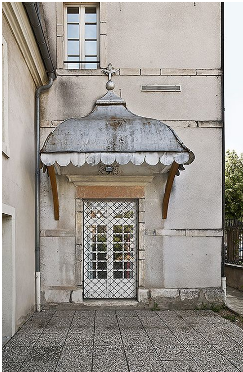
Cour d'angle sur rue : porte sous auvent.