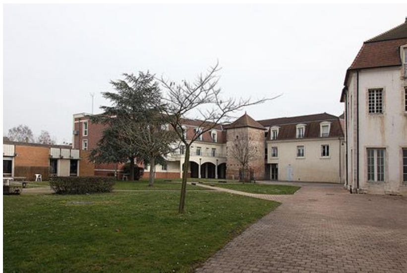
Puits et colombier devant des bâtiments construits vers 1995.