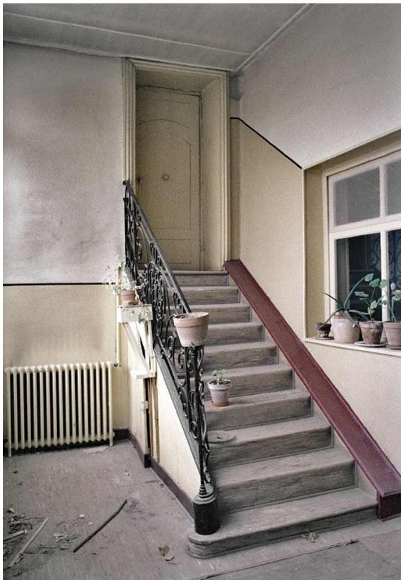
Immeuble en retrait sur la rue, avant travaux : escalier de la galerie postérieure menant au rez-de-chaussée surélevé de l'aile ouest. 21, Saint-Jean-de-Losne place d' Armes