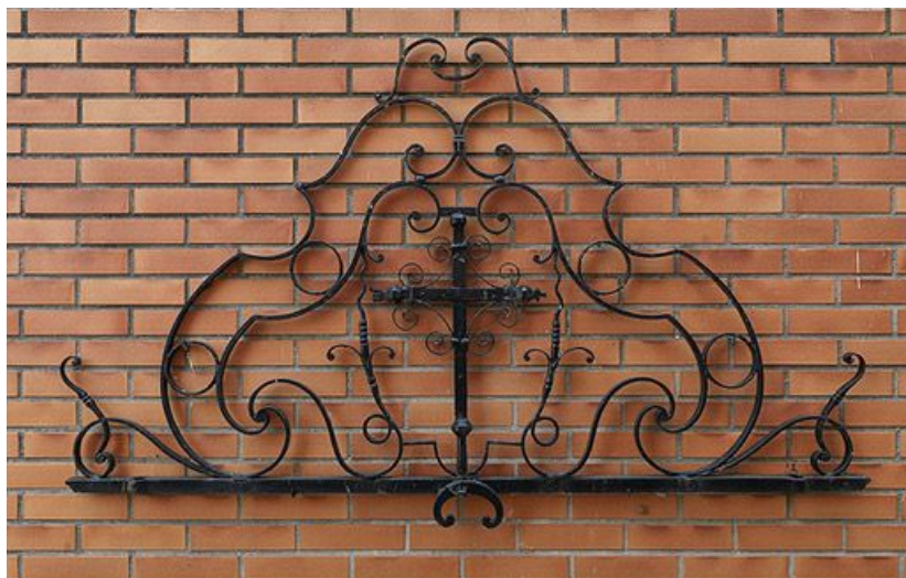
Couronnement de l'ancien portail en fer forgé du jardin.