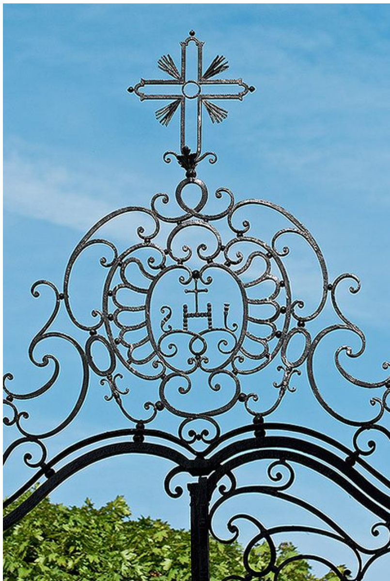
Cour d'angle sur rue : détail du couronnement du portail en fer forgé. 21, Saint-Jean-de-Losne place d' Armes