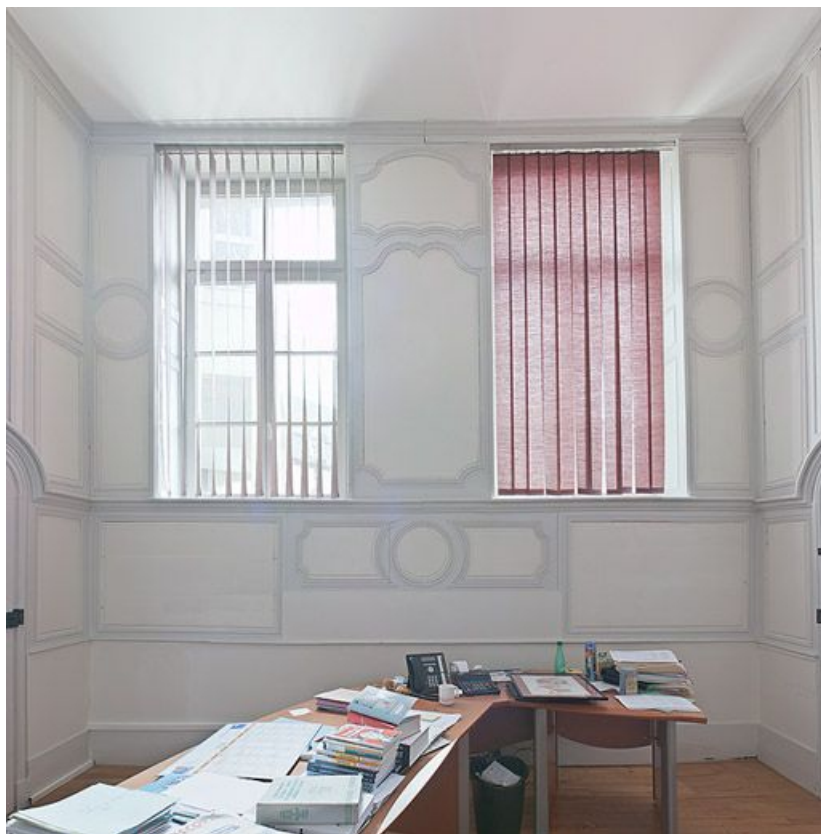
Aile droite : pièce du rez-de-chaussée, actuellement bureau de la directrice. 21, Saint-Jean-de-Losne place d'Armes