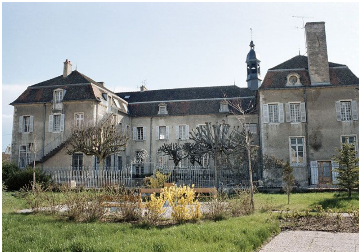
Bâtiment de plan en U : façade postérieure sur jardin, avant travaux. 21, Saint-Jean-de-Losne place d' Armes