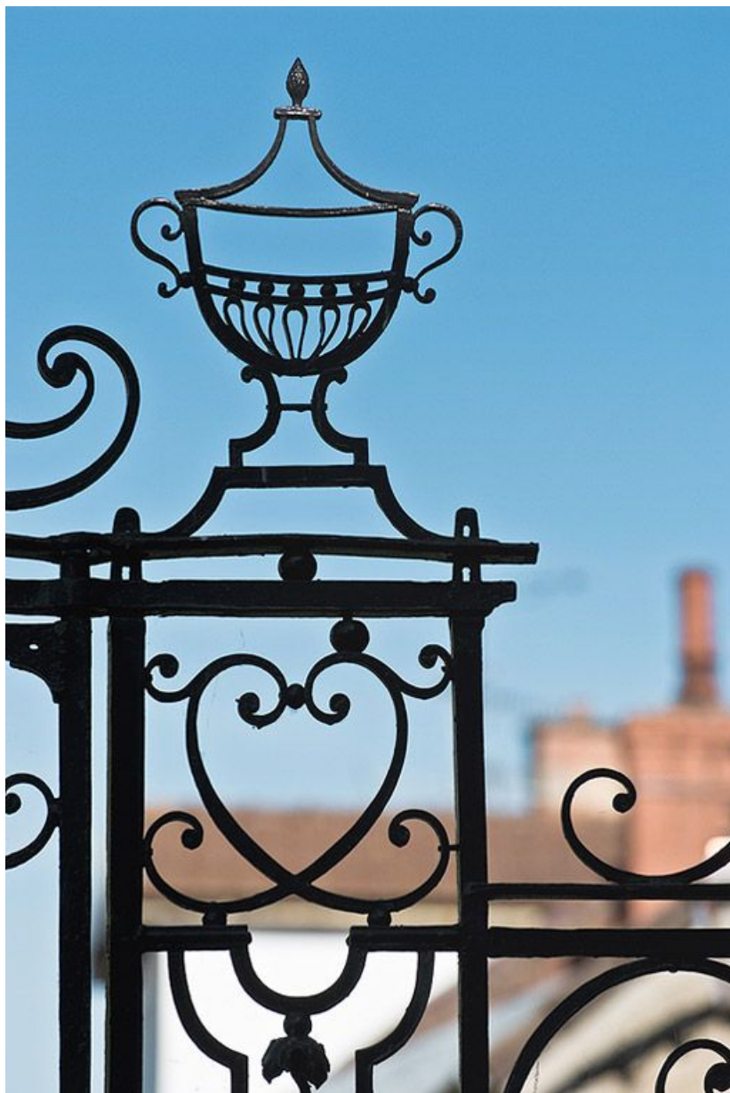
Cour d'angle sur rue : détail du portail en fer forgé. 21, Saint-Jean-de-Losne place d' Armes