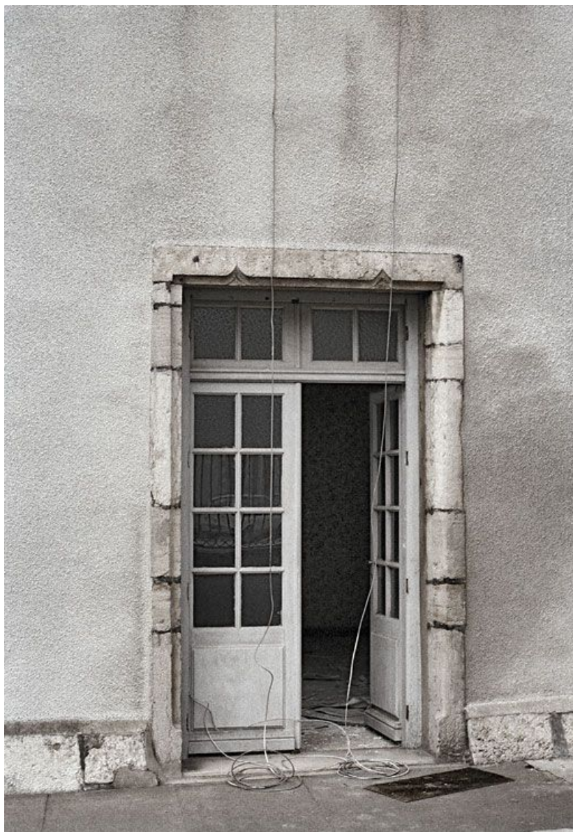
Immeuble en retrait sur la rue, avant travaux : détail de la porte à encadrement mouluré.