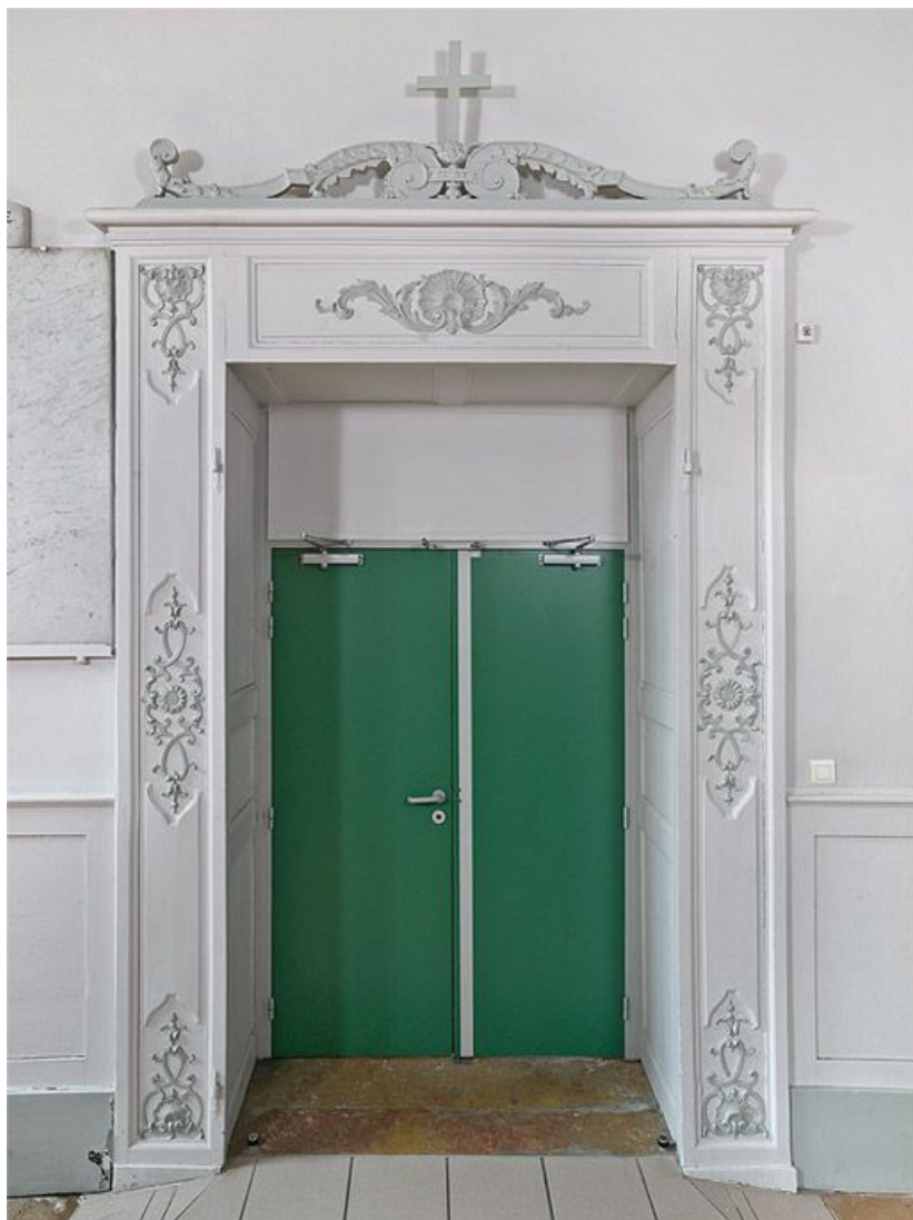
Porte d'entrée de l'ancienne salle des femmes.