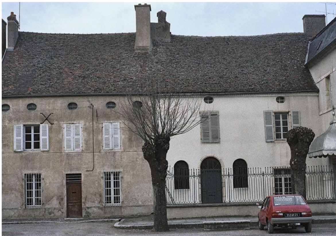
Immeuble en retrait sur la rue, avant travaux. Les ouvertures en plein-cintre de la chapelle n'existent plus. 21, Saint-Jean-de-Losne place d' Armes