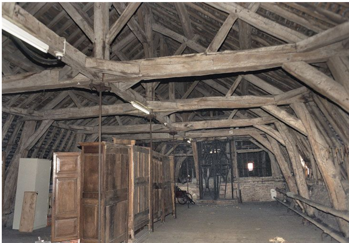
Bâtiment de plan en U : comble du corps principal, avant travaux. 21, Saint-Jean-de-Losne place d' Armes