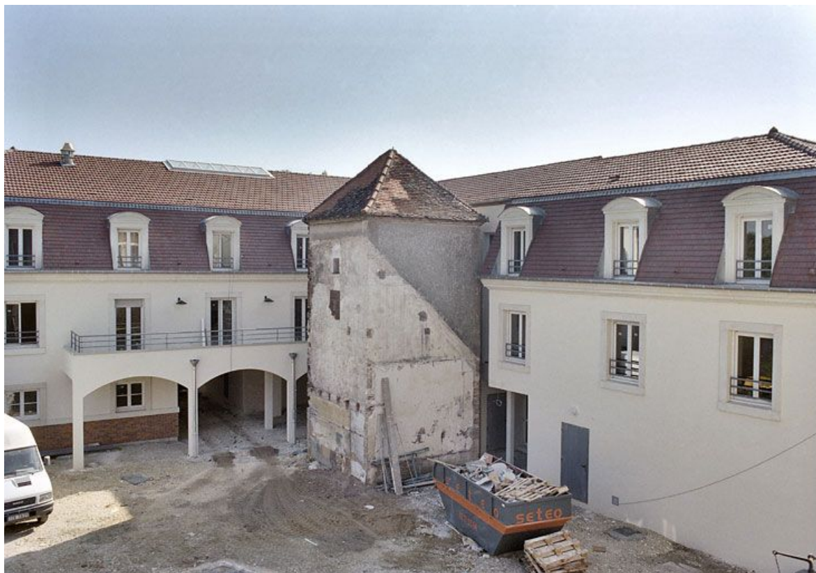
Vue du colombier pendant la construction des nouveaux bâtiments.