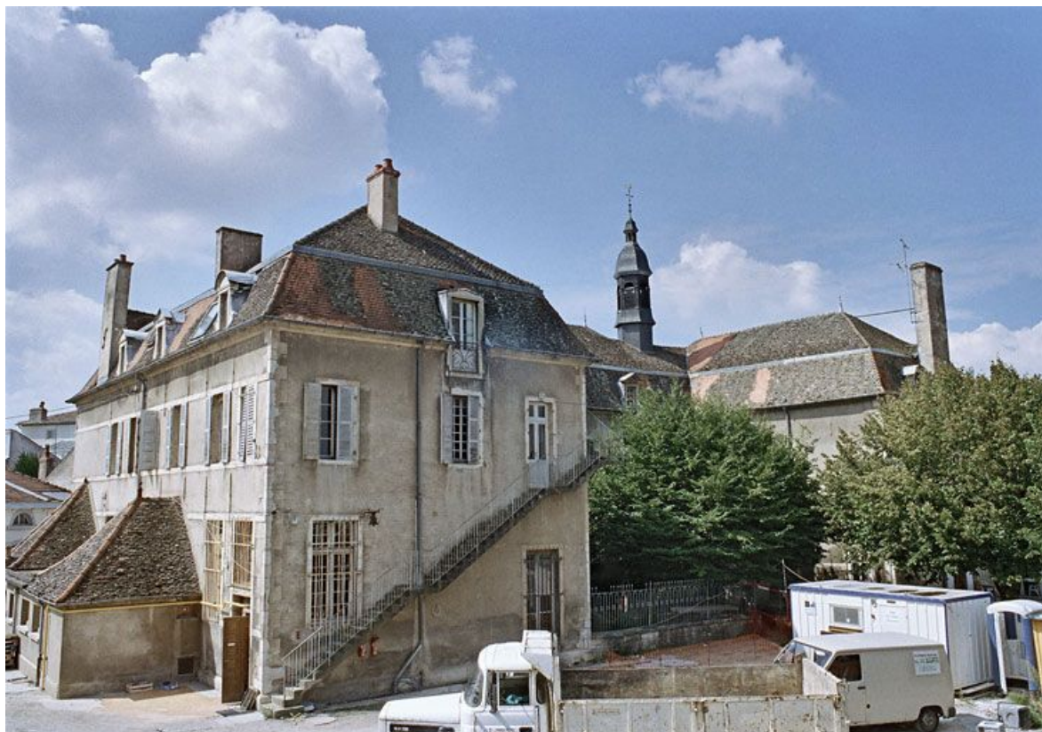
Bâtiment en U, vue prise de l'est.