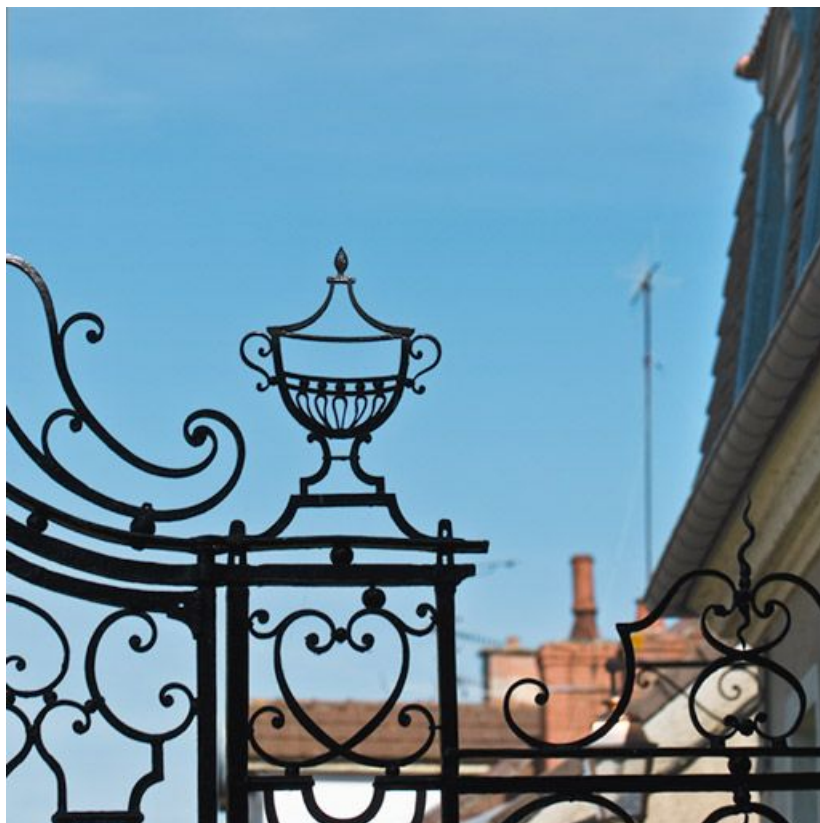
Cour d'angle sur rue : détail du portail en fer forgé.