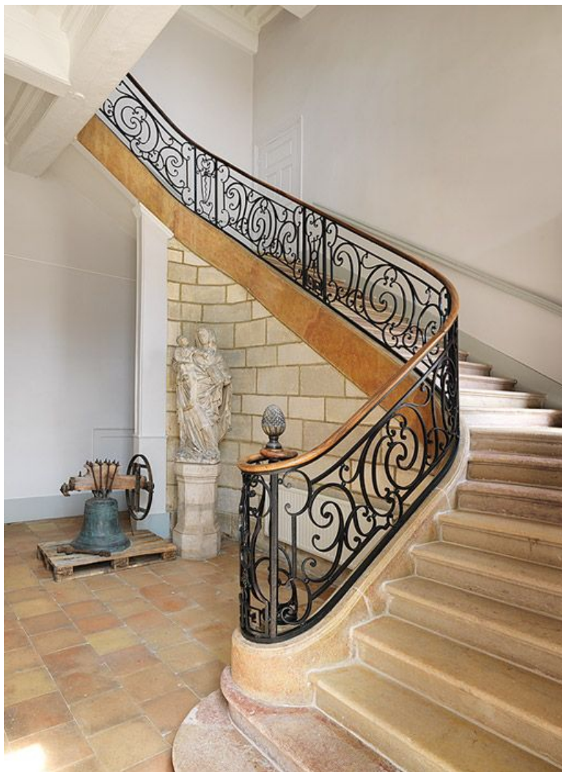
Vestibule du corps de bâtiment principal : escalier tournant en pierre à rampe en fer forgé. 21, Saint-Jean-de-Losne place d'Armes