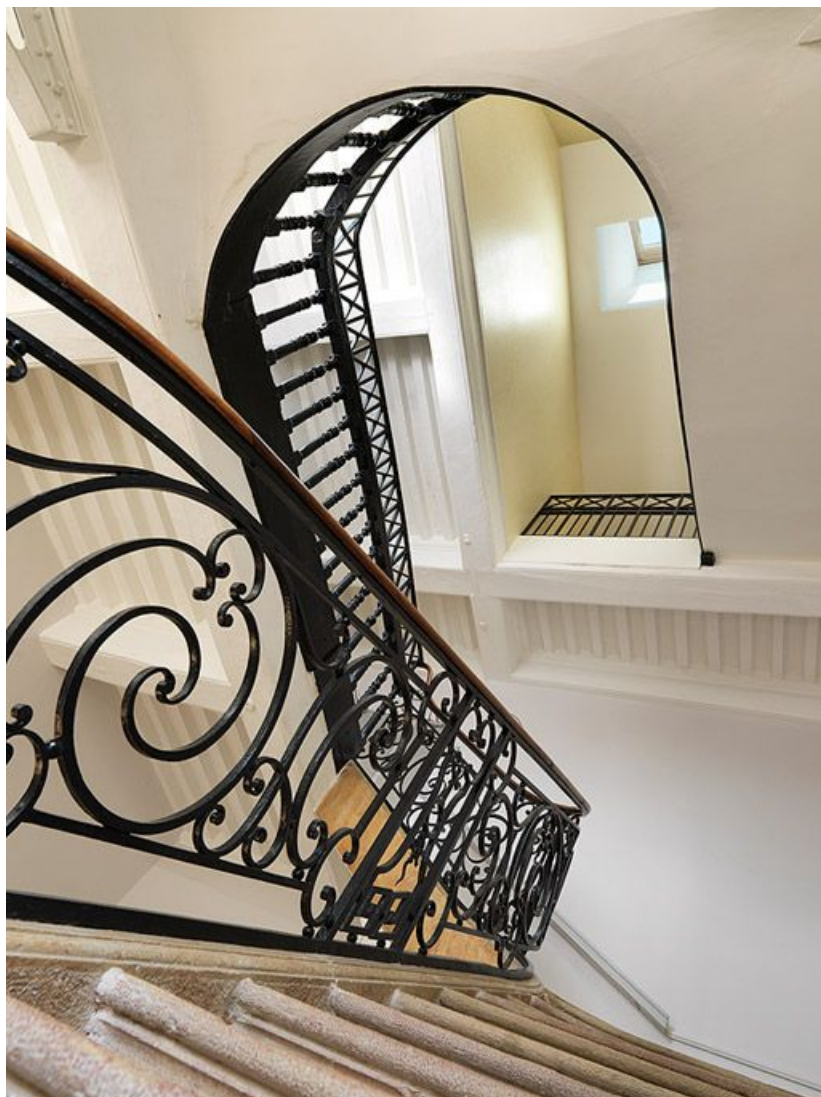
Vestibule du corps de bâtiment principal : escalier tournant en pierre à rampe en fer forgé. 21, Saint-Jean-de-Losne place d' Armes