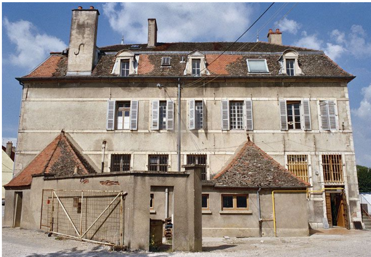
Aile est du bâtiment en U : façade est de l'aile est. 21, Saint-Jean-de-Losne place d' Armes