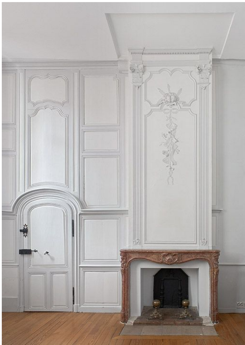
Aile droite : pièce du rez-de-chaussée, actuellement bureau de la directrice. 21, Saint-Jean-de-Losne place d'Armes