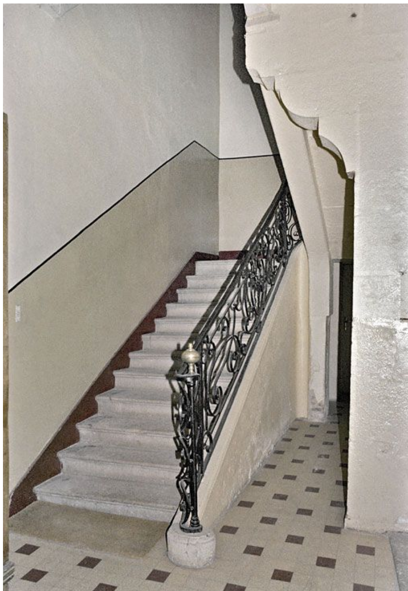
Immeuble en retrait sur la rue, avant travaux : 1ère volée de l'escalier tournant à retours. 21, Saint-Jean-de-Losne place d' Armes