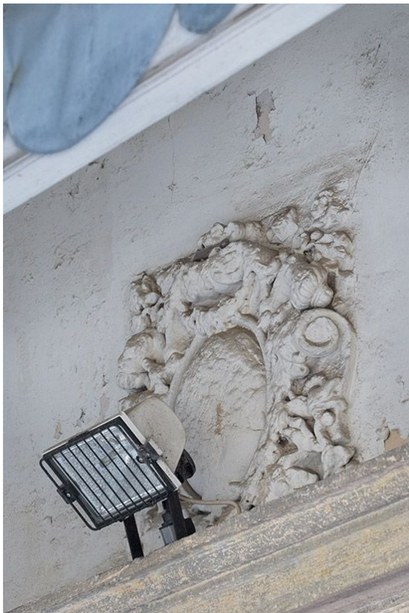
Cour d'angle sur rue : détail de l'écu au-dessus de la porte sous auvent. 21, Saint-Jean-de-Losne place d' Armes