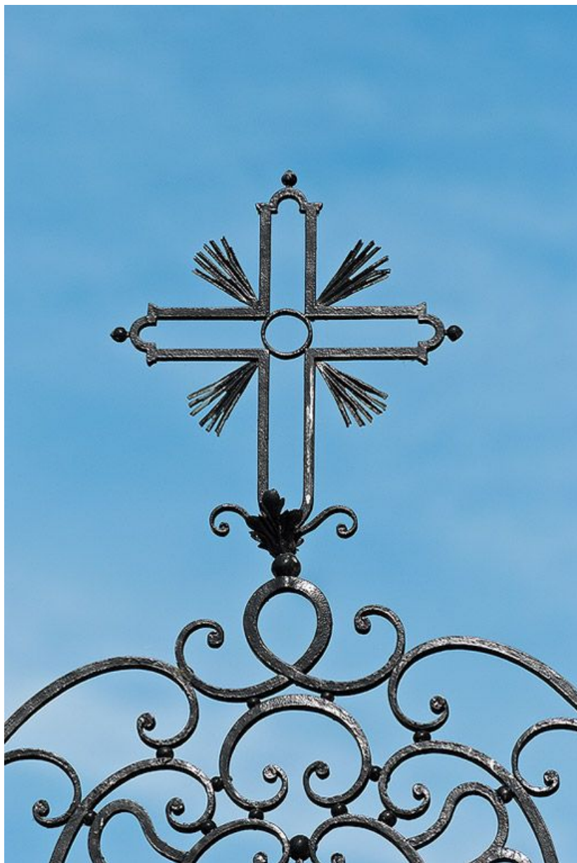
Cour d'angle sur rue : détail du portail en fer forgé. 21, Saint-Jean-de-Losne place d' Armes