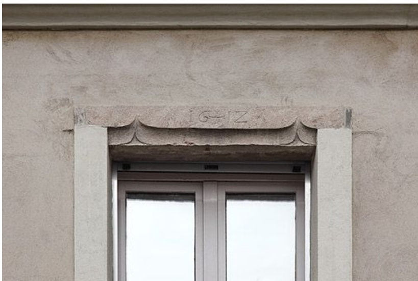
Détail du linteau en accolade daté 1612.