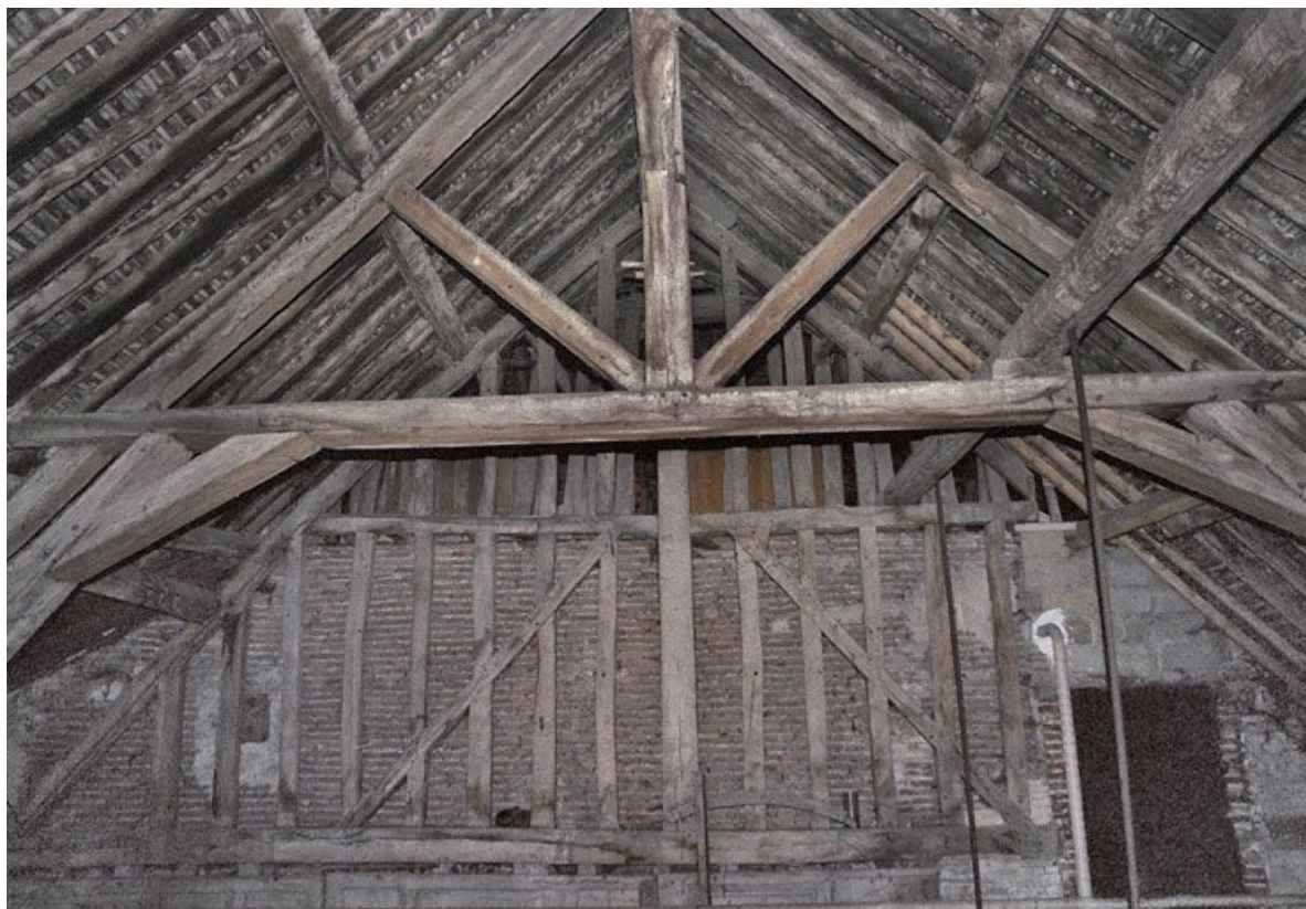
Bâtiment de plan en U : comble du corps principal, avant travaux. 21, Saint-Jean-de-Losne place d' Armes