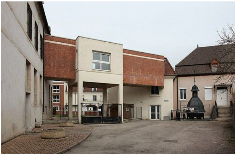
Passage couvert moderne, à l'est du bâtiment sur rue.