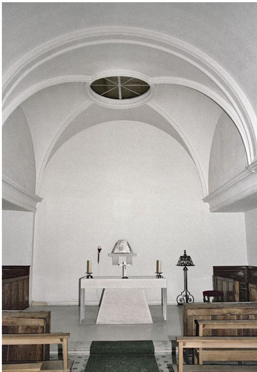
Intérieur de la chapelle en 1980.