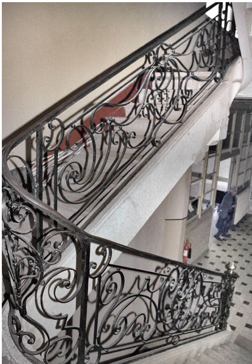
Immeuble en retrait sur la rue, avant travaux : escalier tournant à retours. 21, Saint-Jean-de-Losne place d'Armes