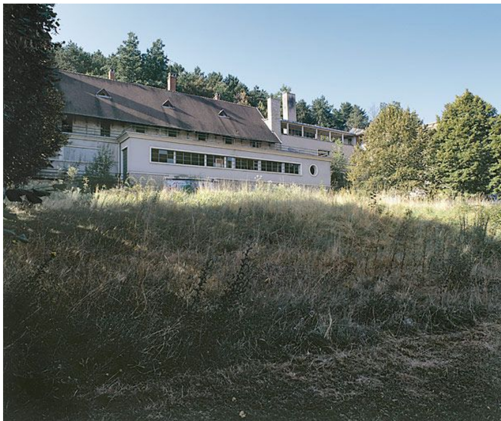
Bâtiment central, corps annexe adossé à la façade nord.

21, Velars-sur-Ouche chemin rural n° 8, lieudit : rente des Bons Pasteurs