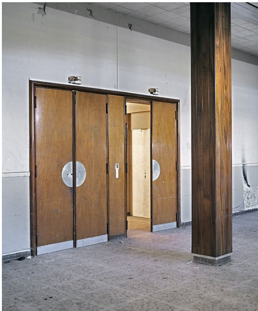
Aile ouest, extrémité ouest, porte de la salle de conférence et de spectacles. 21, Velars-sur-Ouche chemin rural n° 8, lieudit : rente des Bons Pasteurs