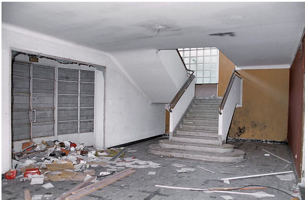
Aile ouest, extrémité ouest, étage de soubassement : hall de la salle de conférences et de spectacles.

21, Velars-sur-Ouche chemin rural n° 8, lieudit : rente des Bons Pasteurs