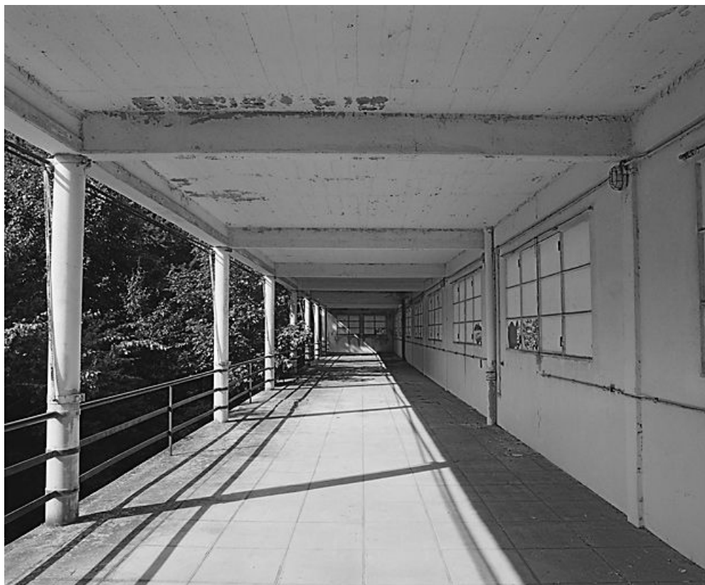
Galerie de cure ouest, façade sud-est.

21, Velars-sur-Ouche chemin rural n° 8, lieudit : rente des Bons Pasteurs