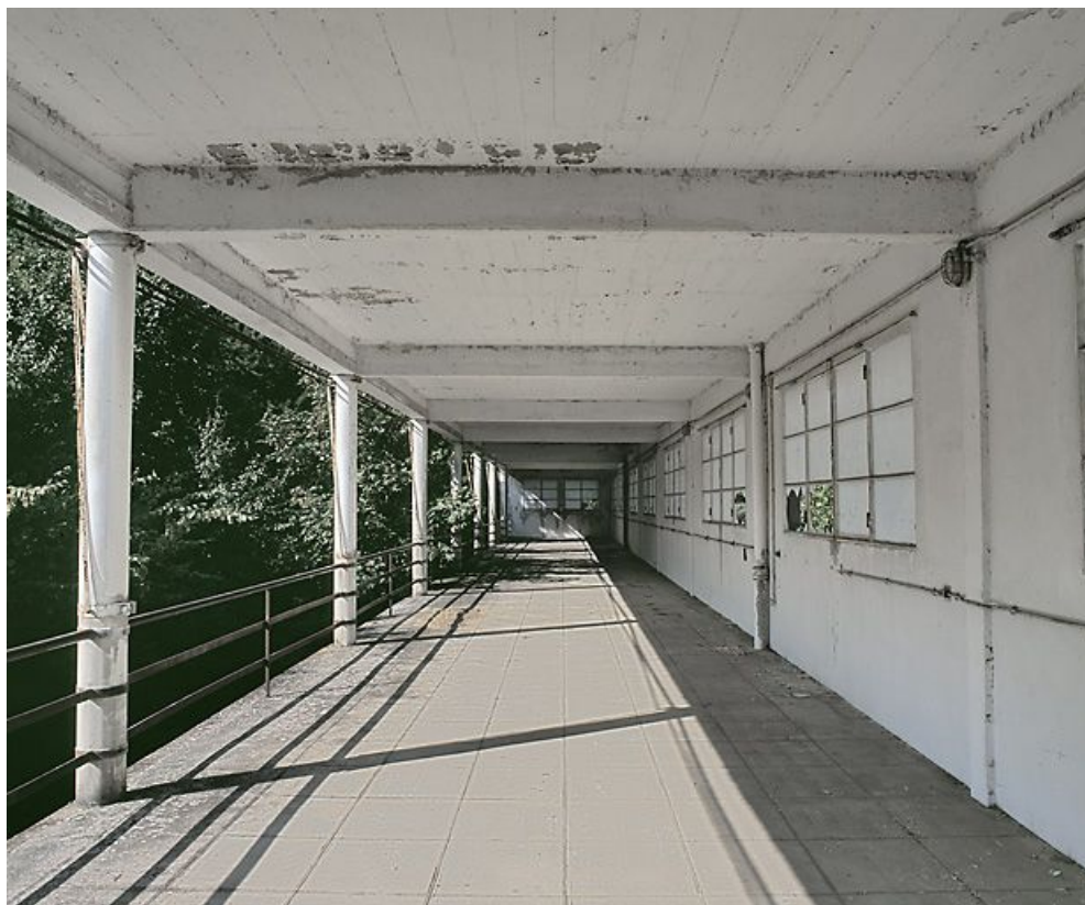
Galerie de cure ouest, façade sud-est.

21, Velars-sur-Ouche chemin rural n° 8, lieudit : rente des Bons Pasteurs