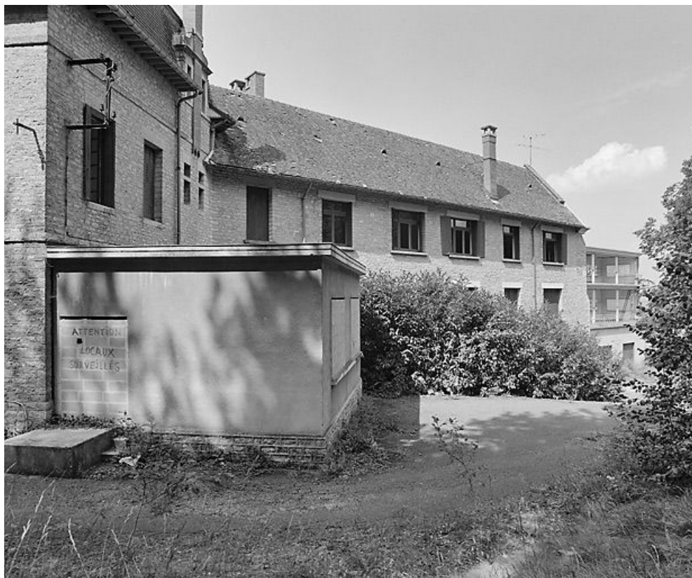
Pavillon du corps de bâtiment central et élévation sud-est de l'aile est.

21, Velars-sur-Ouche chemin rural n° 8, lieudit : rente des Bons Pasteurs