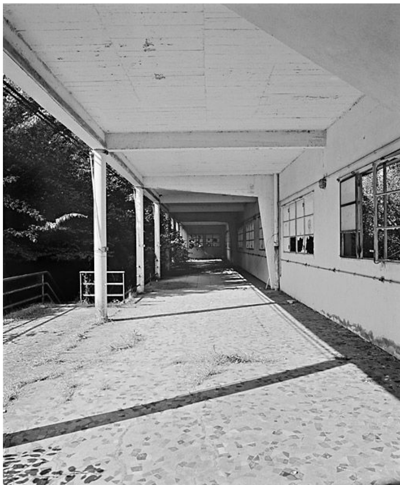
Galerie de cure ouest, façade sud-est.

21, Velars-sur-Ouche chemin rural n° 8, lieudit : rente des Bons Pasteurs