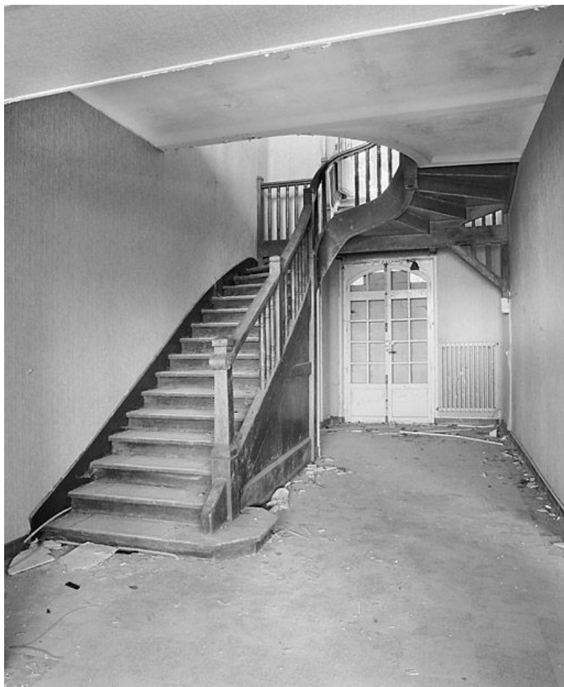
Pavillon est du bâtiment central : escalier.

21, Velars-sur-Ouche chemin rural n° 8, lieudit : rente des Bons Pasteurs