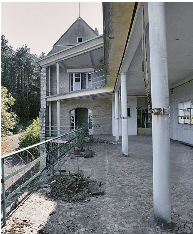
Galerie de cure est, façade sud-est.

21, Velars-sur-Ouche chemin rural n° 8, lieudit : rente des Bons Pasteurs