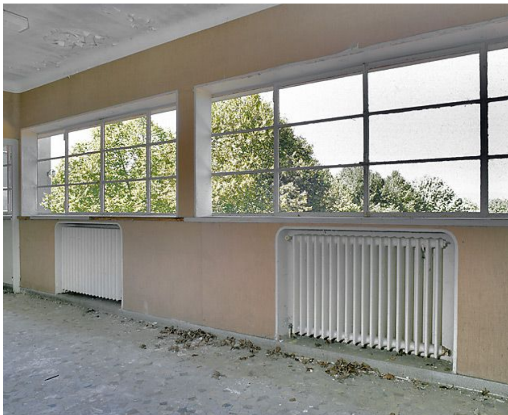
Couloir reliant le bâtiment central à l'aile ouest.

21, Velars-sur-Ouche chemin rural n° 8, lieudit : rente des Bons Pasteurs