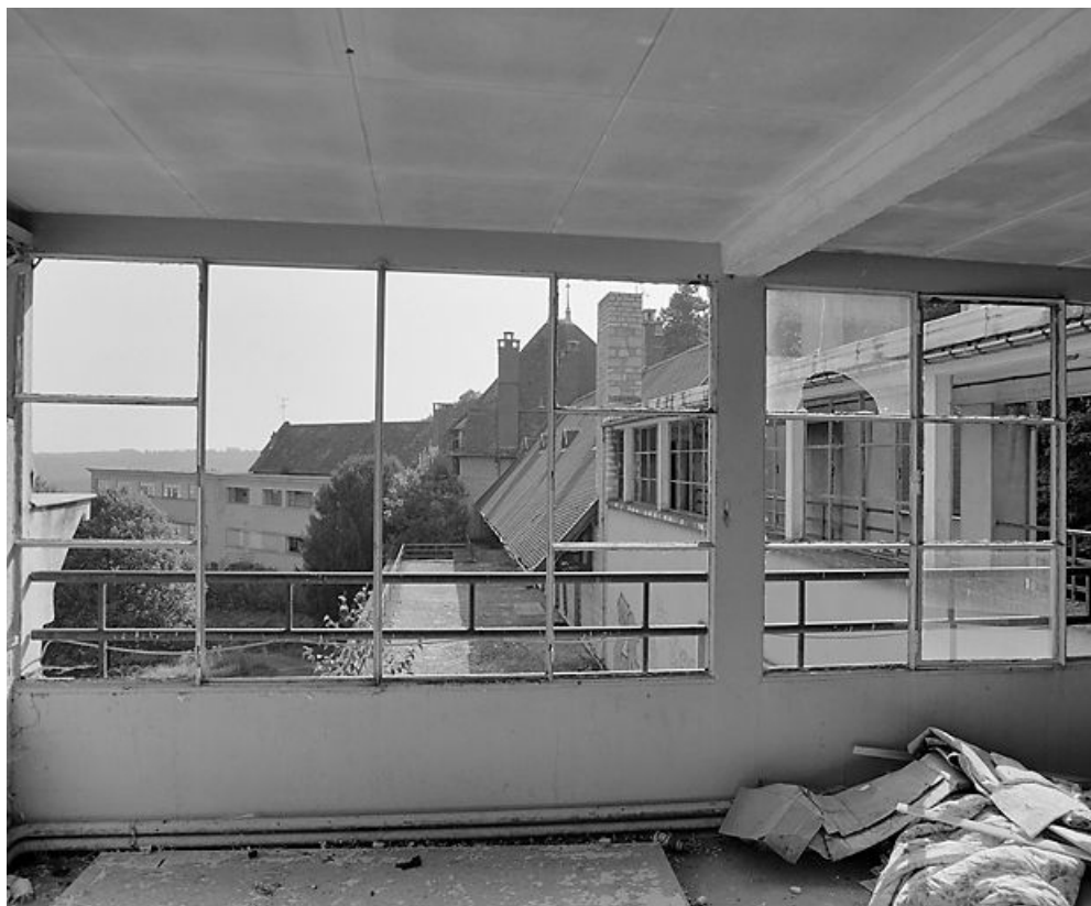
Corps central et aile est, vue prise de l'aile ouest.

21, Velars-sur-Ouche chemin rural n° 8, lieudit : rente des Bons Pasteurs