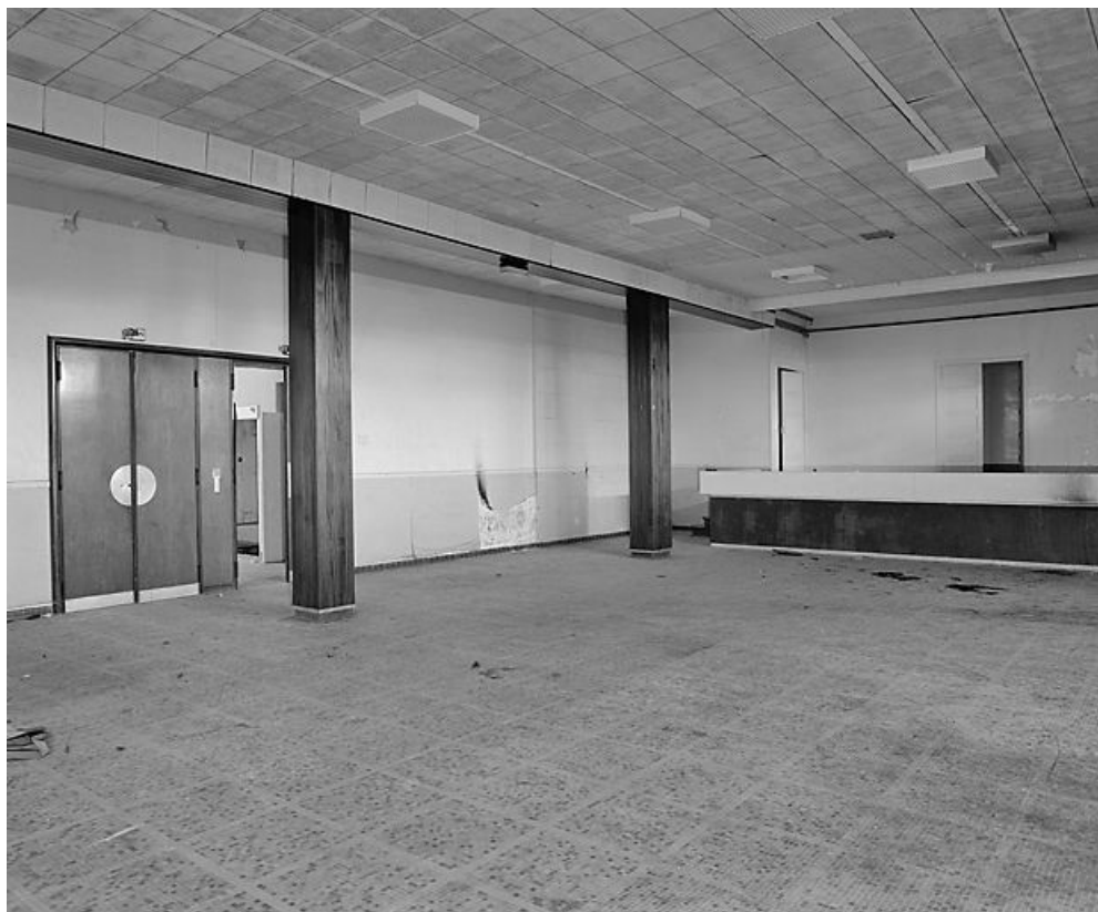
Aile ouest, extrémité ouest, salle de conférence et de spectacles située à l'étage de soubassement. 21, Velars-sur-Ouche chemin rural n° 8, lieudit : rente des Bons Pasteurs