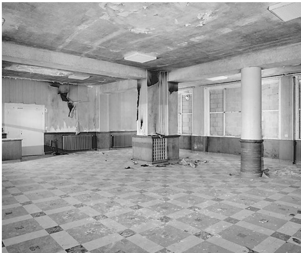
Bâtiment central, rez-de-chaussée : salle à manger jouxtant le pavillon.

21, Velars-sur-Ouche chemin rural n° 8, lieudit : rente des Bons Pasteurs