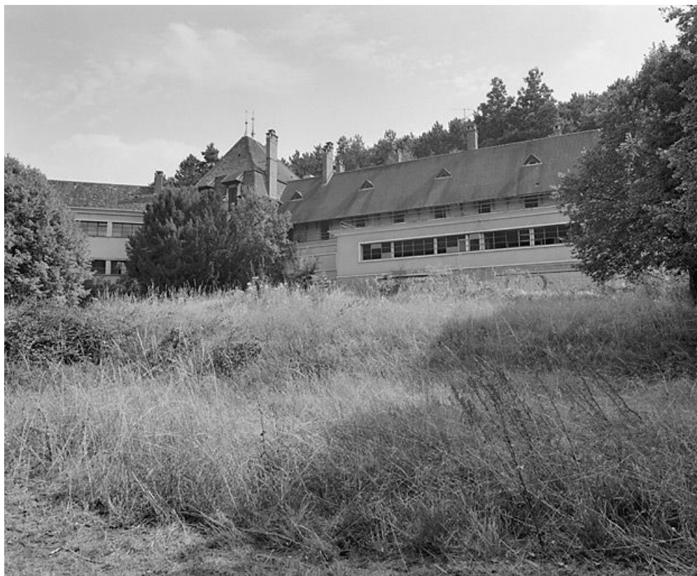
Bâtiment central, corps annexe adossé à la façade nord.

21, Velars-sur-Ouche chemin rural n° 8, lieudit : rente des Bons Pasteurs