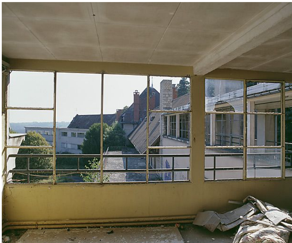
Corps central et aile est, vue prise de l'aile ouest.

21, Velars-sur-Ouche chemin rural n° 8, lieudit : rente des Bons Pasteurs