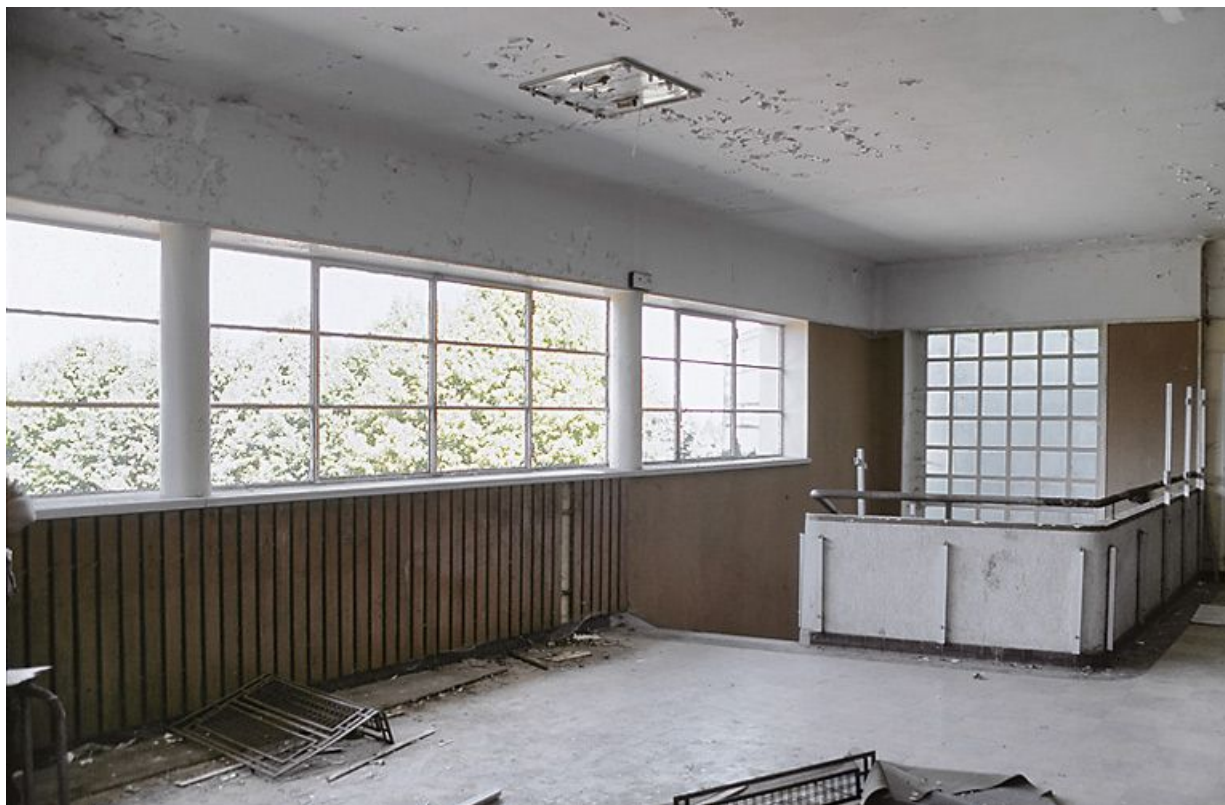
Aile ouest, extrémité ouest, rez-de-chaussée : hall d'accès au couloir des chambres.

21, Velars-sur-Ouche chemin rural n° 8, lieu dit : rente des Bons Pasteurs