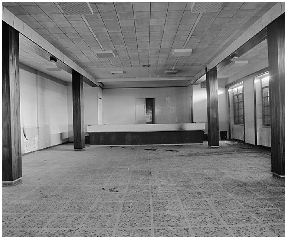
Aile ouest, extrémité ouest, étage de soubassement : salle de conférences et de spectacles. 21, Velars-sur-Ouche chemin rural n° 8, lieudit : rente des Bons Pasteurs