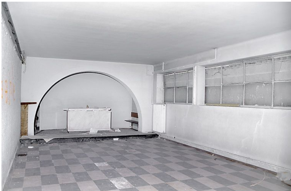
Corps adossé à la façade nord du bâtiment central : chapelle située à l'étage de soubassement.

21, Velars-sur-Ouche chemin rural n° 8, lieudit : rente des Bons Pasteurs