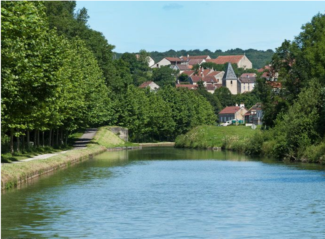
Vue d'ensemble, avec le village de Buffon.

21, Buffon, lieudit : bief 69 du versant Yonne