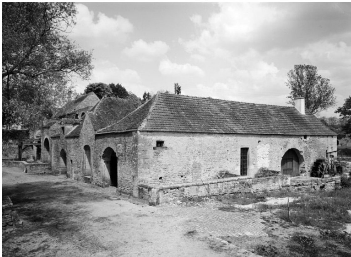
Bâtiment de la fenderie, vue prise du sud-est.

21, Buffon, lieudit : bief 69 du versant Yonne