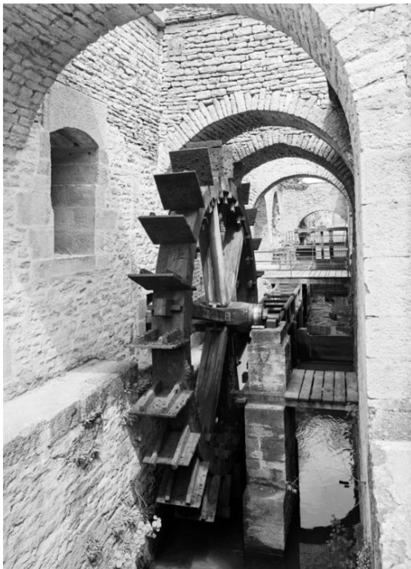
Haut fourneau, roue hydraulique reconstituée.

21, Buffon, lieudit : bief 69 du versant Yonne