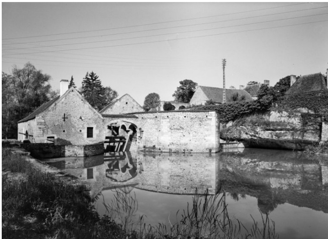
Vue prise du bief d'amont : à gauche la fenderie, à droite la forge.

21, Buffon, lieudit : bief 69 du versant Yonne