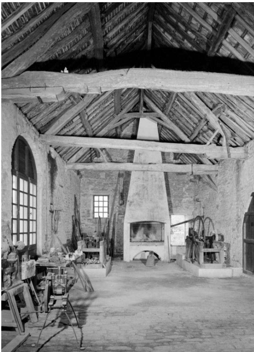
Bâtiment de la fenderie, vue intérieure prise du sud.

21, Buffon, lieudit : bief 69 du versant Yonne