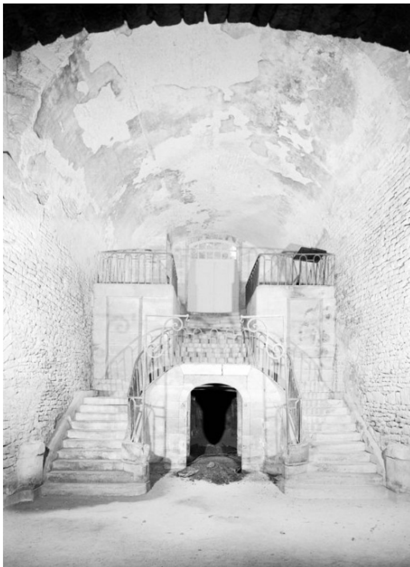
Haut fourneau, escalier d'honneur vu depuis la halle de coulée.

21, Buffon, lieudit : bief 69 du versant Yonne