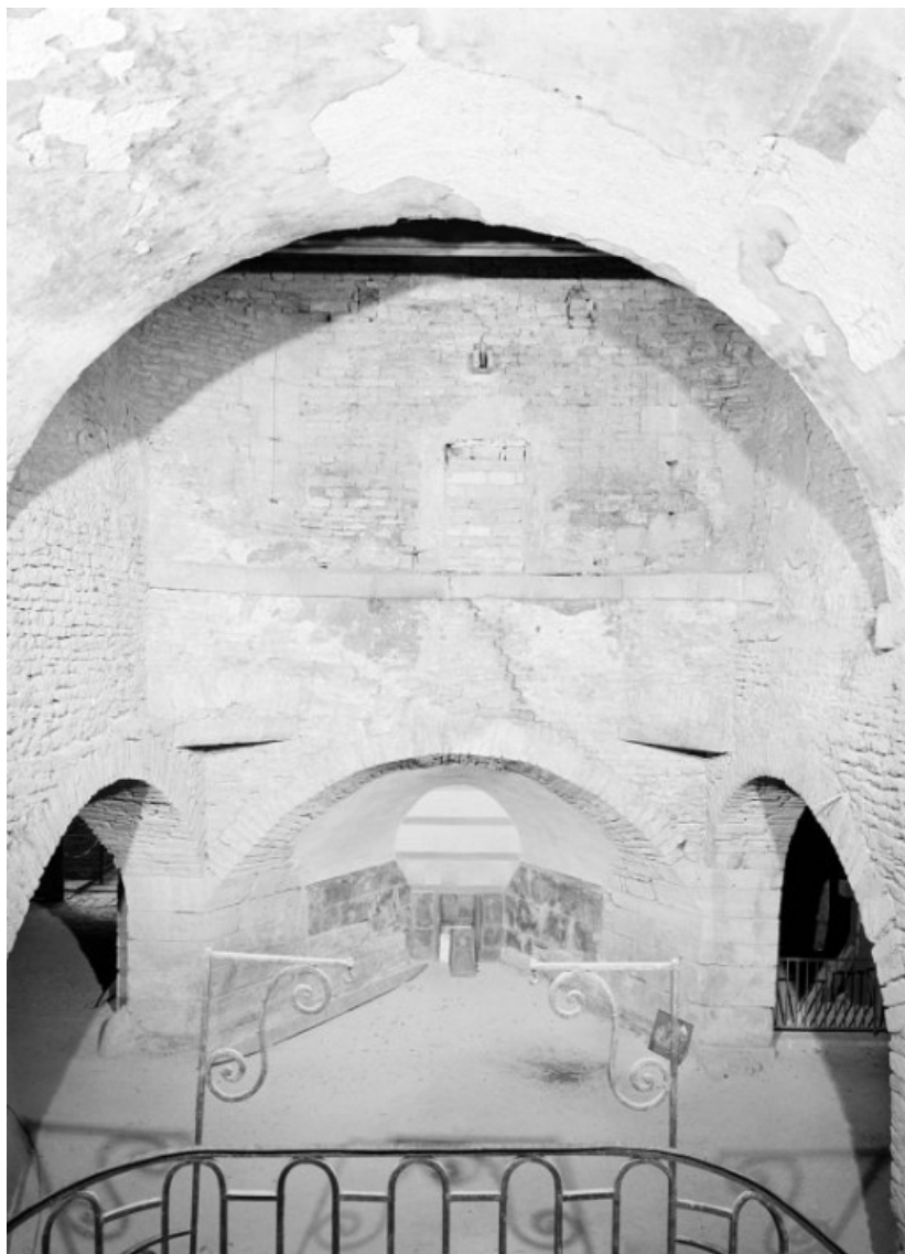
Haut fourneau, halle de coulée, vue prise de l'escalier d'honneur.

21, Buffon, lieudit : bief 69 du versant Yonne