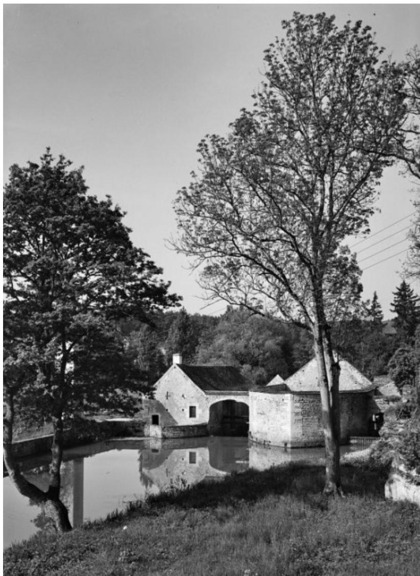
Vue prise du bief d'amont : à gauche la fenderie, à droite la forge.

21, Buffon, lieudit : bief 69 du versant Yonne