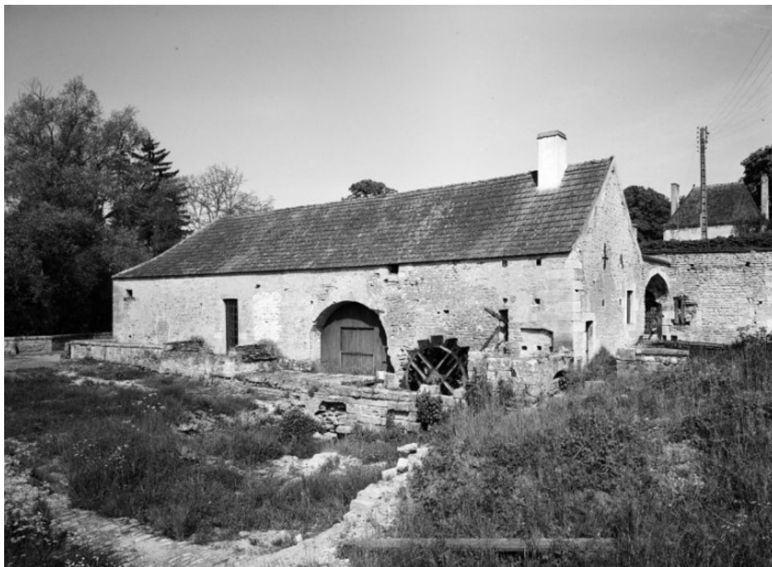
Bâtiment de la fenderie, élévation est.

21, Buffon, lieudit : bief 69 du versant Yonne