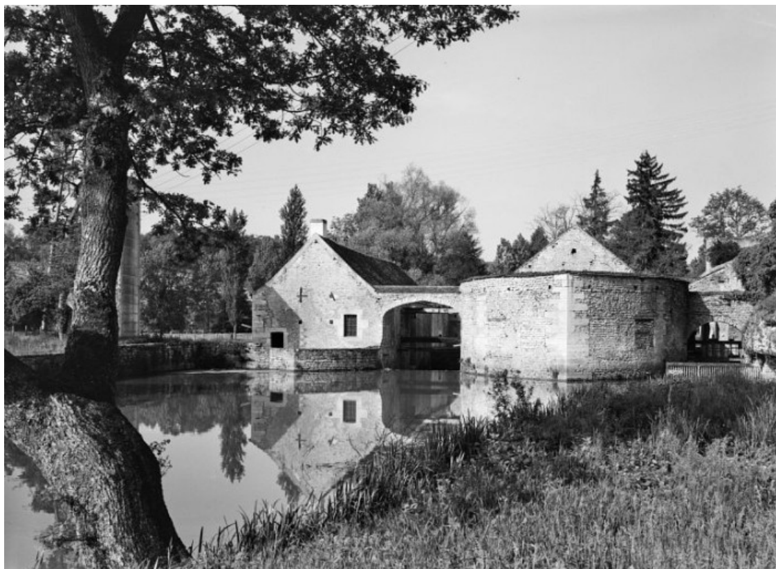
Vue prise du bief d'amont : à gauche la fenderie, à droite la forge.

21, Buffon, lieudit : bief 69 du versant Yonne