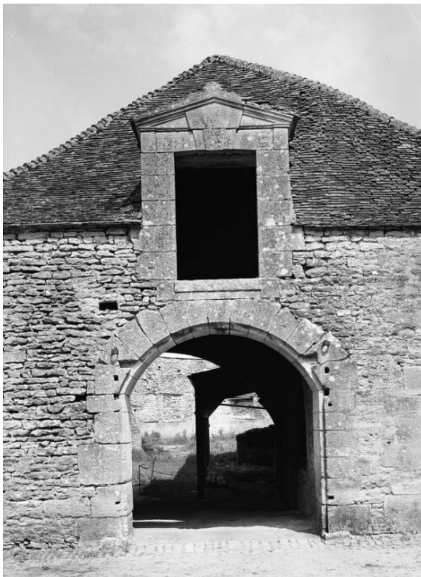
Entrée du bâtiment de la forge d'affinerie, élévation sud.

21, Buffon, lieudit : bief 69 du versant Yonne