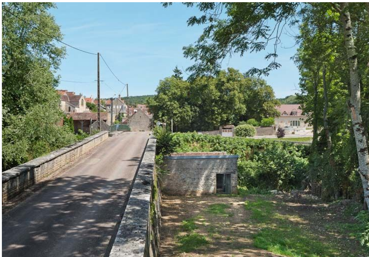
Le pont sur la Brenne avec le lavoir en contrebas.

21, Buffon, lieudit : bief 69 du versant Yonne