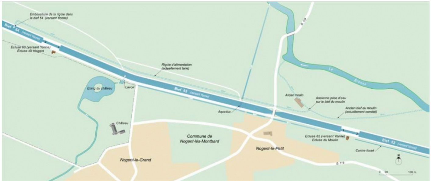
Plan schématique du système hydraulique des biefs 62, 63 et 64 du versant Yonne. 21, Nogent-lès-Montbard, lieudit : Nogent-le-Petit