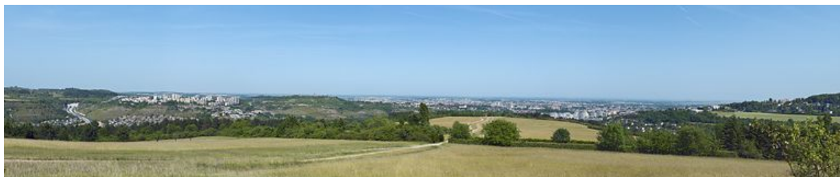
Vue générale de l'entrée de l'agglomération dijonnaise avec la ZAC de Talant et la ZUP de la Fontaine-d'Ouche depuis l'ouest. 21, Dijon, lieudit : Fontaine-d'Ouche