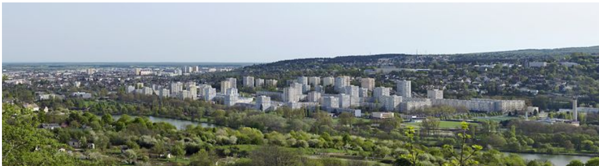
Vue générale de la Fontaine-d'Ouche depuis le parc de la fontaine aux fées au nord-ouest.