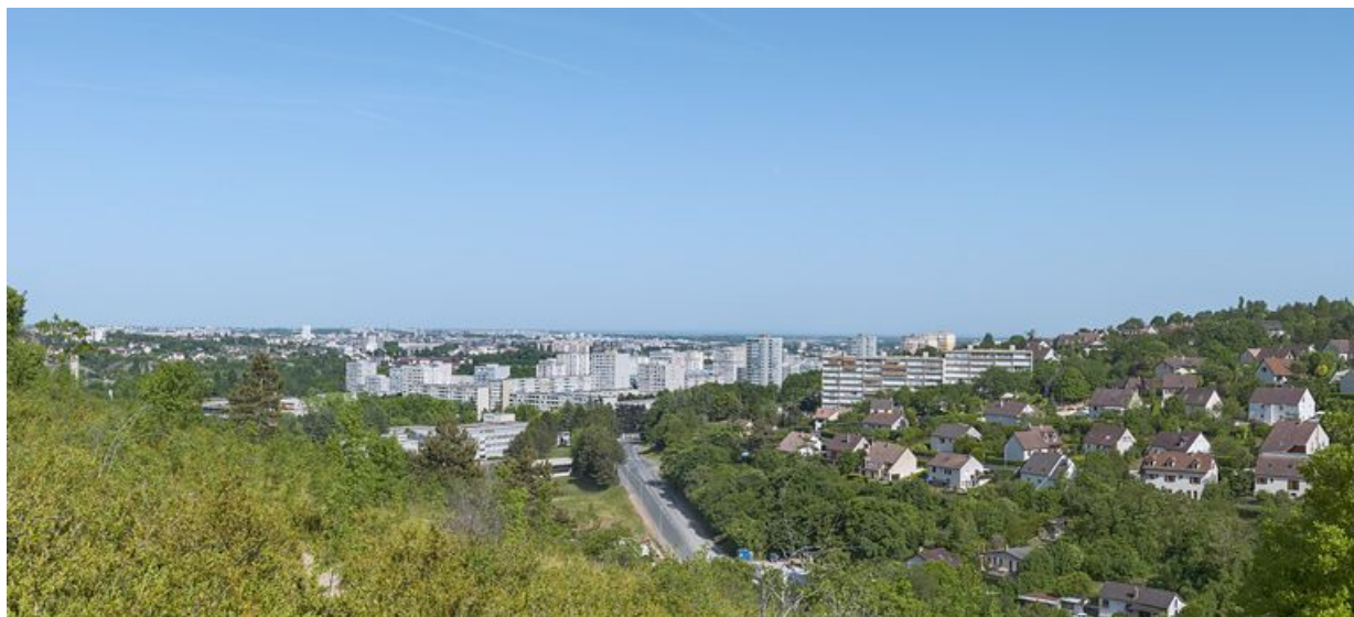
Vue générale de la Fontaine-d'Ouche depuis la combe à la Serpent à l'ouest.