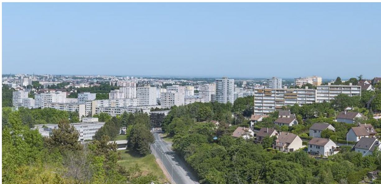
Vue générale de la Fontaine-d'Ouche depuis la combe à la Serpent à l'ouest.