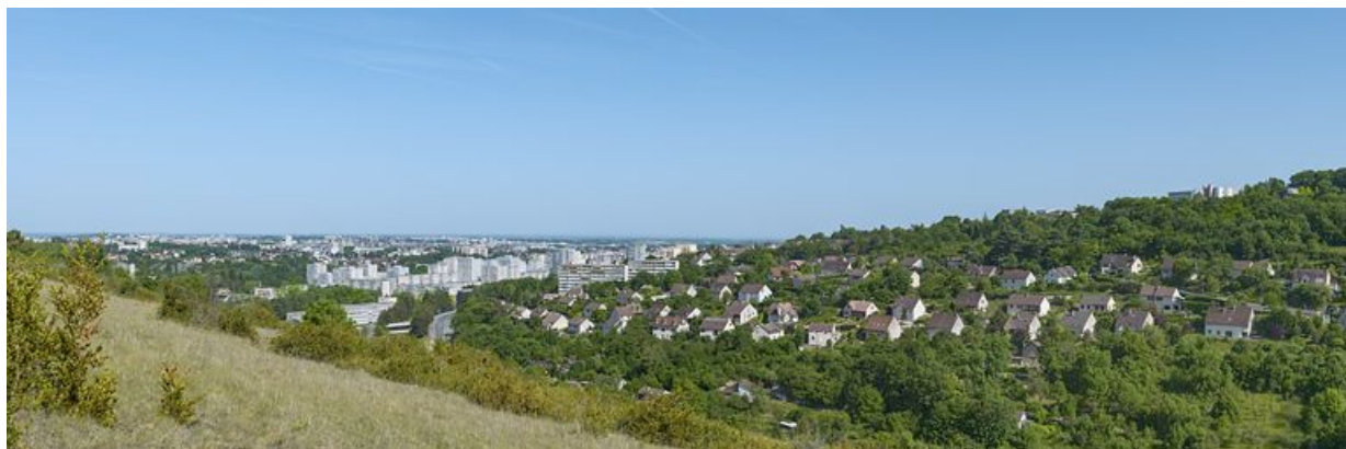
Vue générale de la Fontaine-d'Ouche depuis la combe à la Serpent à l'ouest.