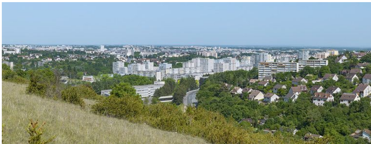
Vue générale de la Fontaine-d'Ouche depuis la combe à la Serpent à l'ouest.