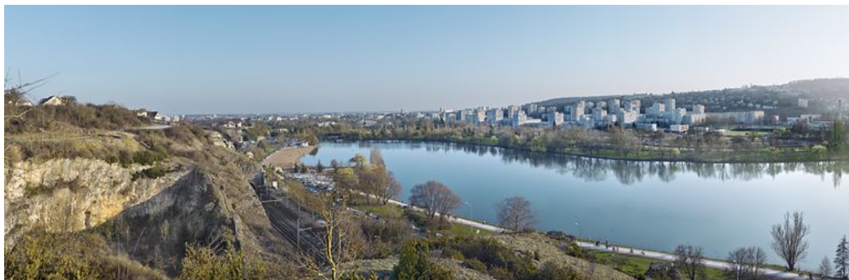
Vue générale de la Fontaine-d'Ouche depuis le nord-ouest.