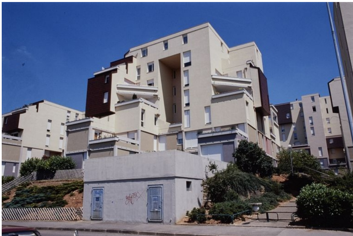
Vue d'ensemble de la cité Plein-Ciel.