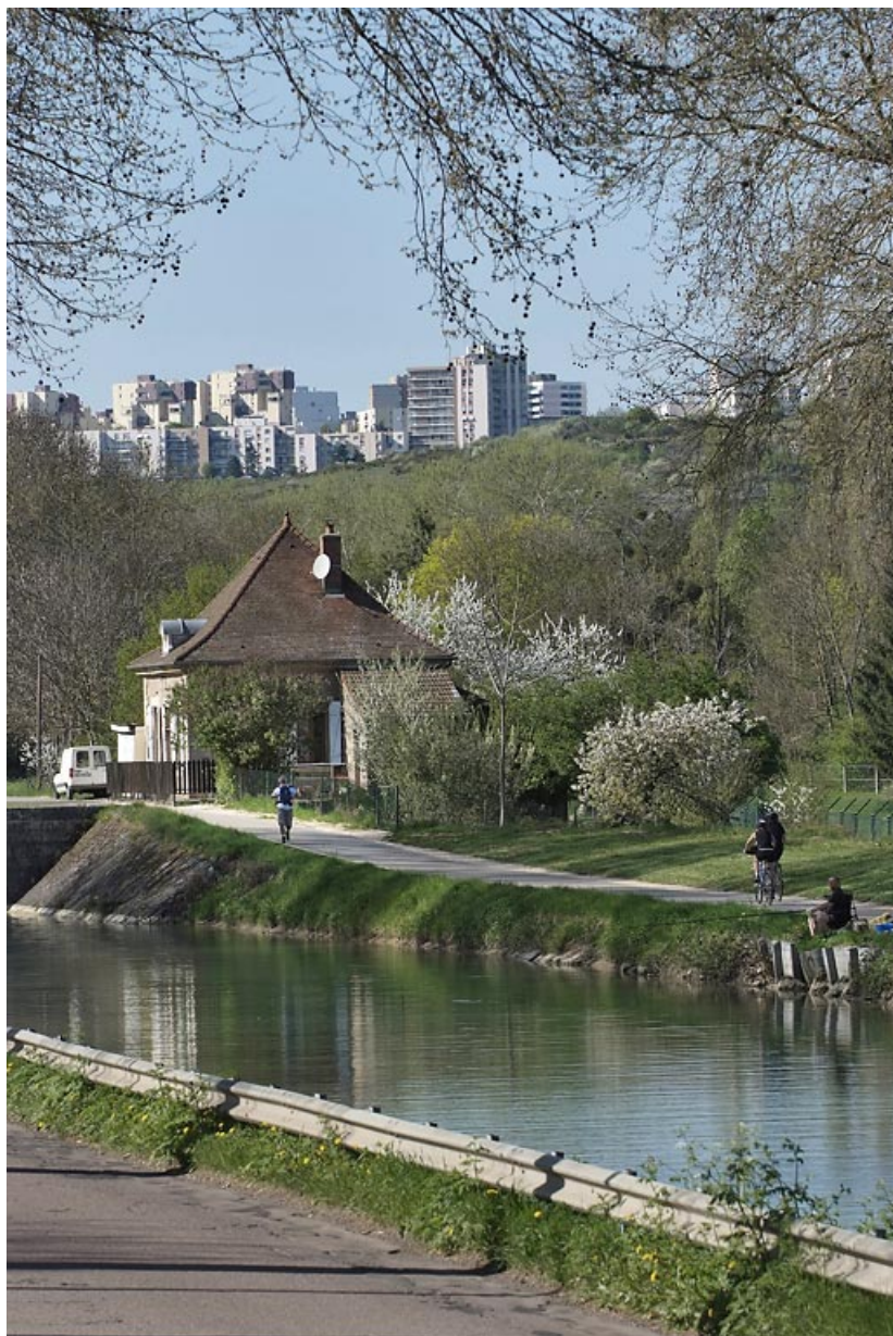
Site de l'écluse 53 du versant Saône, dite des Marcs d'Or (canal de Bourgogne). Au fond, vue du quartier de Talant Belvédère. 21, Talant avenue de la Citadelle