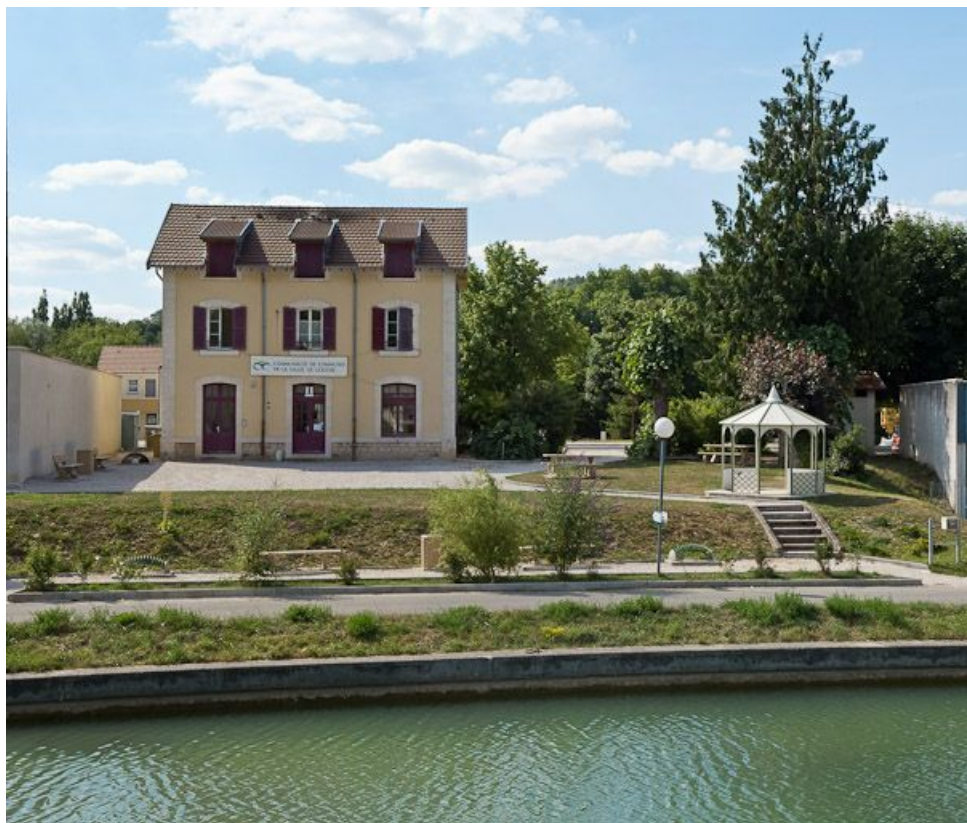
Vue de la gare de Velars-sur-Ouche depuis la rive droite du canal.

21, Velars-sur-Ouche, lieudit : bief 46 du versant Saône