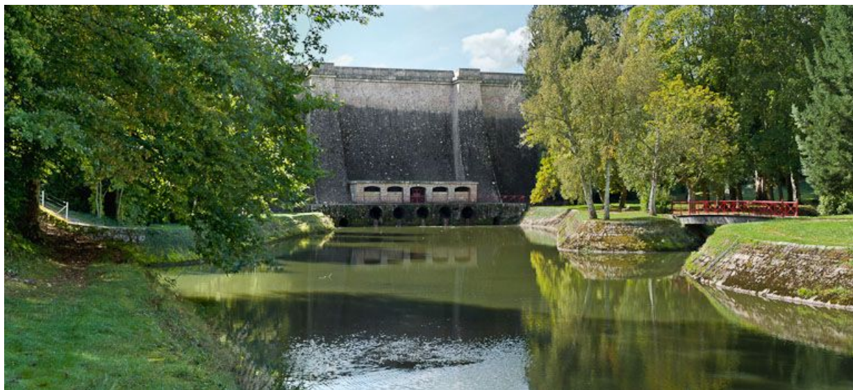
Vue de la digue et de la rigole traitées dans un aménagement paysager.