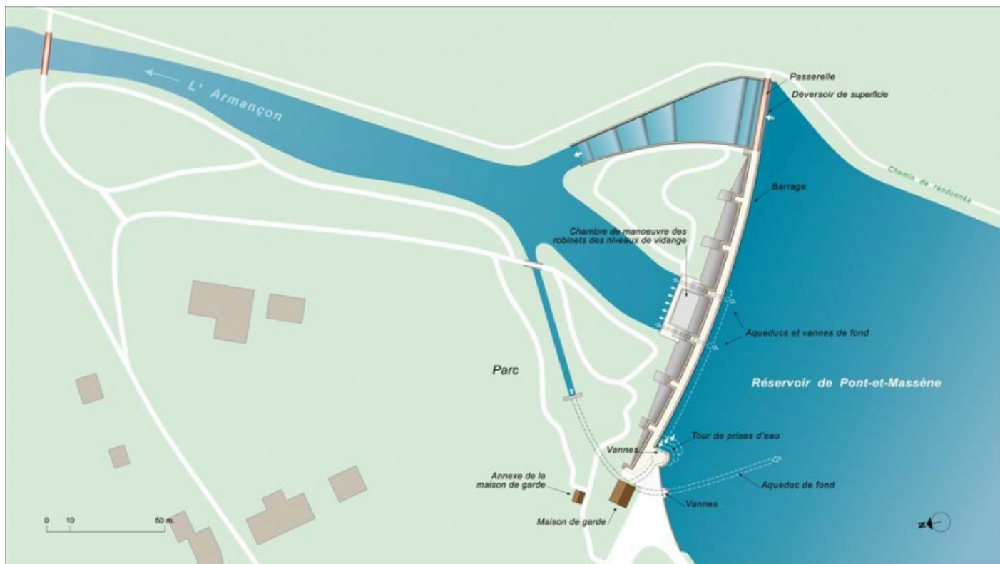
Plan schématique du réservoir de Pont, détail du barrage.