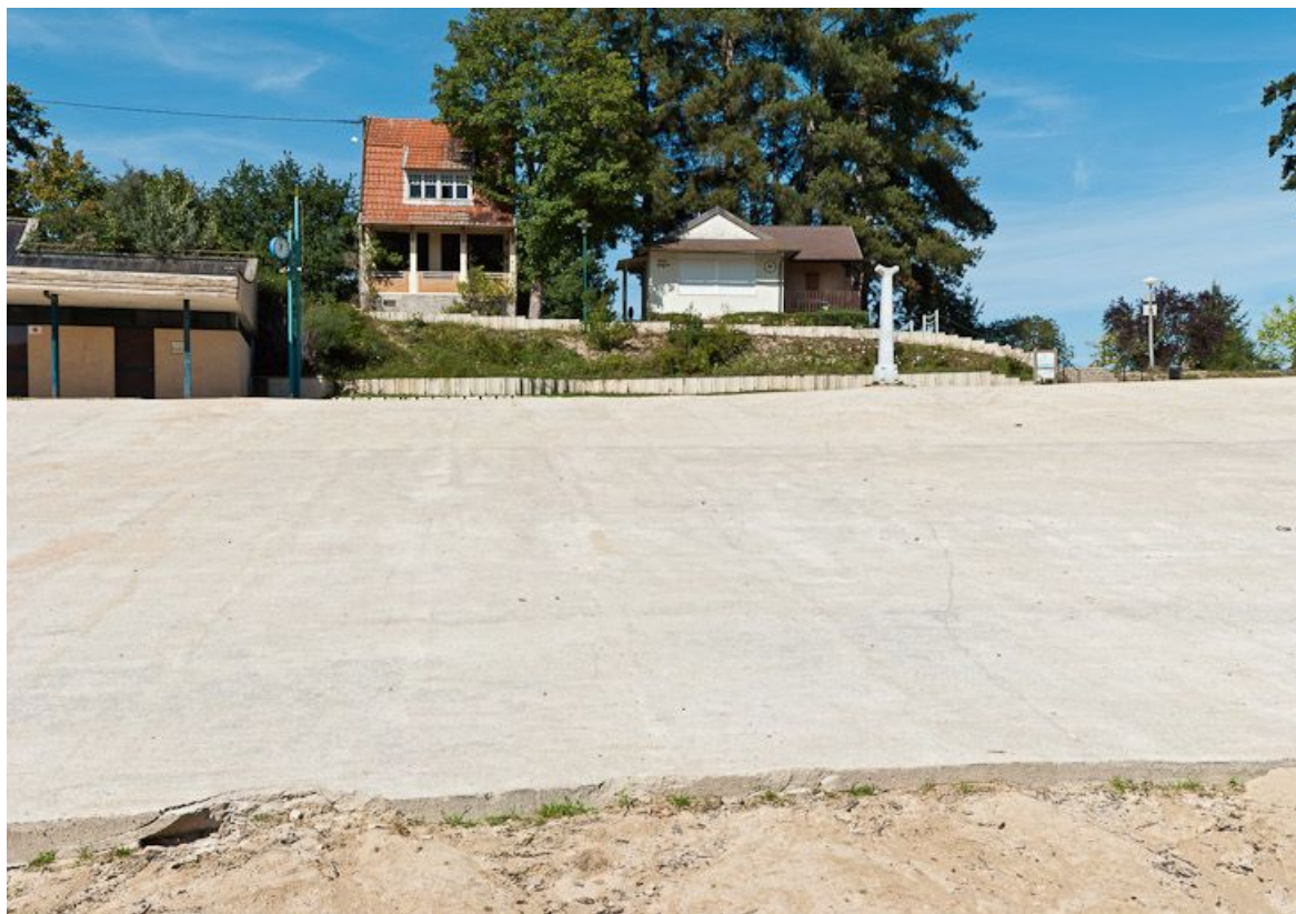
Vue de la plage du réservoir de Pont.