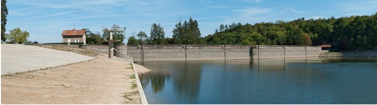
Vue générale du réservoir avec la digue et la maison de garde à l'arrière-plan.