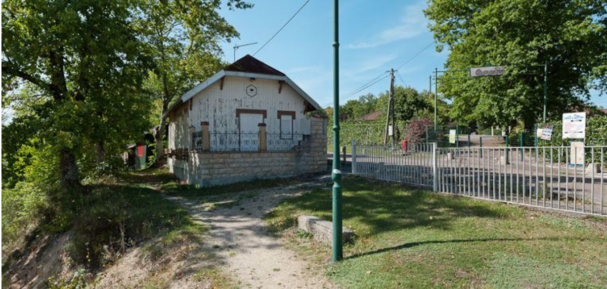
Vue d'une demeure de villégiature autour du réservoir.