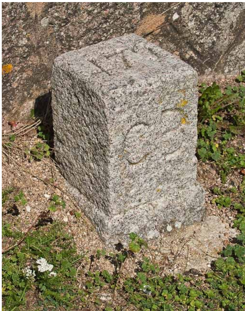
Vue d'une borne du réservoir de Pont.