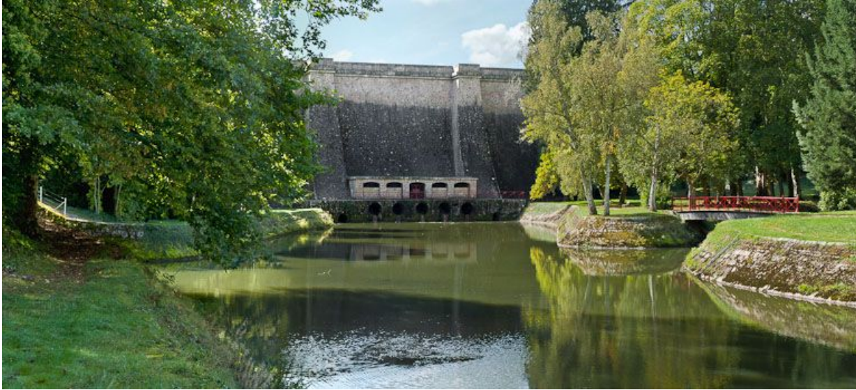
Vue de la digue et de la rigole traitées dans un aménagement paysager.