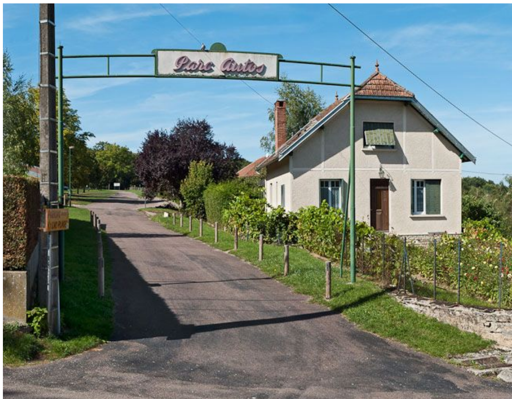
Vue d'une demeure de villégiature autour du réservoir.