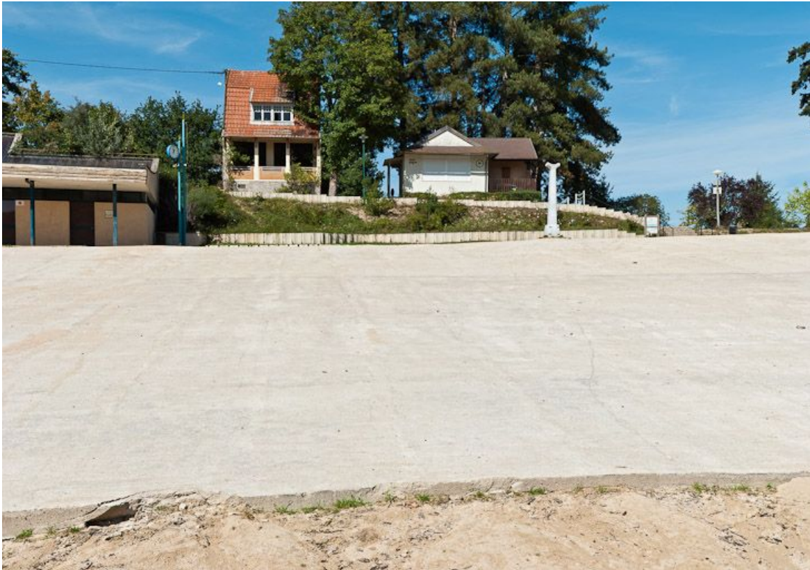
Vue de la plage du réservoir de Pont.