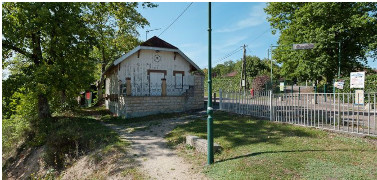
Vue d'une demeure de villégiature autour du réservoir.