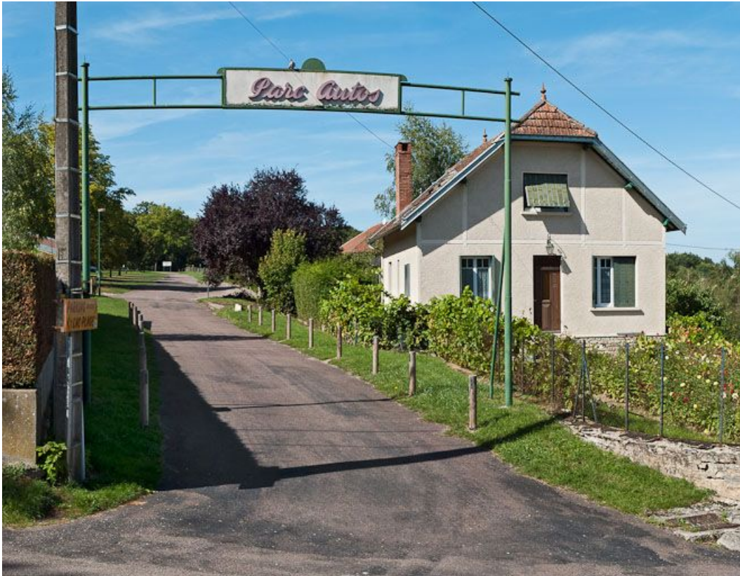
Vue d'une demeure de villégiature autour du réservoir.