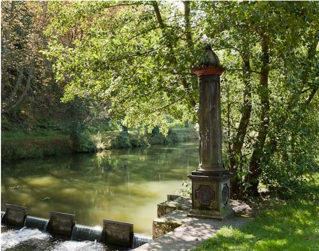
Vue de la rigole et du limnimètre.