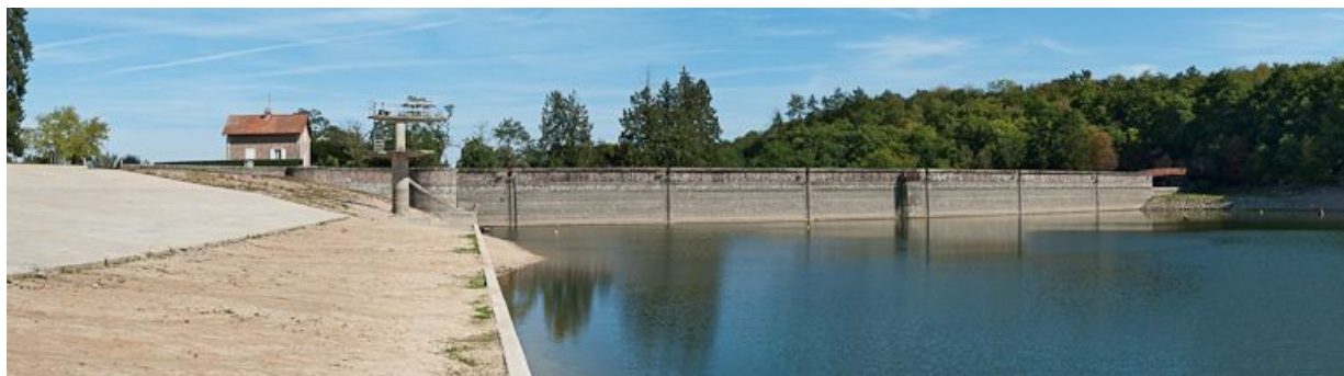
Vue générale du réservoir avec la digue et la maison de garde à l'arrière-plan.