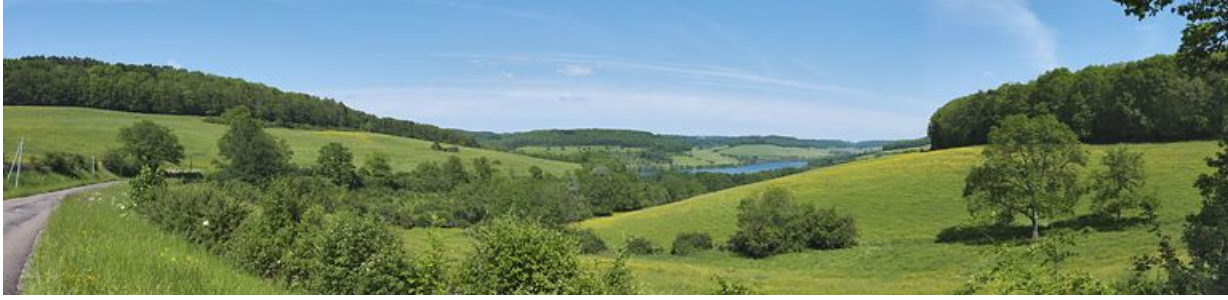
Panorama du réservoir de Grosbois, pris du village de Civry-en-Montagne.

21, Grosbois-en-Montagne, lieudit : Grosbois