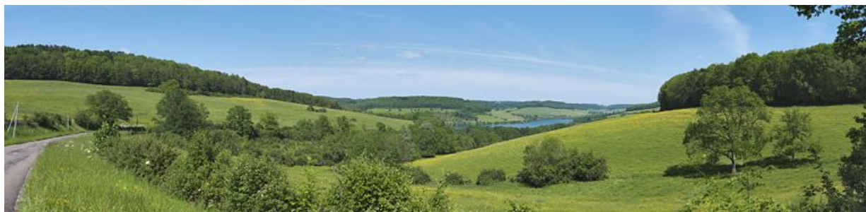
Panorama du réservoir de Grosbois, pris du village de Civry-en-Montagne.

N° de l'illustration : 20122102801NUC4AQ