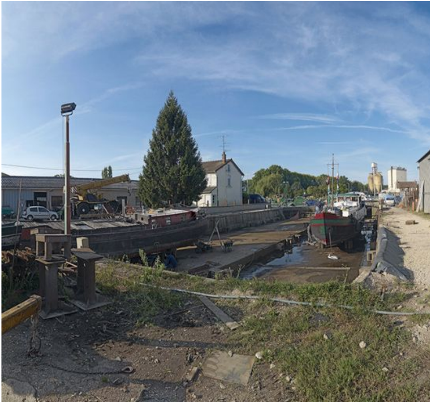
Détail du port : les cales pour réparer ou déchirer les bateaux.

21, Saint-Usage, lieudit : bief 76 du versant Saône