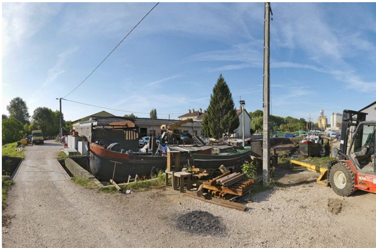
Détail du port : les cales pour réparer ou déchirer les bateaux.

21, Saint-Usage, lieudit : bief 76 du versant Saône