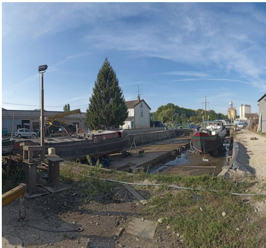
Détail du port : les cales pour réparer ou déchirer les bateaux.

21, Saint-Usage, lieudit : bief 76 du versant Saône