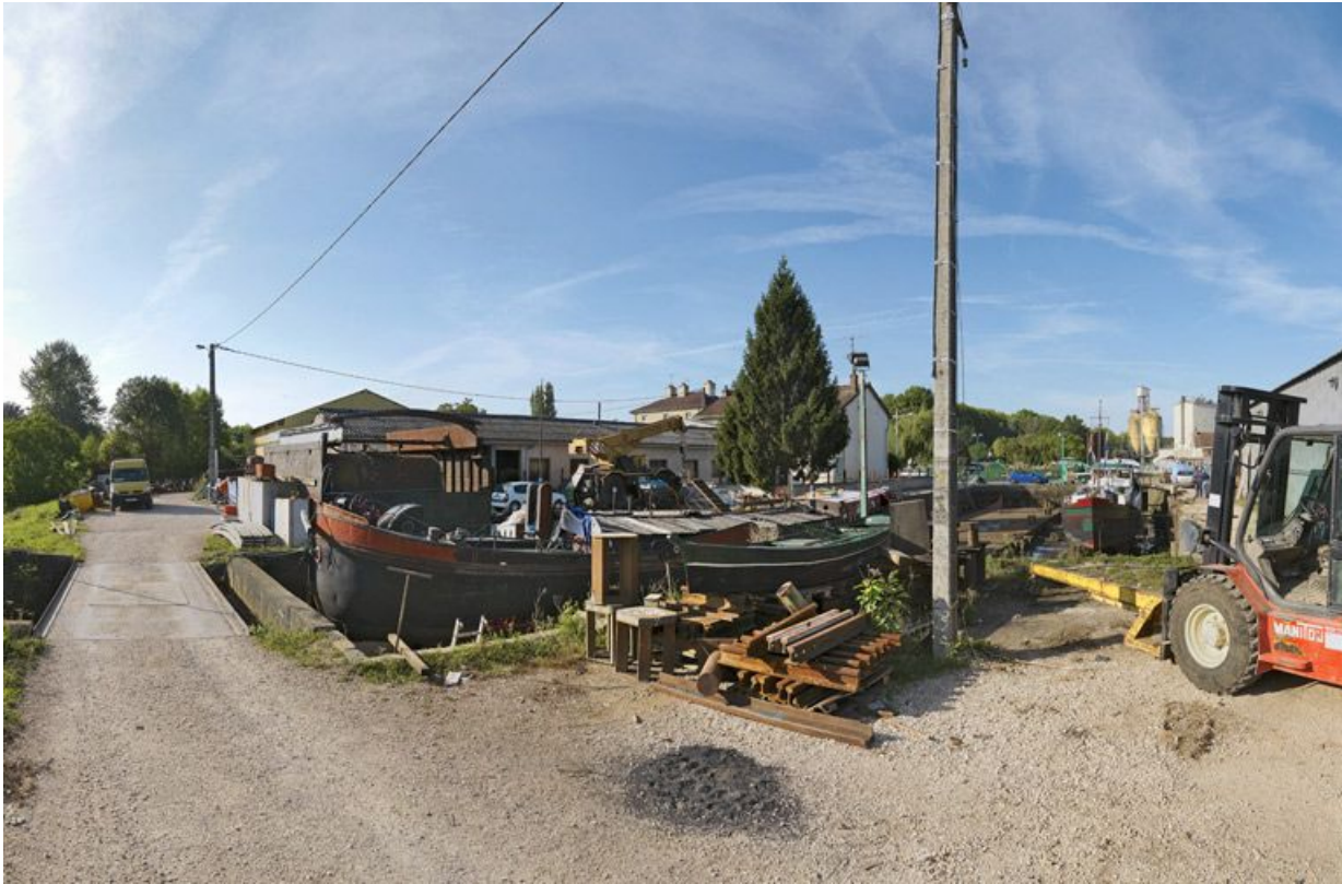
Détail du port : les cales pour réparer ou déchirer les bateaux.

21, Saint-Usage, lieudit : bief 76 du versant Saône