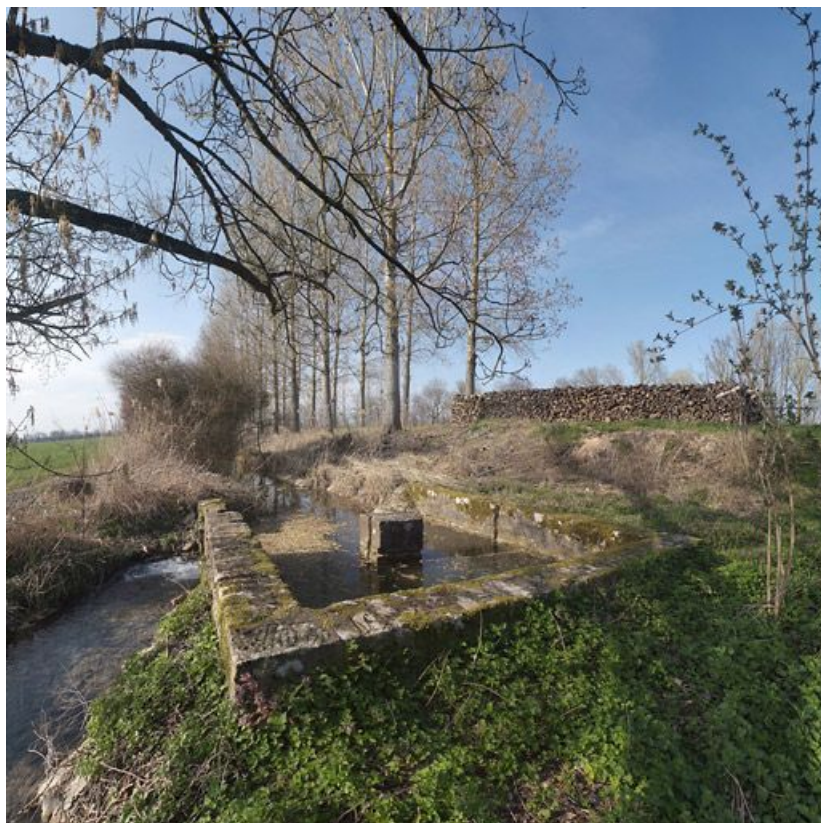
Bassin maçonné recevant les eaux du contre-fossé et celles de l'aqueduc passant sous l'écluse. 21, Longecourt-en-Plaine, lieudit : bief 69 du versant Saône