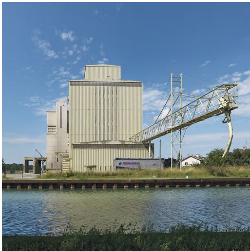
Le silo vu de la rive droite du port.

21, Bretenière, lieudit : bief 65 du versant Saône