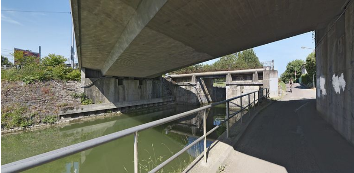
Pont routier moderne au premier plan, au second : l'ancien pont désaffecté.

21, Longvic, lieudit : bief 56 du versant Saône