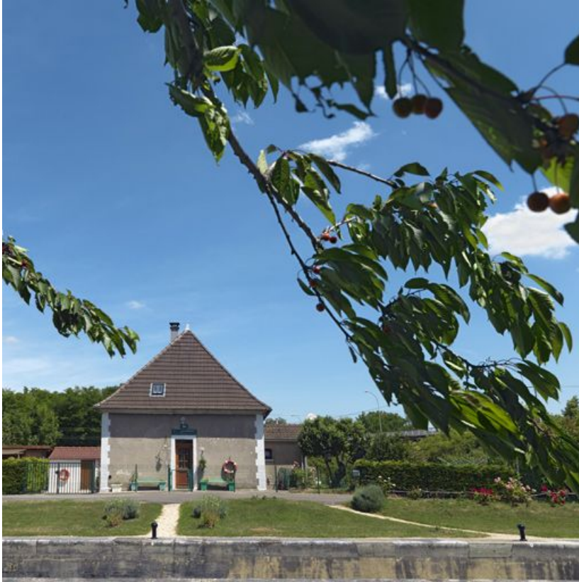
Façade de la maison éclusière : seule une porte ouvre sur le canal. Le modèle de cette série présentait une fenêtre de chaque côté de la porte.

21, Longvic, lieudit : bief 56 du versant Saône