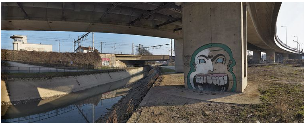
Pont routier permettant le passage des boulevards John Kennedy et Maillard vu du dessous. A l'arrière-plan : pont ferroviaire. 21, Dijon, lieudit : bief 56 du versant Saône

N° de l'illustration : 20112102920NUC4AQ