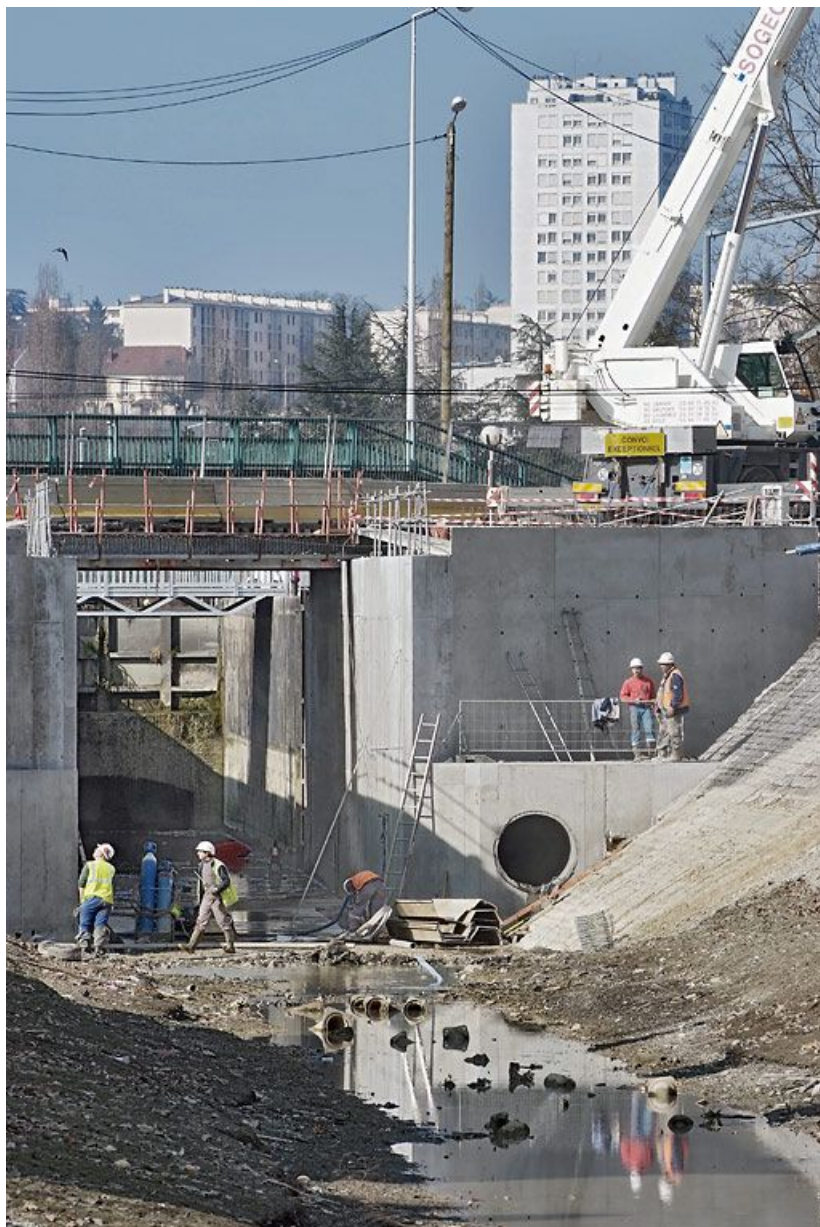
Le bief 56 est vide pour refaire le pont. On voit nettement à droite la sortie ronde de l'aqueduc qui aide au fonctionnement du sas. 21, Dijon, lieudit : Port du canal