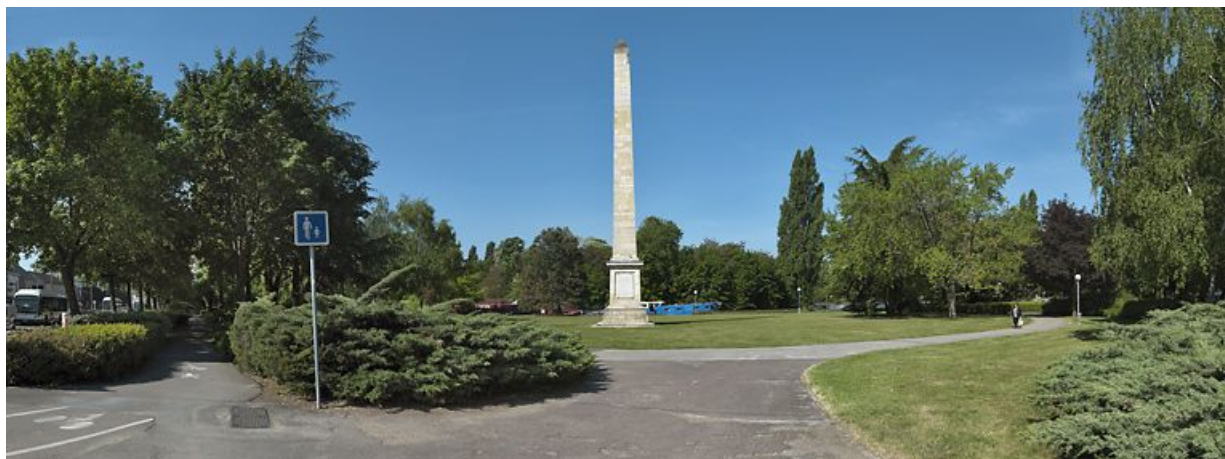
Vue d'ensemble de l'obélisque, au centre du jardin public.