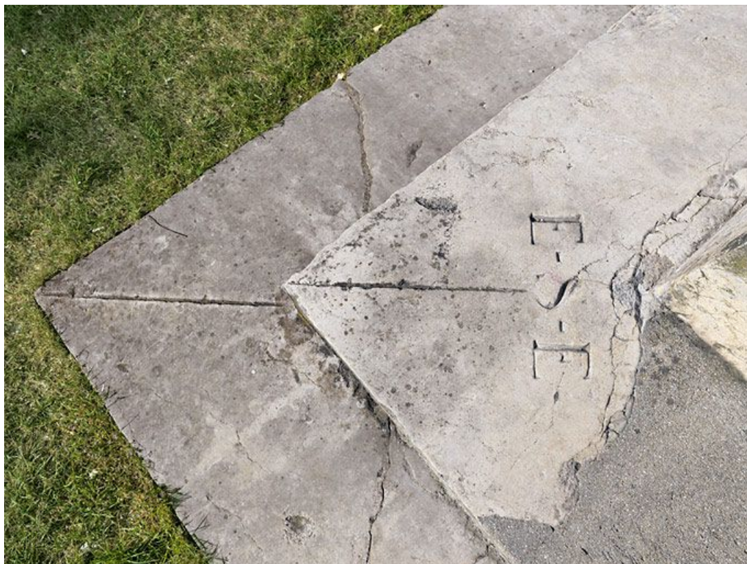
Détail du socle : indication de l'orientation par rapport au soleil.