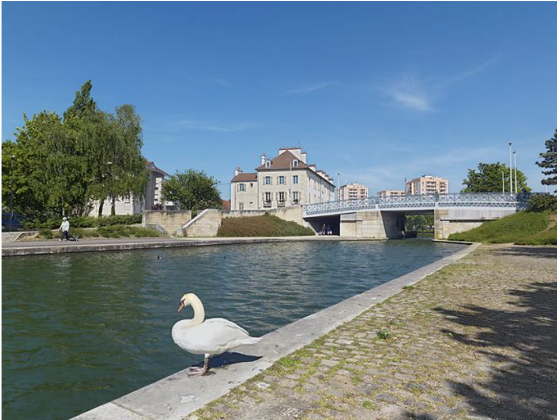
Vue d'ensemble prise du port.