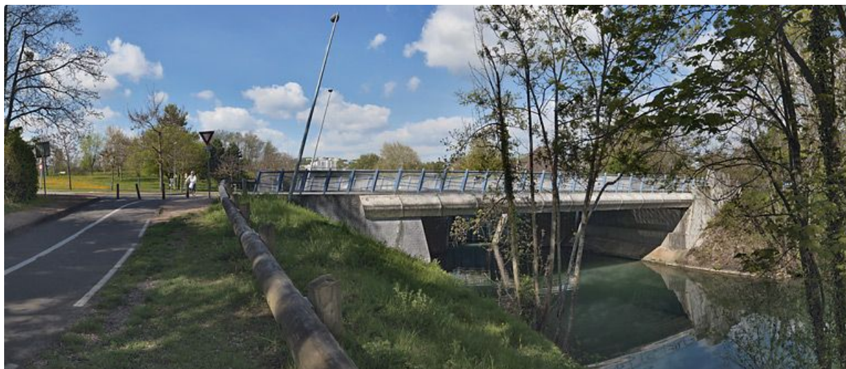
Pont moderne remplaçant le pont ancien sur l'écluse 54 S : vue d'aval. 21, Dijon, lieudit : Larrey