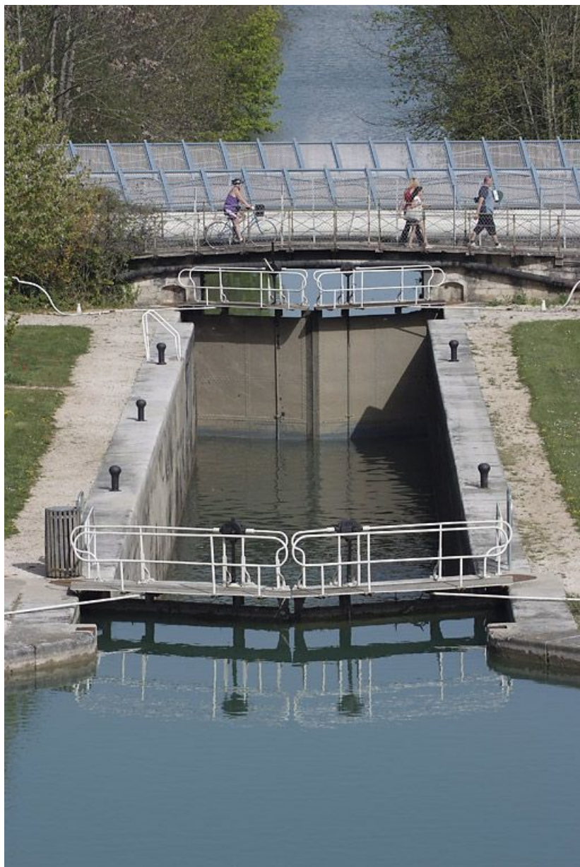
Tête aval de l'écluse 54, avec le pont ancien sur écluse doublé par le pont moderne. 21, Dijon, lieudit : Larrey