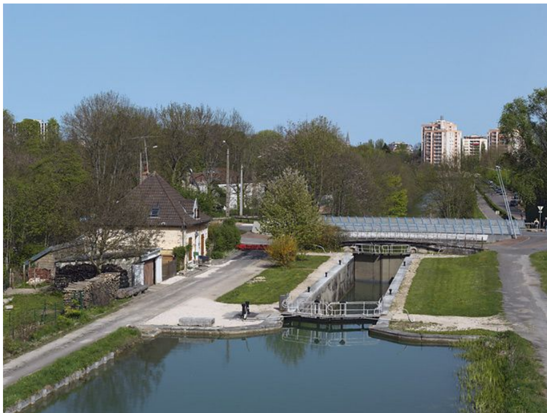
Le site d'écluse du d'amont avec en fond le pont ancien sur écluse (IA21003790) et le nouveau pont (IA21003791). 21, Dijon, lieudit : Larrey