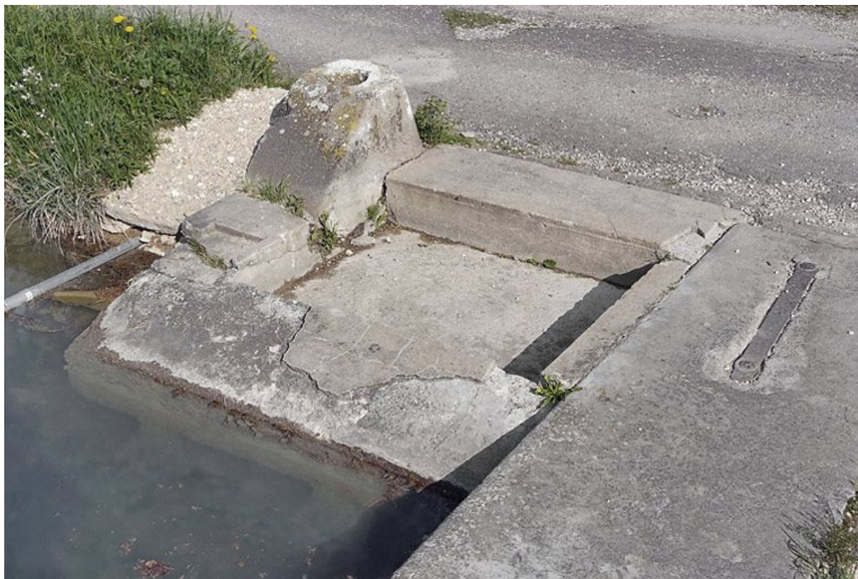
Lavoir maçonné à l'usage des éclusiers, placé avant la tête amont de l'écluse. 21, Dijon, lieudit : Larrey