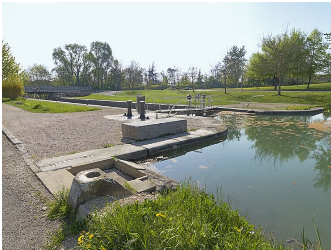
Le sas vu de la tête amont rive gauche. A gauche : le lavoir domestique du site d'écluse. En arrière-plan, les ponts sur écluse, (ancien IA21003790 et nouveau IA21003791).