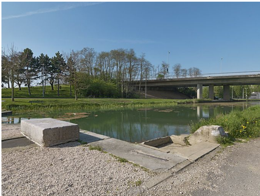
Tête amont de l'écluse, rive gauche : le lavoir domestique du site d'écluse. A l'arrière-plan, le pont isolé IA21003788. 21, Dijon, lieudit : Larrey