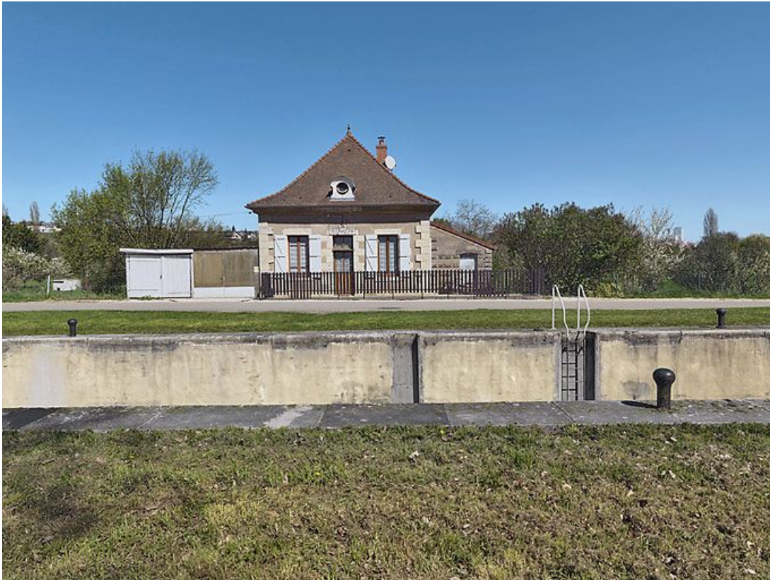
Vue d'ensemble du site d'écluse vu de face.