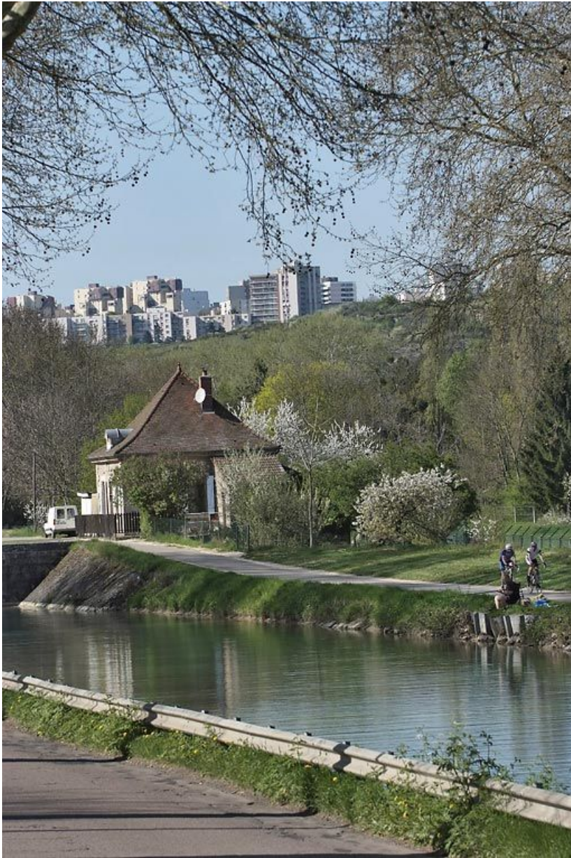
Le site d'écluse vu d'aval avec la colline de Talant en arrière-plan. 21, Dijon, lieudit : Fontaine-d'Ouche