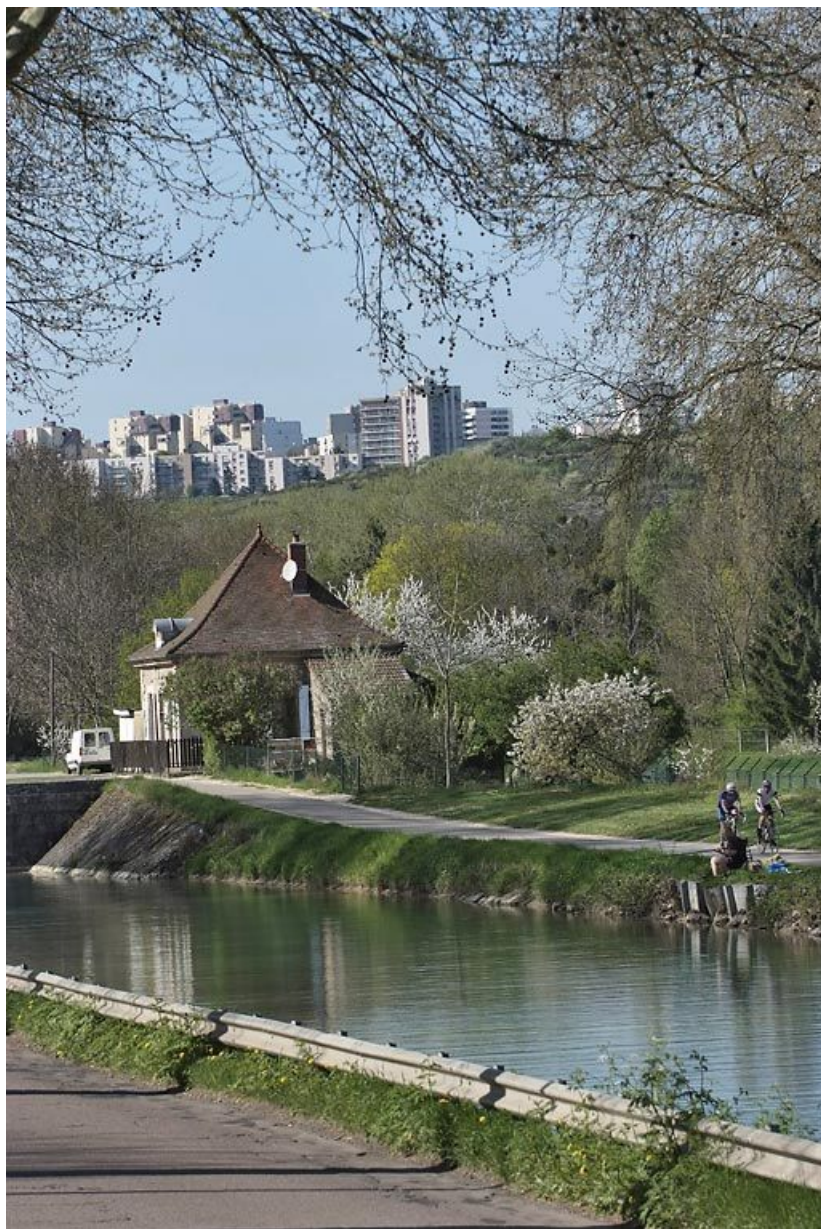
Le site d'écluse vu d'aval avec la colline de Talant en arrière-plan. 21, Dijon, lieudit : Fontaine-d'Ouche