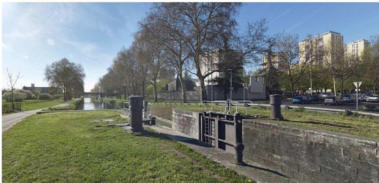
Aval du sas. Le quartier de la Fontaine-d'Ouche en arrière-plan.