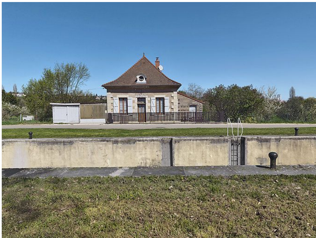
Vue d'ensemble du site d'écluse vu de face.