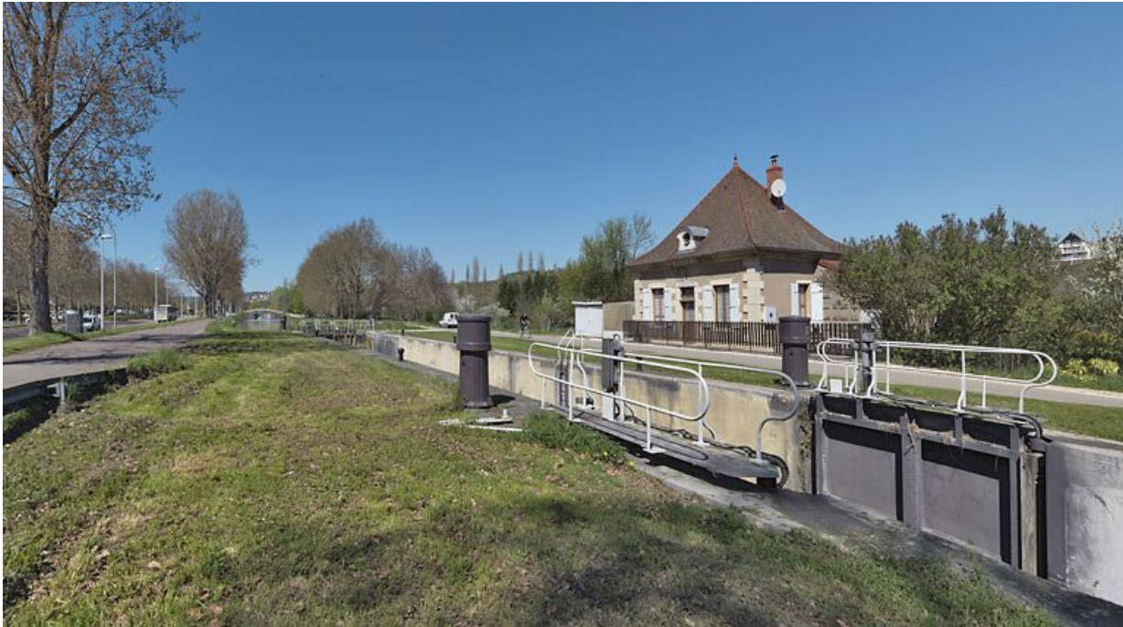
Vue d'ensemble du site d'écluse (d'aval).