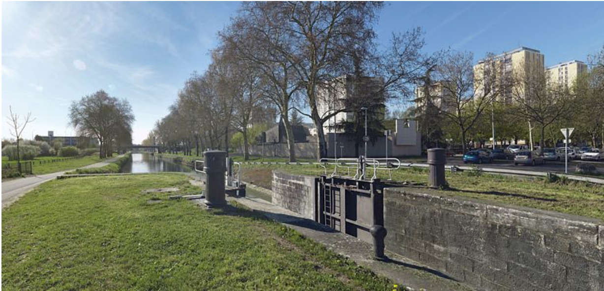
Aval du sas. Le quartier de la Fontaine-d'Ouche en arrière-plan.