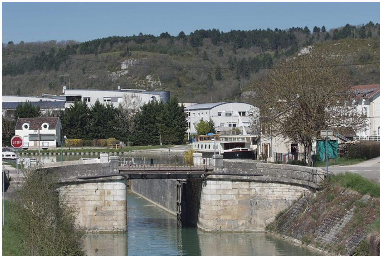
Pont vu d'ensemble d'aval, avec port de Plombières en fond.

21, Plombières-lès-Dijon, lieudit : bief 50 du versant Saône