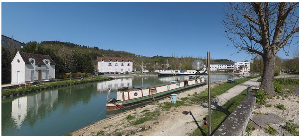
Le port, vu d'amont, petite construction moderne à gauche, puis gare ferroviaire transformée en immeuble à logements. Site d'écluse au fond. Au premier plan, un bateau anglais.

21, Plombières-lès-Dijon, lieudit : bief 50 du versant Saône