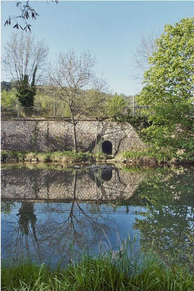
Sortie de la rigole dans l'Ouche au premier plan.

21, Plombières-lès-Dijon, lieudit : bief 50 du versant Saône