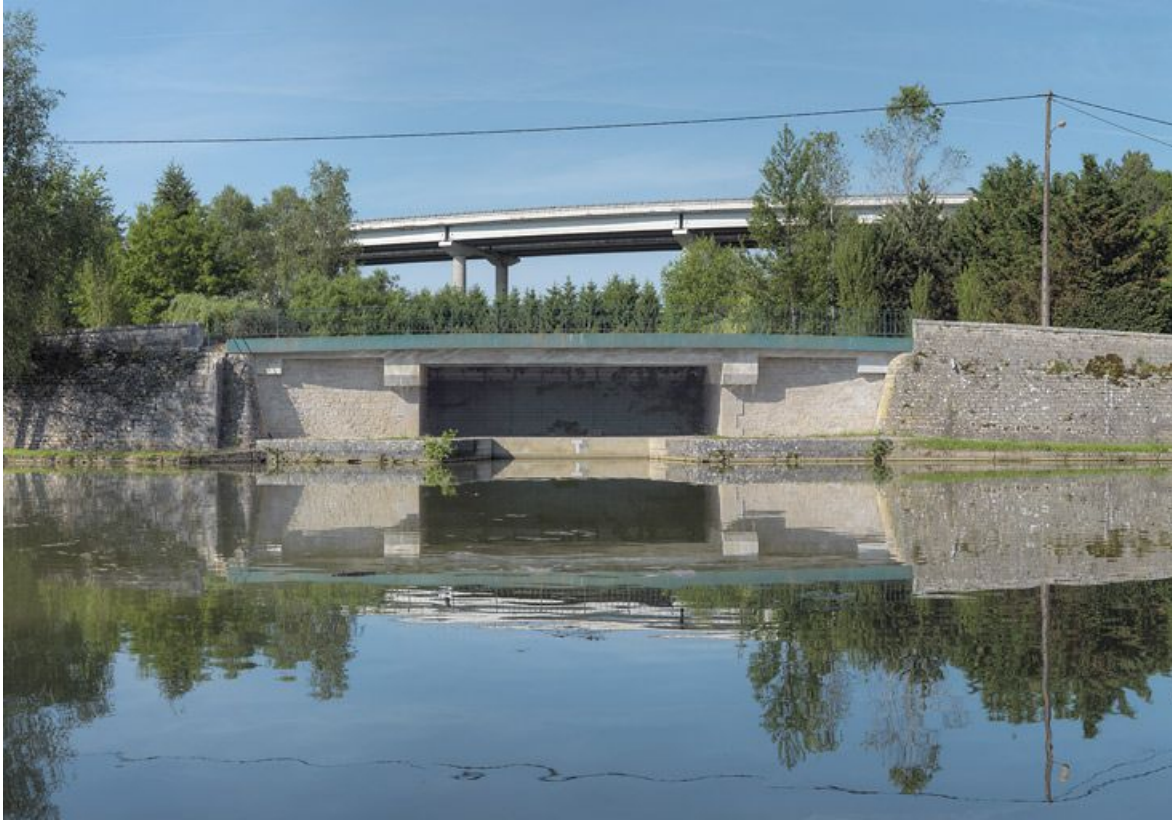
Le viaduc surplombant le pont sur l'ancienne gare d'eau des houillères d'Epinac.

21, Crugey, lieudit : bief 17 du versant Saône