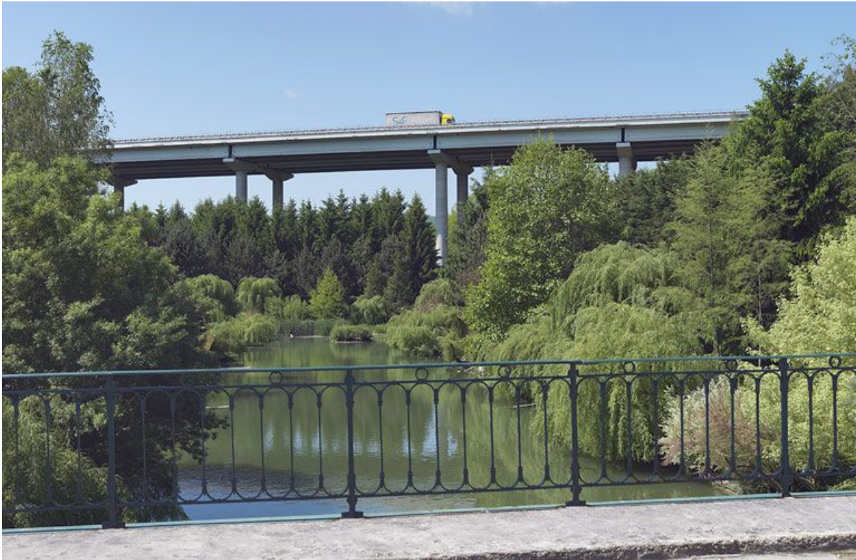
Le viaduc surplombant l'ancienne gare d'eau des houillères d'Epinaç.

21, Crugey, lieudit : bief 17 du versant Saône