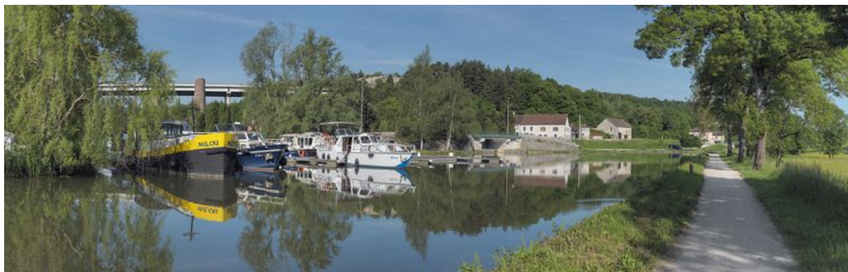
Le port de Pont-d'Ouche. En arrière-plan, la cheminée des anciennes houillères d'Epinac, devant le viaduc autoroutier. Pont sur la gare d'eau des houillères en face.

21, Colombier, lieudit : bief 20 du versant Saône