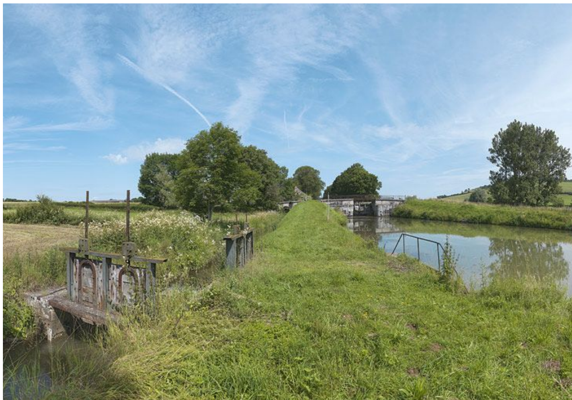
Réseau hydraulique autour de la rigole du Tillot avec arrivée d'eau dans le canal et vannes.

21, Sainte-Sabine, lieudit : bief 13 du versant Saône