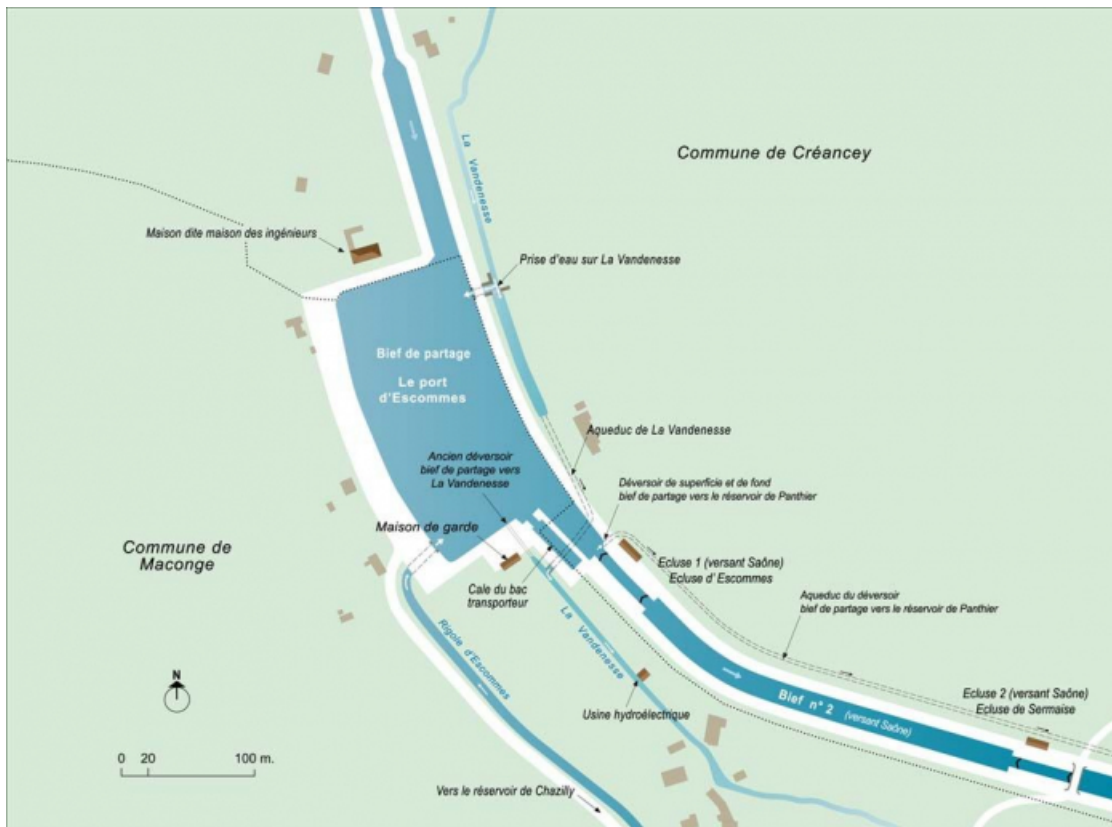
Plan schématique du port d'Escommes et du bief 02 du versant Saône.