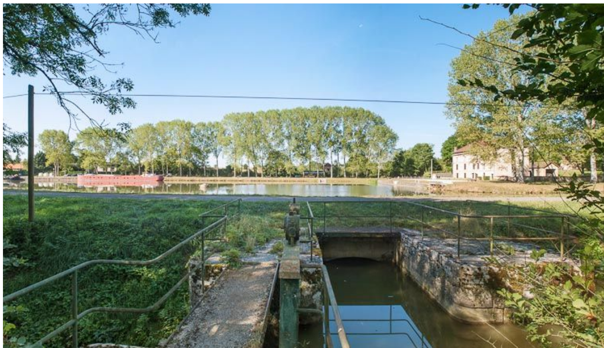
Vue du système de vannes sur le ruisseau de la Vandenesse et du port à l'arrière plan.