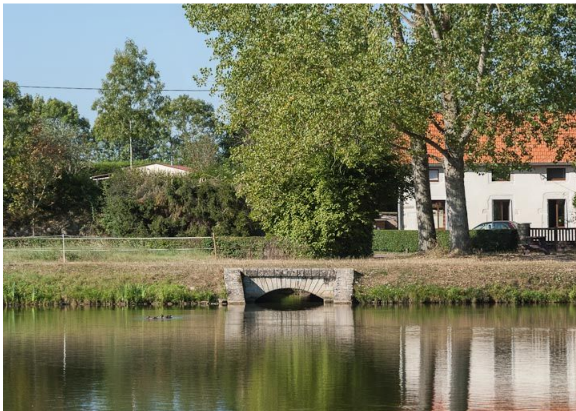
Vue de l'arrivée de la rigole de Chazilly.