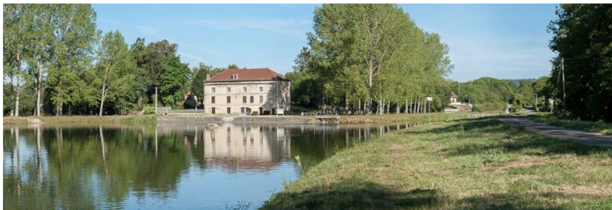
Vue du port et de la cimenterie depuis la rive gauche.