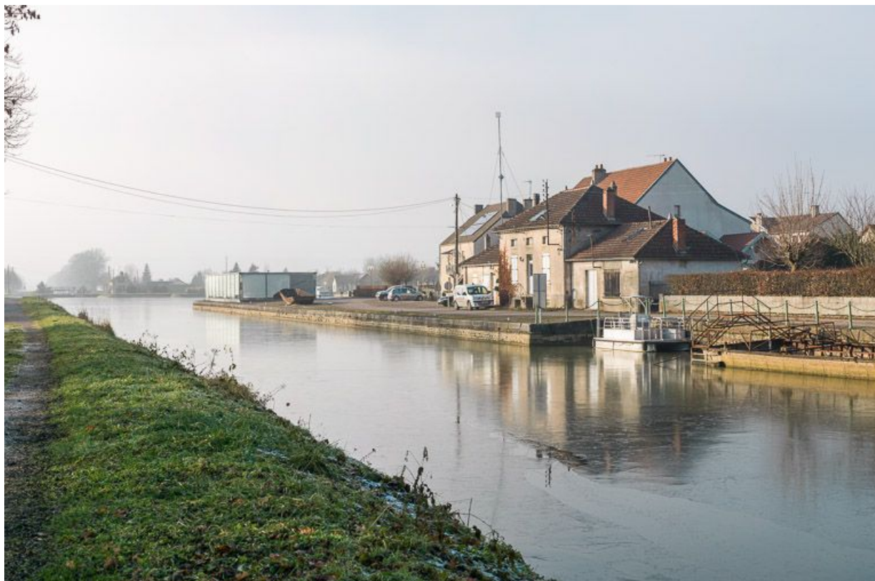
Vue d'amont. En arrière plan le centre d'interprétation et le port.

21, Pouilly-en-Auxois, lieudit : bief de partage