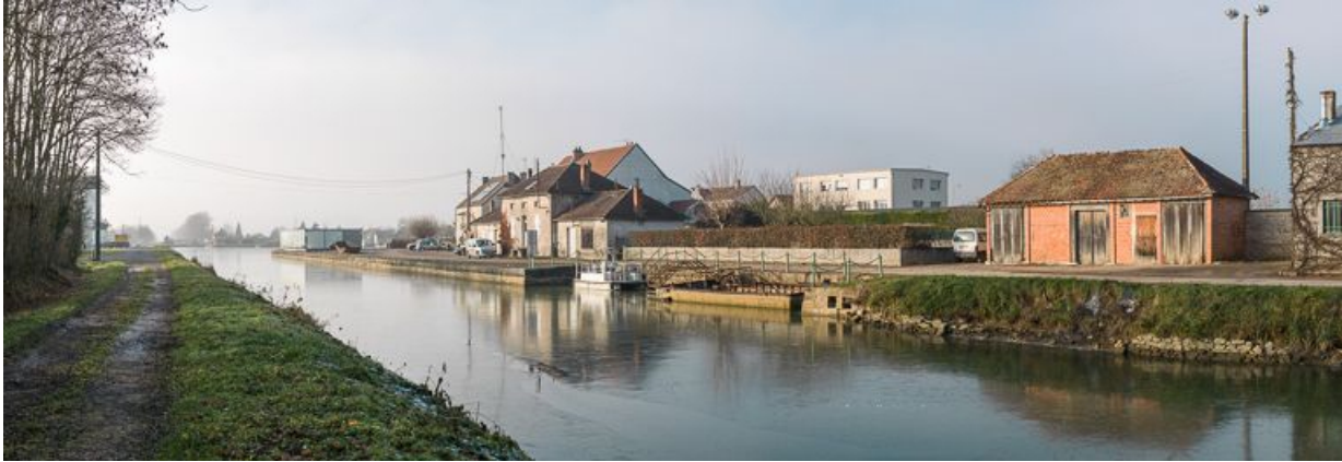
Vue d'amont, au premier plan la remise.

21, Pouilly-en-Auxois, lieudit : bief de partage