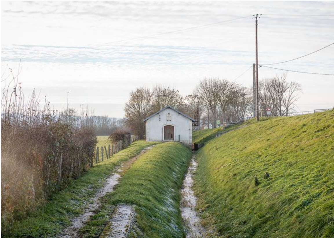
Vue de l'entrée de l'usine.

21, Pouilly-en-Auxois, lieudit : bief de partage