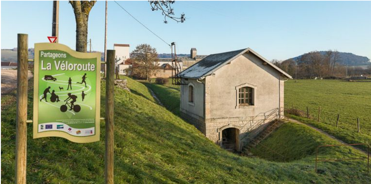
façade postérieure de l'usine.

21, Pouilly-en-Auxois, lieudit : bief de partage