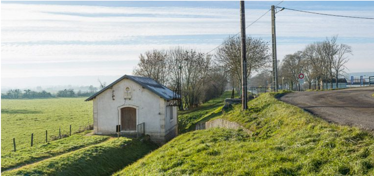
Vue de l'entrée de l'usine.

21, Pouilly-en-Auxois, lieudit : bief de partage