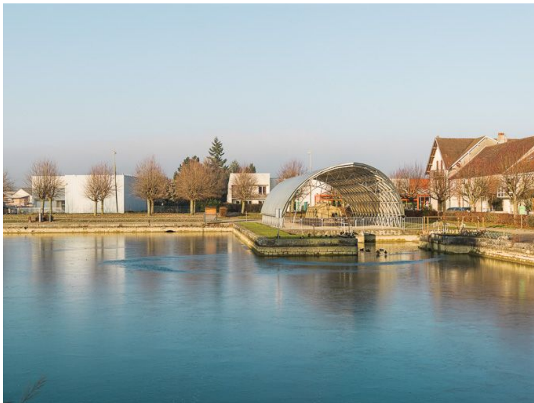
Le port depuis la rive gauche, au centre la halle du toueur.

21, Pouilly-en-Auxois, lieudit : bief de partage