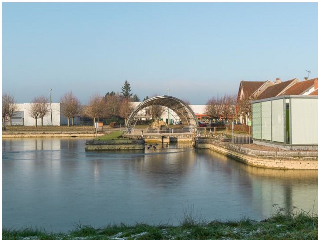
Le port depuis la rive gauche, au centre la halle du toueur.

21, Pouilly-en-Auxois, lieudit : bief de partage