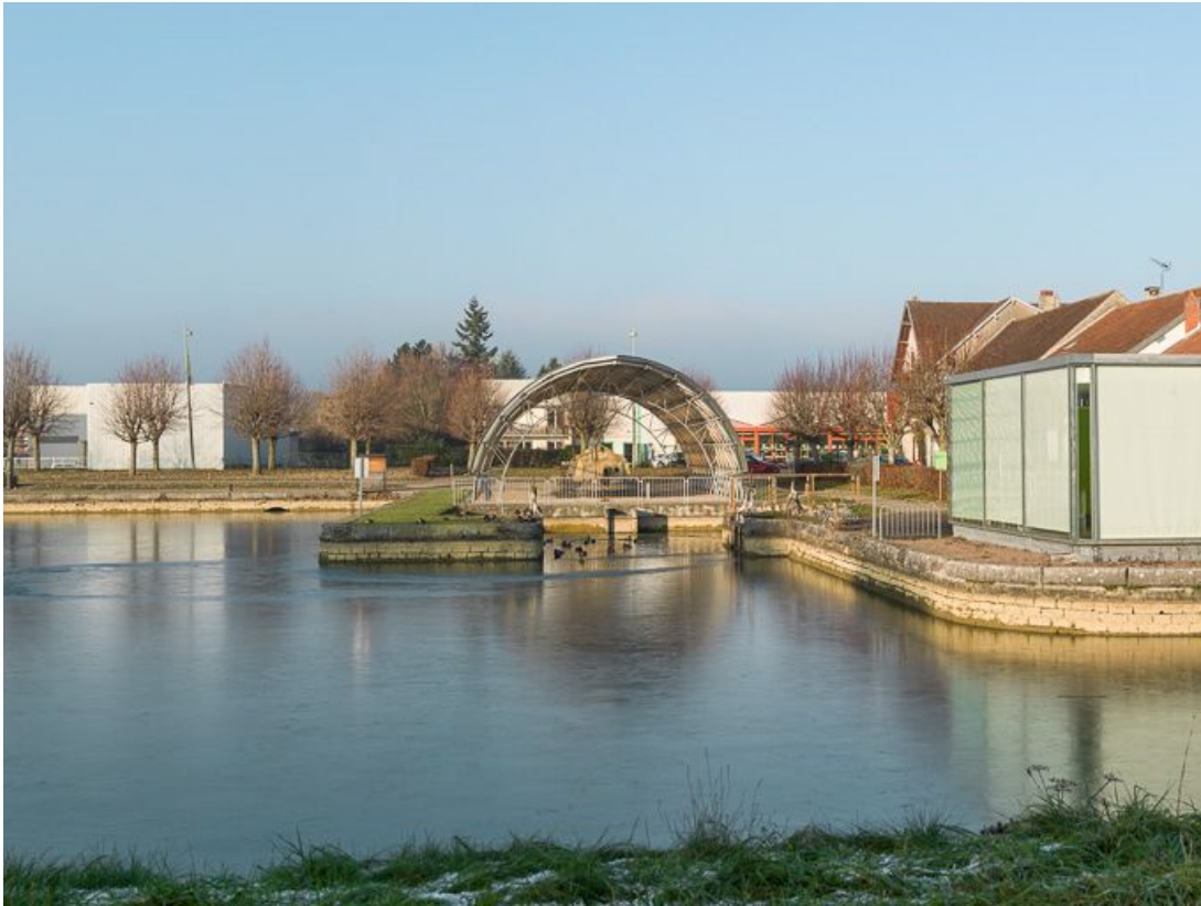
Le port depuis la rive gauche, au centre la halle du toueur.

21, Pouilly-en-Auxois, lieudit : bief de partage