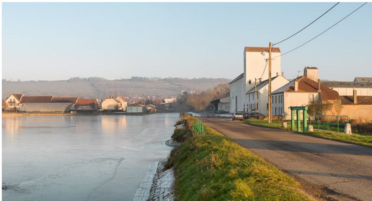
Vue d'aval : à droite le déversoir et les silos, à gauche la halle du toueur. 21, Pouilly-en-Auxois, lieudit : bief de partage

N° de l'illustration : 20132101045NUC4AQ