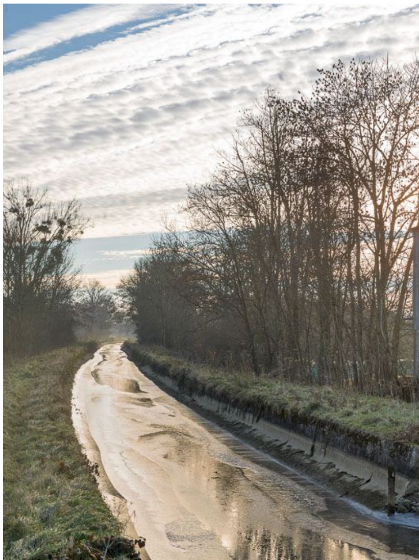
La rigole d'alimentation rive gauche.

21, Pouilly-en-Auxois, lieudit : bief de partage