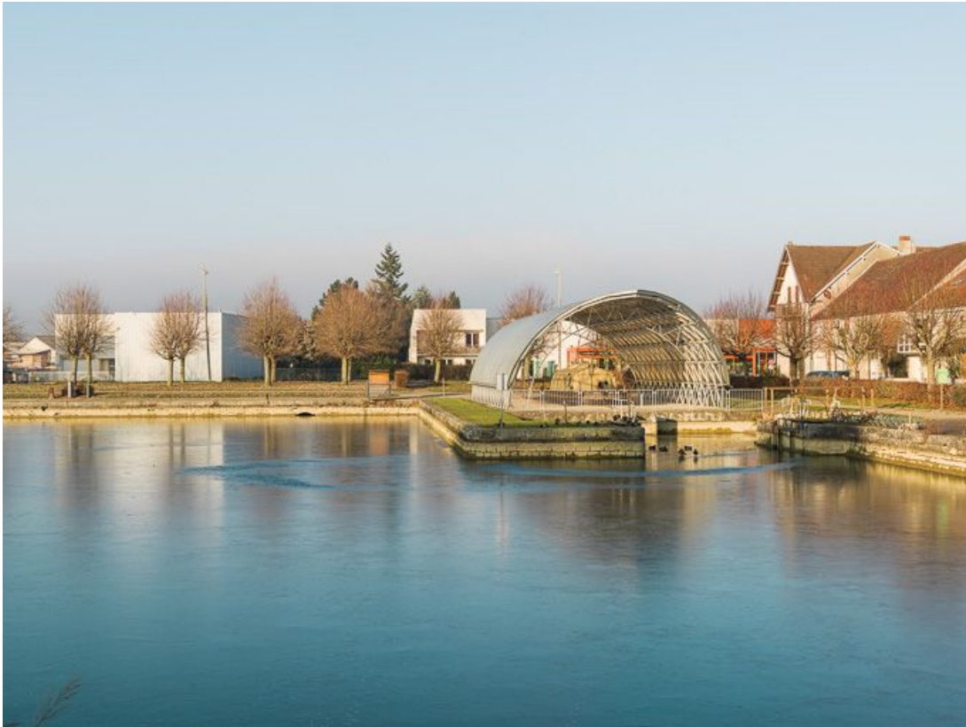
Le port depuis la rive gauche, au centre la halle du toueur.

21, Pouilly-en-Auxois, lieudit : bief de partage