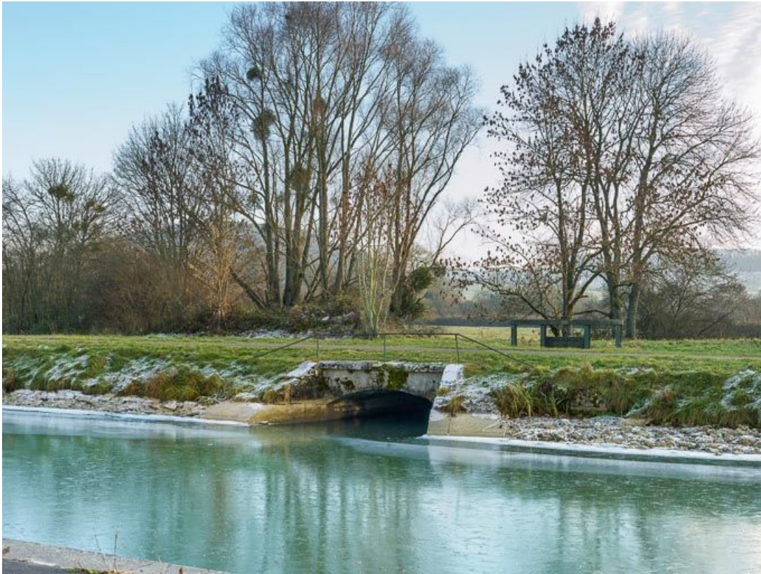
Arrivée de la rigole d'alimentation dans le canal.

21, Pouilly-en-Auxois, lieudit : bief de partage