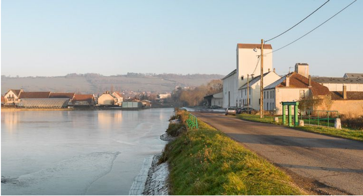
Vue d'aval : à droite le déversoir et les silos, à gauche la halle du toueur.

21, Pouilly-en-Auxois, lieudit : bief de partage