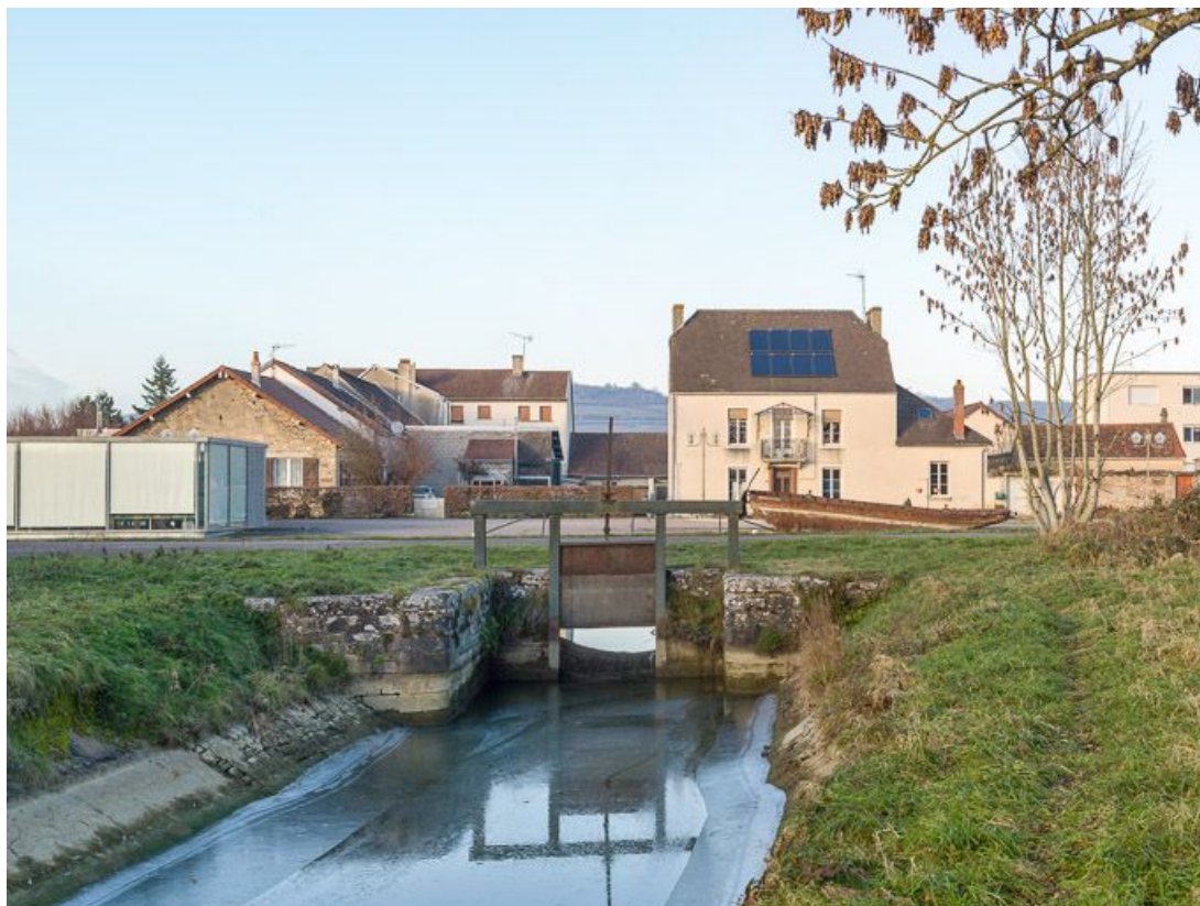
Arrivée de la rigole d'alimentation rive gauche. A gauche, on aperçoit le musée.

21, Pouilly-en-Auxois, lieudit : bief de partage