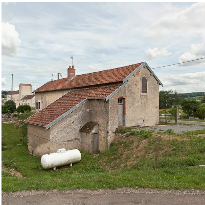
Vue de trois-quarts de la façade arrière de la maison.

21, Pouilly-en-Auxois, lieudit : bief 01 du versant Yonne