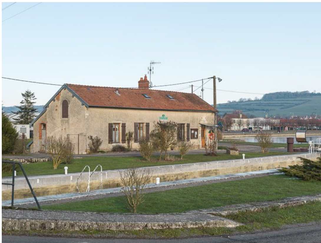
Vue de 3/4 de la maison éclusière, pignon gauche et petits bâtiments sous appentis.

21, Pouilly-en-Auxois, lieudit : bief 01 du versant Yonne