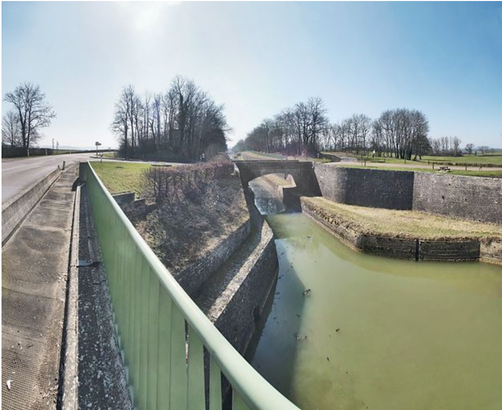
Le pont en pierre de l'aval. On voit les différents niveaux de la tranchée : canal, banquette de halage et sommet.

21, Saint-Thibault, lieudit : bief 13 du versant Yonne