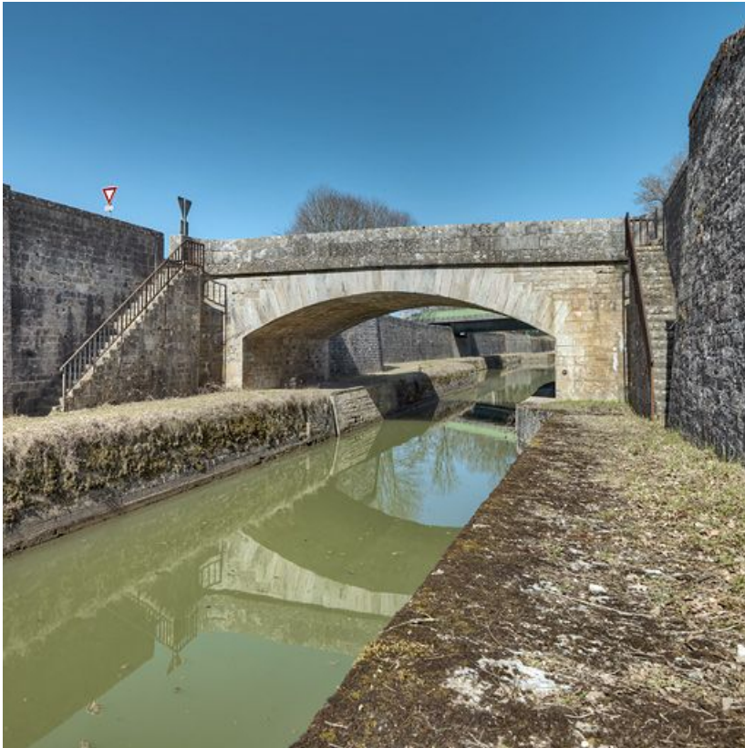
Le pont en pierre de l'amont, avec ses deux escaliers d'accès à la banquette de halage de la tranchée. Derrière le pont plus récent. 21, Saint-Thibault, lieudit : bief 13 du versant Yonne