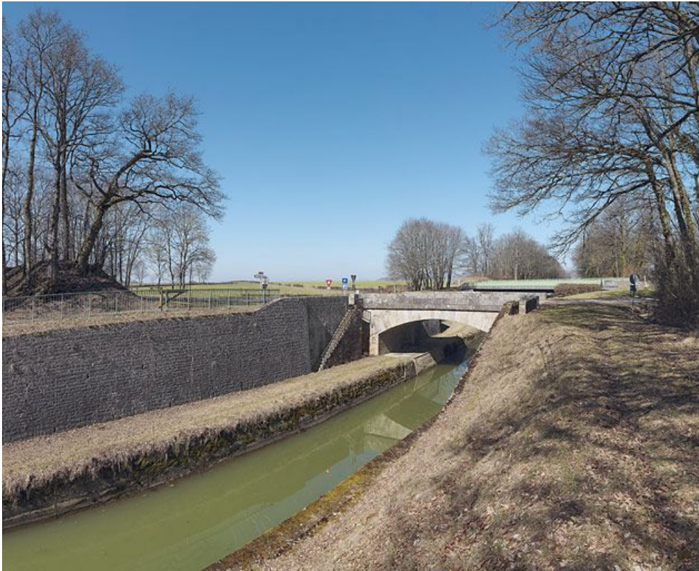
Le pont en pierre de l'amont, avec un des deux escaliers d'accès à la banquette de halage de la tranchée. Derrière le pont plus récent.

21, Saint-Thibault, lieudit : bief 13 du versant Yonne