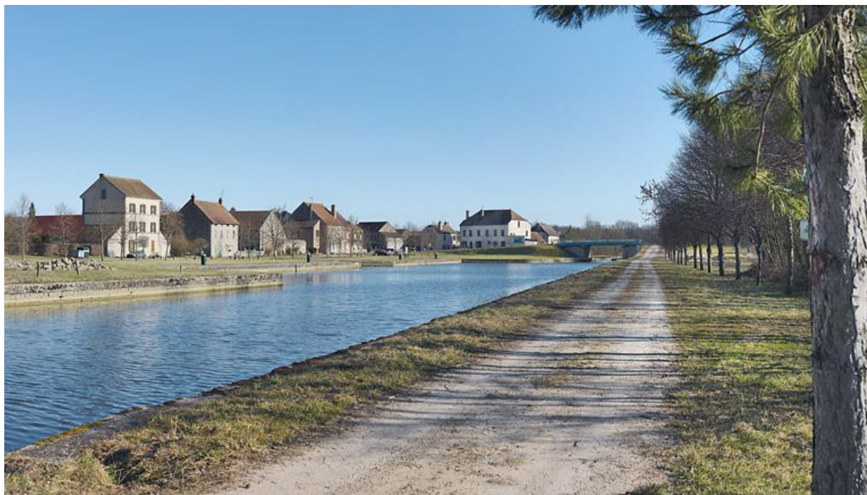
Vue d'ensemble du port pris d'aval, à l'arrière-plan : pont routier.