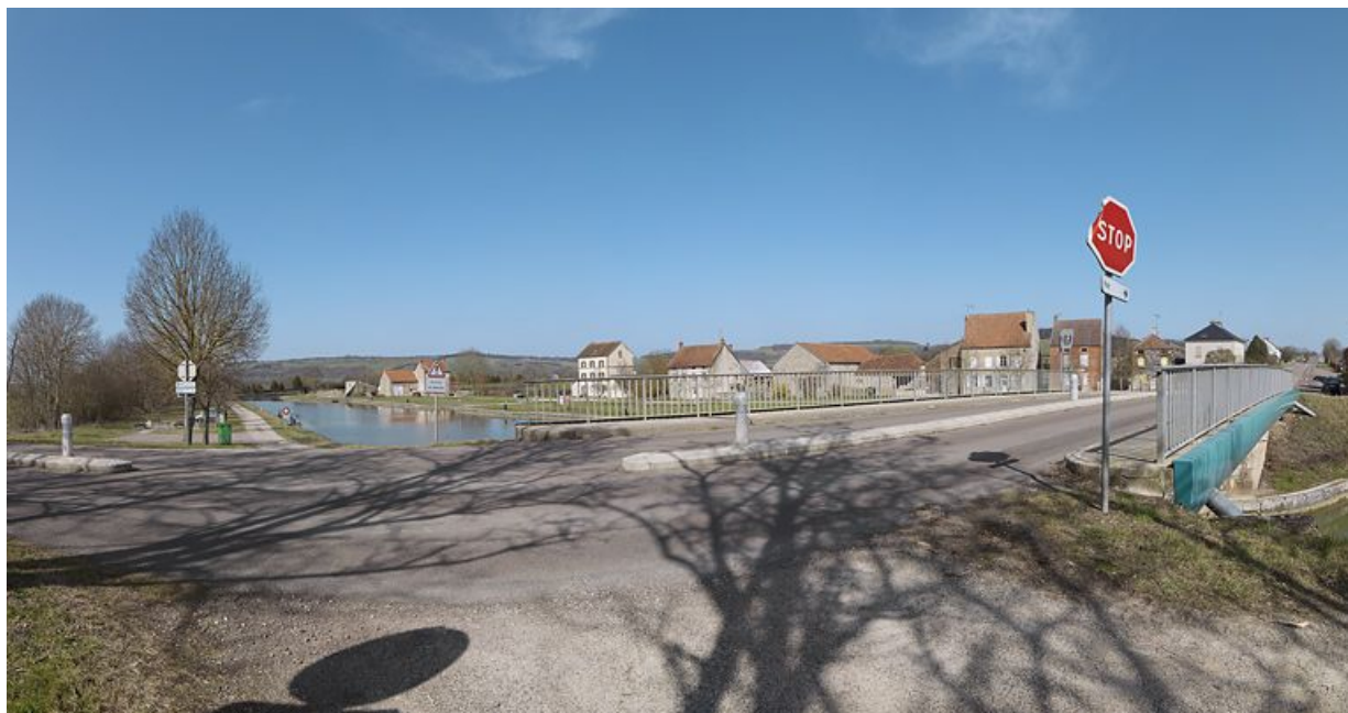
Vue d'ensemble du port avec le pont routier au premier plan.