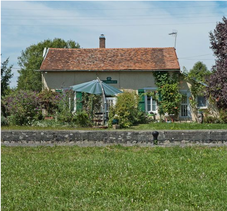
Vue de face de la maison éclusière.

21, Marigny-le-Cahouët, lieudit : bief 23 du versant Yonne