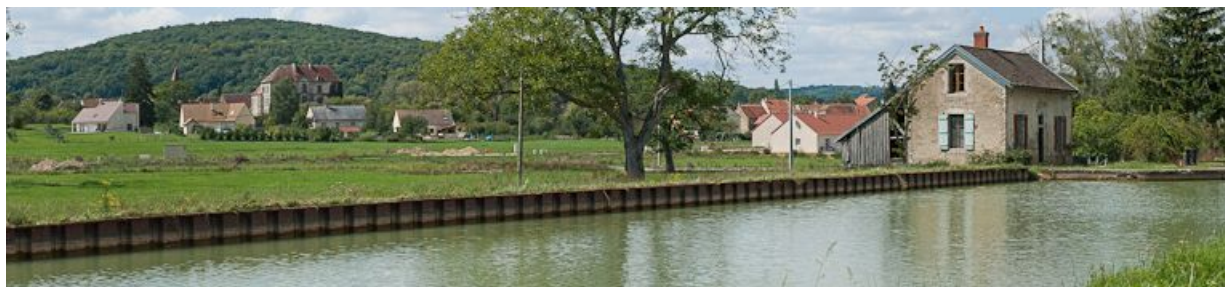
Vue du site d'écluse et du château de Venarey (IA21003512) à l'arrière-plan.

21, Venarey-les-Laumes, lieudit : bief 55 du versant Yonne