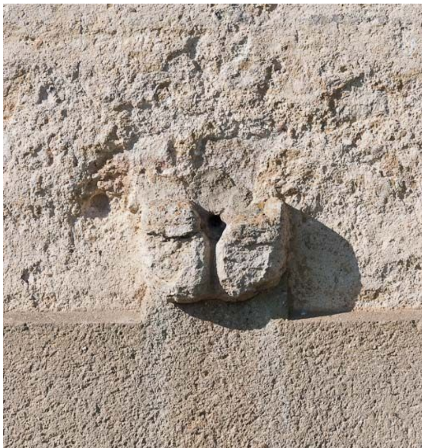
Vue d'une pierre d'écoulement de l'évier.

21, Venarey-les-Laumes, lieudit : bief 55 du versant Yonne