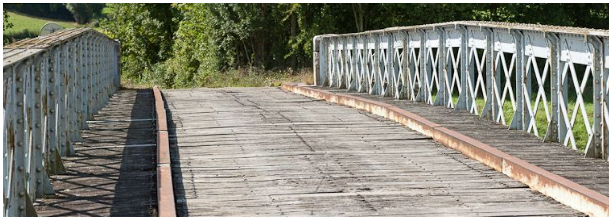
Vue du tablier avant les travaux de l'automne 2011.

21, Grignon, lieudit : bief 59 du versant Yonne