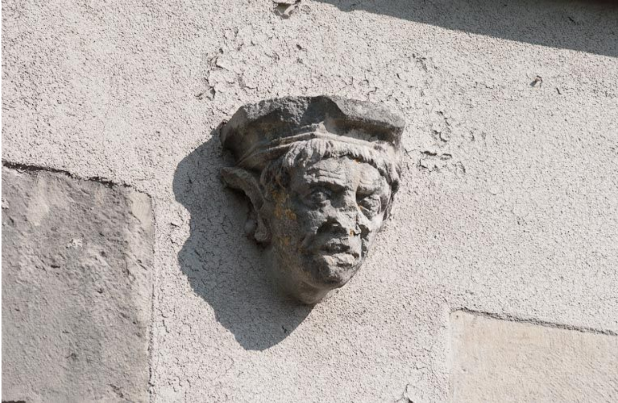
Corps de bâtiment principal : façade postérieure, sculpture en remploi.

21, Moutiers-Saint-Jean, 8 place de l' Hôpital