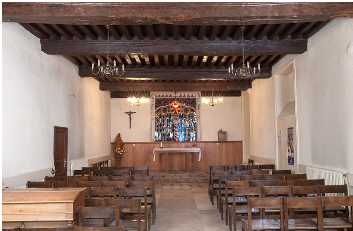
Corps de bâtiment principal : salle des hommes devenue chapelle (vue depuis l'entrée).

21, Moutiers-Saint-Jean, 8 place de l' Hôpital