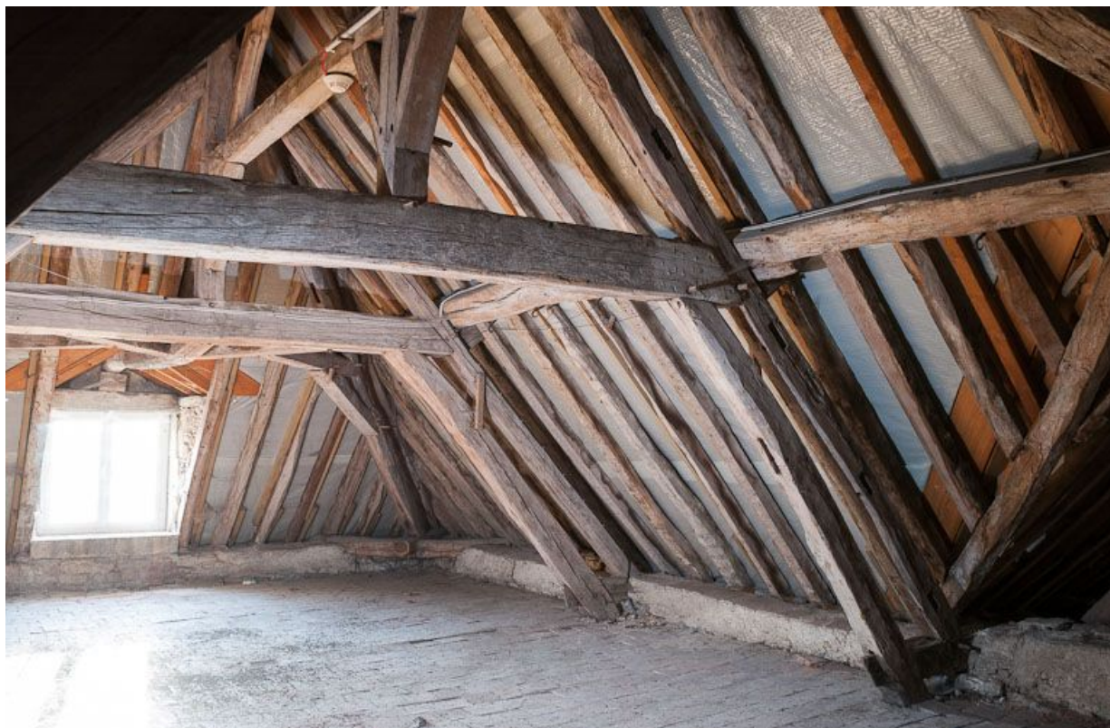
Corps de bâtiment principal : charpente (au-dessus de l'ancienne salle des femmes).

21, Moutiers-Saint-Jean, 8 place de l' Hôpital