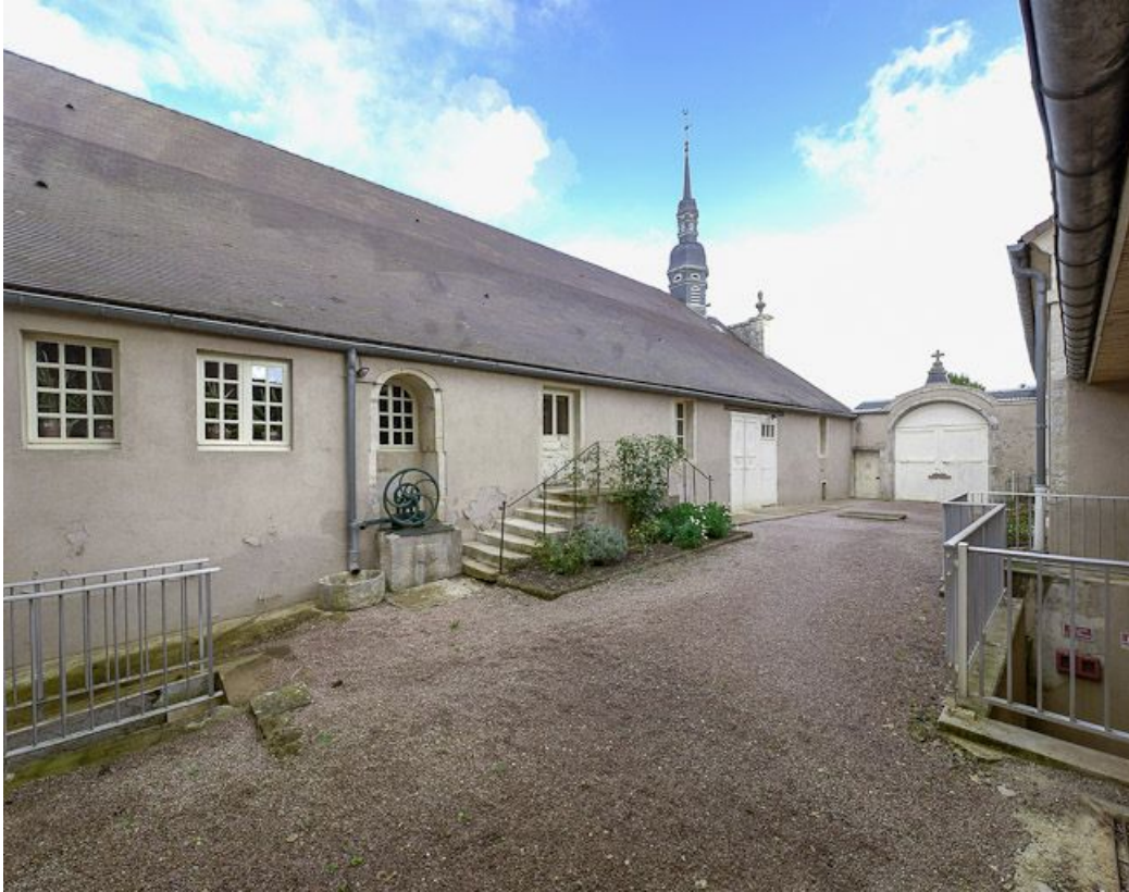
Cour principale : élévation gauche du bâtiment principal.

21, Moutiers-Saint-Jean, 8 place de l' Hôpital