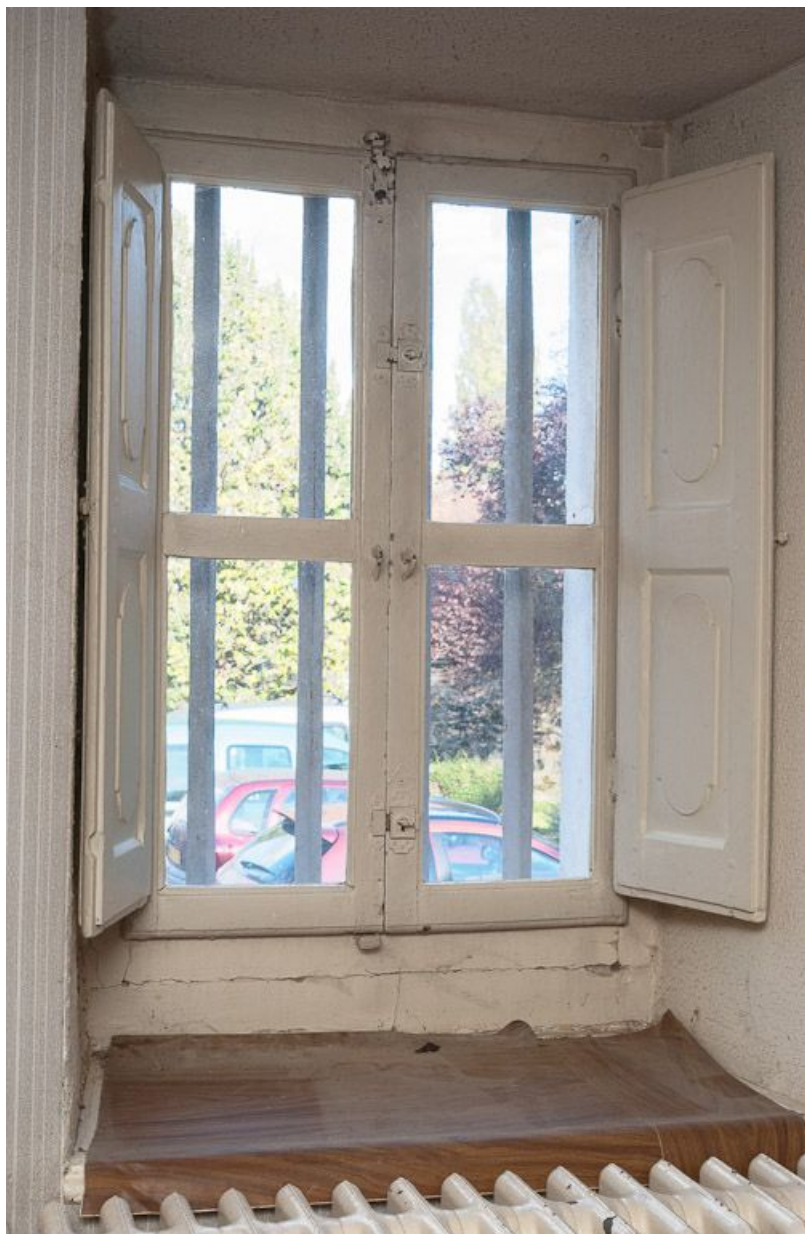
Corps de bâtiment principal : première pièce latérale gauche (détail : fenêtre à volets intérieurs). 21, Moutiers-Saint-Jean, 8 place de l' Hôpital