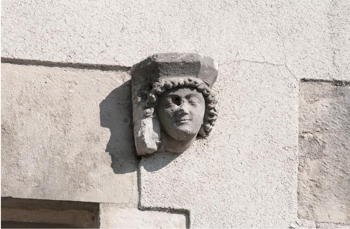
Corps de bâtiment principal : façade postérieure, sculpture en remploi.

21, Moutiers-Saint-Jean, 8 place de l' Hôpital