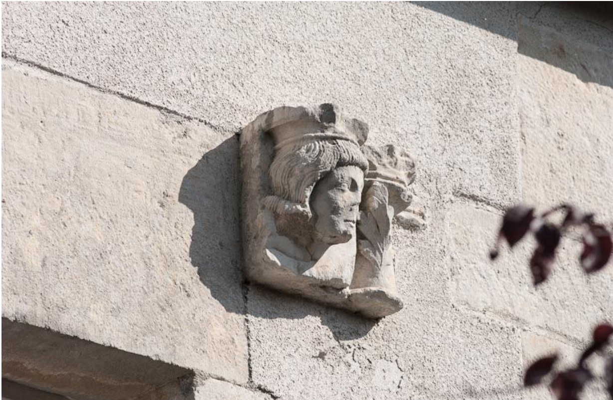
Corps de bâtiment principal : façade postérieure, sculpture en remploi.

21, Moutiers-Saint-Jean, 8 place de l' Hôpital