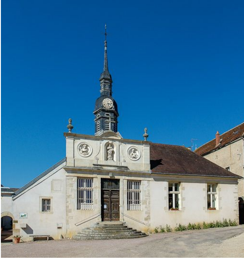
Façade sur rue : vue partielle (ancienne salle des hommes devenue chapelle). 21, Moutiers-Saint-Jean, 8 place de l' Hôpital