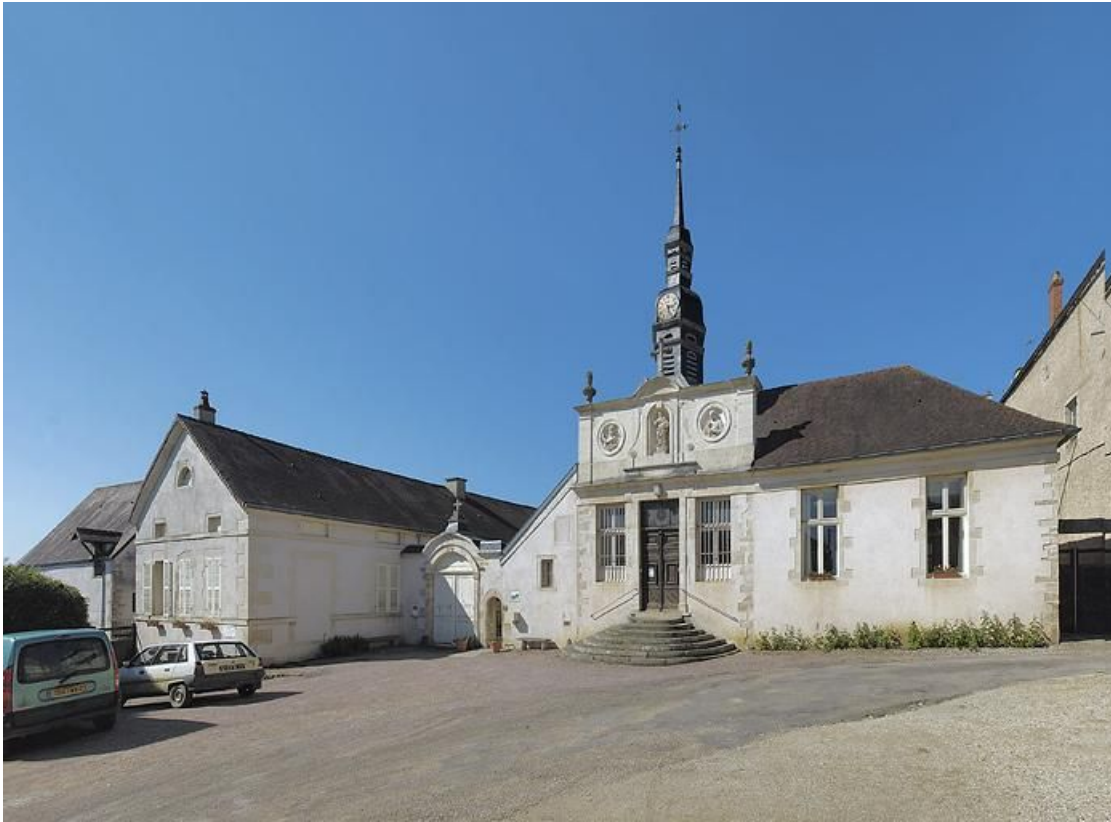
Façade sur rue : vue d'ensemble.

21, Moutiers-Saint-Jean, 8 place de l' Hôpital