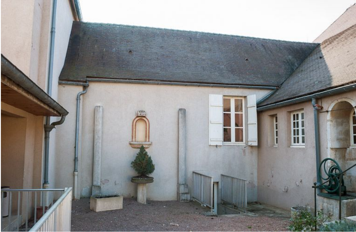
Corps de bâtiment transversal : élévation sur la cour principale.

21, Moutiers-Saint-Jean, 8 place de l' Hôpital