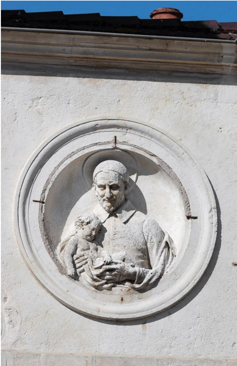
Façade sur rue, détail du haut-relief : saint Vincent de Paul.

21, Moutiers-Saint-Jean, 8 place de l' Hôpital