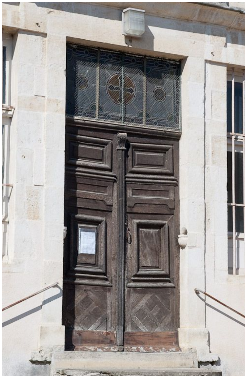
Façade sur rue : détail (porte d'entrée de l'ancienne salle des hommes devenue chapelle). 21, Moutiers-Saint-Jean, 8 place de l' Hôpital