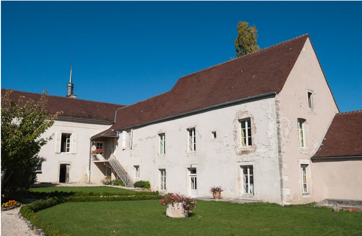
Vue d'ensemble des bâtiments à l'angle nord du jardin : bâtiment de l'apothicaire et ancien bûcher transformé en "salle d'asile". 21, Moutiers-Saint-Jean, 8 place de l' Hôpital