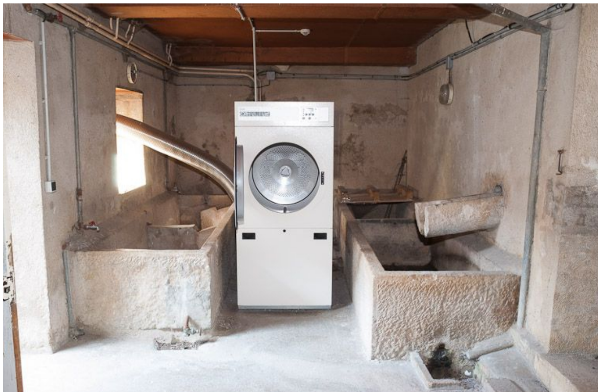
Corps de bâtiment transversal : buanderie à l'étage de soubassement.

21, Moutiers-Saint-Jean, 8 place de l' Hôpital