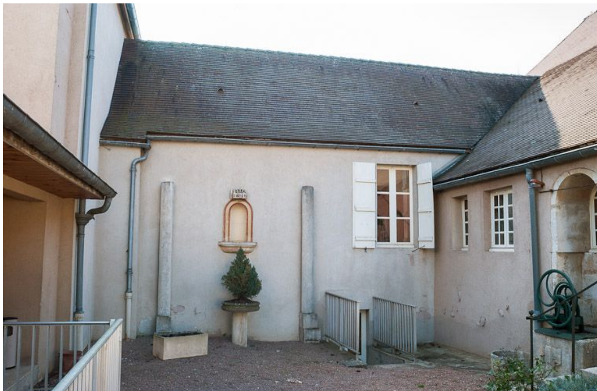
Corps de bâtiment transversal : élévation sur la cour principale.

21, Moutiers-Saint-Jean, 8 place de l' Hôpital