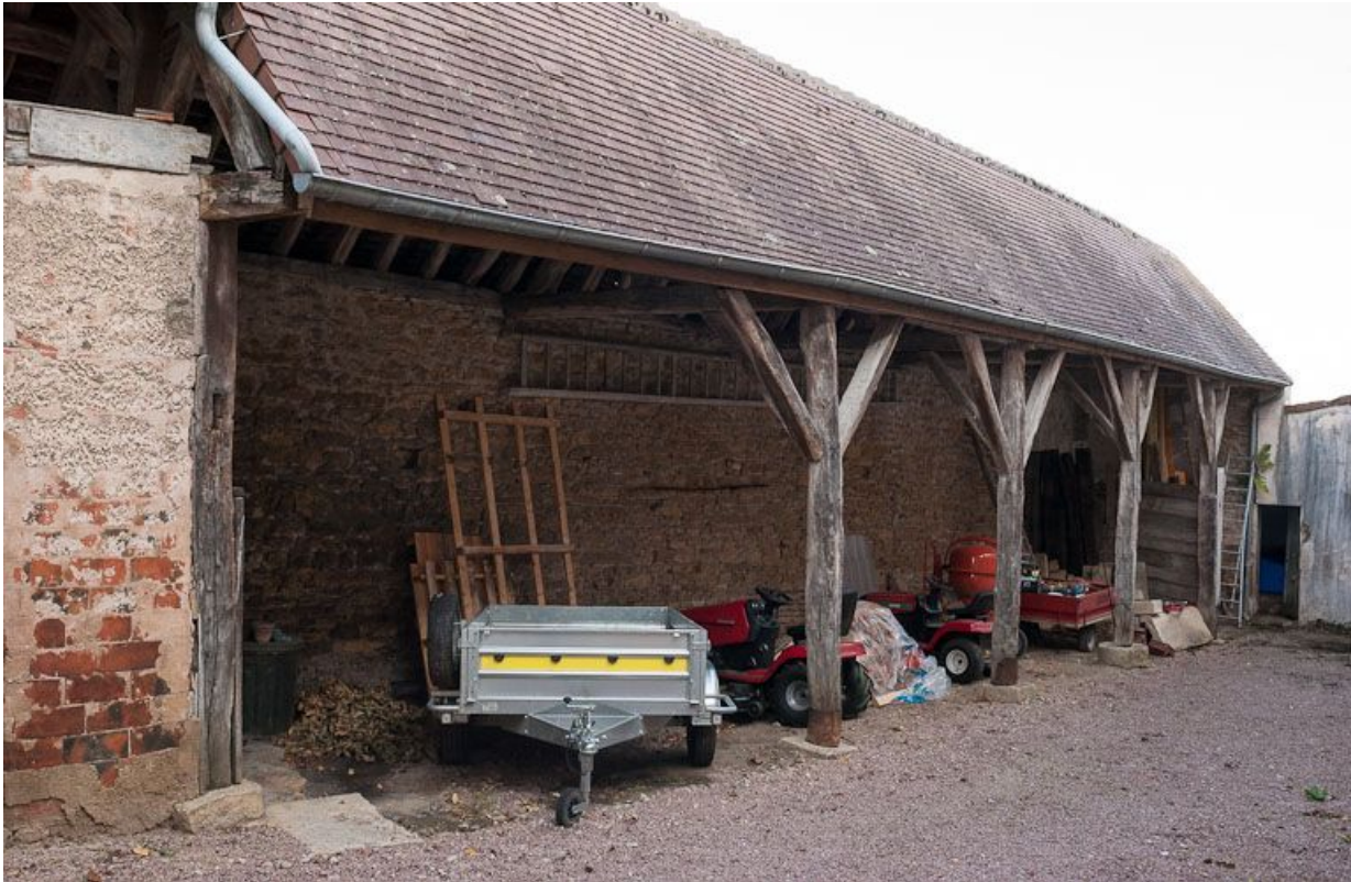
Cour latérale gauche : hangar.

21, Moutiers-Saint-Jean, 8 place de l' Hôpital