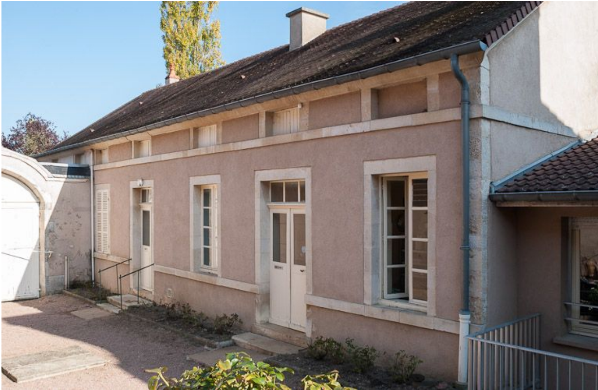
Corps de bâtiment à gauche de la cour principale : élévation sur cour. 21, Moutiers-Saint-Jean, 8 place de l' Hôpital