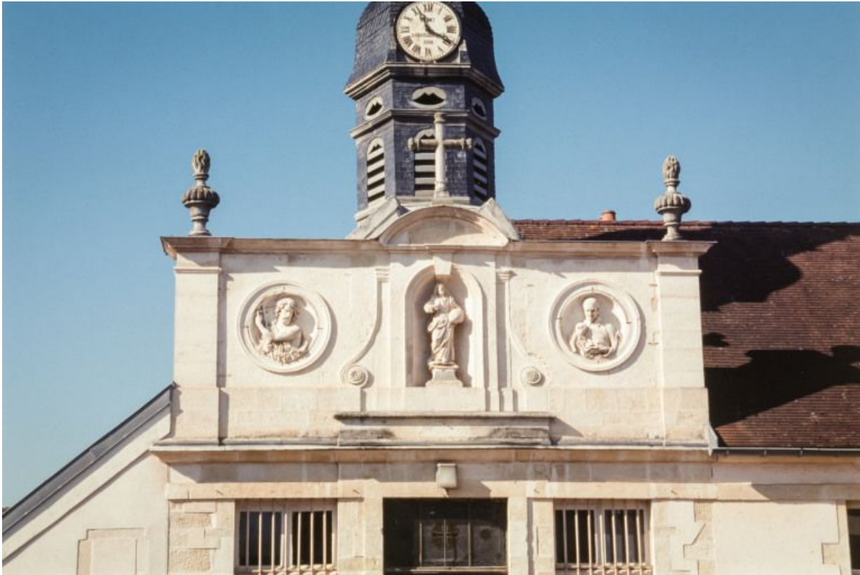
Façade de la chapelle : détail du décor sculpté (Salvator mundi, saint Jean-Baptiste, saint Vincent de Paul). 21, Moutiers-Saint-Jean, 8 place de l' Hôpital