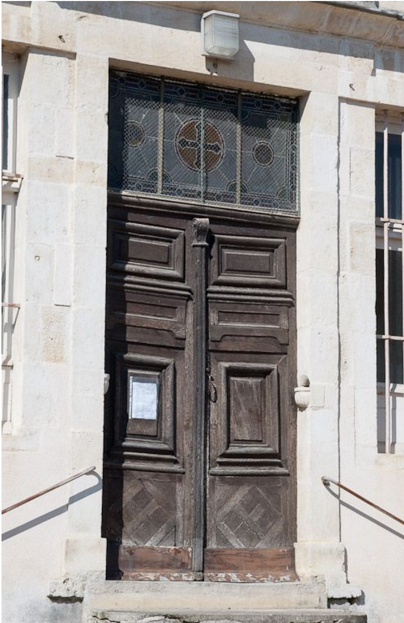
Façade sur rue : détail (porte d'entrée de l'ancienne salle des hommes devenue chapelle). 21, Moutiers-Saint-Jean, 8 place de l' Hôpital