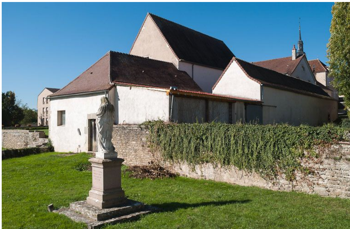
Vue d'ensemble : ancien bâtiment du pressoir, ancien bûcher transformé en "salle d'asile" et hangar (vue prise de l'est). 21, Moutiers-Saint-Jean, 8 place de l' Hôpital