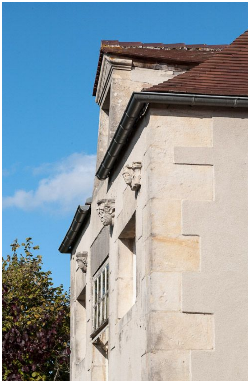
Corps de bâtiment principal : façade postérieure, sculptures en remploi (vue d'ensemble). 21, Moutiers-Saint-Jean, 8 place de l' Hôpital