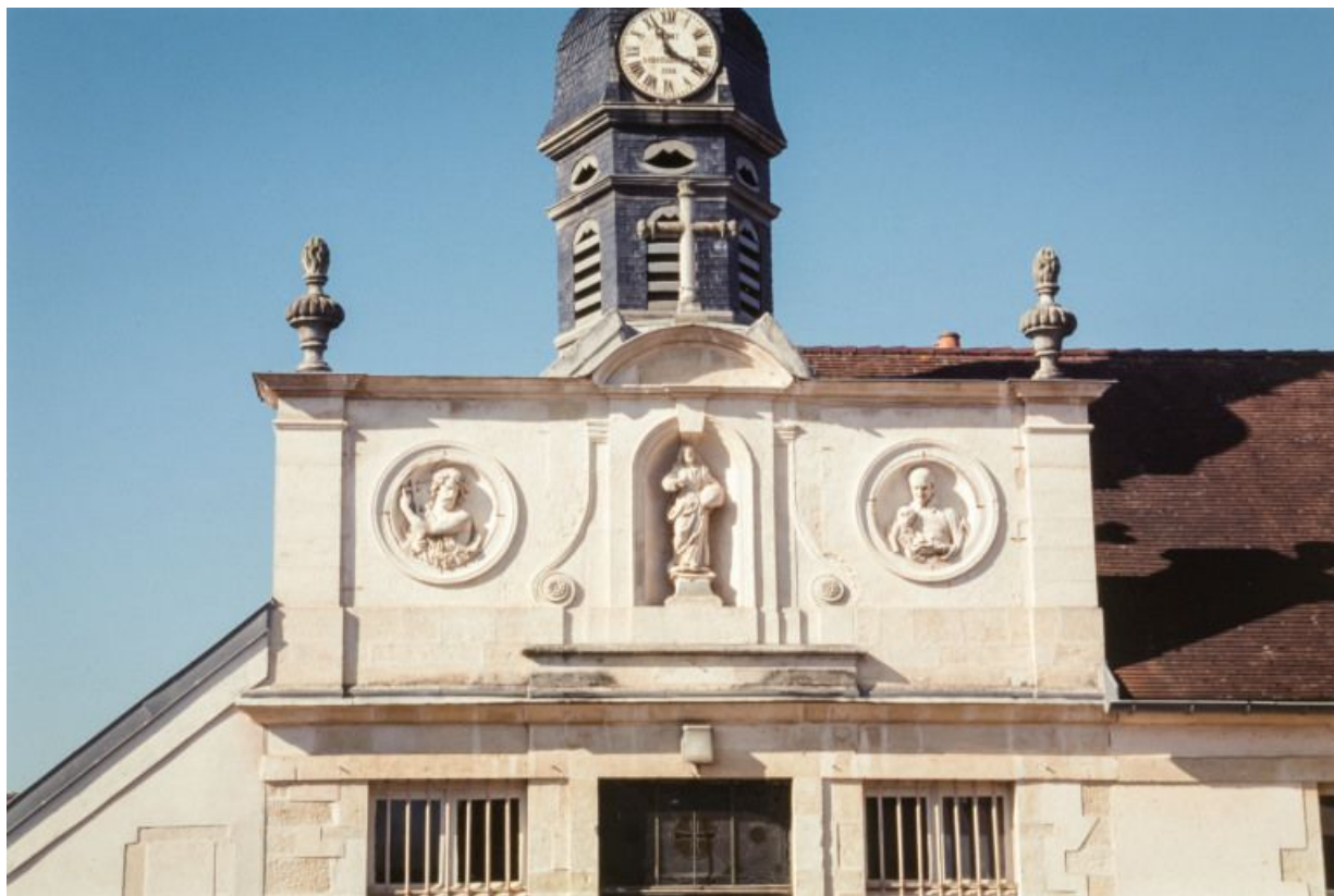
Façade de la chapelle : détail du décor sculpté (Salvator mundi, saint Jean-Baptiste, saint Vincent de Paul). 21, Moutiers-Saint-Jean, 8 place de l' Hôpital