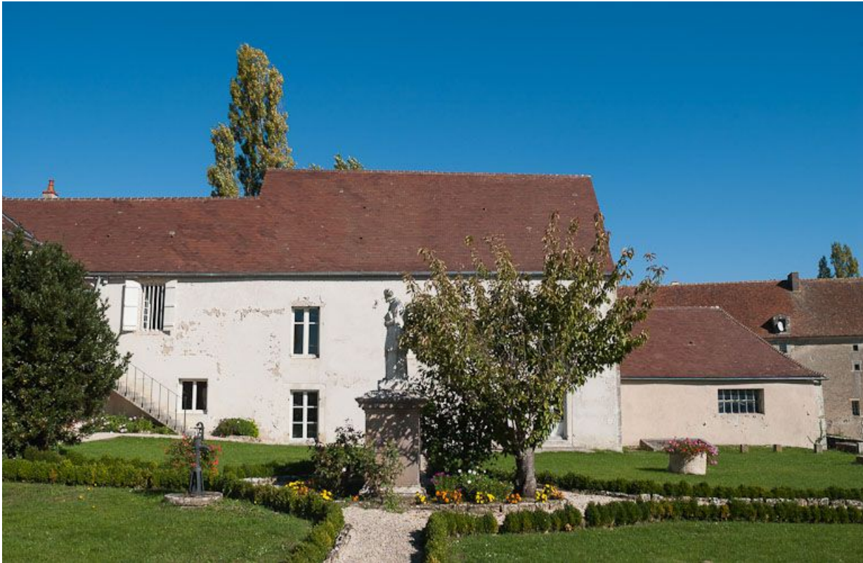
Jardin et vue partielle du bâtiment de l'apothicaire, de l'ancienne "salle d'asile" et de l'ancien pressoir.

21, Moutiers-Saint-Jean, 8 place de l' Hôpital