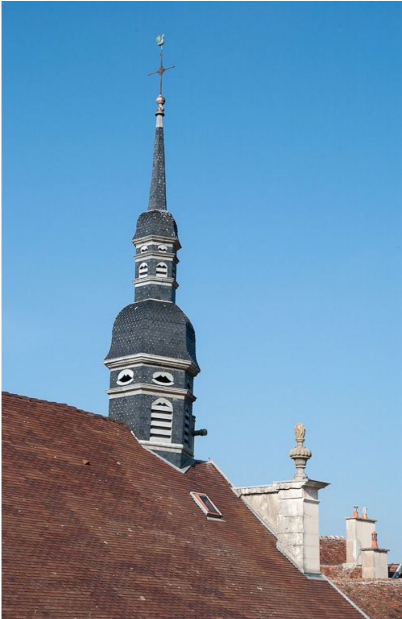
Clocher vu depuis la cour principale.

21, Moutiers-Saint-Jean, 8 place de l' Hôpital