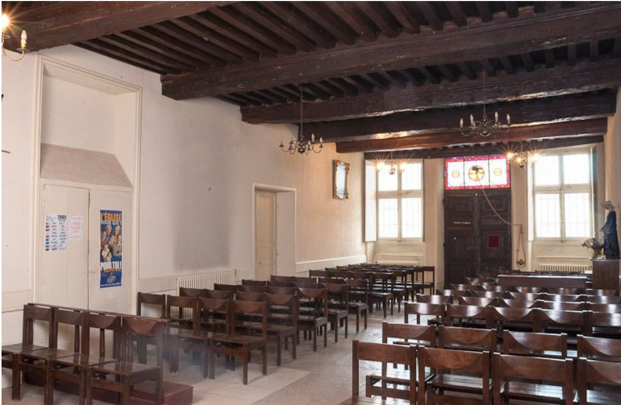
Corps de bâtiment principal : salle des hommes devenue chapelle (vue depuis le chœur).

21, Moutiers-Saint-Jean, 8 place de l' Hôpital