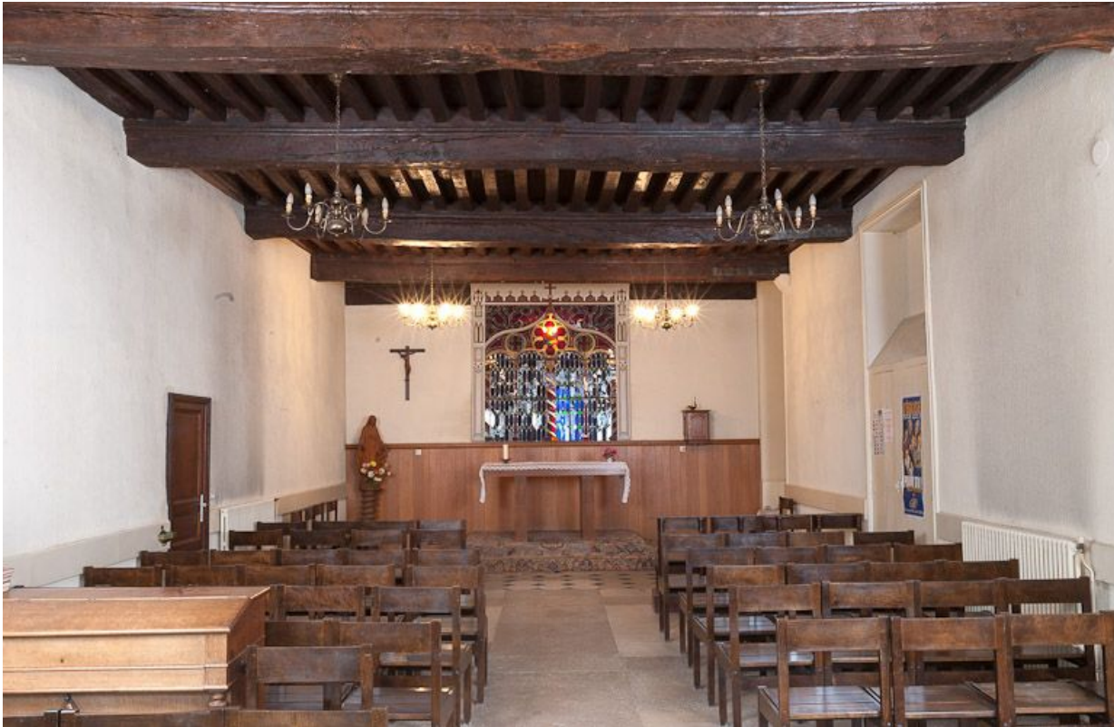
Corps de bâtiment principal : salle des hommes devenue chapelle (vue depuis l'entrée).

21, Moutiers-Saint-Jean, 8 place de l' Hôpital