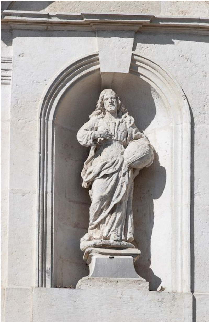
Façade sur rue : détail (statue : Salvator mundi).

21, Moutiers-Saint-Jean, 8 place de l' Hôpital