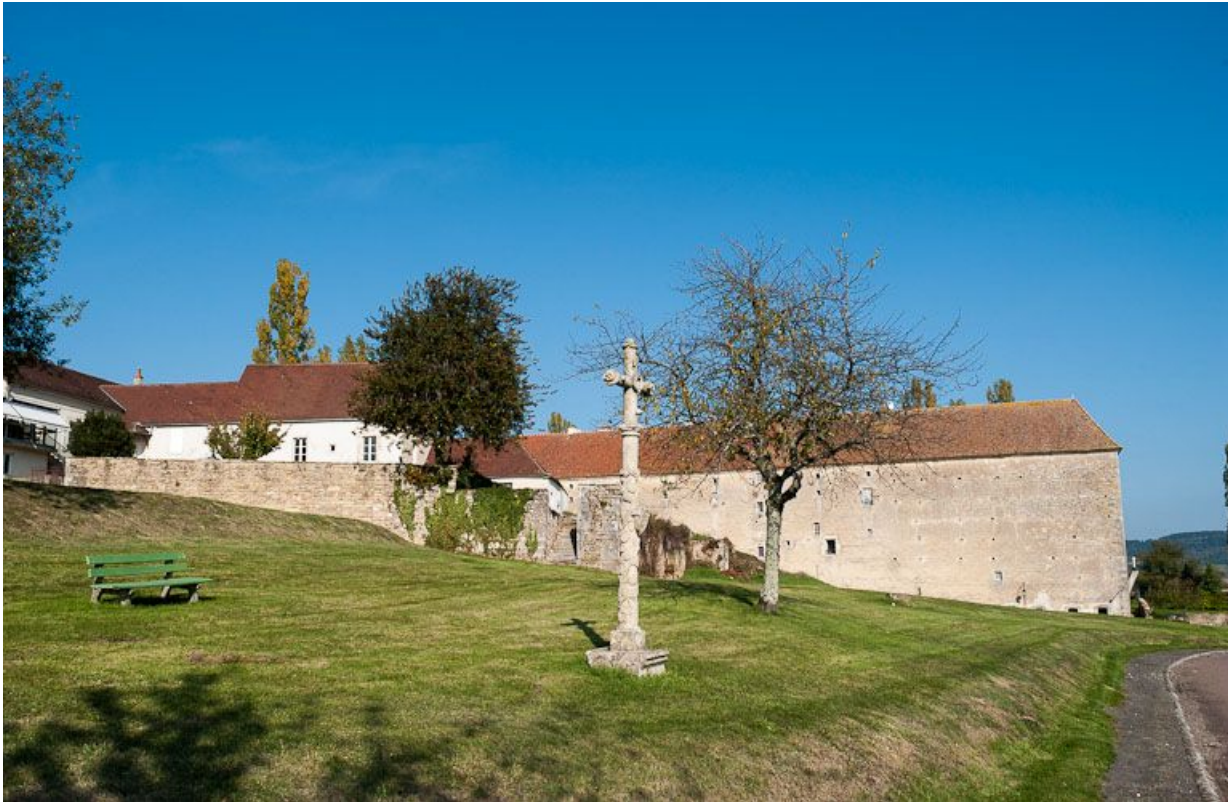
Vue d'ensemble du jardin, en contrebas au sud des bâtiments de l'hôpital.

21, Moutiers-Saint-Jean, 8 place de l' Hôpital