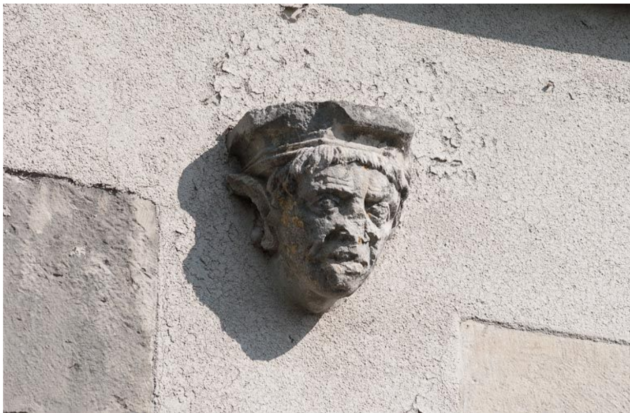
Corps de bâtiment principal : façade postérieure, sculpture en relief.

21, Moutiers-Saint-Jean, 8 place de l' Hôpital