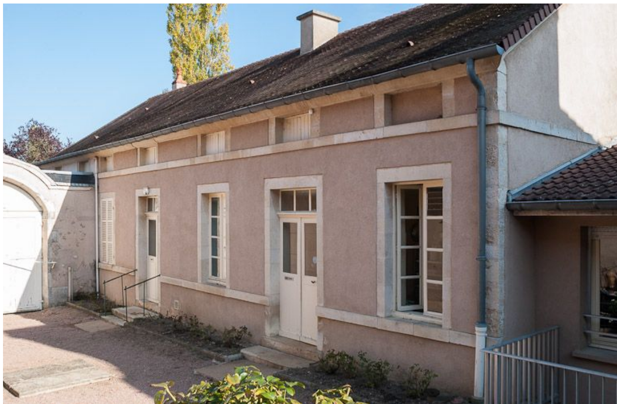
Corps de bâtiment à gauche de la cour principale : élévation sur cour.

21, Moutiers-Saint-Jean, 8 place de l' Hôpital