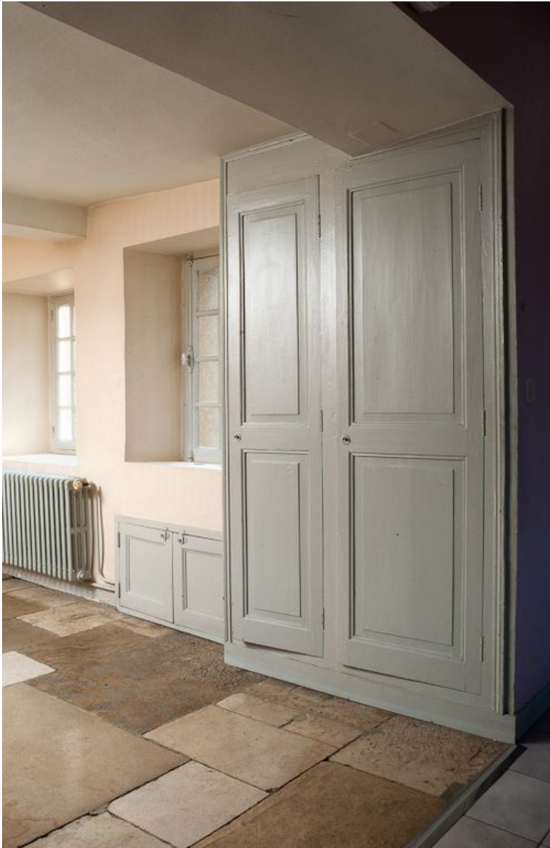
Corps de bâtiment principal : troisième pièce latérale gauche.

21, Moutiers-Saint-Jean, 8 place de l' Hôpital