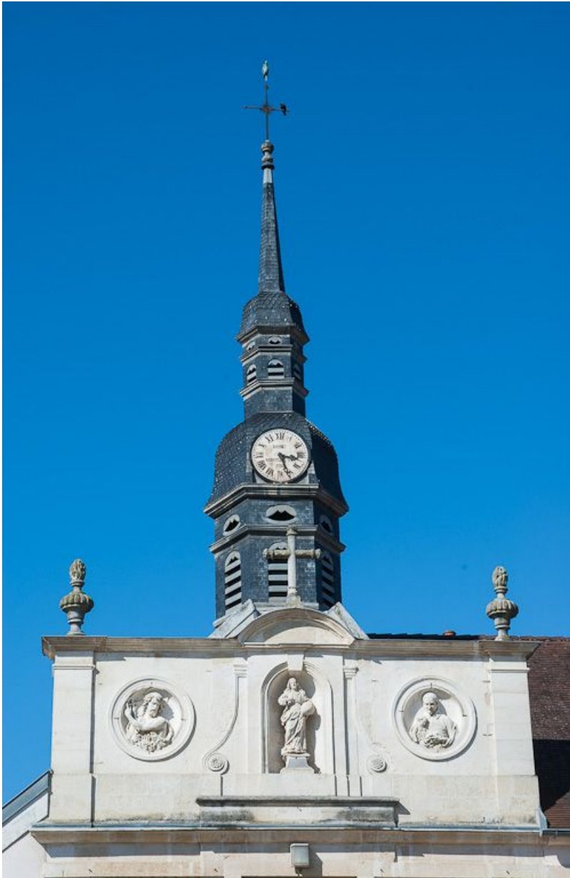
Façade sur rue : détail (clocher et attique de l'ancienne salle des hommes devenue chapelle). 21, Moutiers-Saint-Jean, 8 place de l' Hôpital