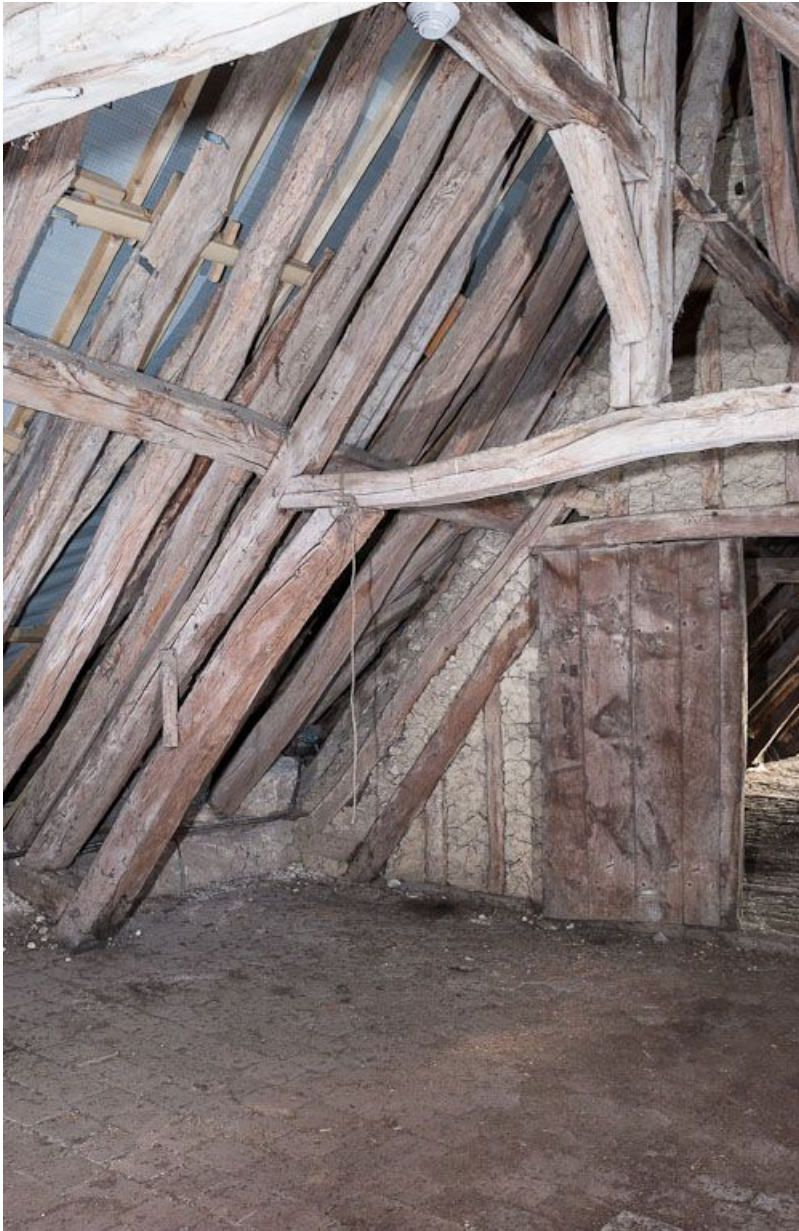
Corps de bâtiment principal : charpente (au-dessus de l'ancienne salle des femmes).

21, Moutiers-Saint-Jean, 8 place de l' Hôpital