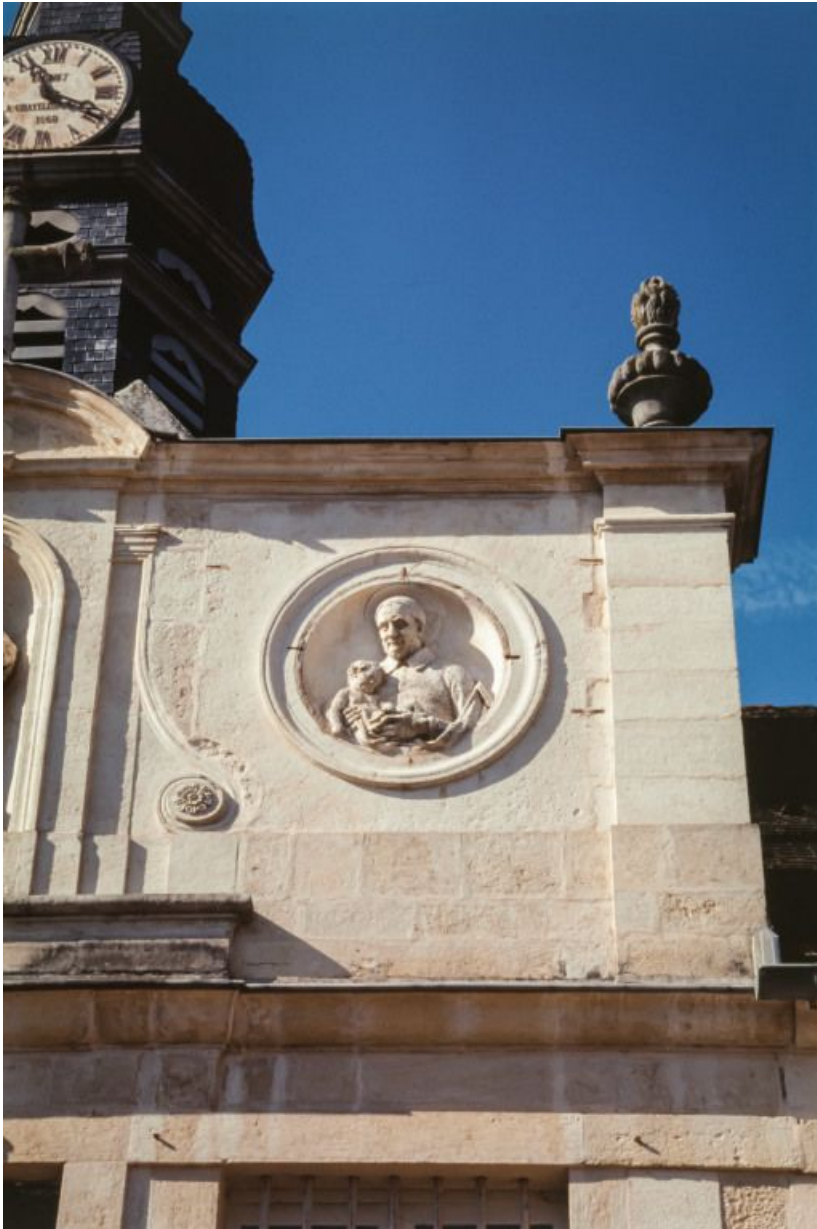
Détail de la façade de la chapelle : saint Vincent de Paul.

21, Moutiers-Saint-Jean, 8 place de l' Hôpital