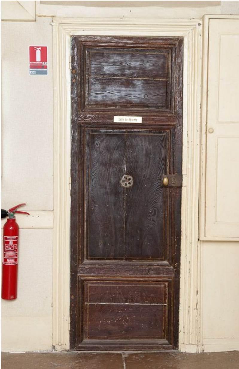
Corps de bâtiment principal : porte de l'extrémité ouest du couloir transversal. 21, Moutiers-Saint-Jean, 8 place de l' Hôpital