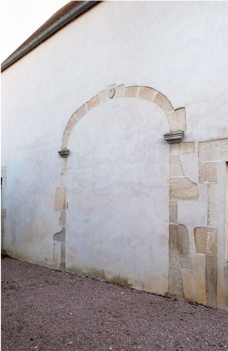
Ancien bûcher transformé en "salle d'asile" : porte charretière murée.

21, Moutiers-Saint-Jean, 8 place de l' Hôpital