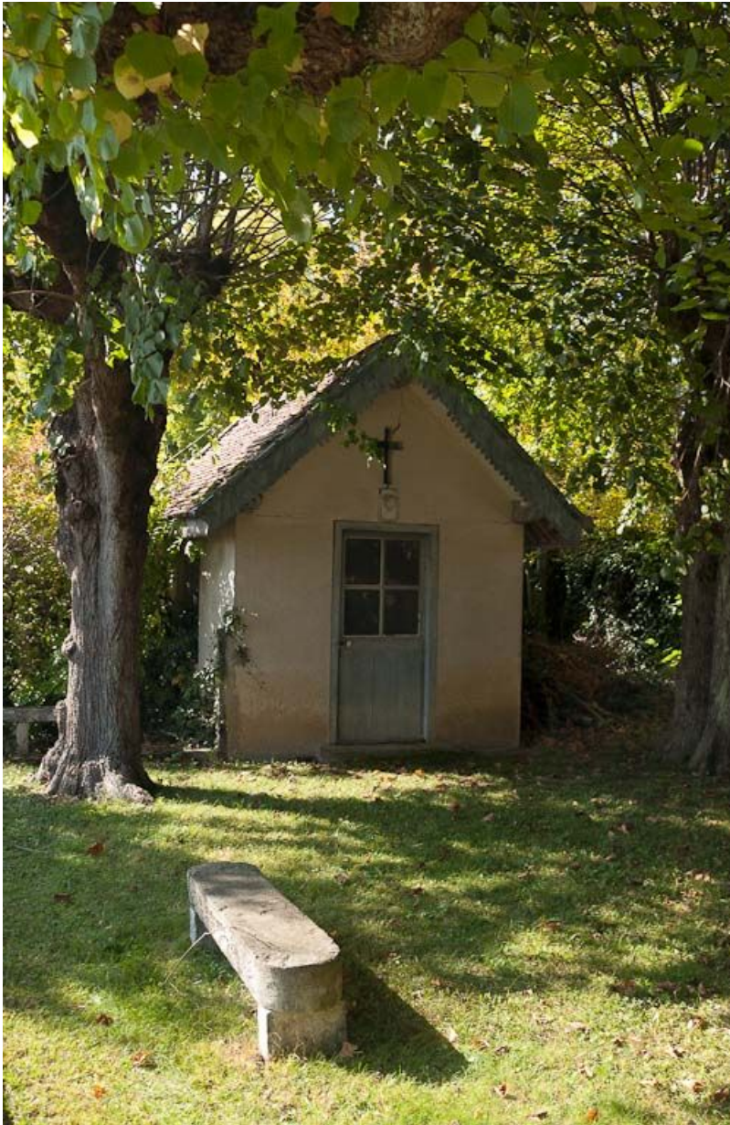
Ancienne chapelle des morts (à l'ouest du jardin).

21, Moutiers-Saint-Jean, 8 place de l' Hôpital