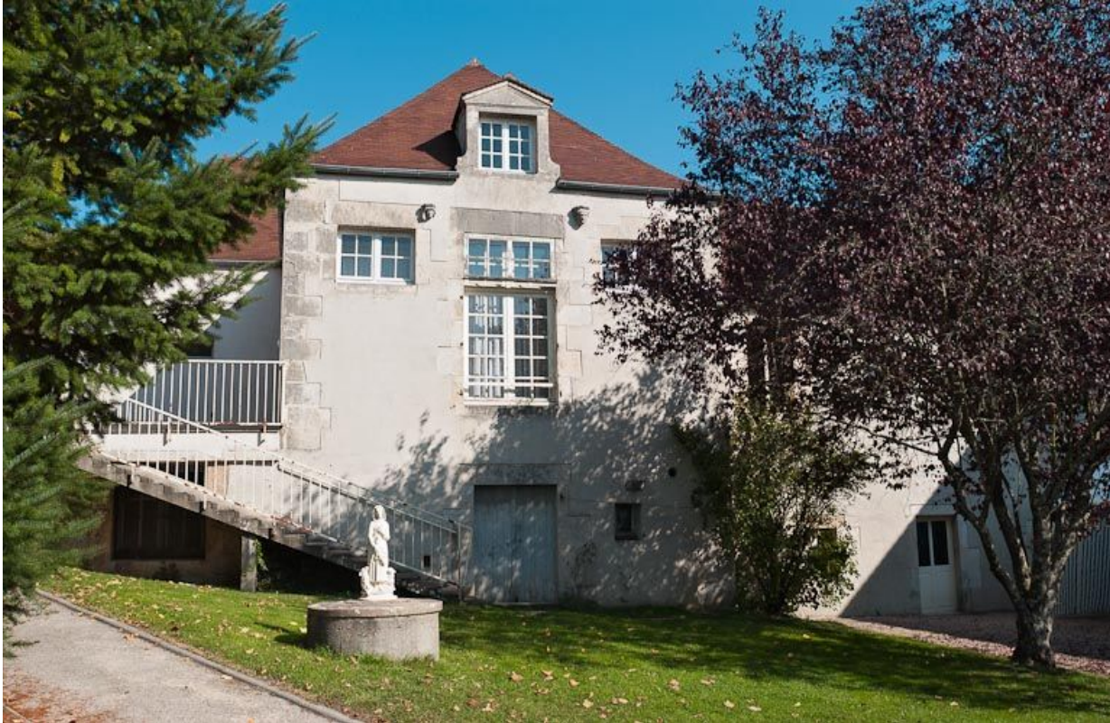
Façade de l'ancienne salle des femmes, sur le jardin.

21, Moutiers-Saint-Jean, 8 place de l' Hôpital