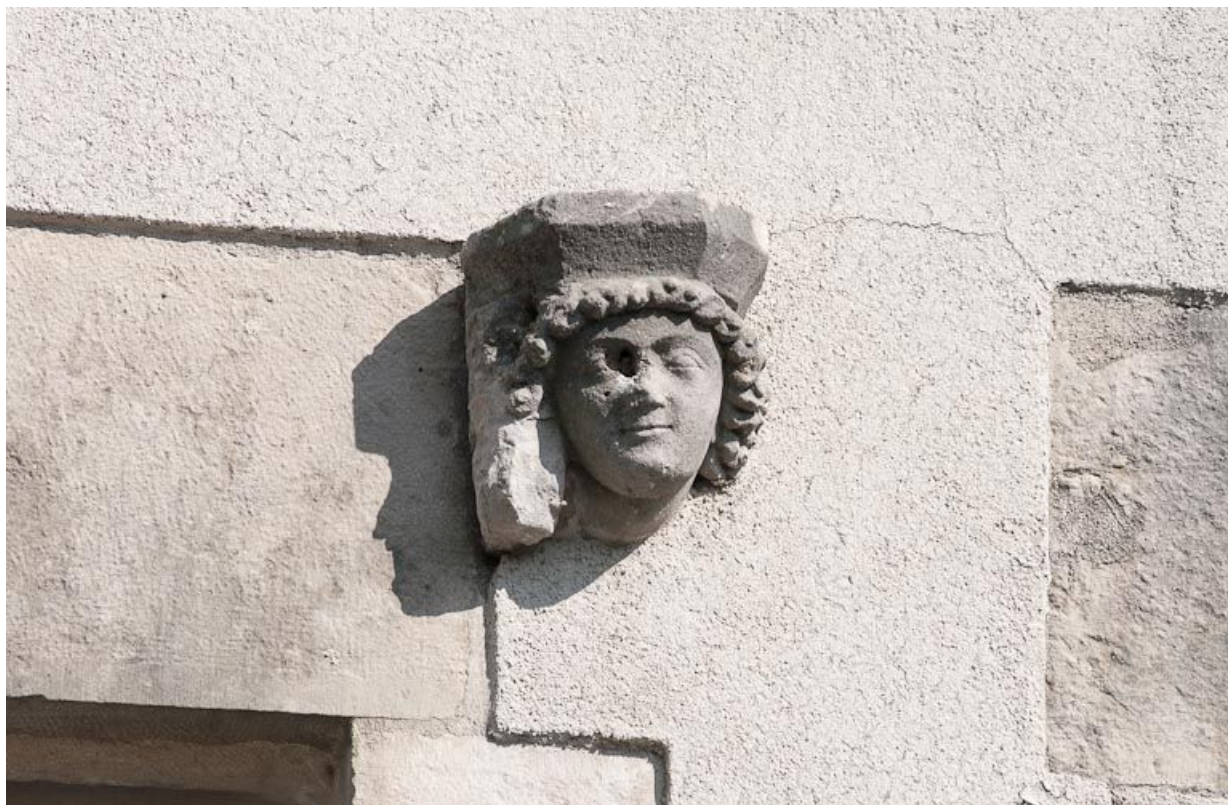
Corps de bâtiment principal : façade postérieure, sculpture en remploi.

21, Moutiers-Saint-Jean, 8 place de l' Hôpital