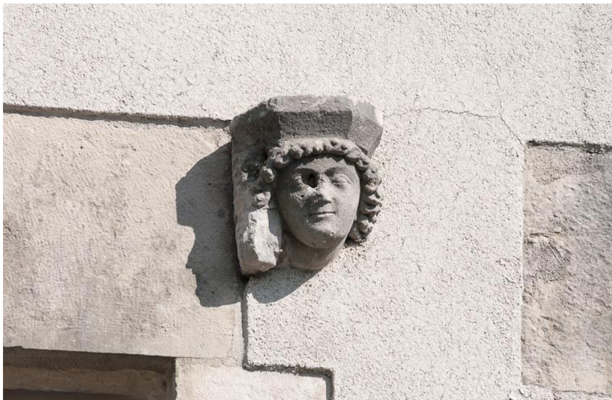
Corps de bâtiment principal : façade postérieure, sculpture en remploi.

21, Moutiers-Saint-Jean, 8 place de l' Hôpital