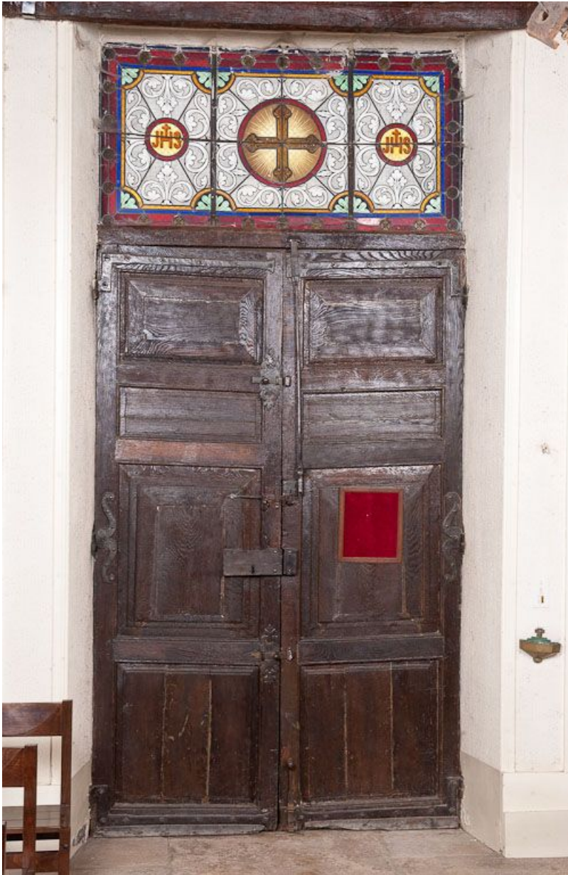
Corps de bâtiment principal : salle des hommes devenue chapelle, porte d'entrée principale.

21, Moutiers-Saint-Jean, 8 place de l' Hôpital