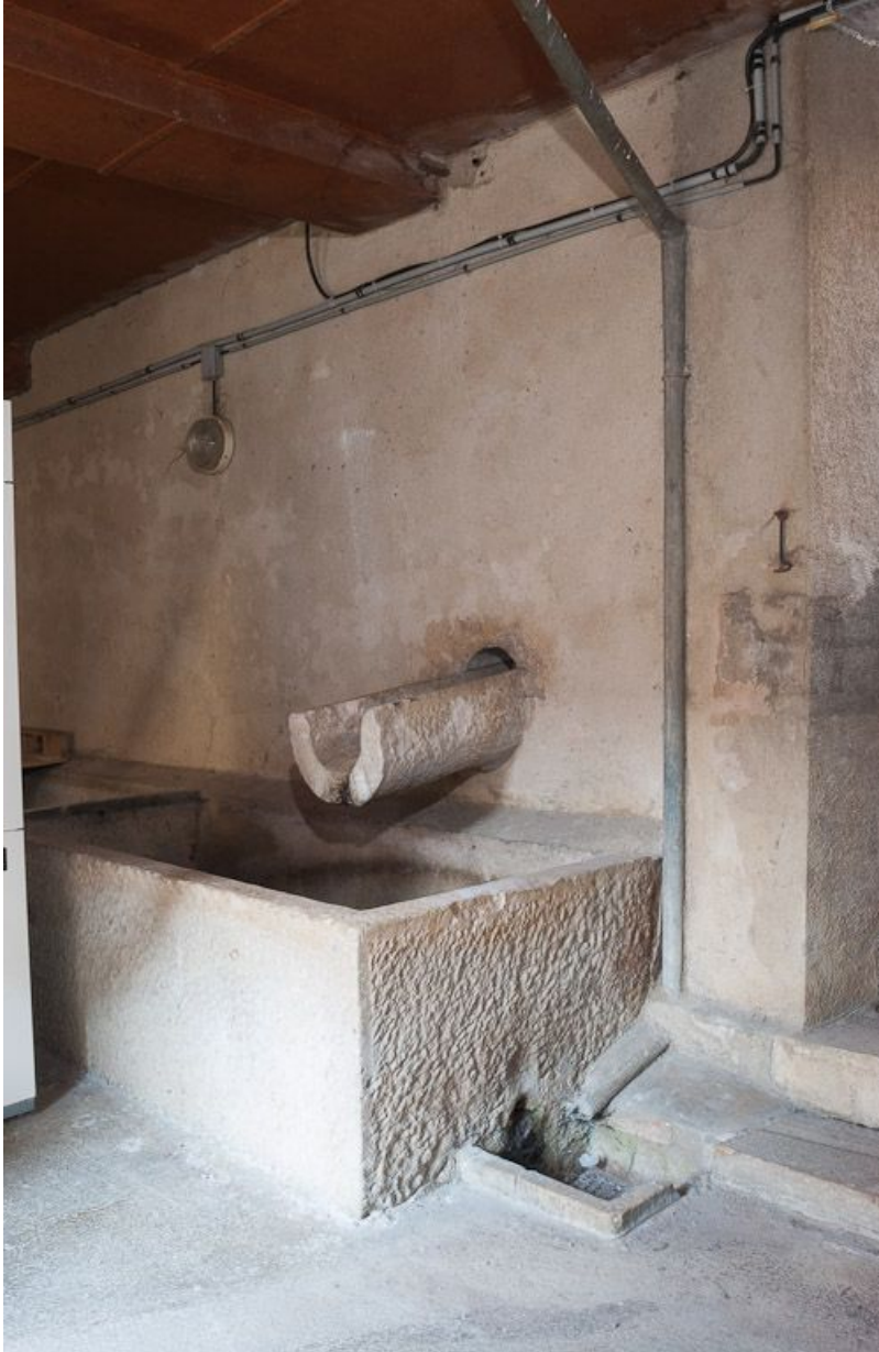
Corps de bâtiment transversal : buanderie à l'étage de soubassement.

21, Moutiers-Saint-Jean, 8 place de l' Hôpital