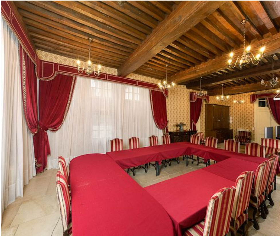
Corps de bâtiment principal : salle des femmes (aujourd'hui salle de réunion). 21, Moutiers-Saint-Jean, 8 place de l' Hôpital