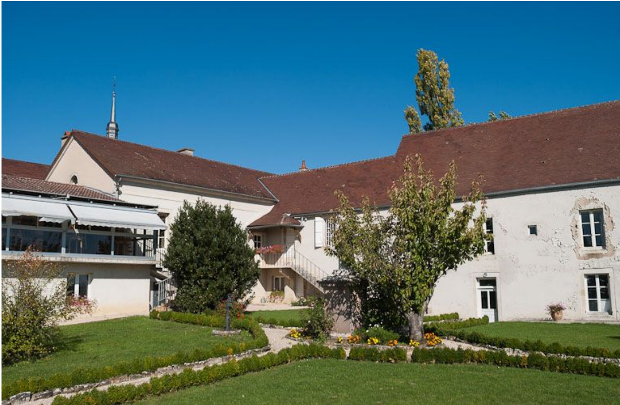
Vue d'ensemble des bâtiments (angle nord du jardin).

21, Moutiers-Saint-Jean, 8 place de l' Hôpital