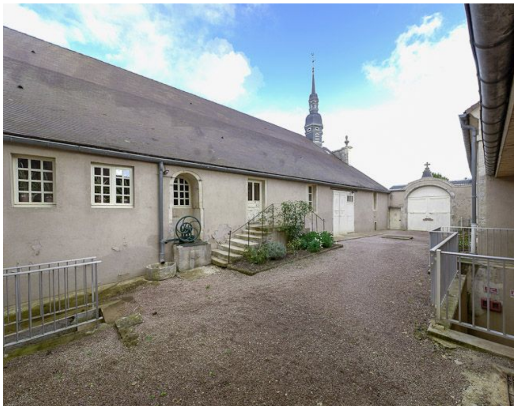
Cour principale : élévation gauche du bâtiment principal.

21, Moutiers-Saint-Jean, 8 place de l' Hôpital