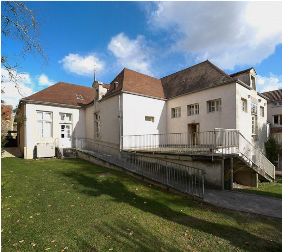
Corps de bâtiment principal : vue d'ensemble, côté jardin, prise depuis l'ouest. 21, Moutiers-Saint-Jean, 8 place de l' Hôpital