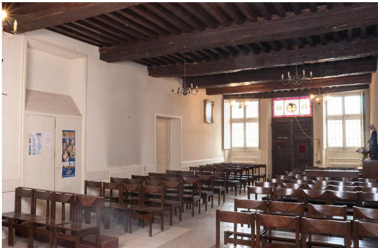
Corps de bâtiment principal : salle des hommes devenue chapelle (vue depuis le chœur). 21, Moutiers-Saint-Jean, 8 place de l' Hôpital