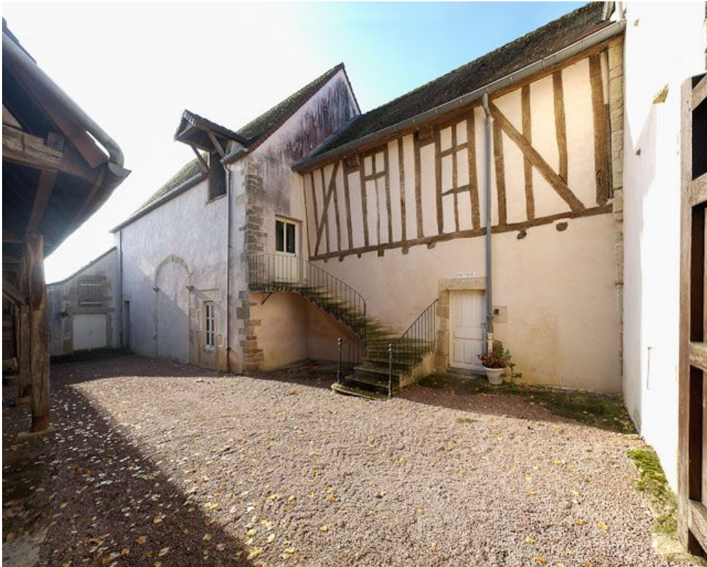
Cour latérale gauche : élévation nord du bâtiment de l'apothicairerie et de l'ancien bûcher transformé en "salle d'asile". 21, Moutiers-Saint-Jean, 8 place de l' Hôpital