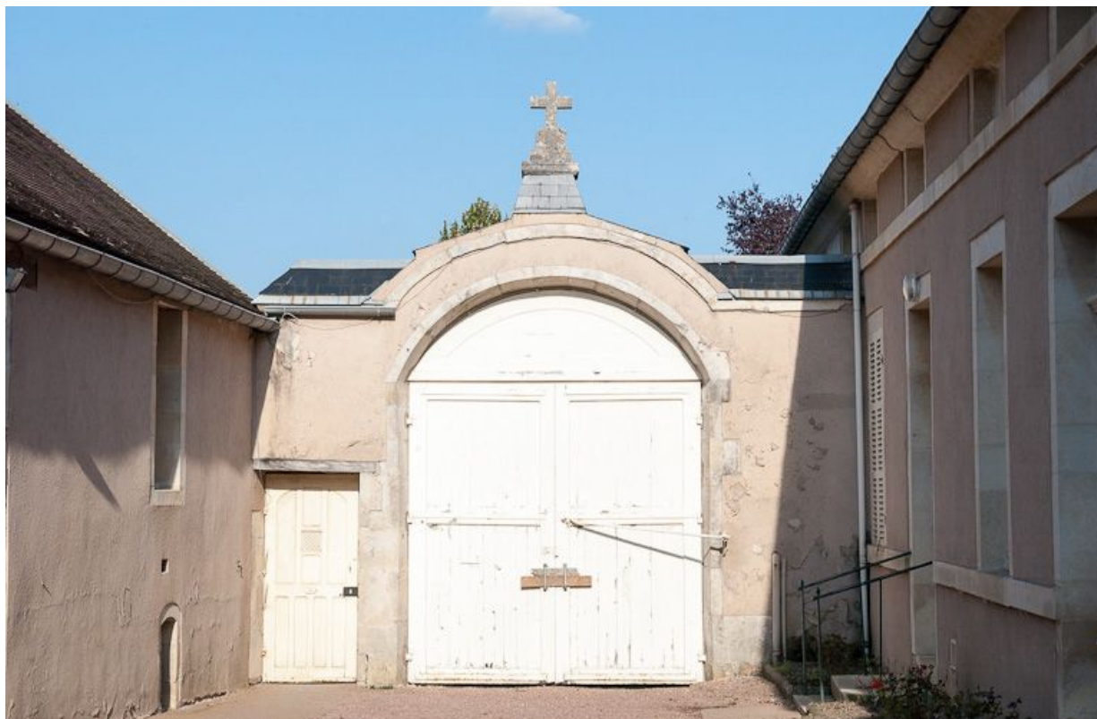
Cour principale : portail à porte cochère et porte piétonne (vue prise depuis la cour).

21, Moutiers-Saint-Jean, 8 place de l' Hôpital