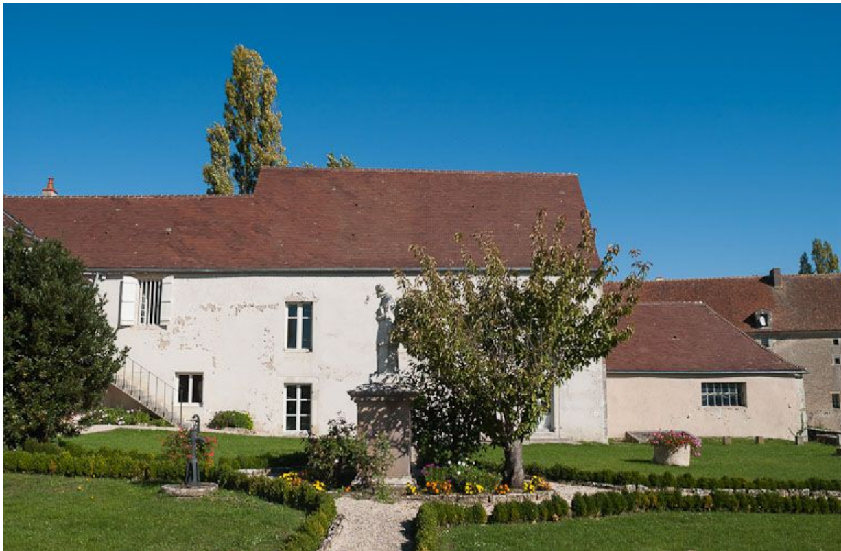
Jardin et vue partielle du bâtiment de l'apothicairerie, de l'ancienne "salle d'asile" et de l'ancien pressoir. 21, Moutiers-Saint-Jean, 8 place de l' Hôpital