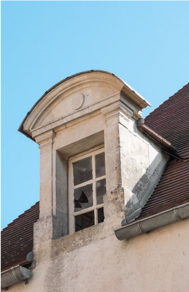
Corps de bâtiment principal : lucarne (élévation latérale ouest).

21, Moutiers-Saint-Jean, 8 place de l' Hôpital