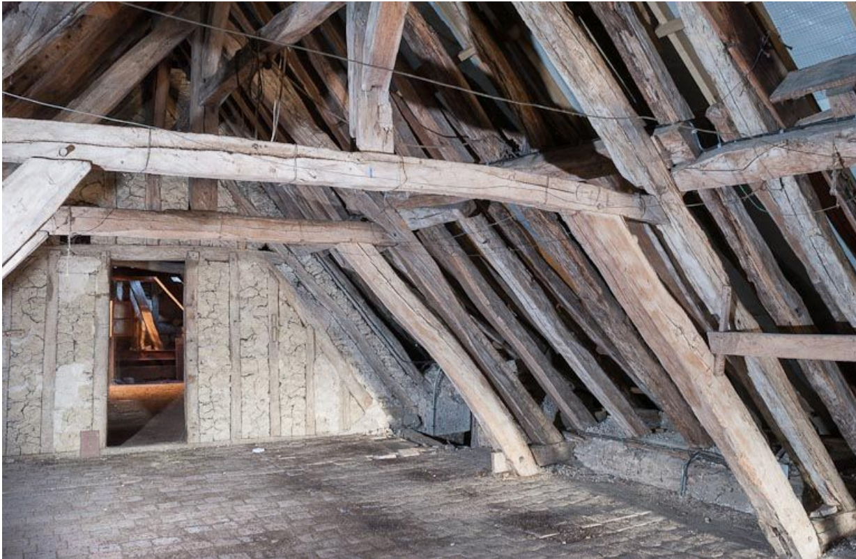
Corps de bâtiment principal : charpente (au-dessus de l'ancienne salle des femmes).

21, Moutiers-Saint-Jean, 8 place de l' Hôpital