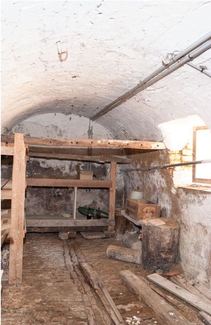
Corps de bâtiment principal : cave située sous l'angle antérieur gauche du bâtiment. 21, Moutiers-Saint-Jean, 8 place de l' Hôpital