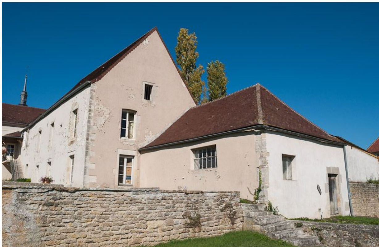
Ancien bûcher transformé en "salle d'asile" et ancien bâtiment du pressoir.

21, Moutiers-Saint-Jean, 8 place de l' Hôpital