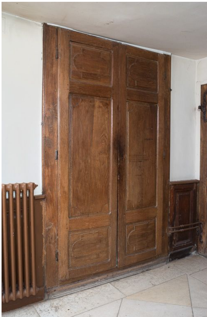
Corps de bâtiment principal : deuxième pièce latérale gauche, devenue sacristie (portes de placard mural). 21, Moutiers-Saint-Jean, 8 place de l' Hôpital