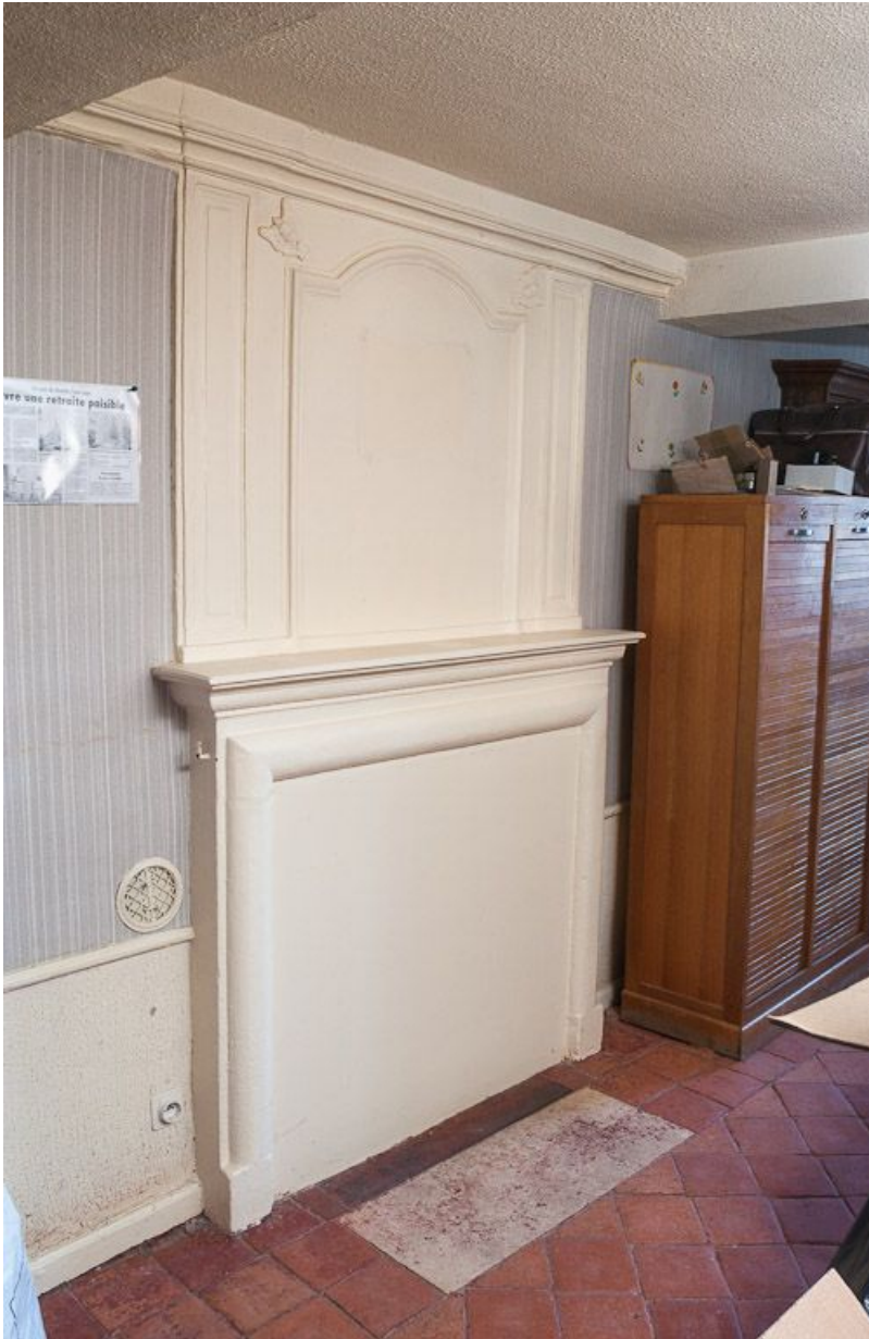
Corps de bâtiment principal : première pièce latérale gauche (détail : cheminée). 21, Moutiers-Saint-Jean, 8 place de l' Hôpital