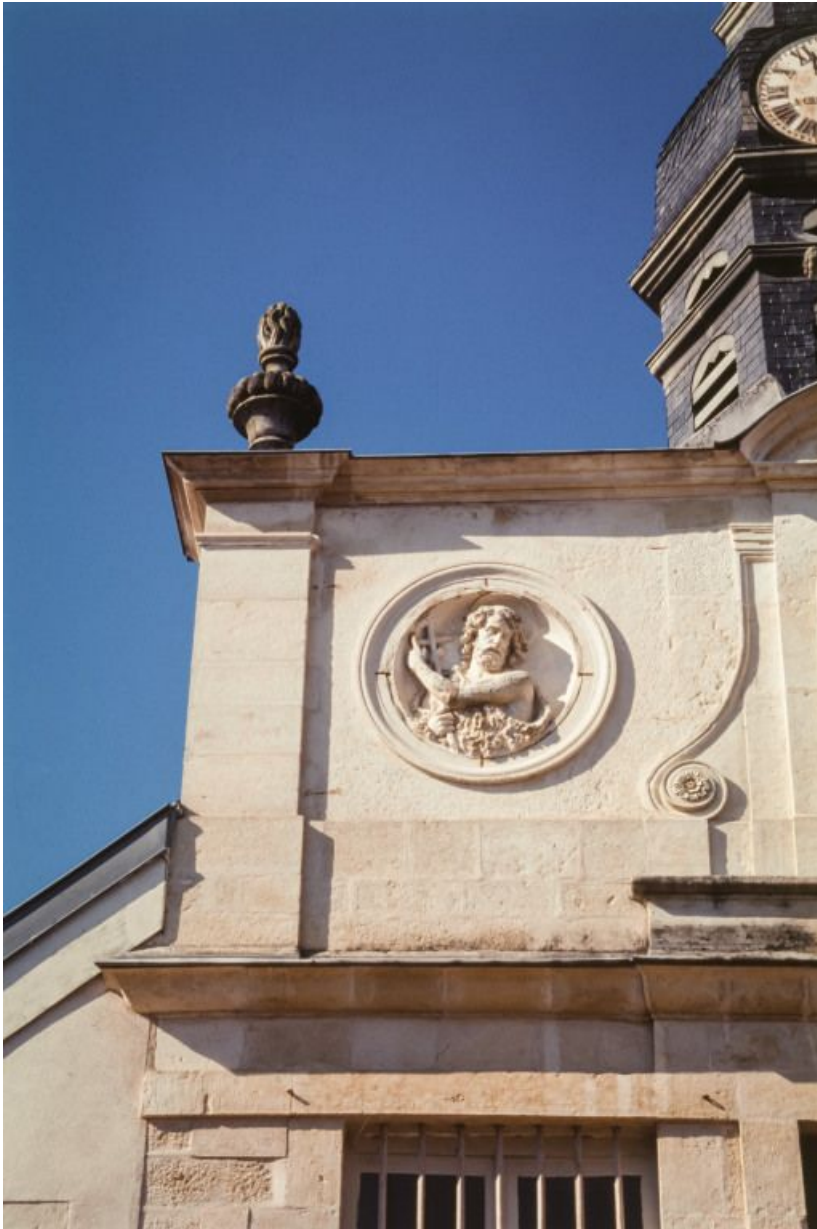
Détail de la façade de la chapelle : saint Jean-Baptiste.

21, Moutiers-Saint-Jean, 8 place de l' Hôpital