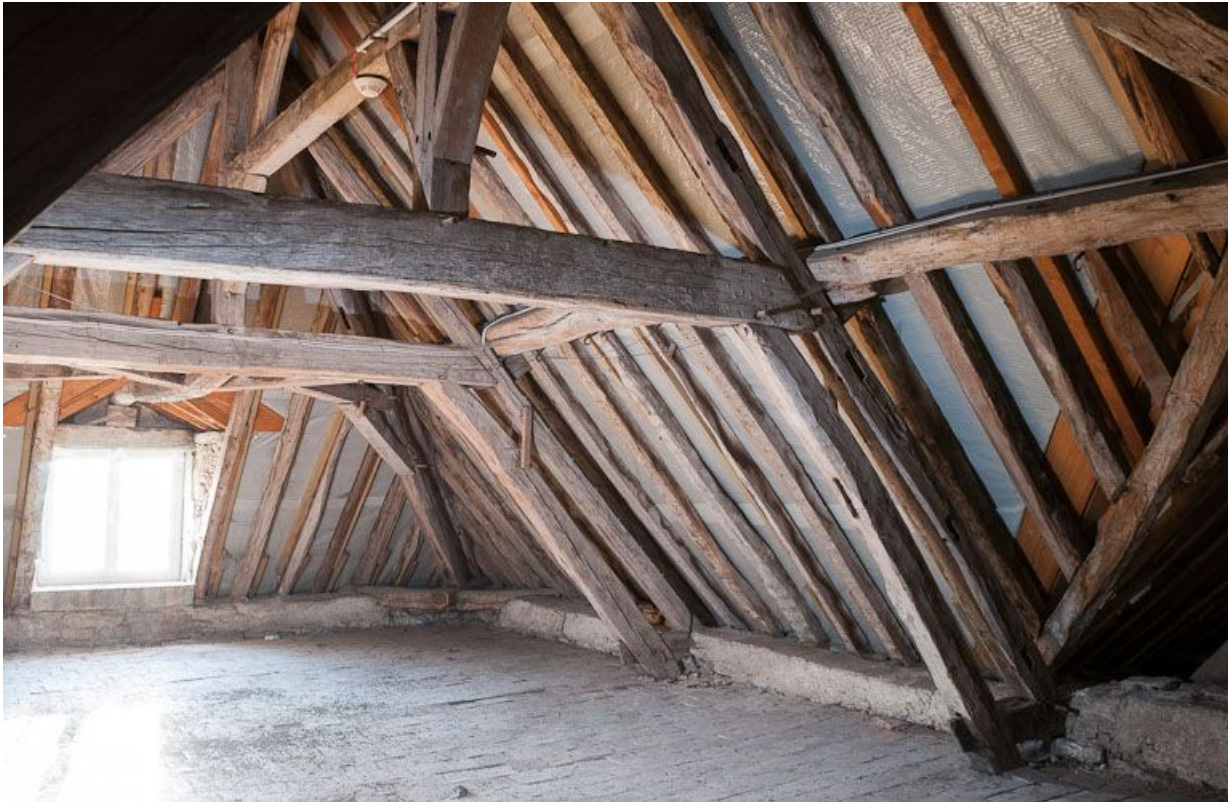
Corps de bâtiment principal : charpente (au-dessus de l'ancienne salle des femmes).

21, Moutiers-Saint-Jean, 8 place de l' Hôpital