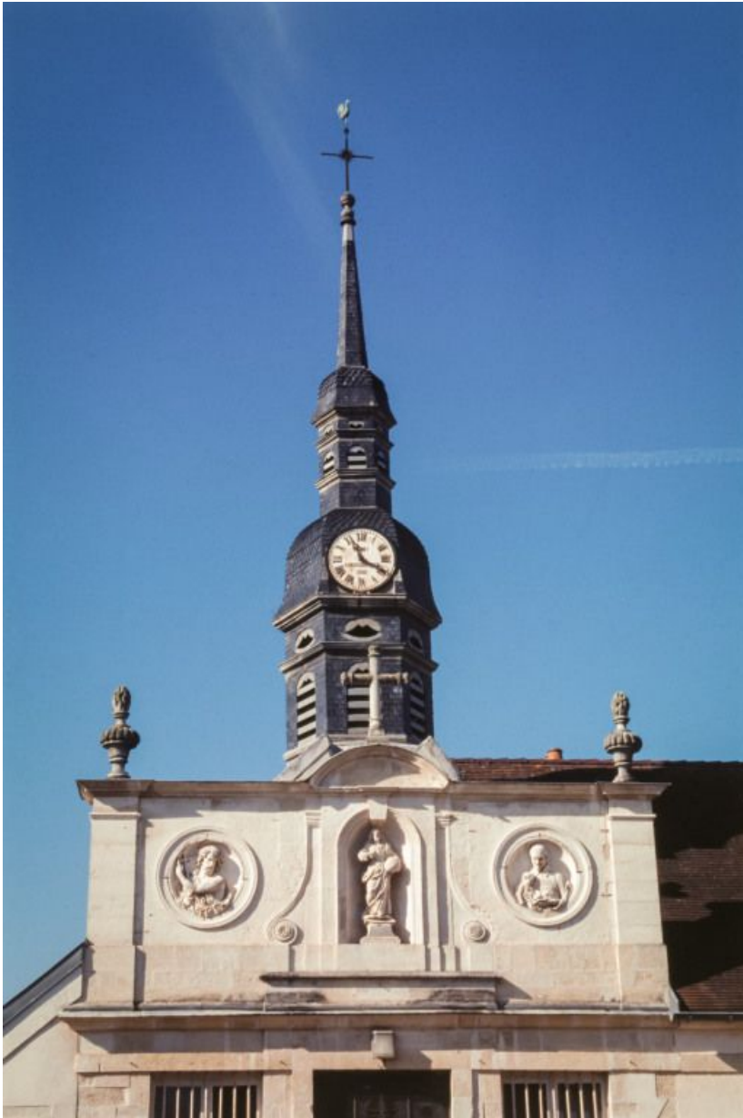
Façade de la chapelle : partie supérieure. 21, Moutiers-Saint-Jean, 8 place de l' Hôpital