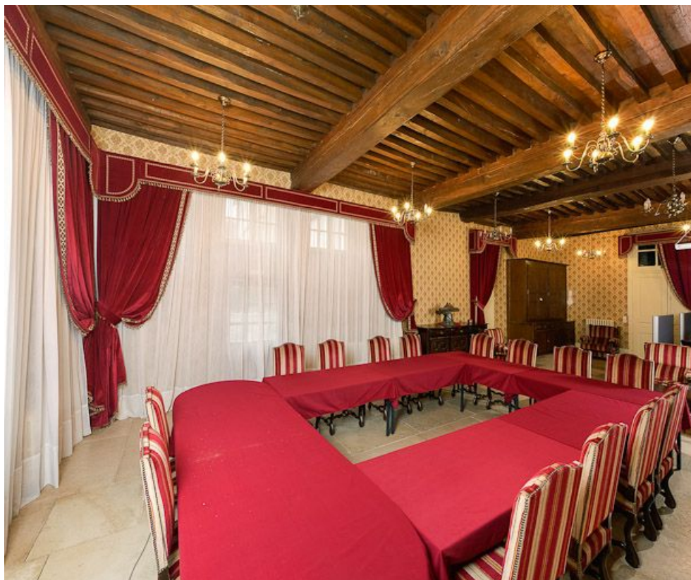
Corps de bâtiment principal : salle des femmes (aujourd'hui salle de réunion). 21, Moutiers-Saint-Jean, 8 place de l' Hôpital