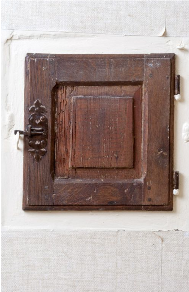
Corps de bâtiment principal : petite porte d'un placard mural du vestibule (mur nord). 21, Moutiers-Saint-Jean, 8 place de l' Hôpital