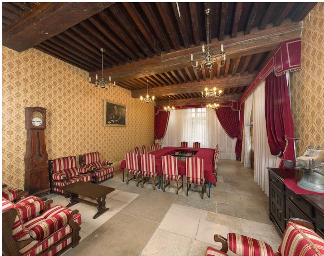
Corps de bâtiment principal : salle des femmes (aujourd'hui salle de réunion). 21, Moutiers-Saint-Jean, 8 place de l' Hôpital