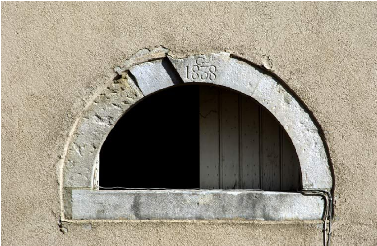
Corps de bâtiment à gauche de la cour principale : date gravée (mur pignon sud).

21, Moutiers-Saint-Jean, 8 place de l' Hôpital