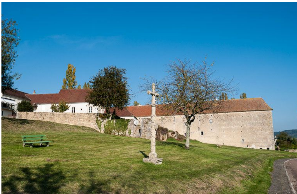
Vue d'ensemble du jardin, en contrebas au sud des bâtiments de l'hôpital.

21, Moutiers-Saint-Jean, 8 place de l' Hôpital