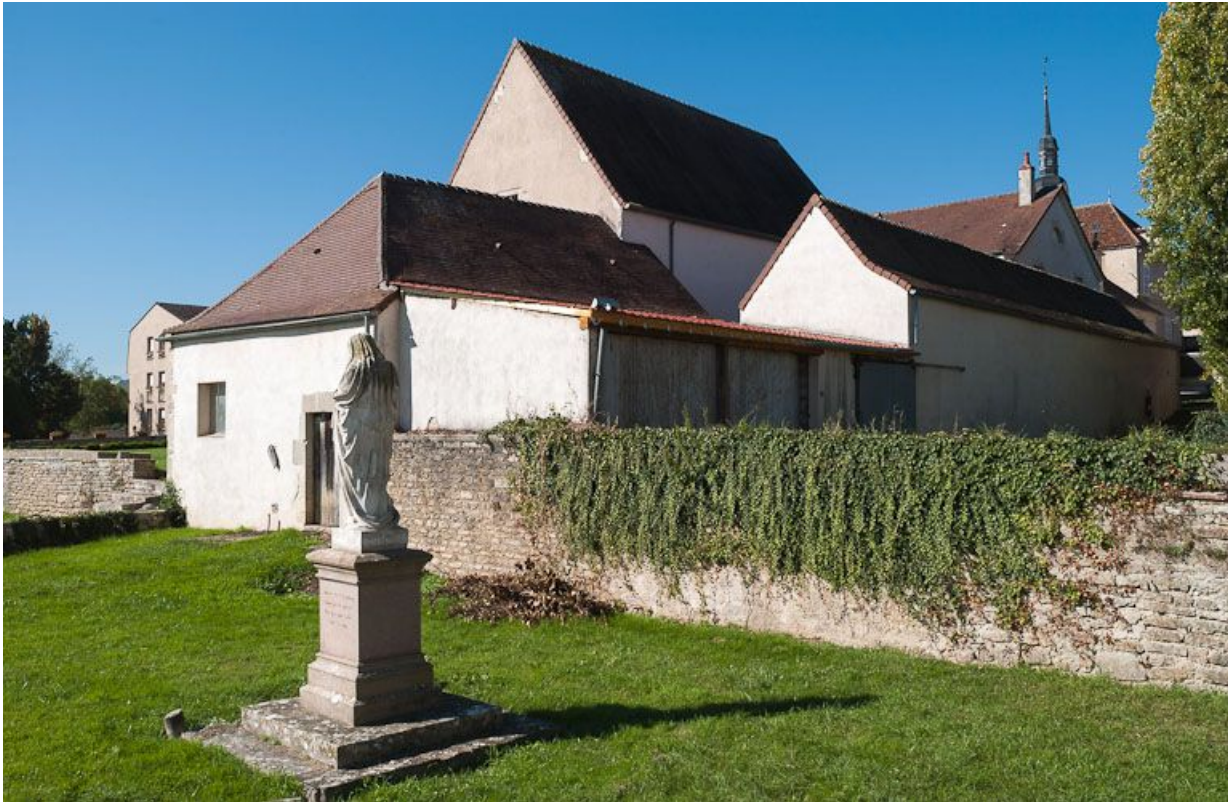
Vue d'ensemble : ancien bâtiment du pressoir, ancien bûcher transformé en "salle d'asile" et hangar (vue prise de l'est). 21, Moutiers-Saint-Jean, 8 place de l' Hôpital