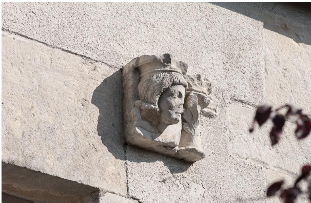
Corps de bâtiment principal : façade postérieure, sculpture en remploi.

21, Moutiers-Saint-Jean, 8 place de l' Hôpital