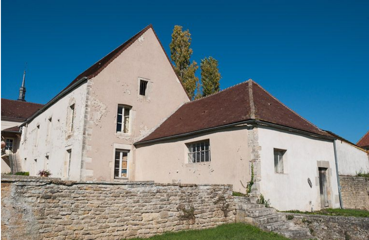
Ancien bûcher transformé en "salle d'asile" et ancien bâtiment du pressoir.

21, Moutiers-Saint-Jean, 8 place de l' Hôpital