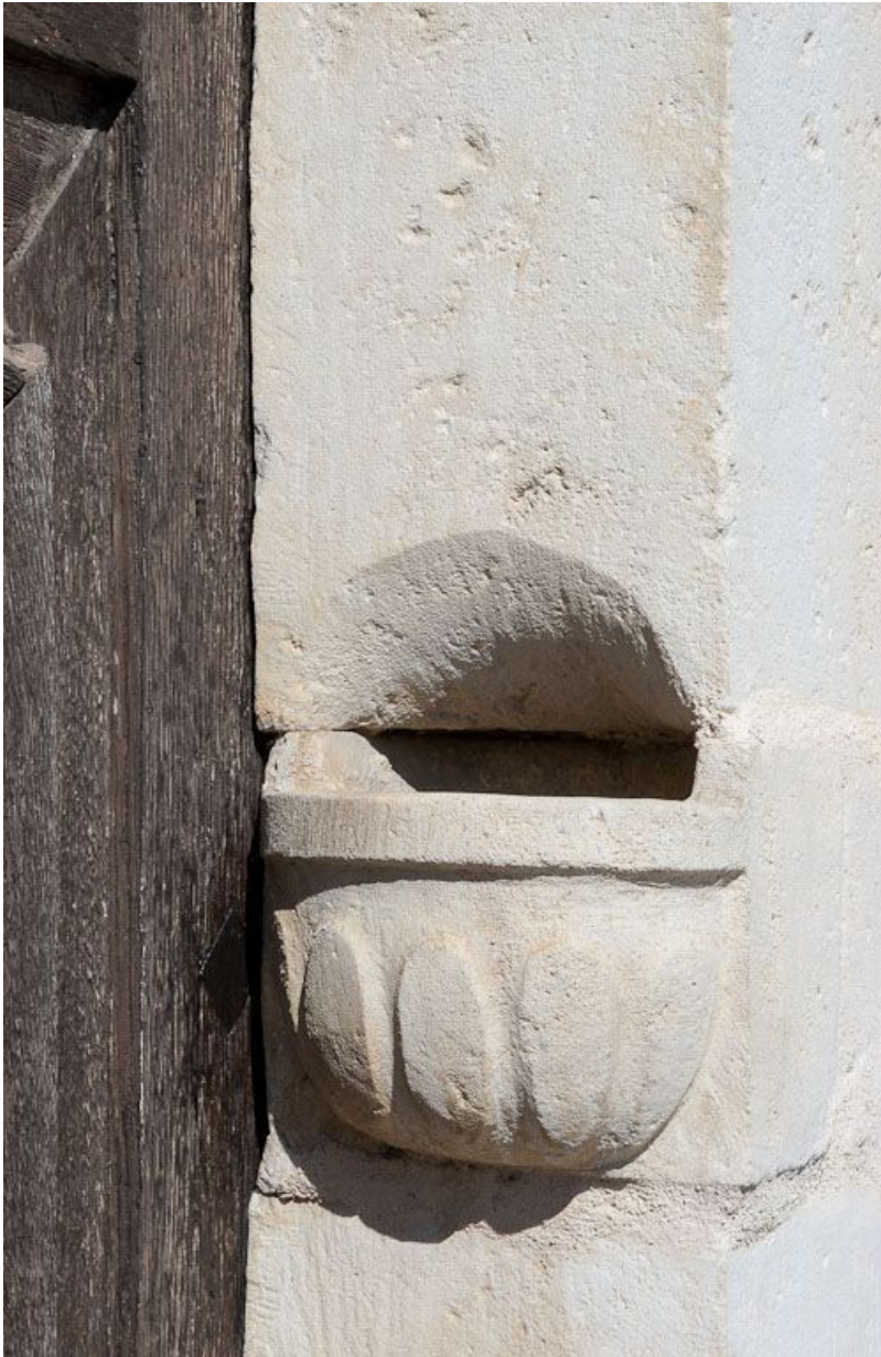
Façade sur rue : détail (bénitier).

21, Moutiers-Saint-Jean, 8 place de l' Hôpital