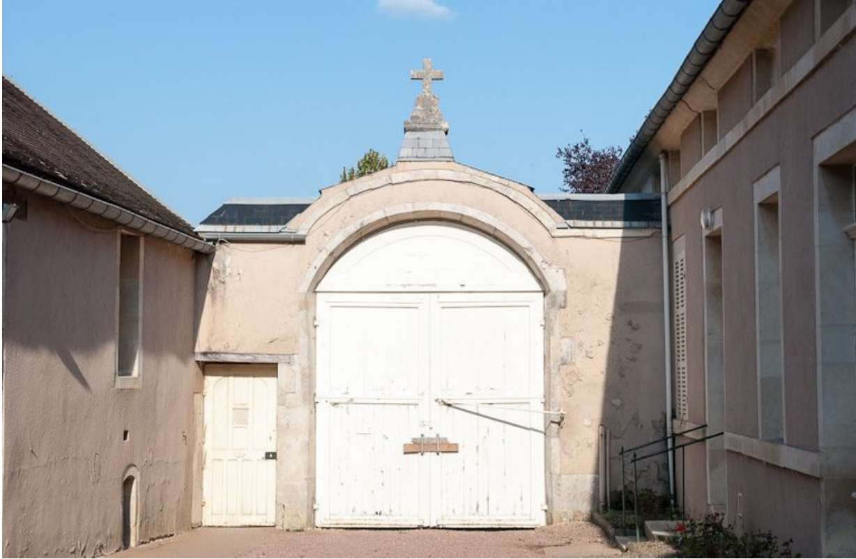
Cour principale : portail à porte cochère et porte piétonne (vue prise depuis la cour).

21, Moutiers-Saint-Jean, 8 place de l' Hôpital