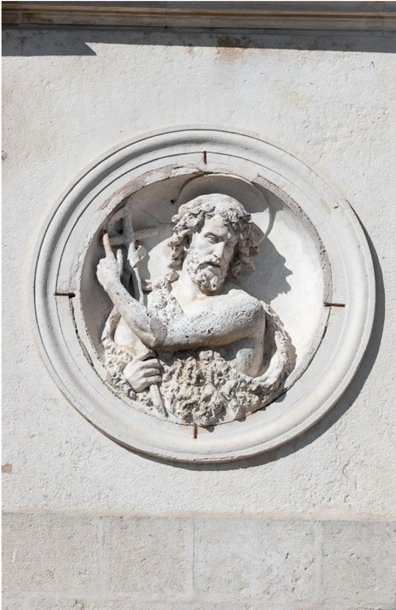
Façade sur rue : détail (haut-relief : saint Jean-Baptiste).

21, Moutiers-Saint-Jean, 8 place de l' Hôpital