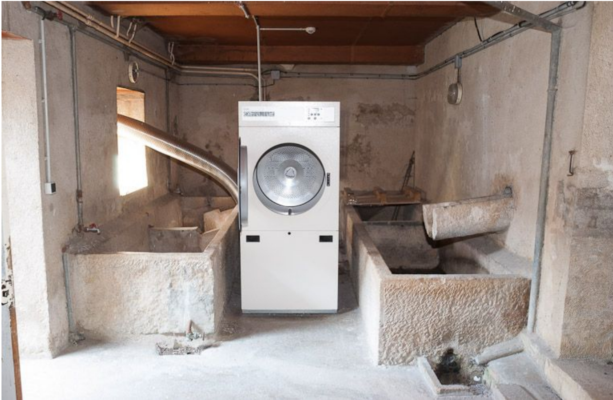
Corps de bâtiment transversal : buanderie à l'étage de soubassement.

21, Moutiers-Saint-Jean, 8 place de l' Hôpital