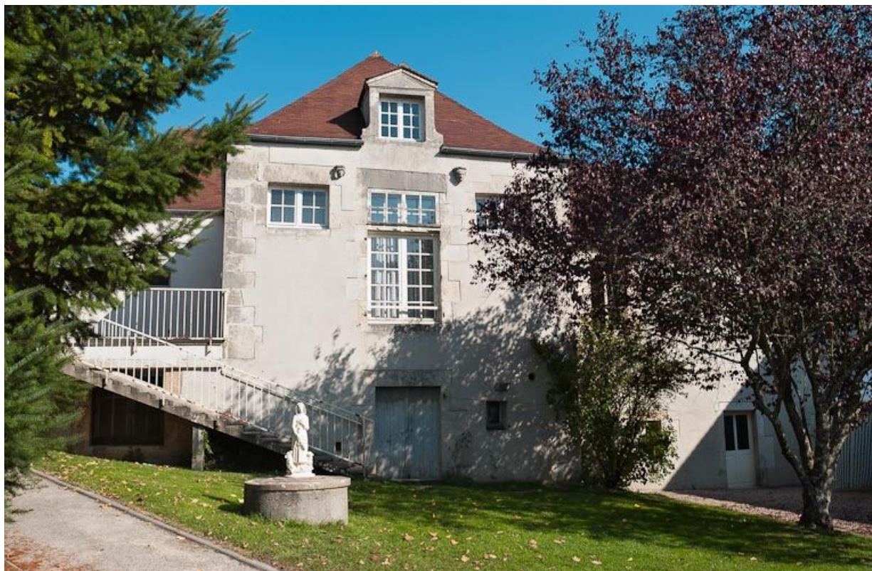
Façade de l'ancienne salle des femmes, sur le jardin.

21, Moutiers-Saint-Jean, 8 place de l' Hôpital