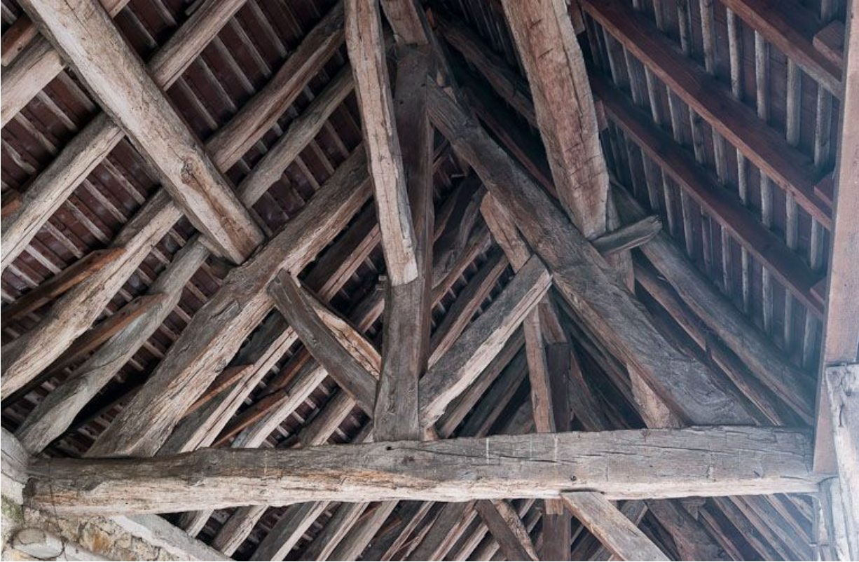
Cour latérale gauche : charpente du hangar.

21, Moutiers-Saint-Jean, 8 place de l' Hôpital