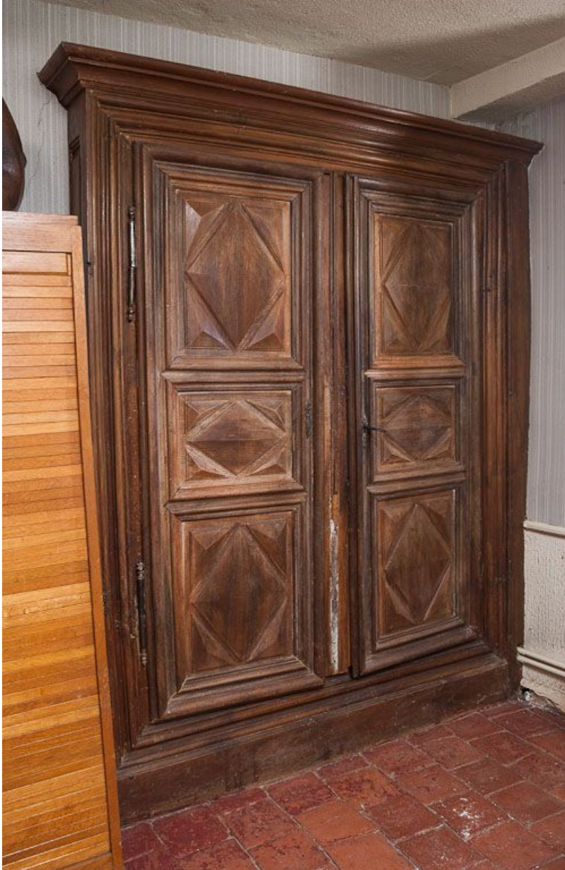
Corps de bâtiment principal : première pièce latérale gauche (détail : façade d'armoire en remploi). 21, Moutiers-Saint-Jean, 8 place de l' Hôpital