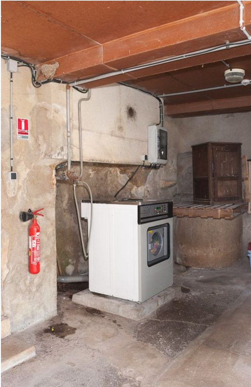
Corps de bâtiment transversal : buanderie à l'étage de soubassement.

21, Moutiers-Saint-Jean, 8 place de l' Hôpital