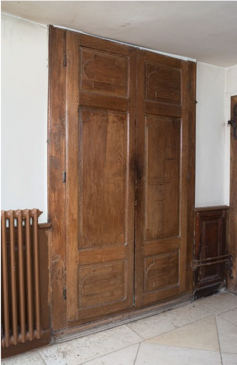
Corps de bâtiment principal : deuxième pièce latérale gauche, devenue sacristie (portes de placard mural). 21, Moutiers-Saint-Jean, 8 place de l' Hôpital