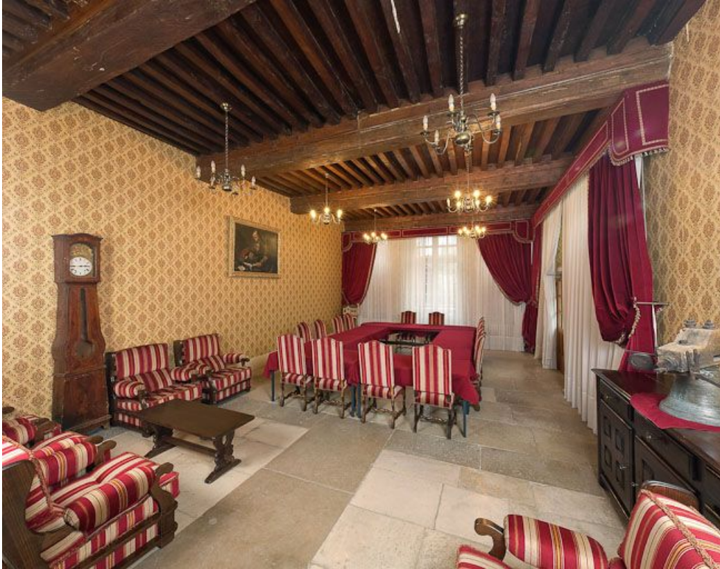
Corps de bâtiment principal : salle des femmes (aujourd'hui salle de réunion).

21, Moutiers-Saint-Jean, 8 place de l' Hôpital