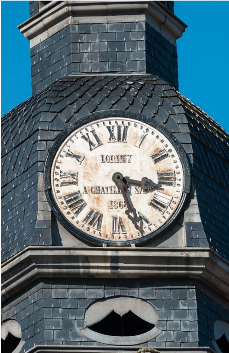
Façade sur rue : détail (cadran de l'horloge).

21, Moutiers-Saint-Jean, 8 place de l' Hôpital