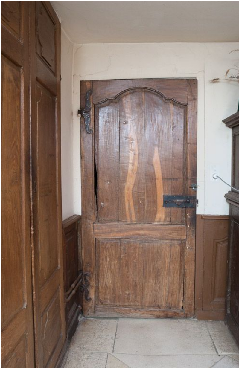
Corps de bâtiment principal : deuxième pièce latérale gauche, devenue sacristie (détail : porte antérieure). 21, Moutiers-Saint-Jean, 8 place de l' Hôpital