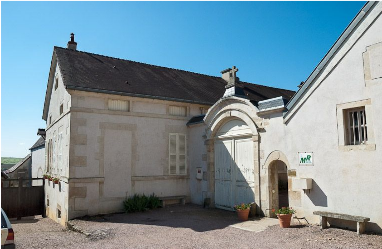
Façade sur rue : vue partielle (portail et corps de bâtiment latéral gauche).

21, Moutiers-Saint-Jean, 8 place de l' Hôpital