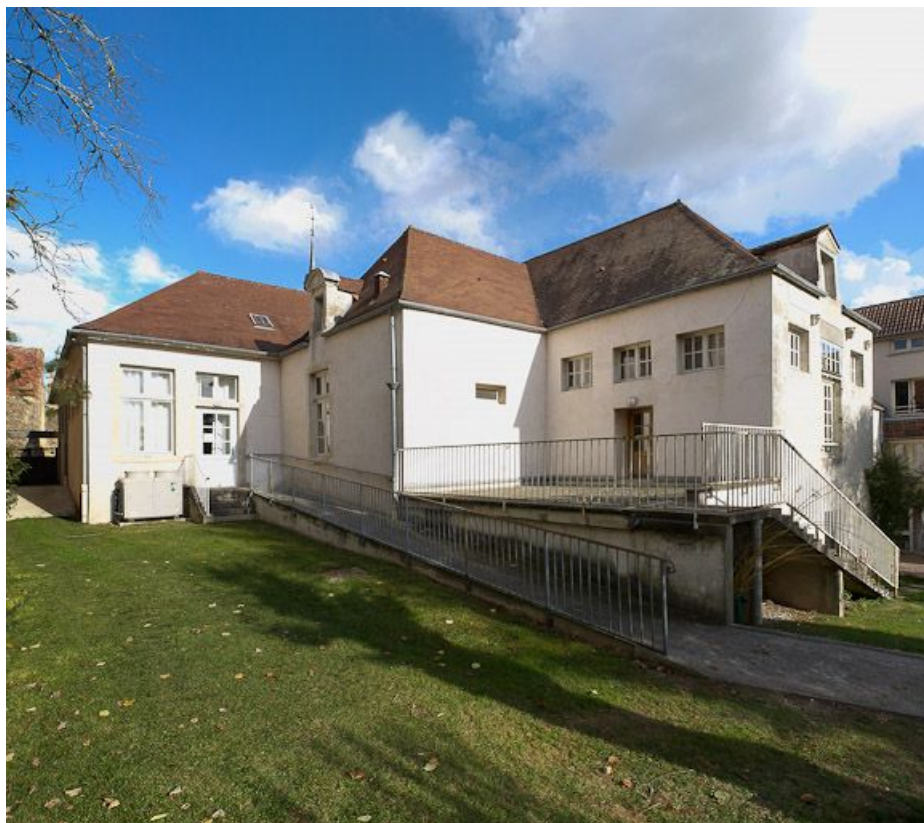
Corps de bâtiment principal : vue d'ensemble, côté jardin, prise depuis l'ouest. 21, Moutiers-Saint-Jean, 8 place de l' Hôpital