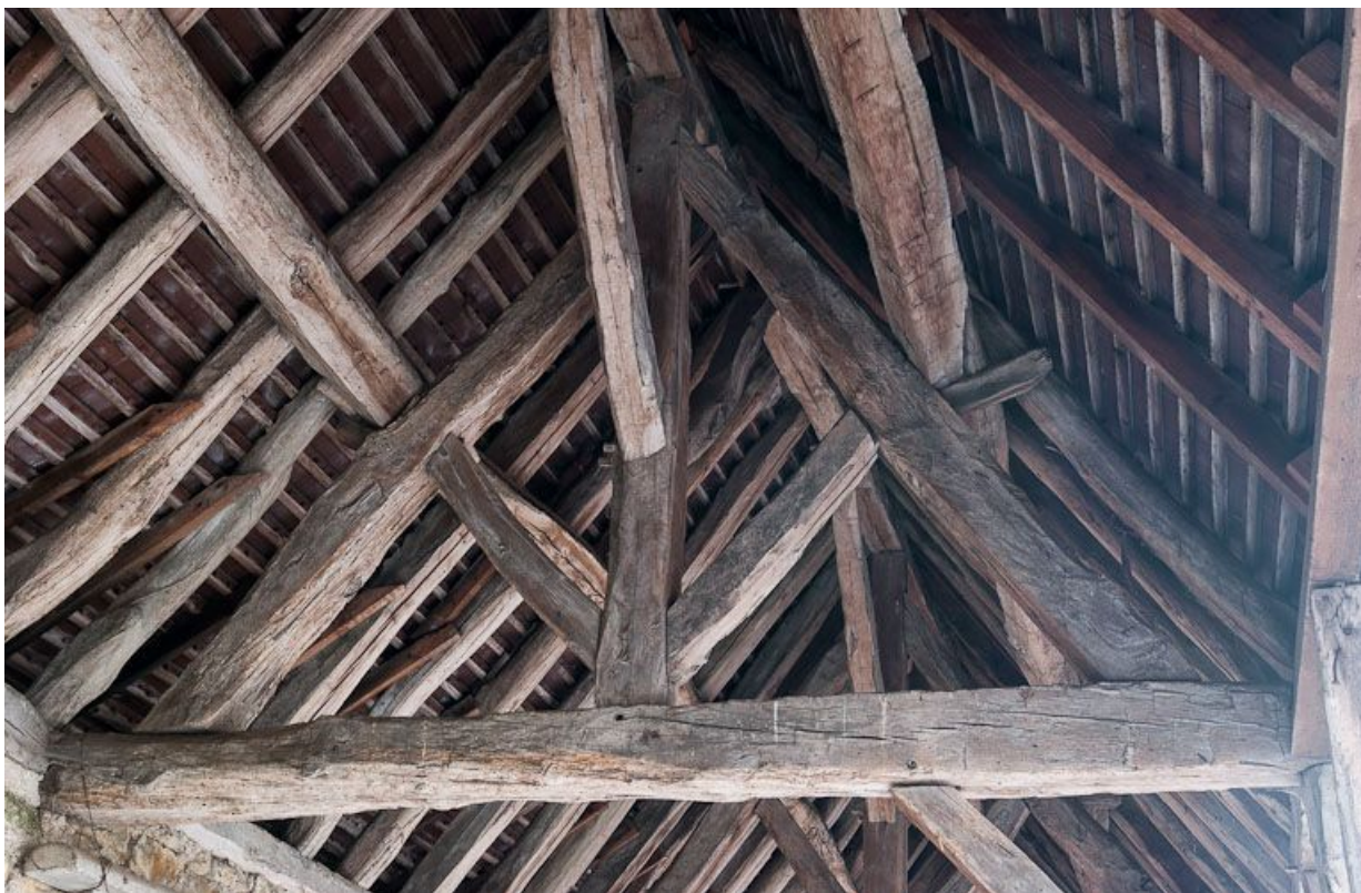
Cour latérale gauche : charpente du hangar.

21, Moutiers-Saint-Jean, 8 place de l' Hôpital