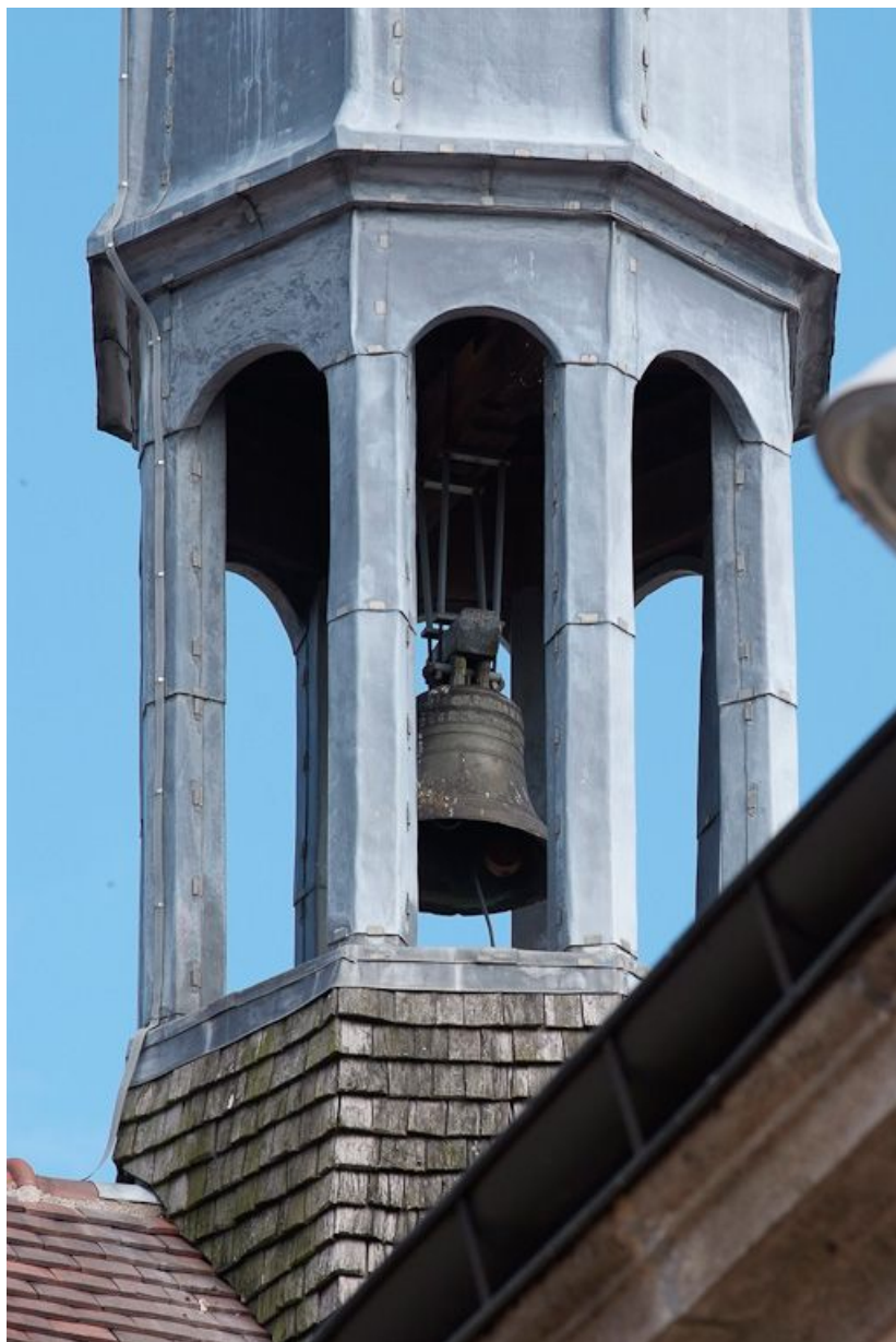
Détail du campanile.