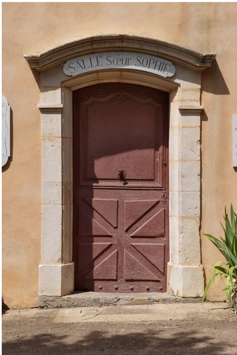
Façade antérieure, porte centrale.