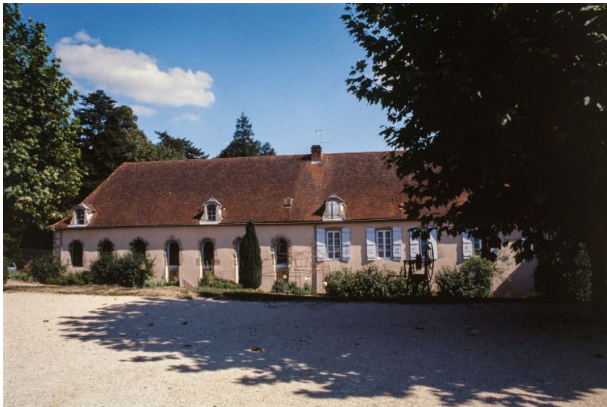
Vue générale de l'ancien hôpital, façade postérieure.