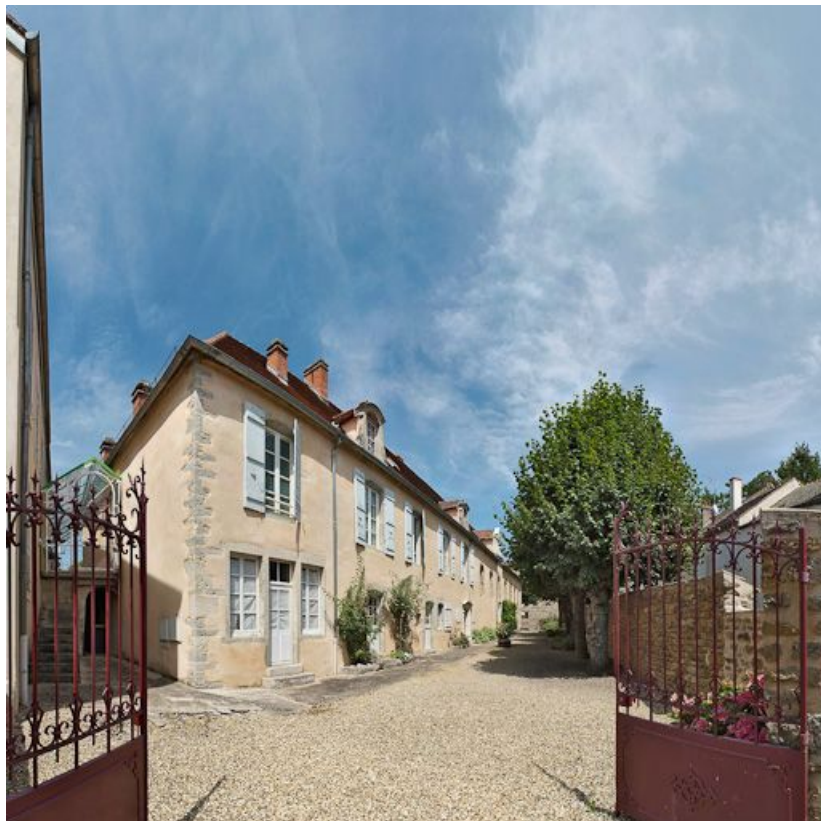
Façade antérieure de l'ancien hôpital.