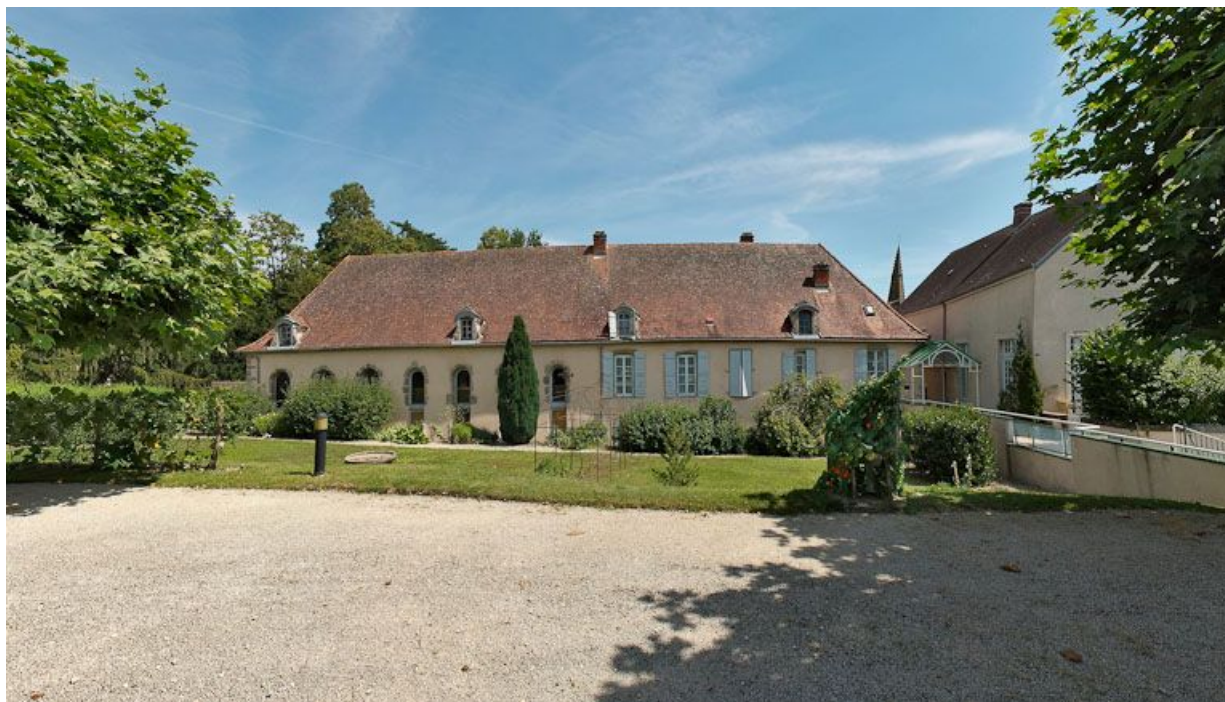
Façade postérieure de l'ancien hôpital.