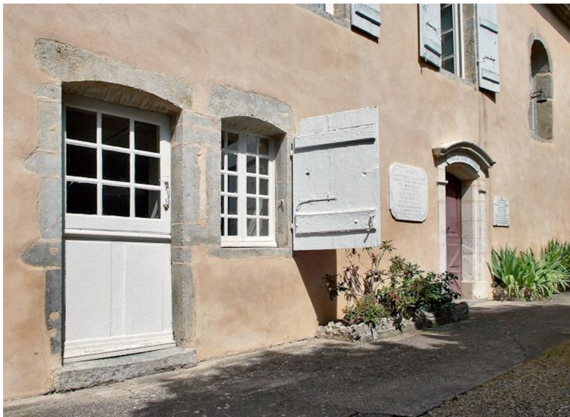
Façade antérieure de l'ancien hôpital, partie centrale.