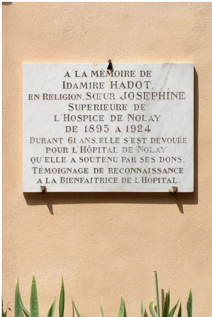
Plaque commémorative de soeur Joséphine. 21, Nolay, 6 rue du Docteur Lavirotte