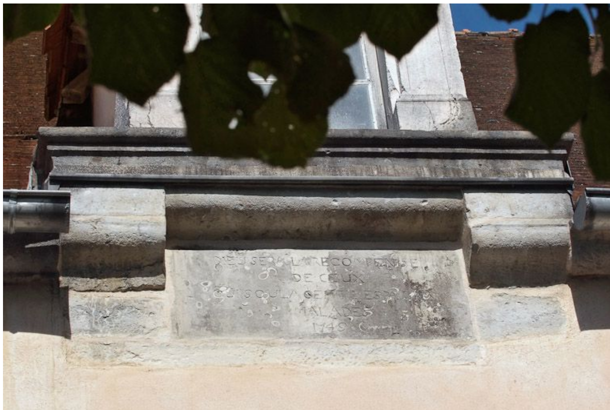
Façade antérieure, détail de l'inscription.