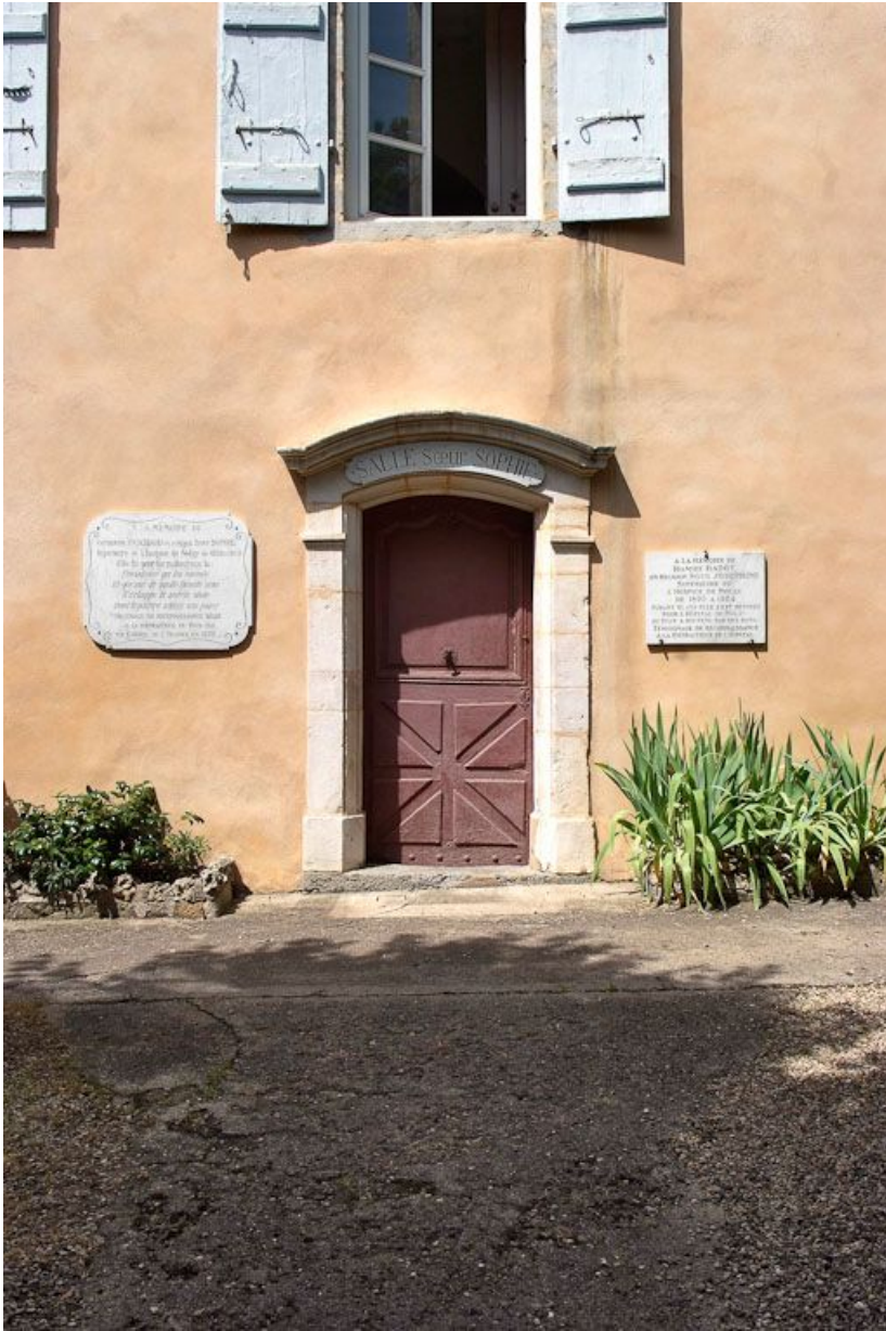
Façade antérieure, détail de la partie centrale. 21, Nolay, 6 rue du Docteur Lavirotte