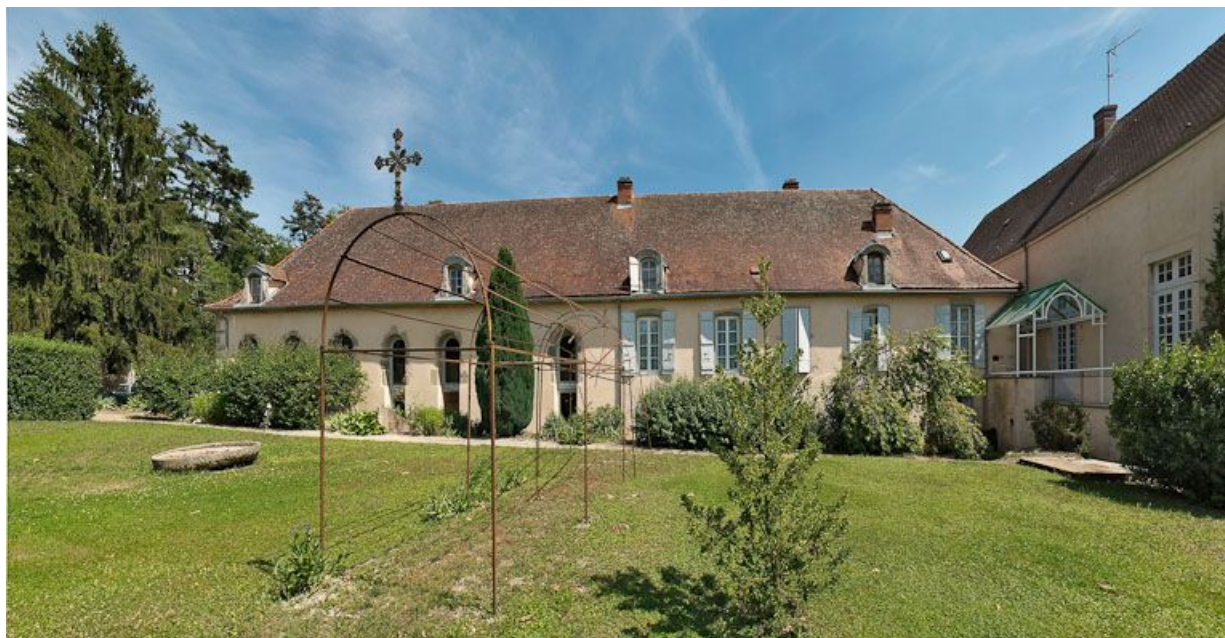
Façade postérieure de l'ancien hôpital.