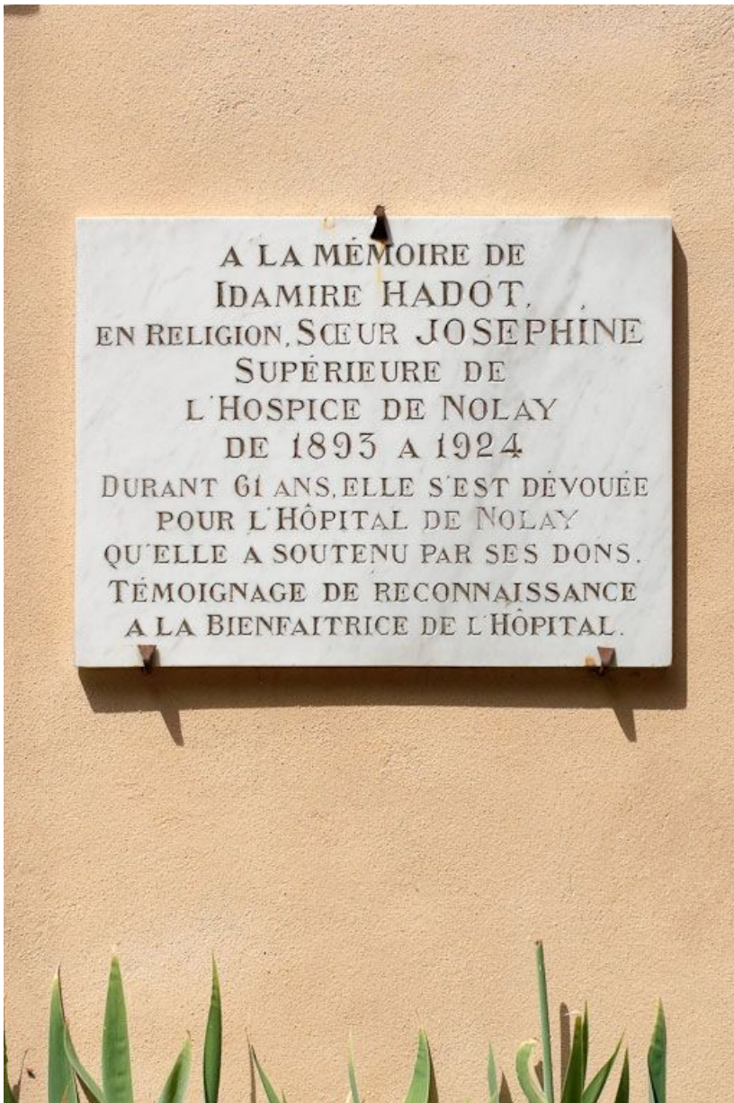
Plaque commémorative de soeur Joséphine. 21, Nolay, 6 rue du Docteur Lavirotte