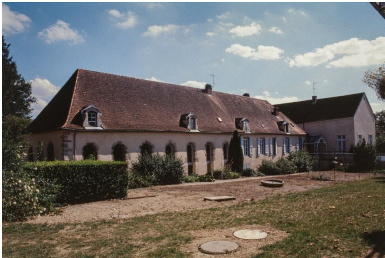
Vue générale de l'ancien hôpital, façade postérieure.