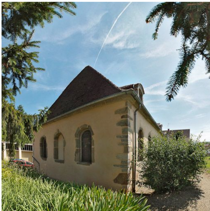
Élévation droite (ancienne chapelle).