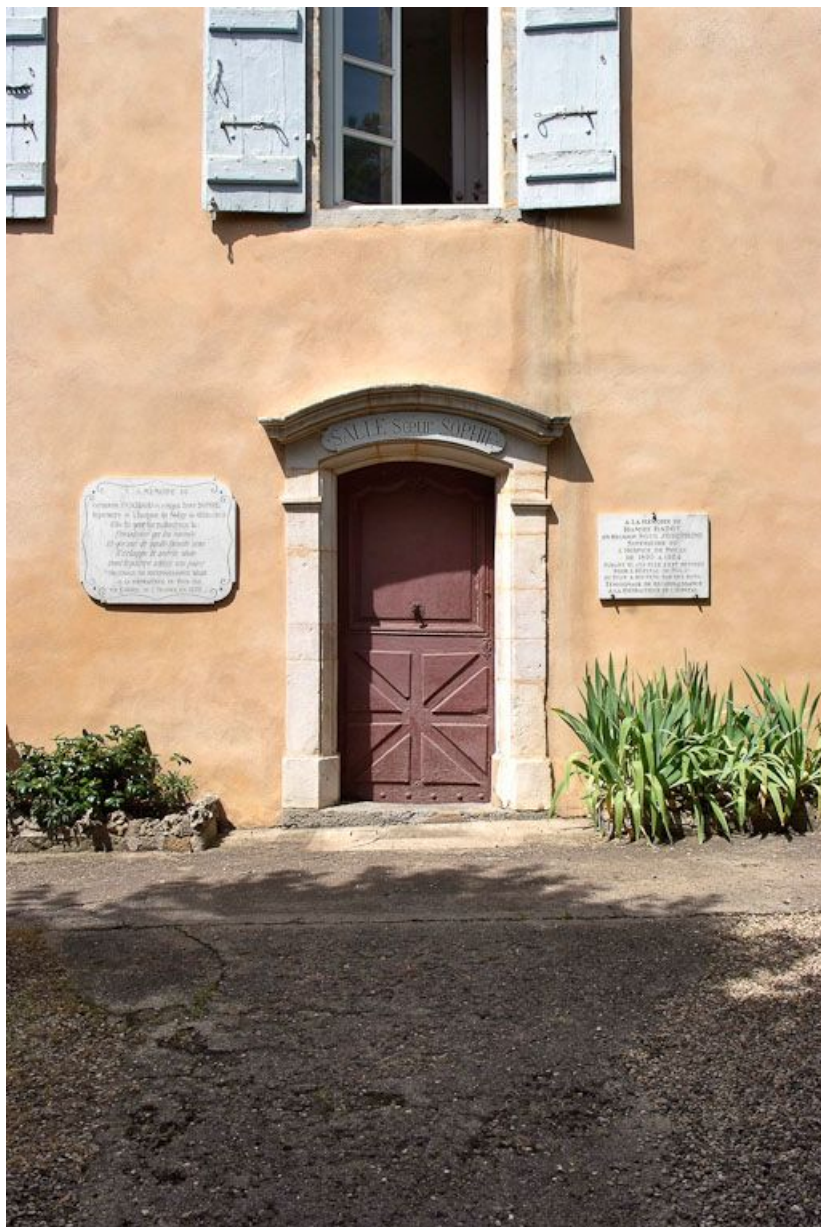
Façade antérieure, détail de la partie centrale. 21, Nolay, 6 rue du Docteur Lavirotte