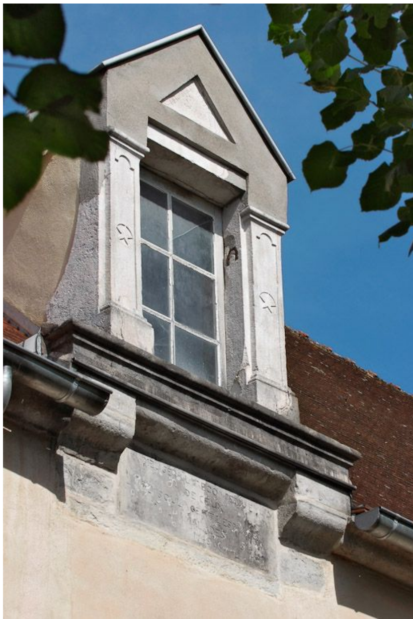
Lucarne située à l'aplomb de la porte de l'ancienne salle des malades. 21, Nolay, 6 rue du Docteur Lavirotte