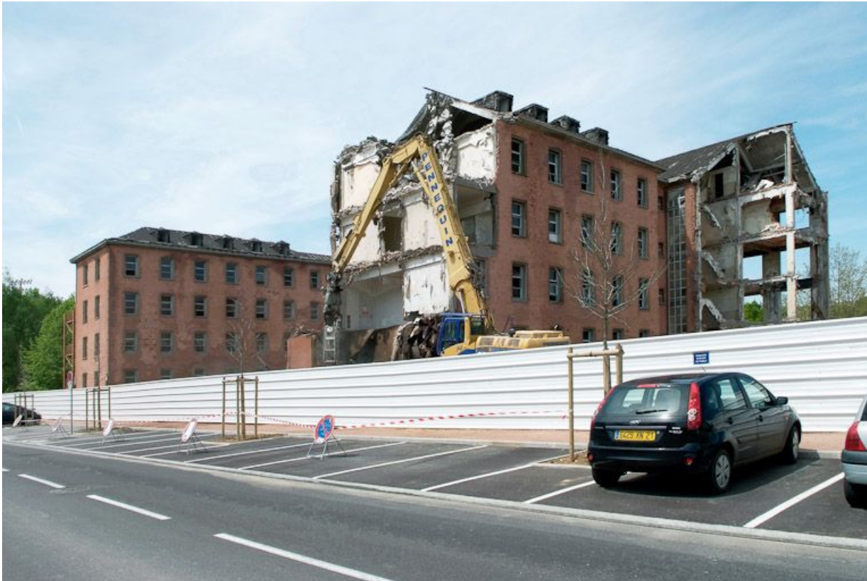
Bâtiment hospitalier en cours de démolition. 21, Dijon Stade