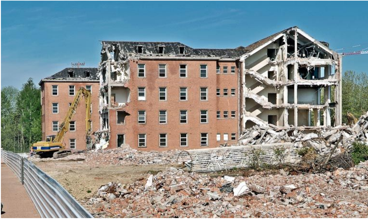
Bâtiment hospitalier en cours de démolition. 21, Dijon Stade