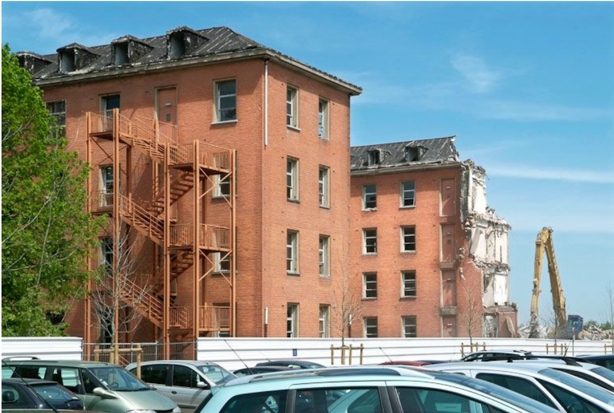
Bâtiment hospitalier en cours de démolition.