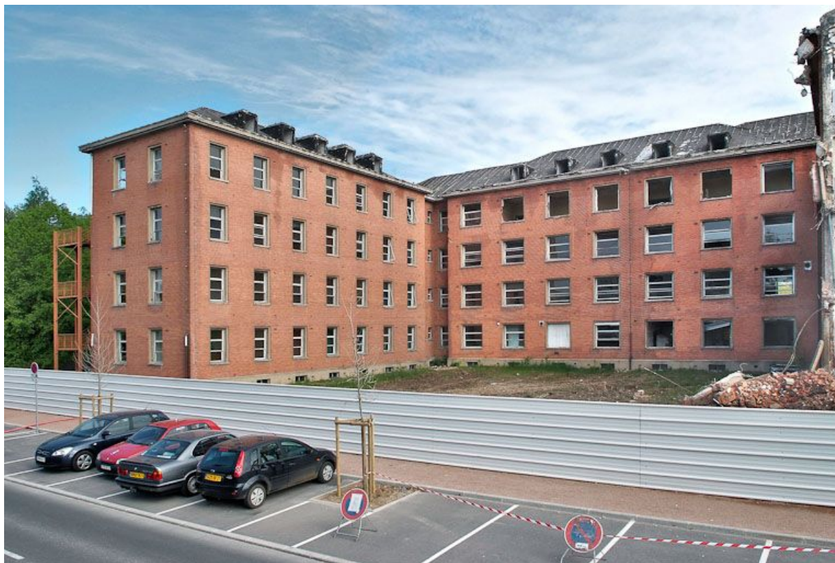
Bâtiment hospitalier en cours de démolition.