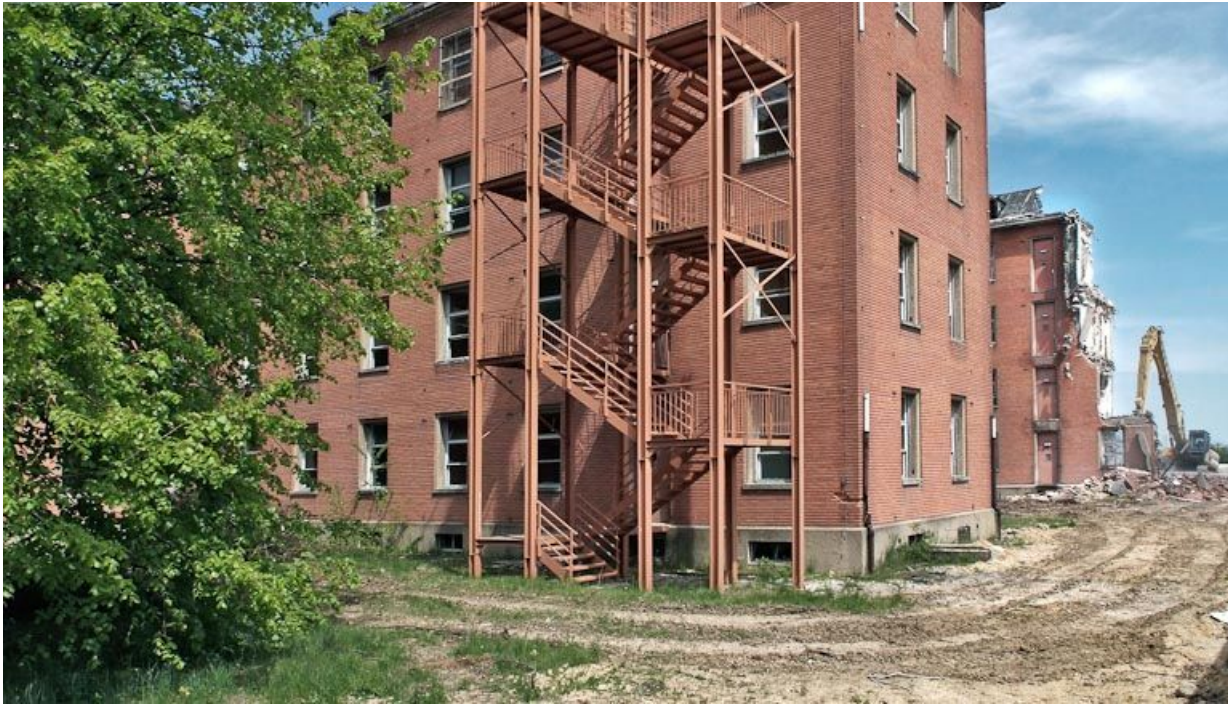
Bâtiment hospitalier en cours de démolition. 21, Dijon Stade