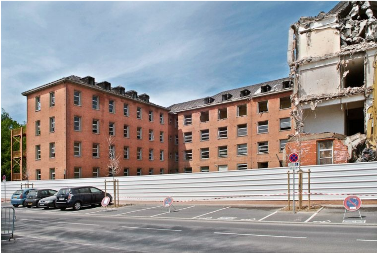
Bâtiment hospitalier en cours de démolition. 21, Dijon Stade