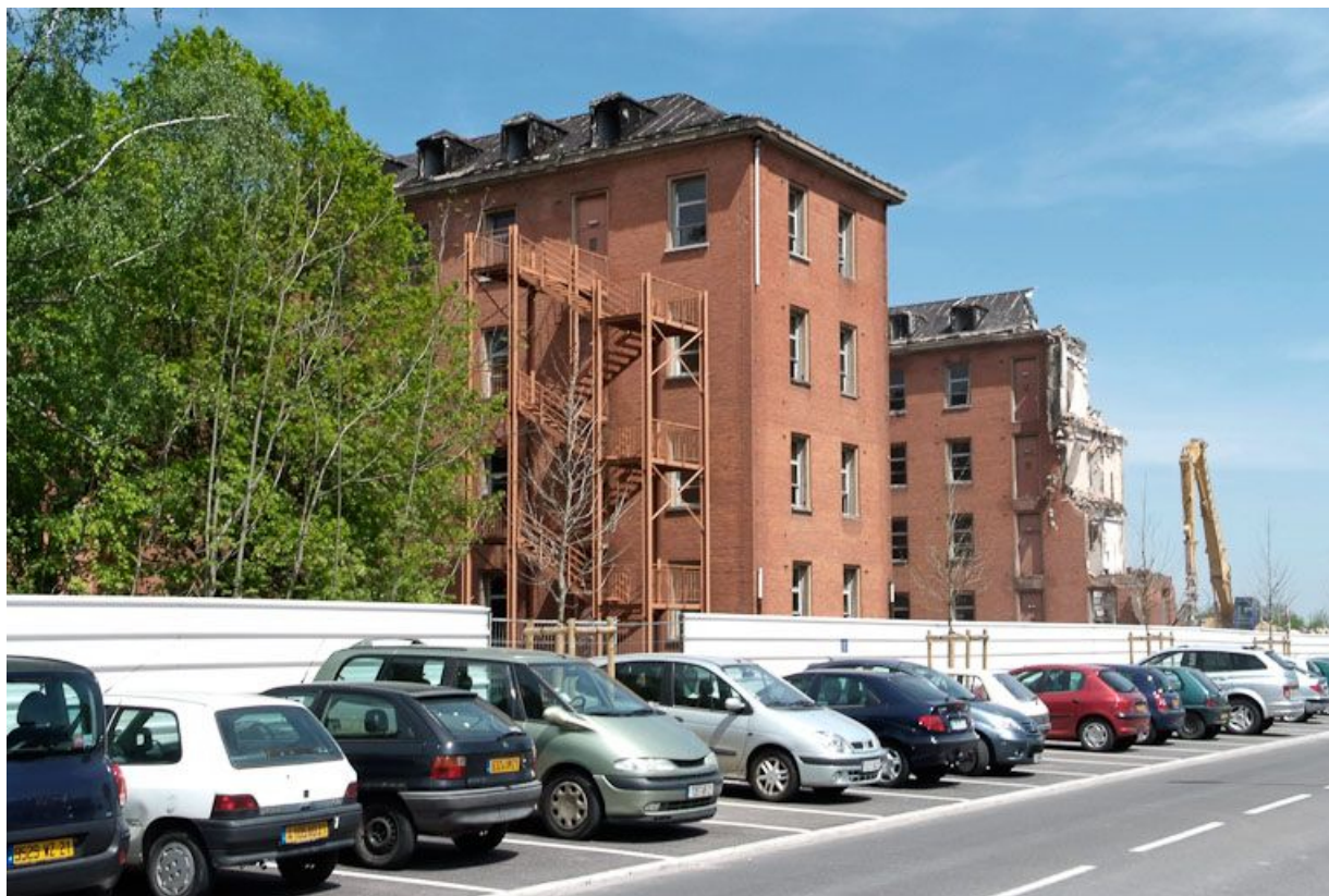
Bâtiment hospitalier en cours de démolition. 21, Dijon Stade