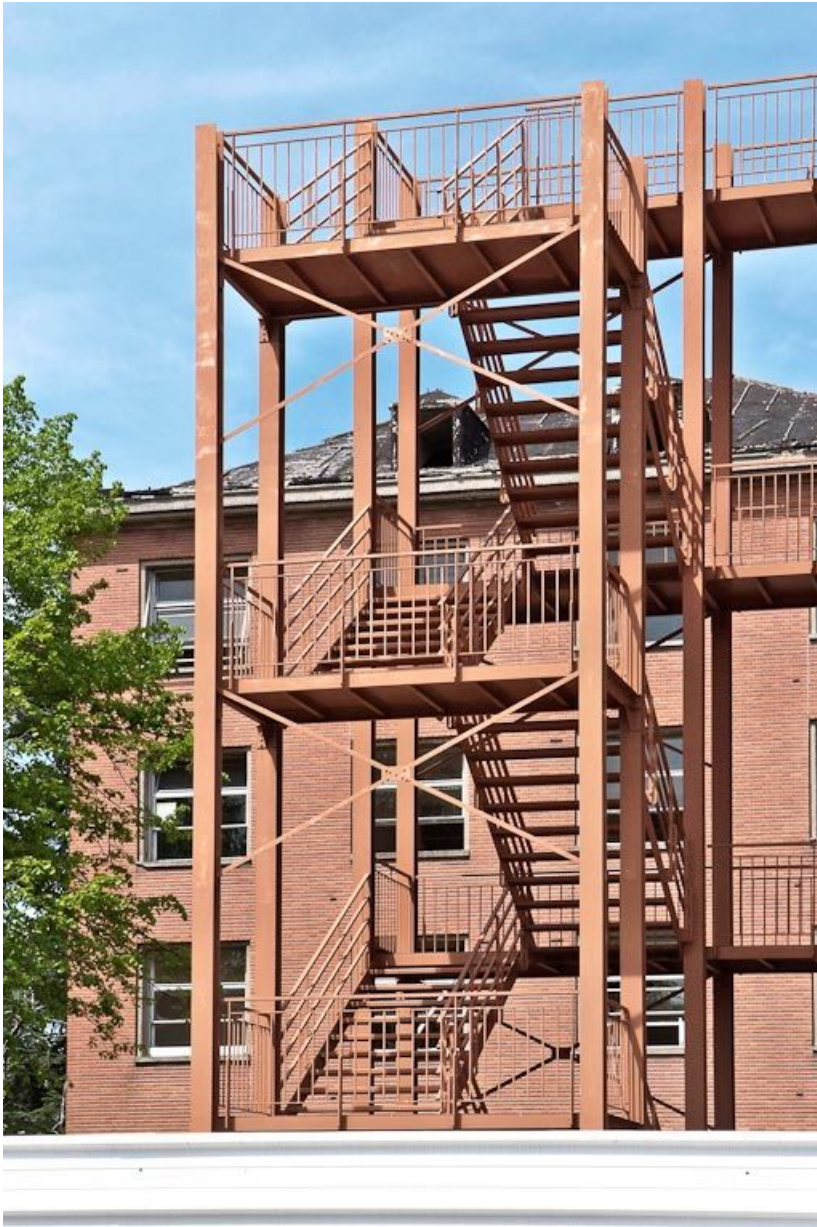
Bâtiment hospitalier, escalier de secours. 21, Dijon Stade