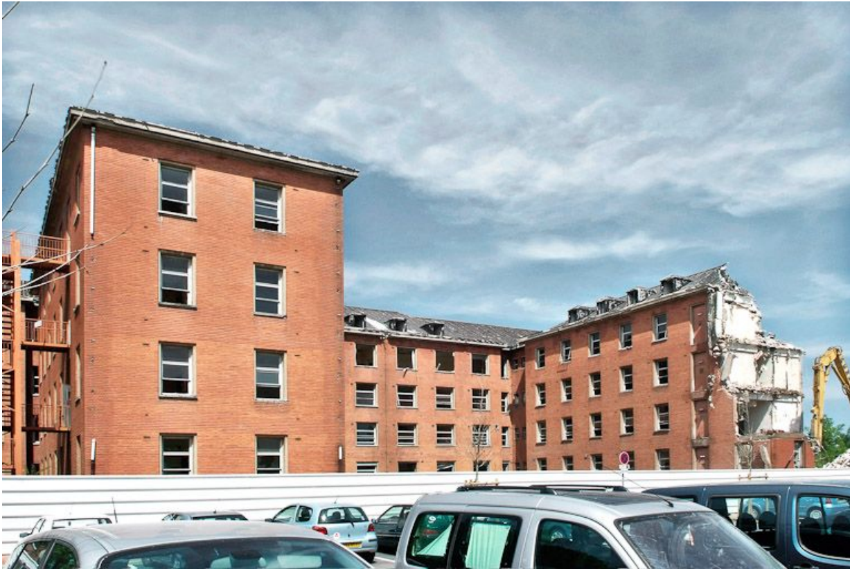
Bâtiment hospitalier en cours de démolition. 21, Dijon Stade