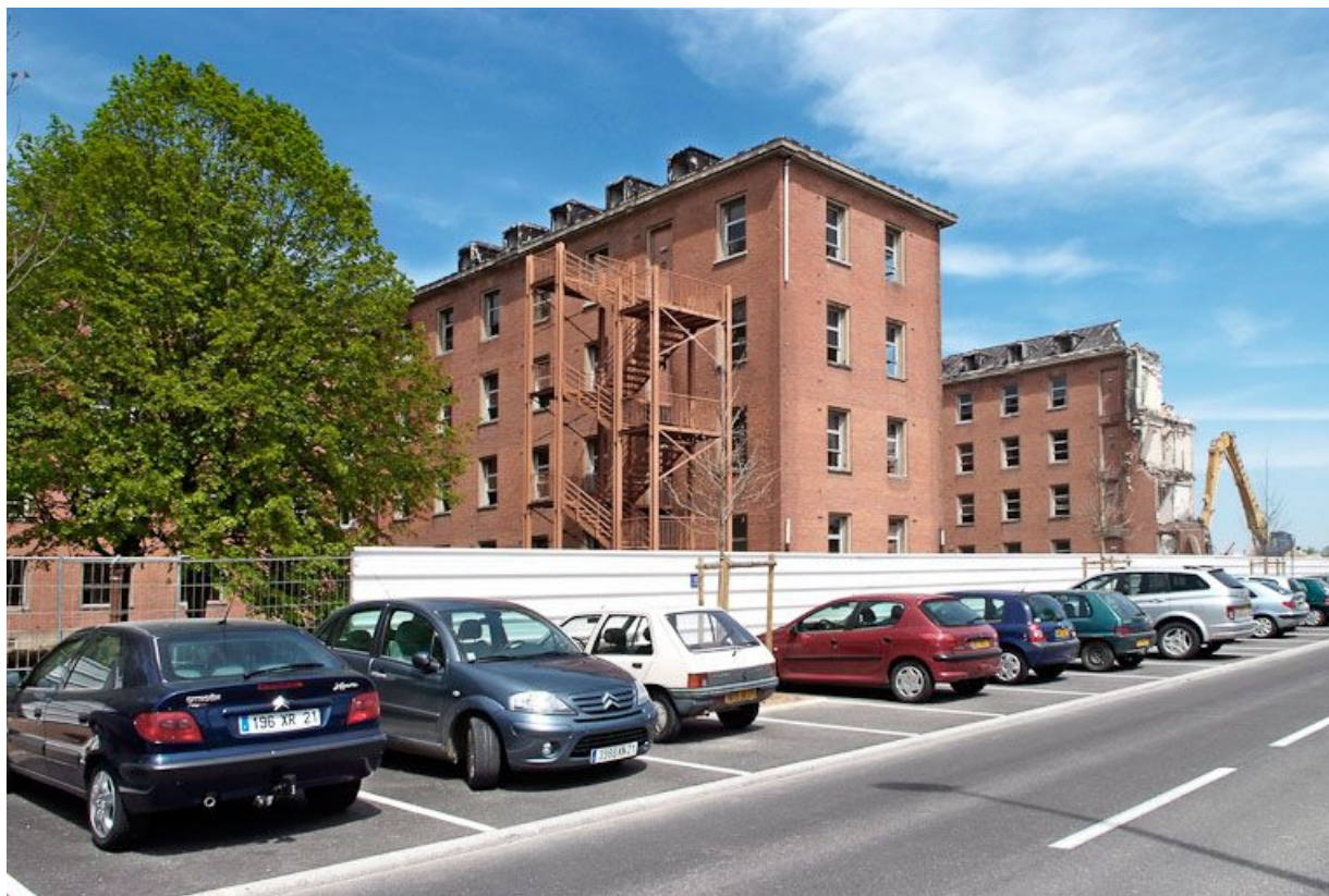
Bâtiment hospitalier en cours de démolition. 21, Dijon Stade