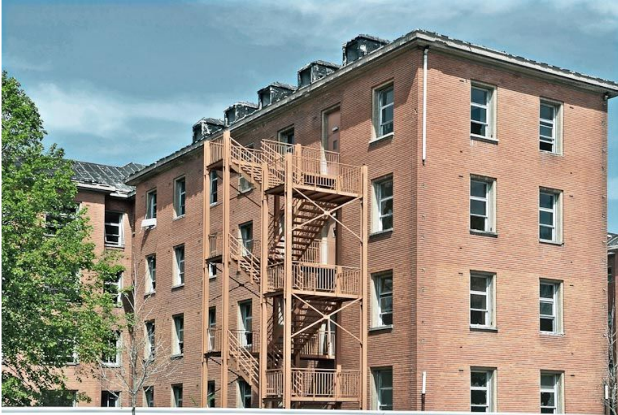
Bâtiment hospitalier, vue d'une aile. 21, Dijon Stade