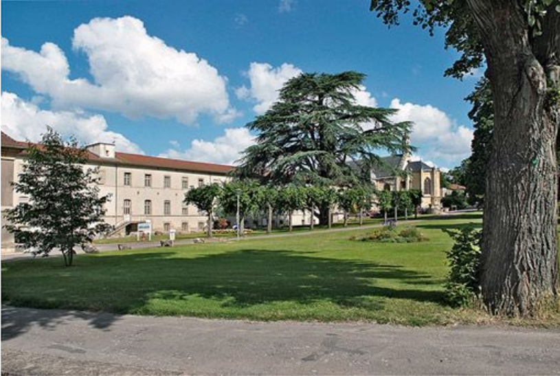
Vue du parc, au fond : bâtiments de l'asile et chevet de la chapelle.