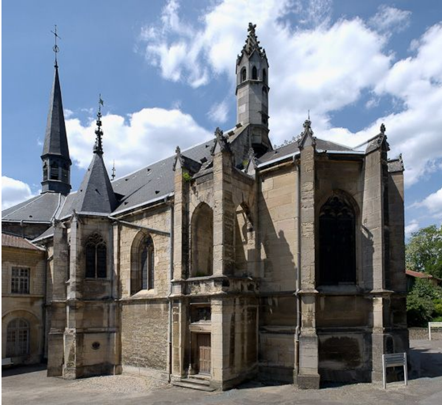
Chevet de la chapelle.