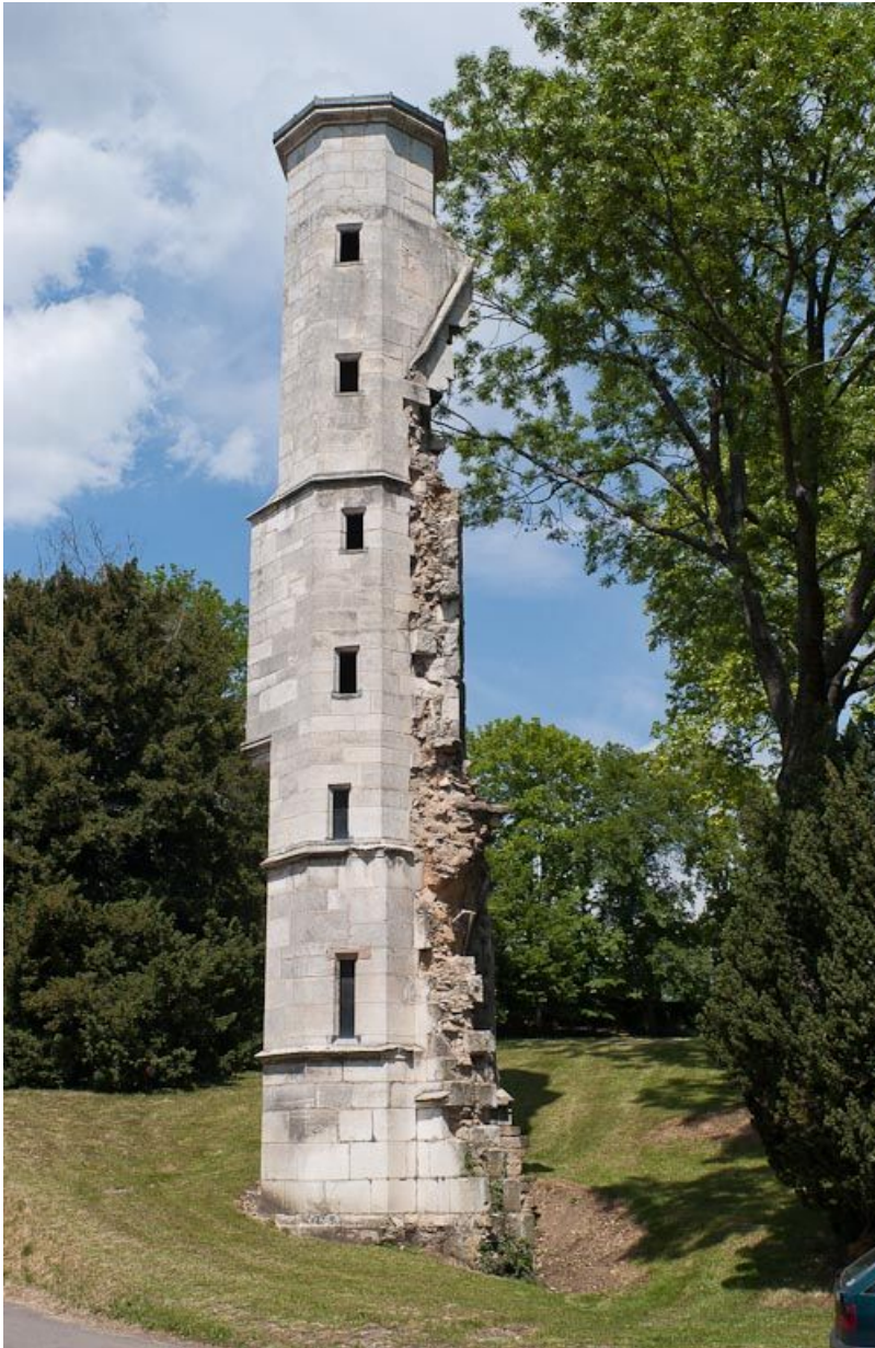
Tourelle d'escalier de l'oratoire ducal.