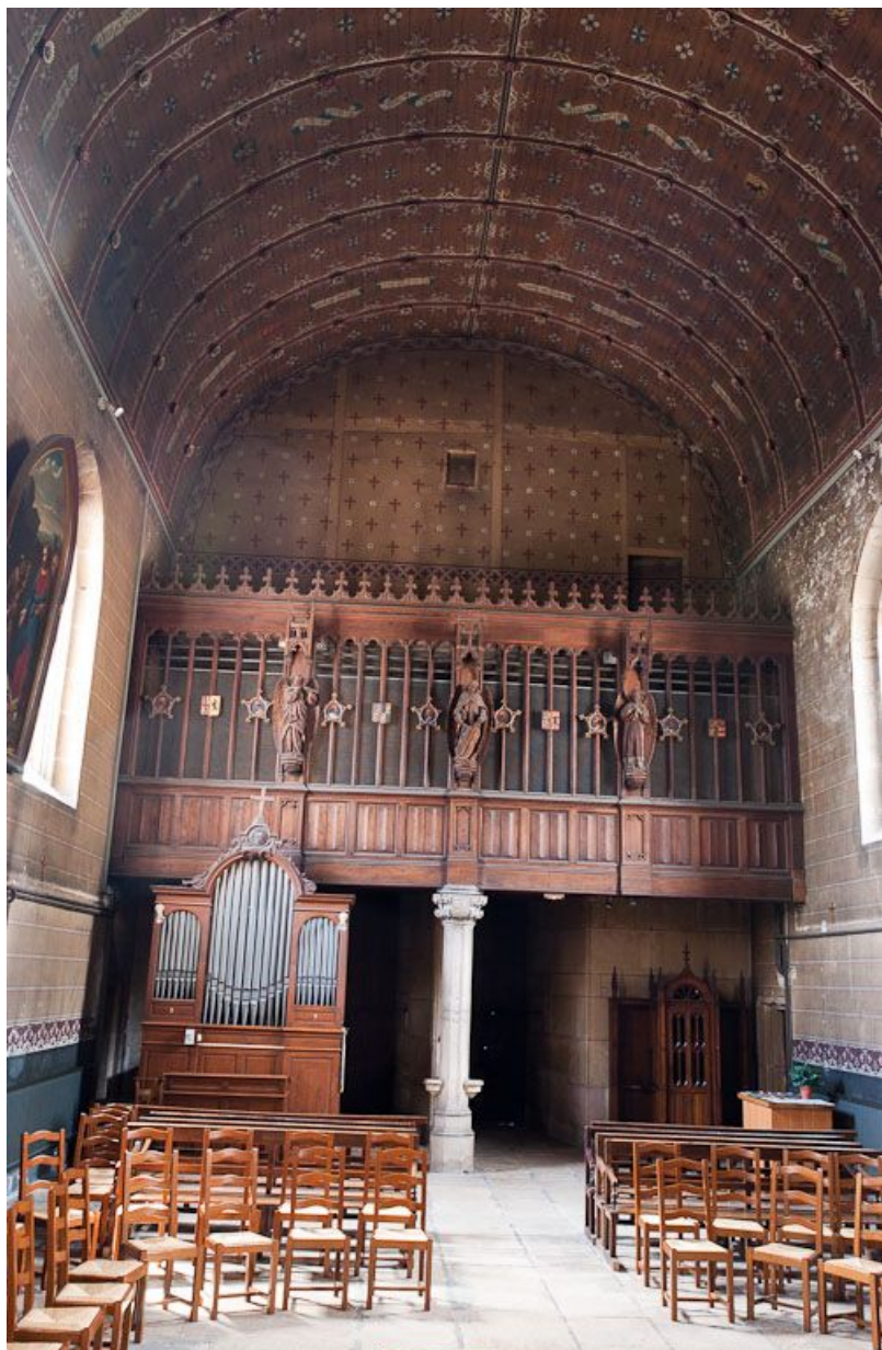
Intérieur de la chapelle (côté tribune).