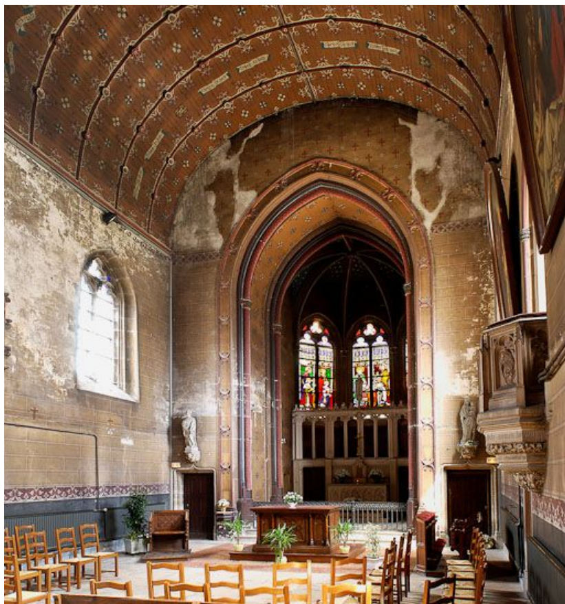
Intérieur de la chapelle (côté chœur).