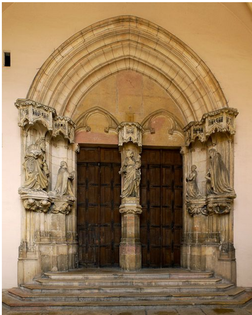
Portail de la chapelle.