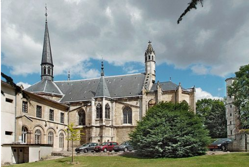
Chapelle : élévation latérale.