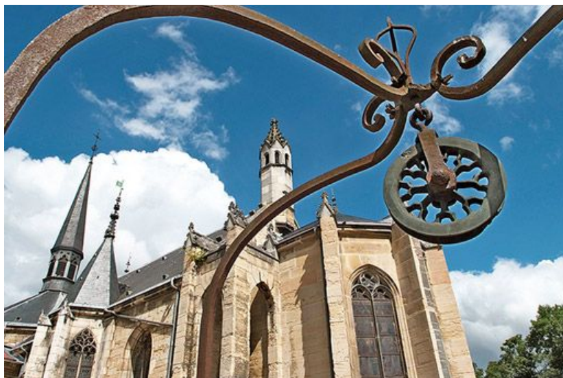
Poulie du puits de Jacob et chevet de la chapelle.