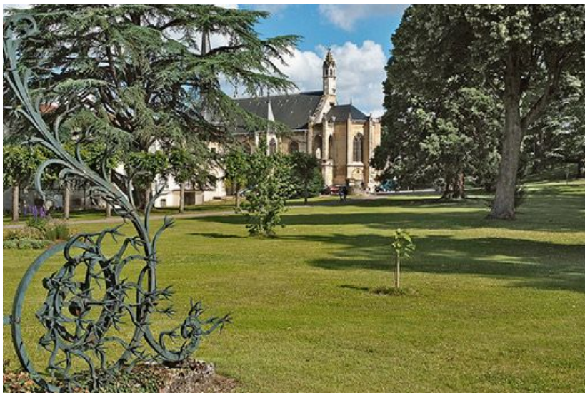
Chevet de la chapelle et ouvrage de ferronnerie du portail de l'hôtellerie.