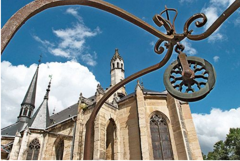
Poulie du puits de Jacob et chevet de la chapelle.