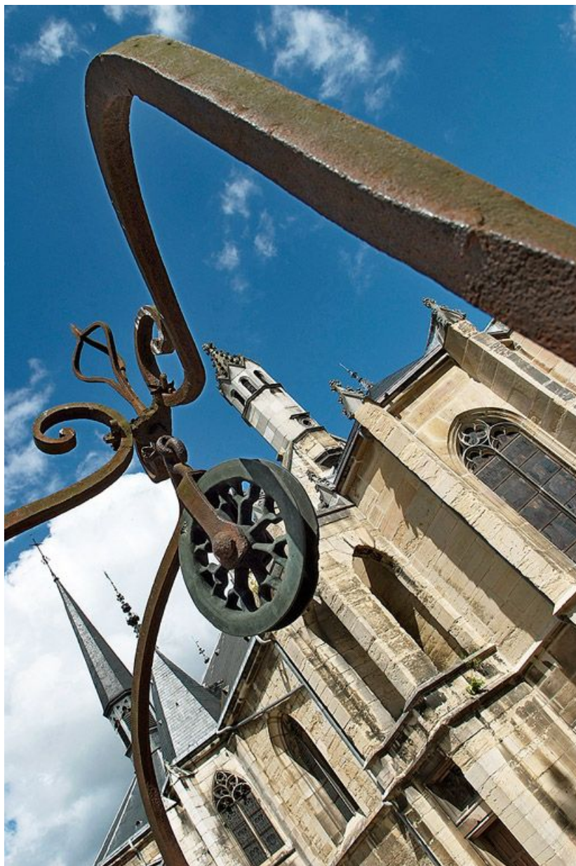
Poulie du puits de Jacob et chevet de la chapelle.