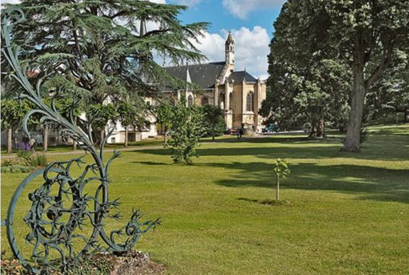
Chevet de la chapelle et ouvrage de ferronnerie du portail de l'hôtellerie. 21, Dijon, 1 boulevard Chanoine Kir