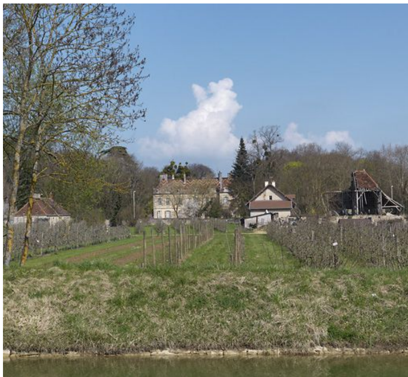
Le château de Bretenière, vu de la rive droite du canal. Au premier plan : des vergers.