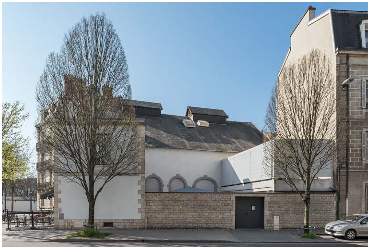
Façade latérale droite. 21, Dijon, 82 rue Devosge