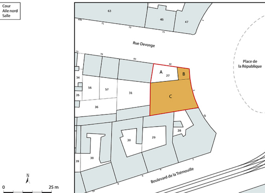
Plan-masse et de situation. Extrait du plan cadastral, 2021, section BN, 1/1 000 agrandi à 1/500. 21, Dijon, 82 rue Devosge