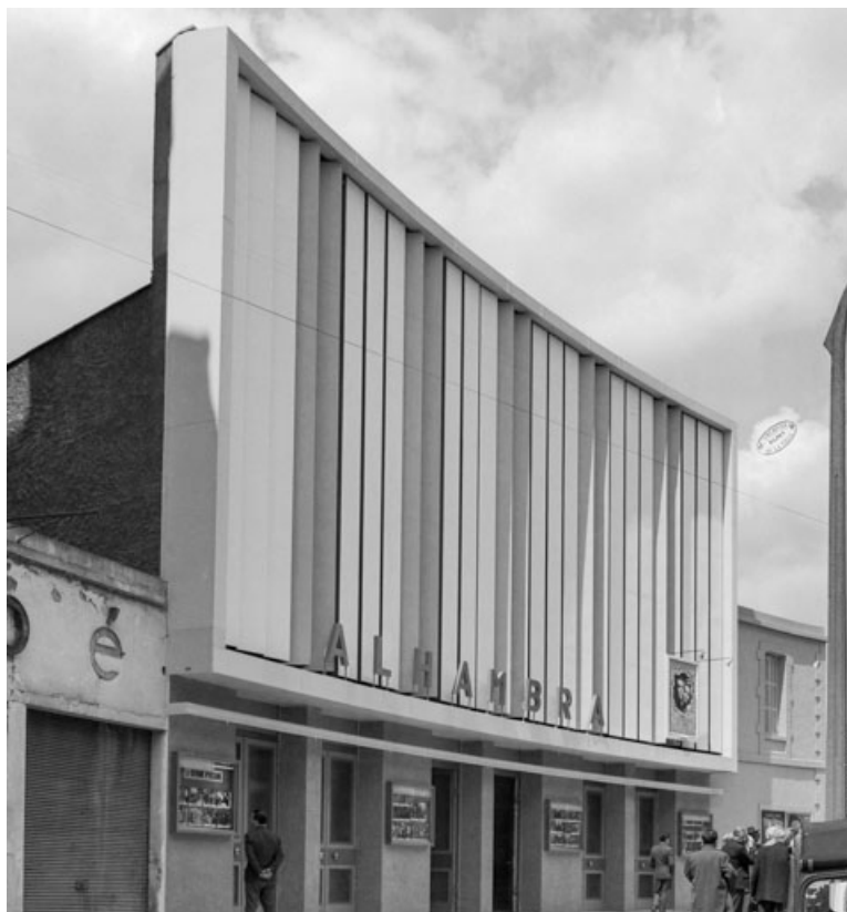
[Façade antérieure, de trois quarts gauche]. 29 mai 1961. 21, Dijon, 82 rue Devosge