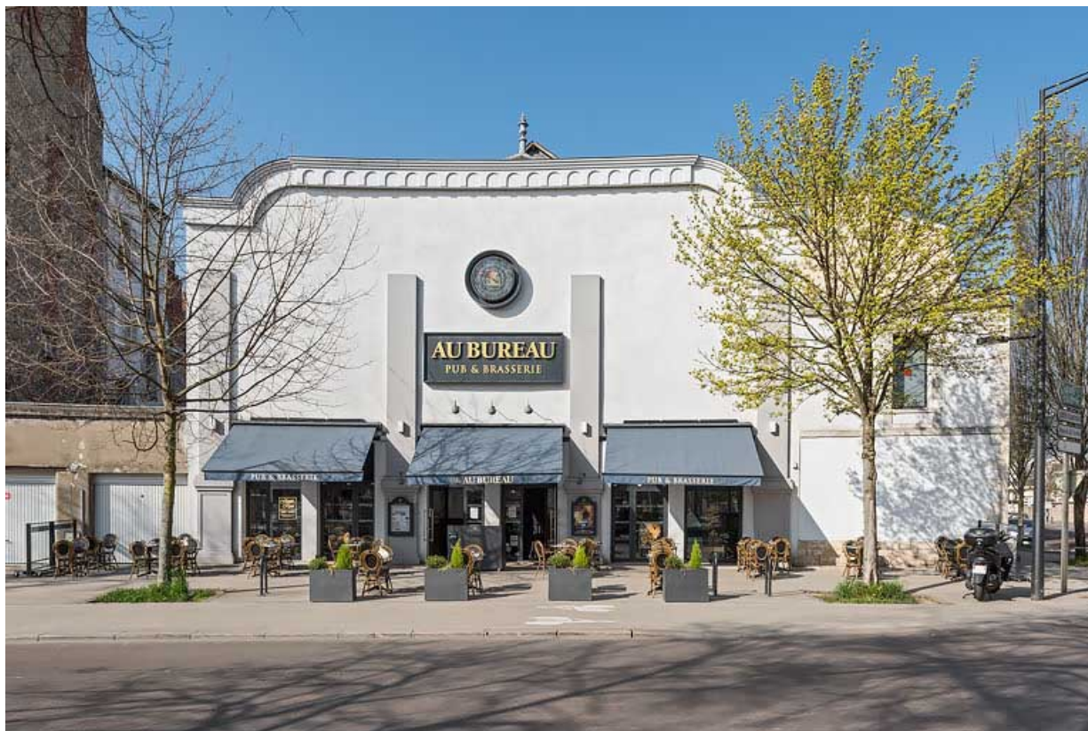
Façade antérieure. 21, Dijon