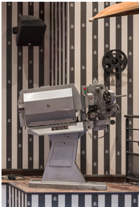
Projecteur de l'Officine Prevost Milano.