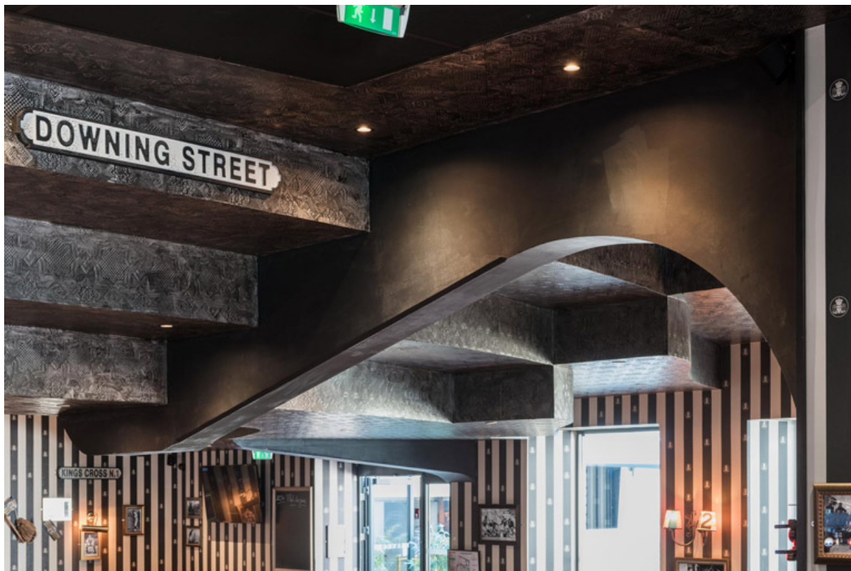
Balcon : support en béton, avec gradins. 21, Dijon, 82 rue Devosge