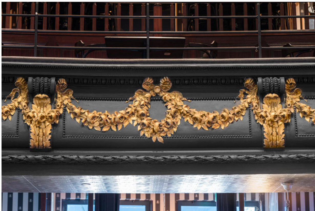
Balcon : décor du garde-corps.