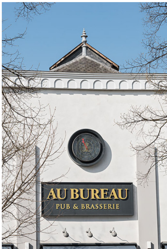
Façade antérieure : décor de la travée centrale.