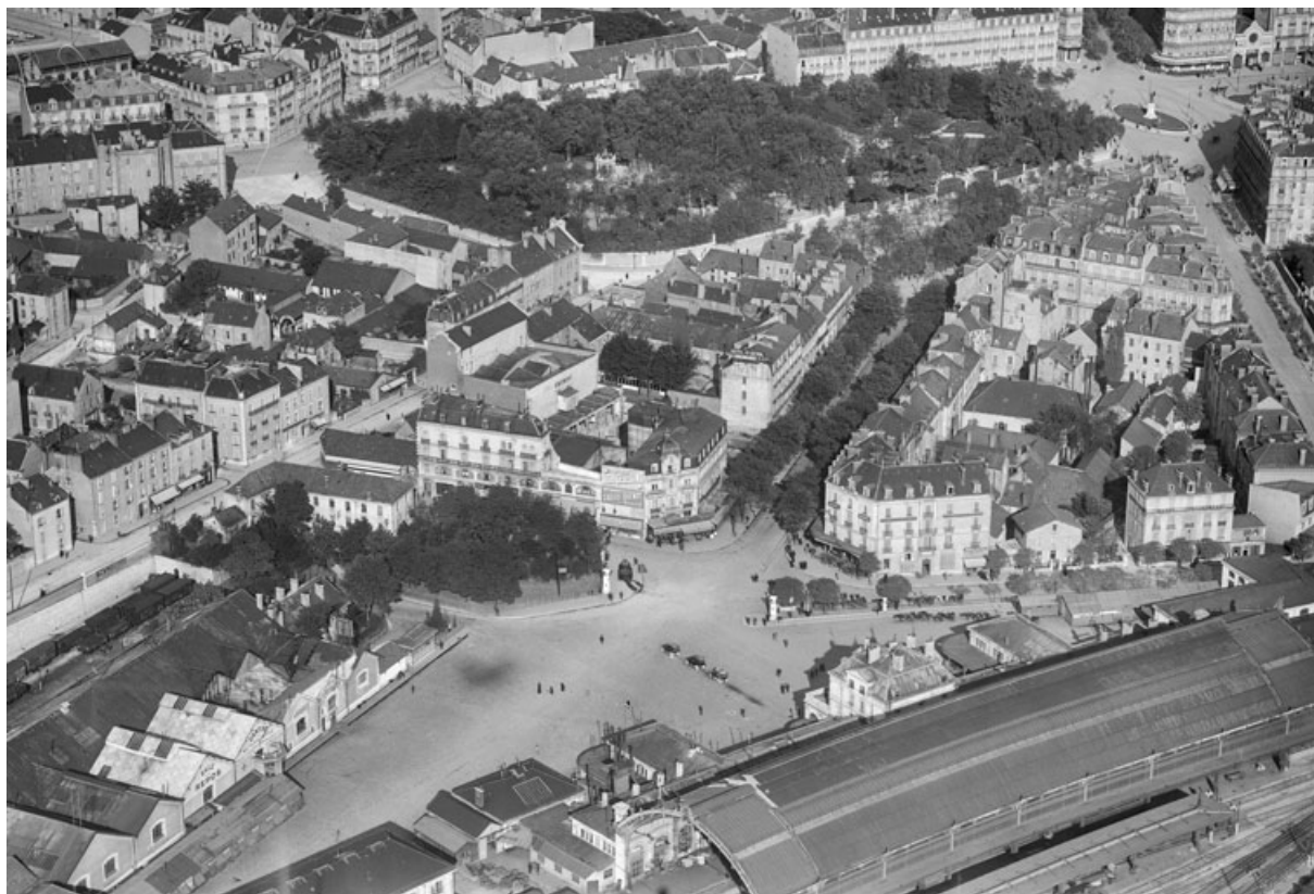
[Vue aérienne oblique du quartier de la gare, depuis le sud-ouest]. 21 septembre 1919. 21, Dijon, 17-19 rue des Perrières