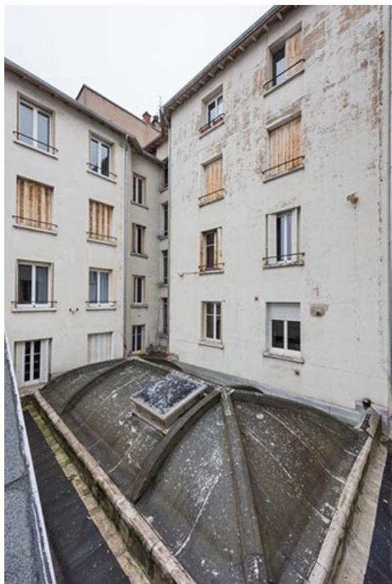
Façade postérieure, aile ouest et toit de la salle 9.