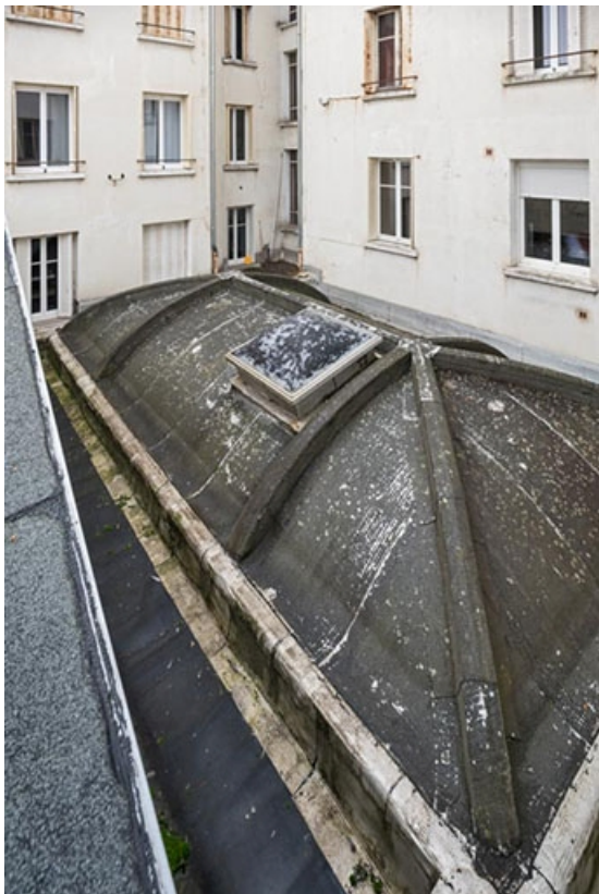
Toit de la salle 9, vu depuis celui de la salle 2.