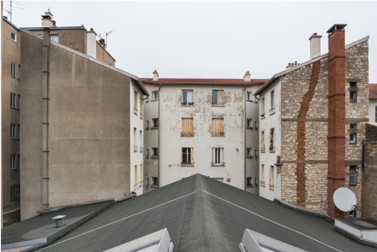
Façade postérieure, depuis le toit de la salle 2. 21, Dijon, 17-19 rue des Perrières