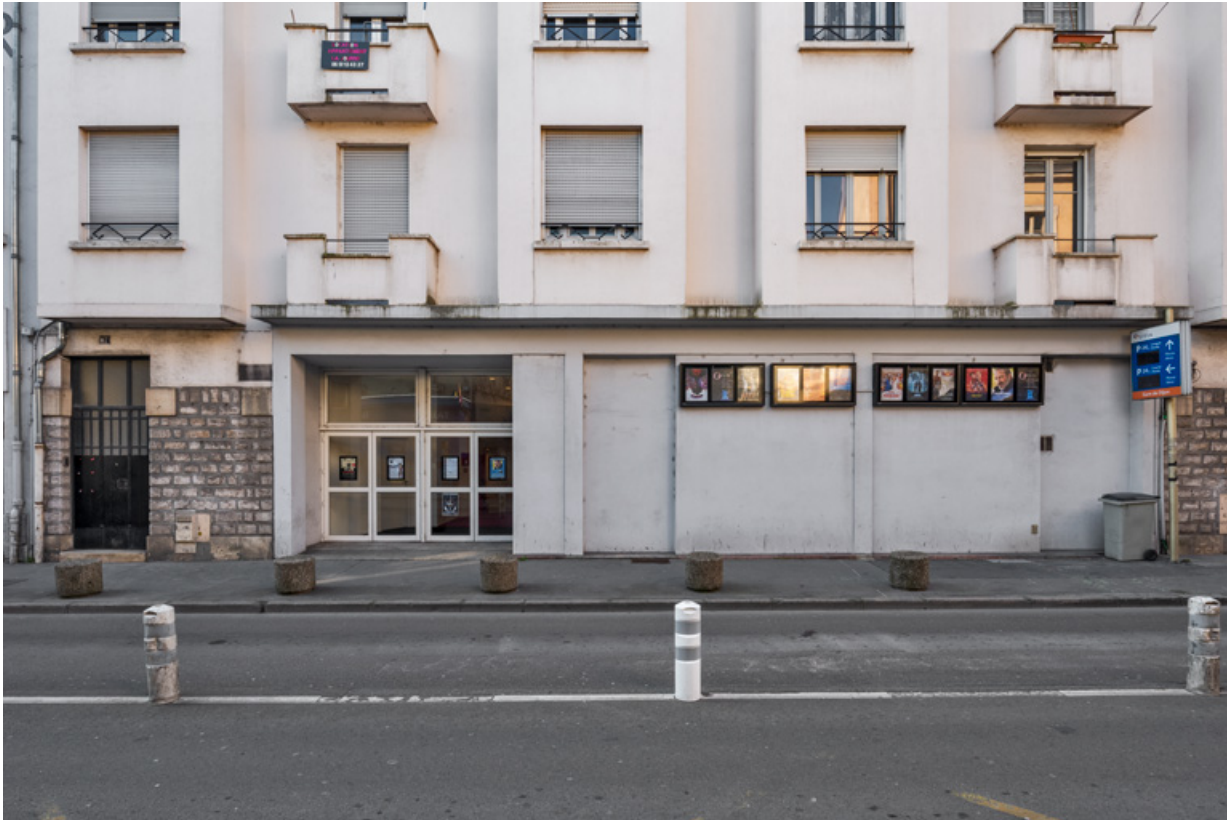
Façade antérieure : sortie du cinéma.