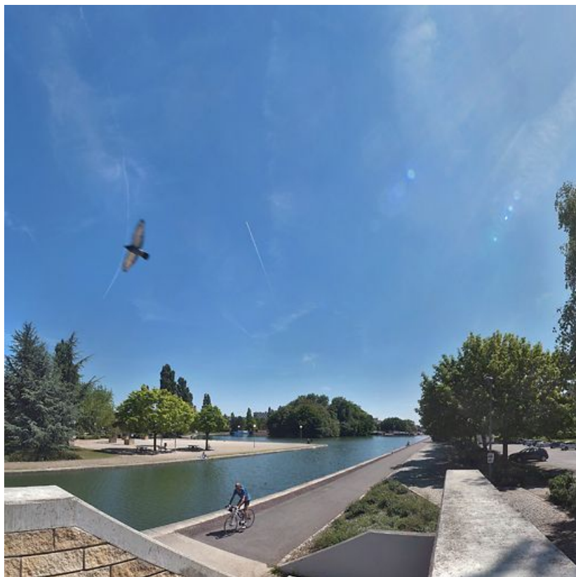
Entrée du port de Dijon (vue d'amont) : on distingue l'île qui caractérise le centre de ce port à l'arrière-plan.

21, Dijon place du 1er mai, lieudit : Port du Canal