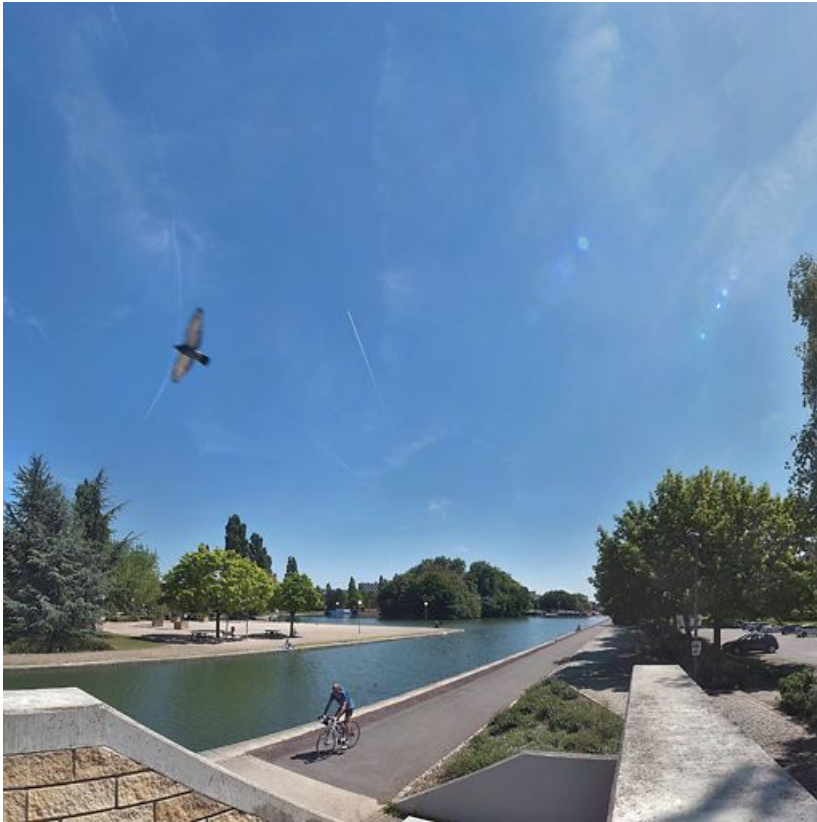
Entrée du port de Dijon (vue d'amont) : on distingue l'île qui caractérise le centre de ce port à l'arrière-plan.

21, Dijon place du 1er mai, lieudit : Port du Canal