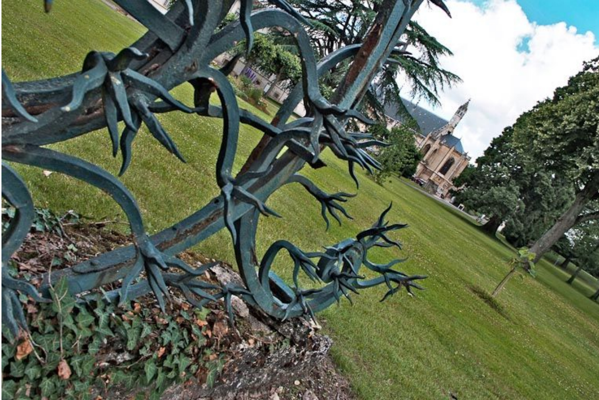
Ferronnerie ouvragée au pied des piliers du portail de l'hôtellerie.