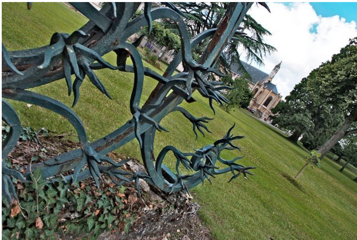
Ferronnerie ouvragée au pied des piliers du portail de l'hôtellerie.