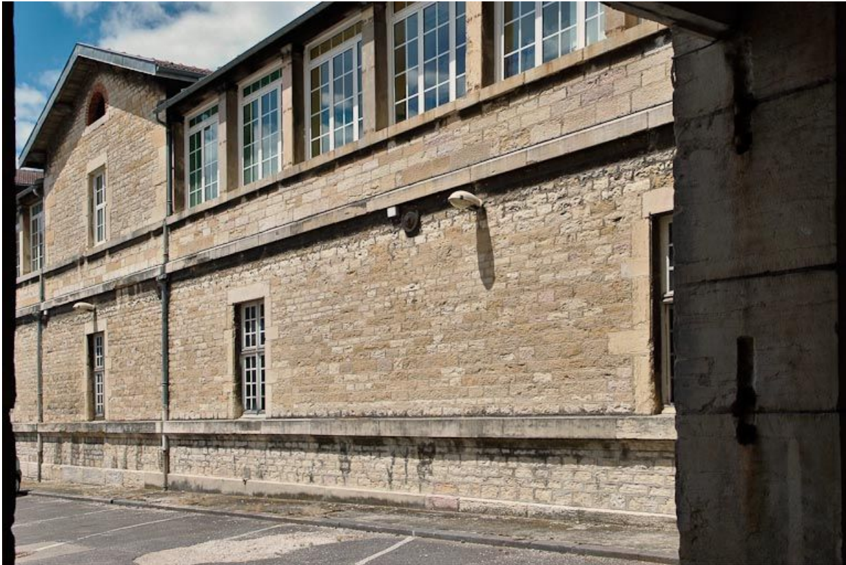
Aile centrale de l'asile d'aliénés : détail de l'élévation et jonction vers l'ancien portail de l'église. 21, Dijon, 1 boulevard Chanoine Kir