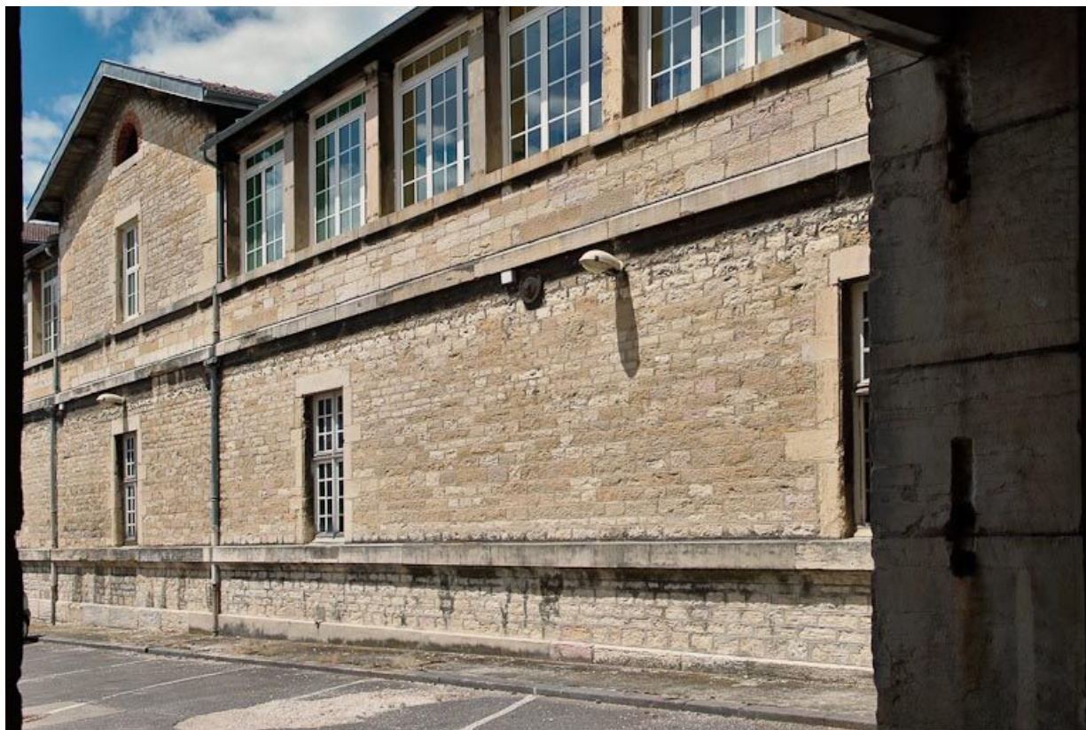
Aile centrale de l'asile d'aliénés : détail de l'élévation et jonction vers l'ancien portail de l'église. 21, Dijon, 1 boulevard Chanoine Kir