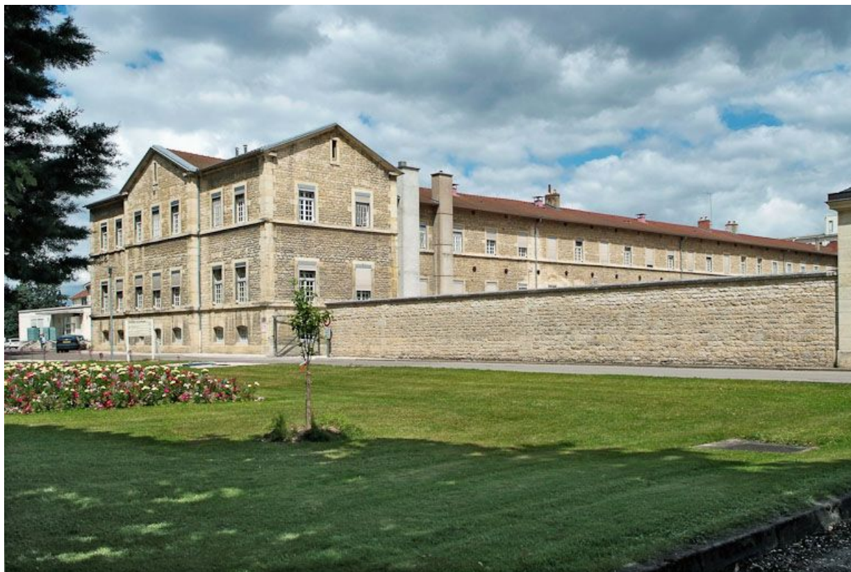
Aile est de l'asile d'aliénés et mur de clôture.