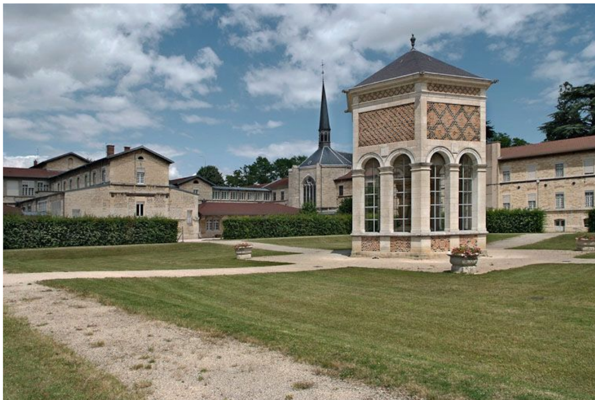
Cour de l'asile d'aliénés et édicule abritant le Puits de Moïse.