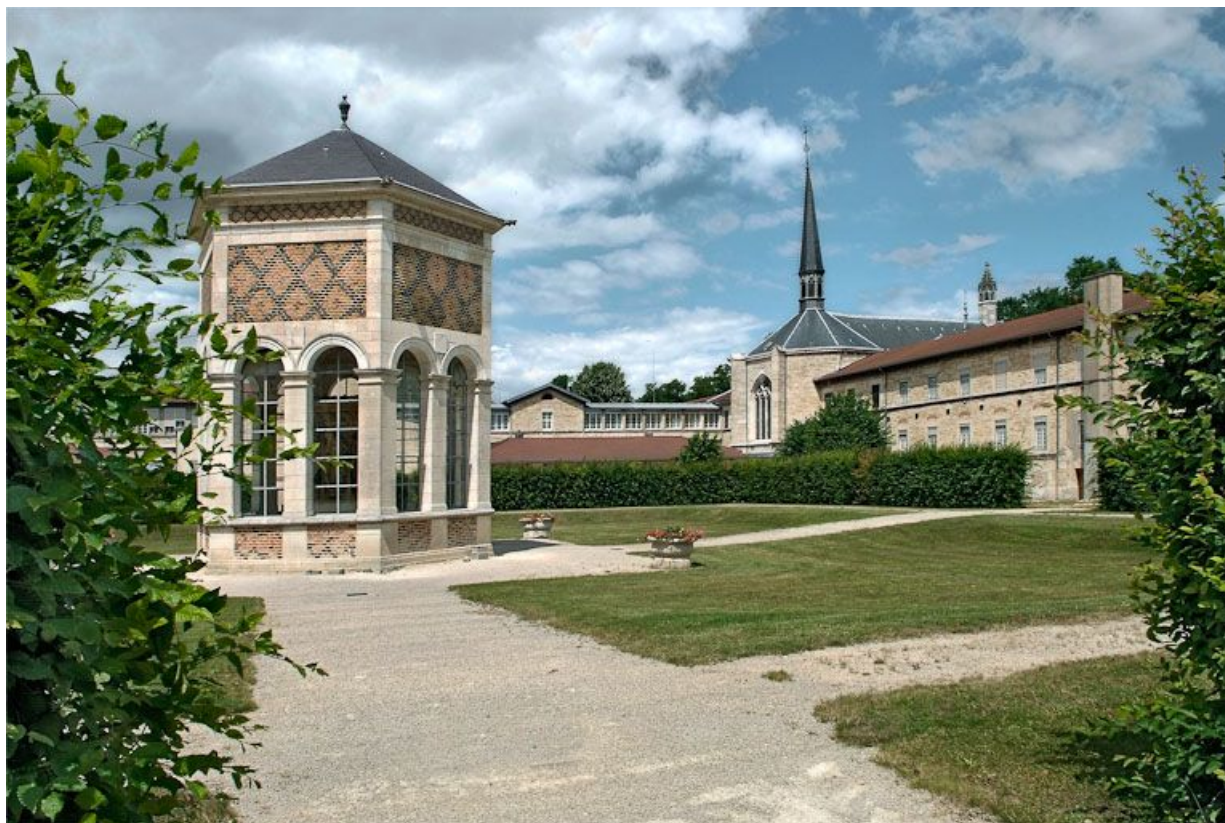
Cour de l'asile d'aliénés et édicule abritant le Puits de Moïse.