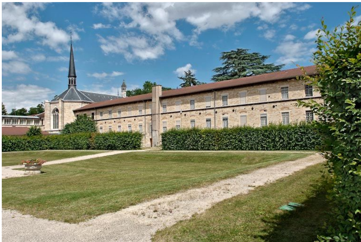
Cour de l'asile d'aliénés : vue vers l'aile ouest.