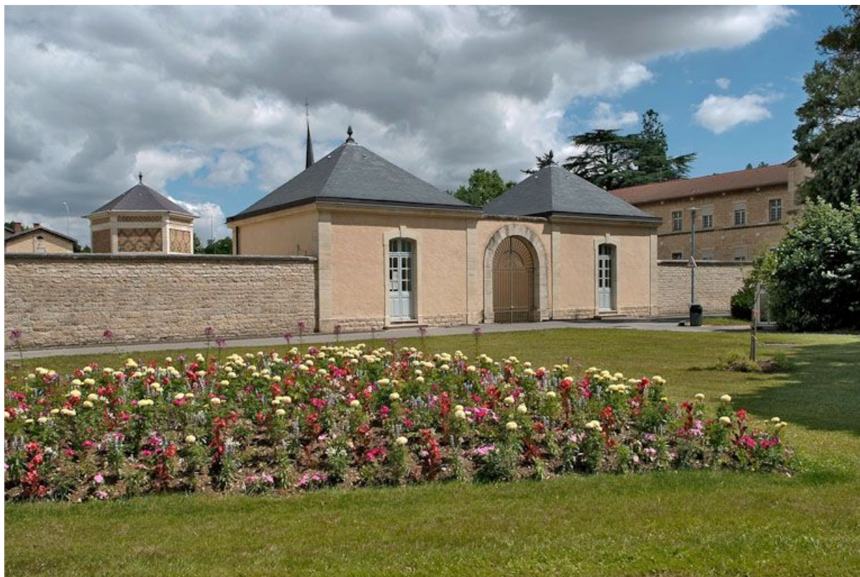
Grille et pavillons d'entrée de l'asile d'aliénés.