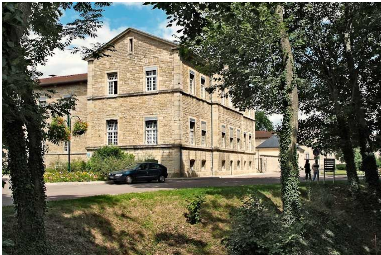
Aile est de l'asile d'aliénés et parc.