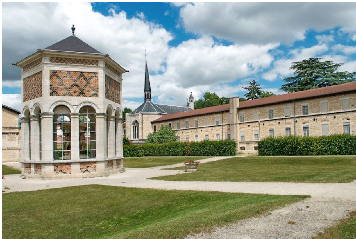
Cour de l'asile d'aliénés et édicule abritant le Puits de Moïse.