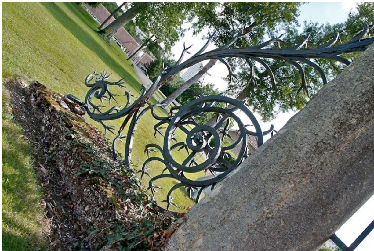
Ferronnerie ouvragée au pied des piliers du portail de l'hôtellerie.