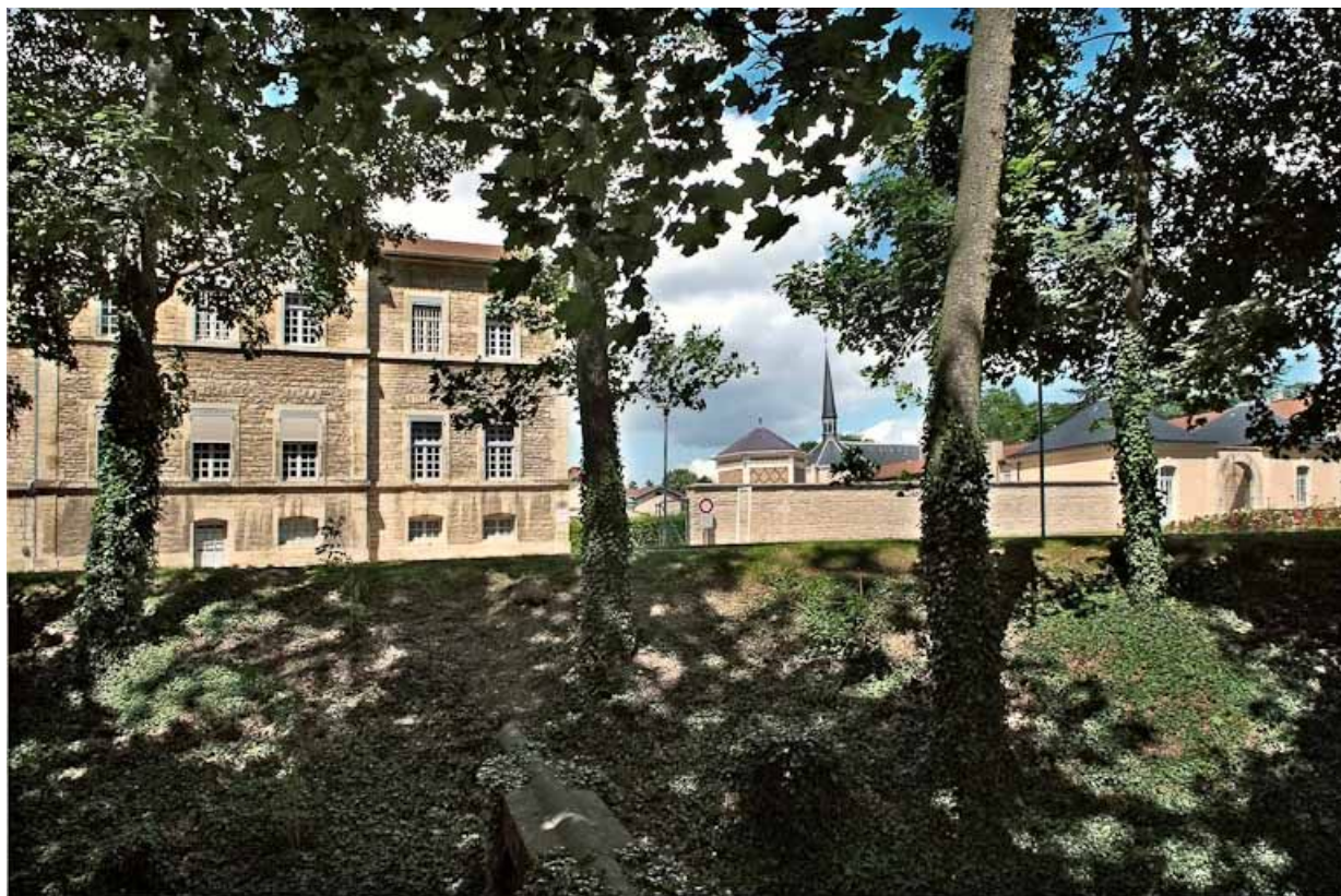
Aile est de l'asile d'aliénés : vue depuis le parc.