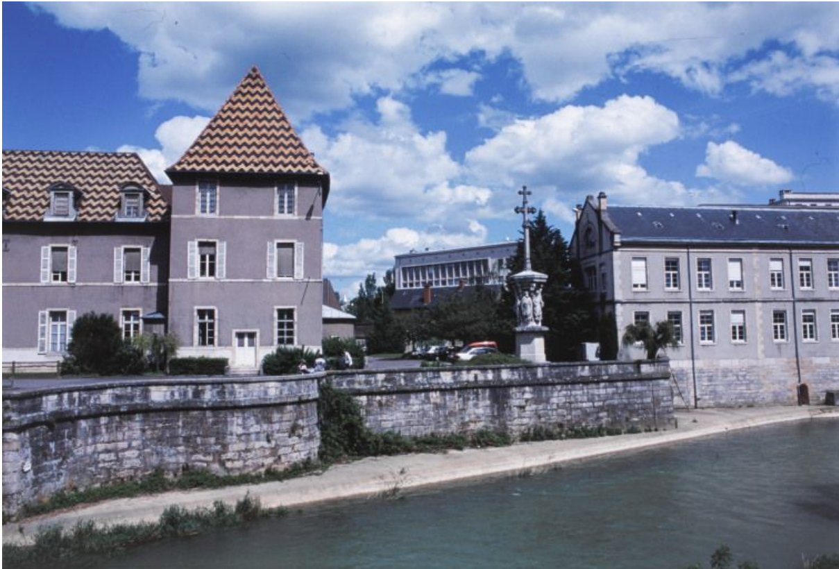
Façades postérieure (ouest) et latérale (sud). 21, Dijon Hôpital