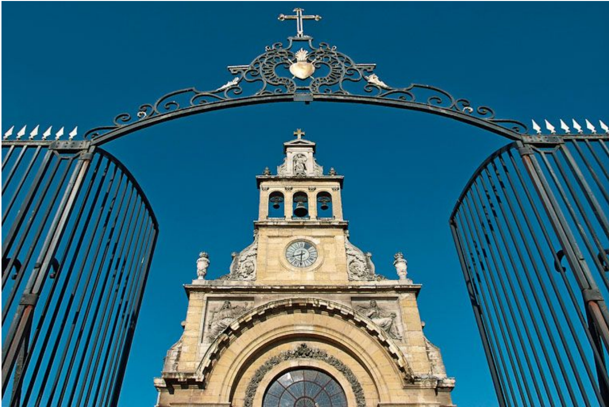
Partie supérieure, façade de la chapelle et grille d'entrée.