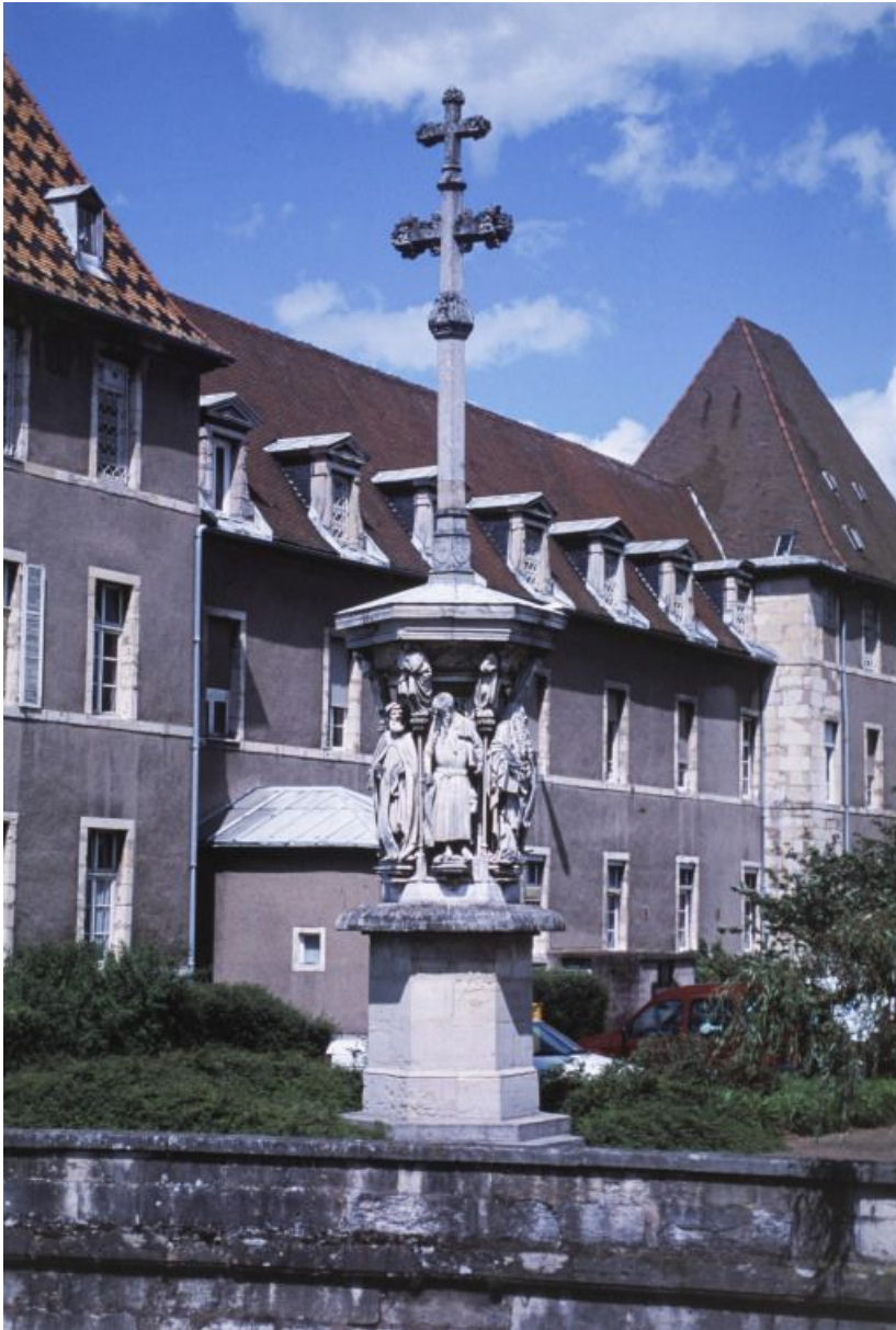
Croix de l'ancien cimetière.