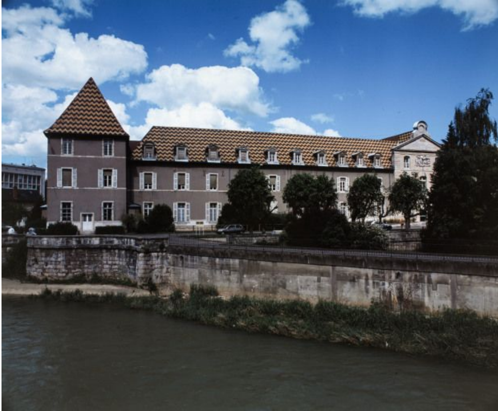
Façade postérieure (ouest) sur l'Ouche. 21, Dijon Hôpital