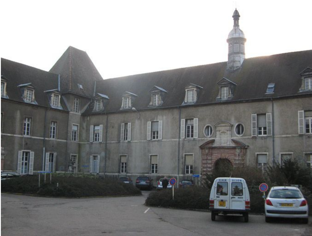
Vue de la cour.