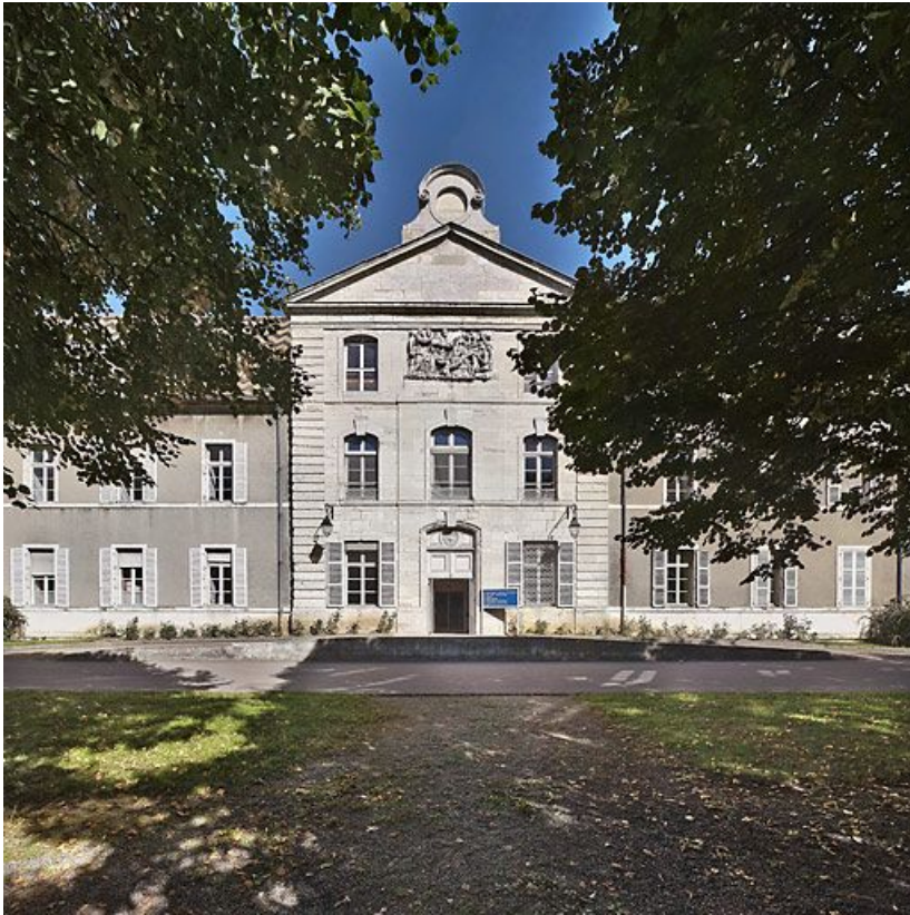
Façade sur l'Ouche, corps central.