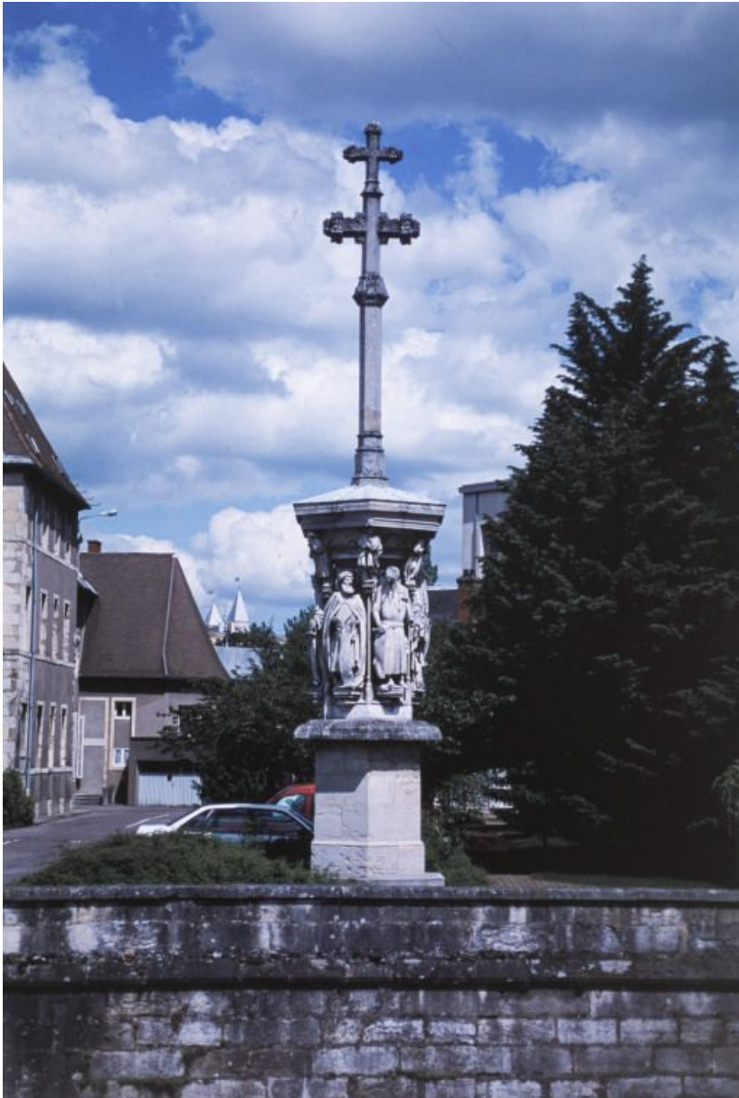
Croix de l'ancien cimetière.