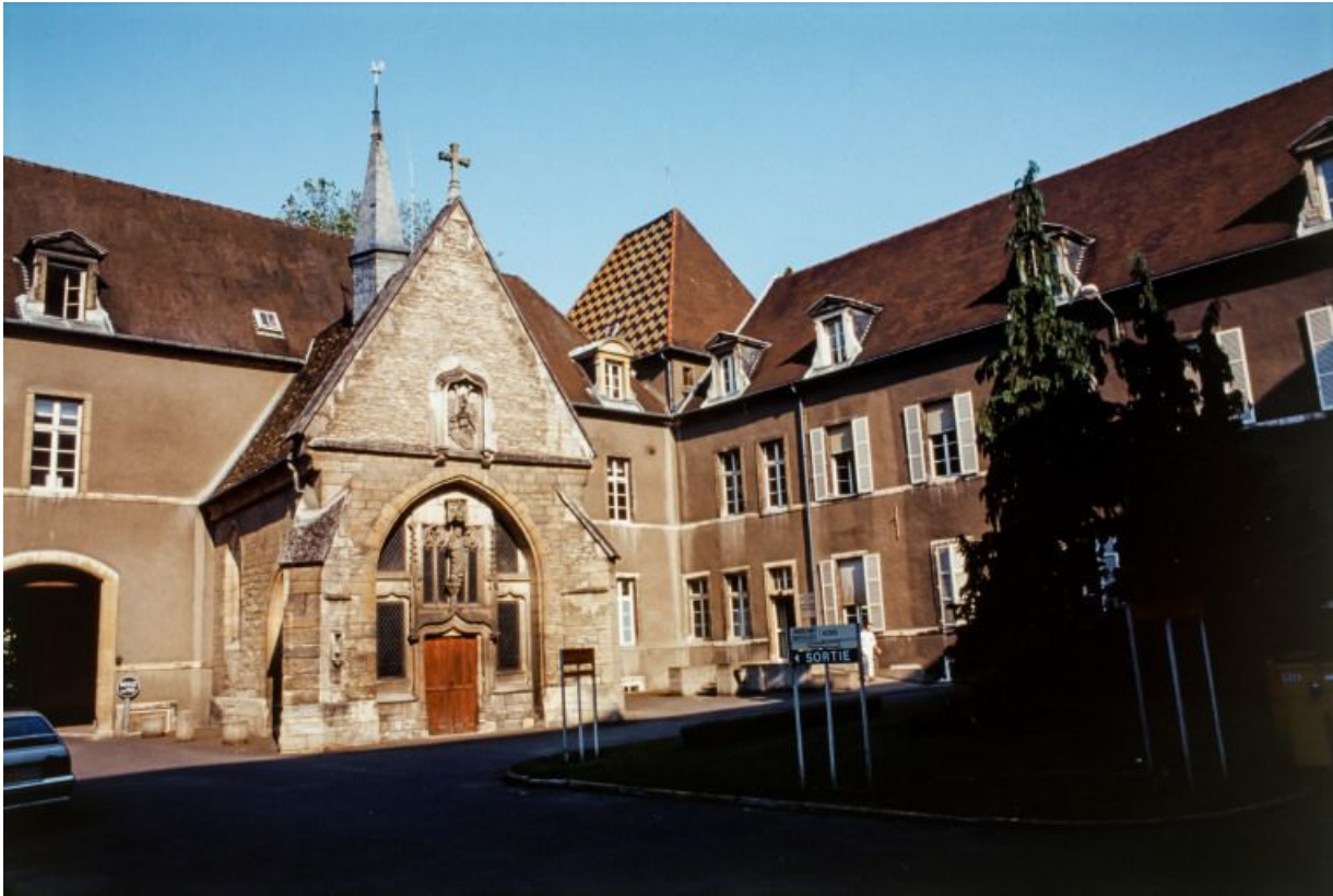
Deuxième cour et chapelle Sainte-Croix de Jérusalem.