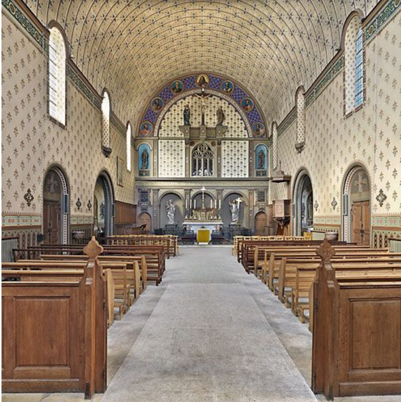
Chapelle, vue intérieure.