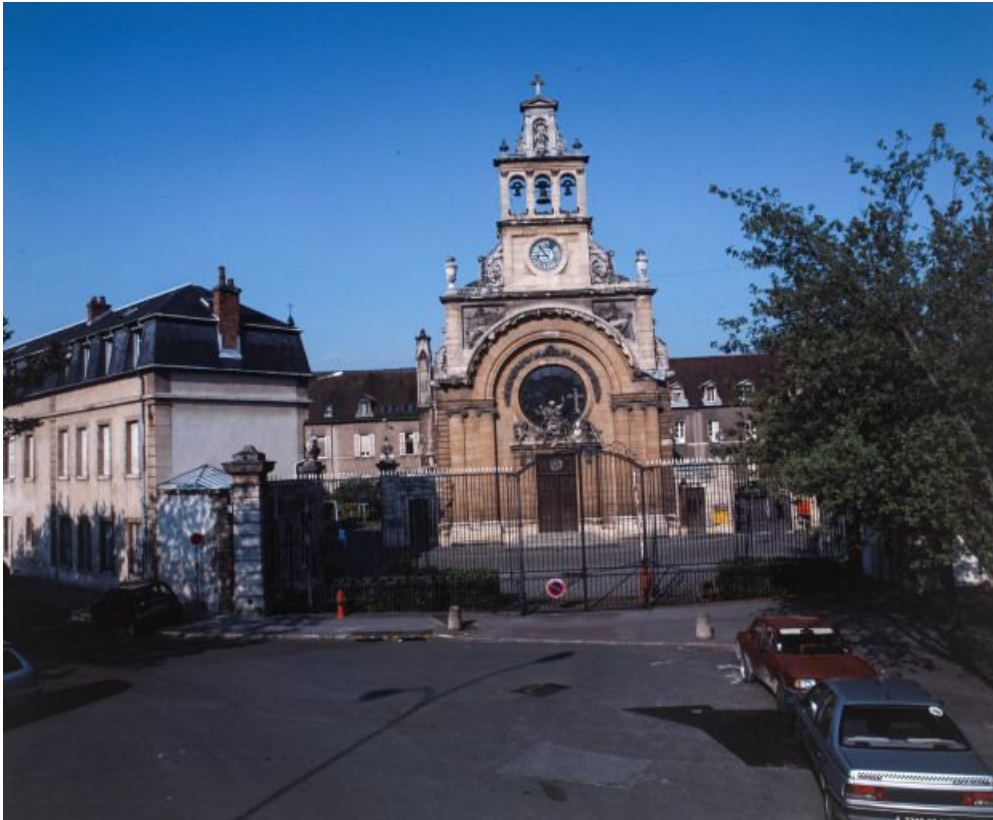
Vue d'ensemble avec la façade de la chapelle.