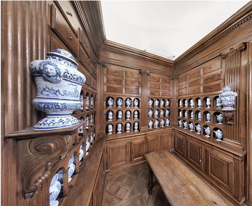
Apothicaire. 21, Dijon Hôpital