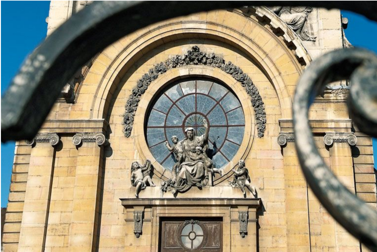
Façade de la chapelle, détail.