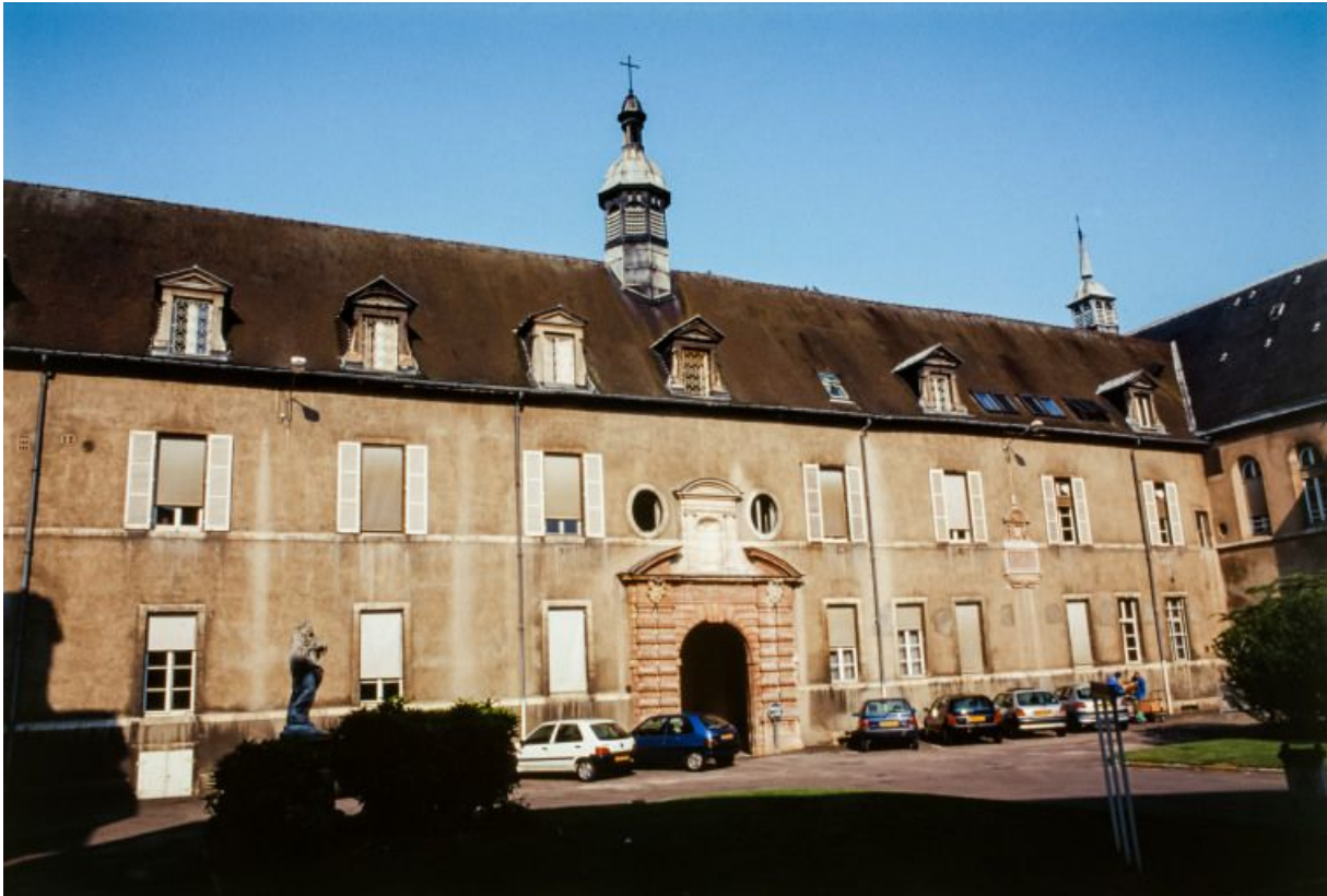
Passage couvert du bâtiment situé entre les deux cours sud. 21, Dijon Hôpital