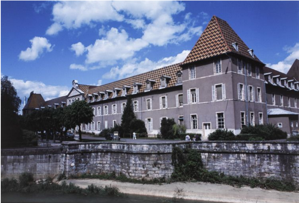
Façade postérieure (ouest) sur l'Ouche. 21, Dijon Hôpital