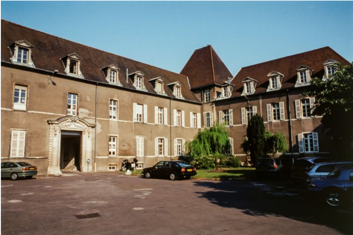
Première cour. 21, Dijon Hôpital