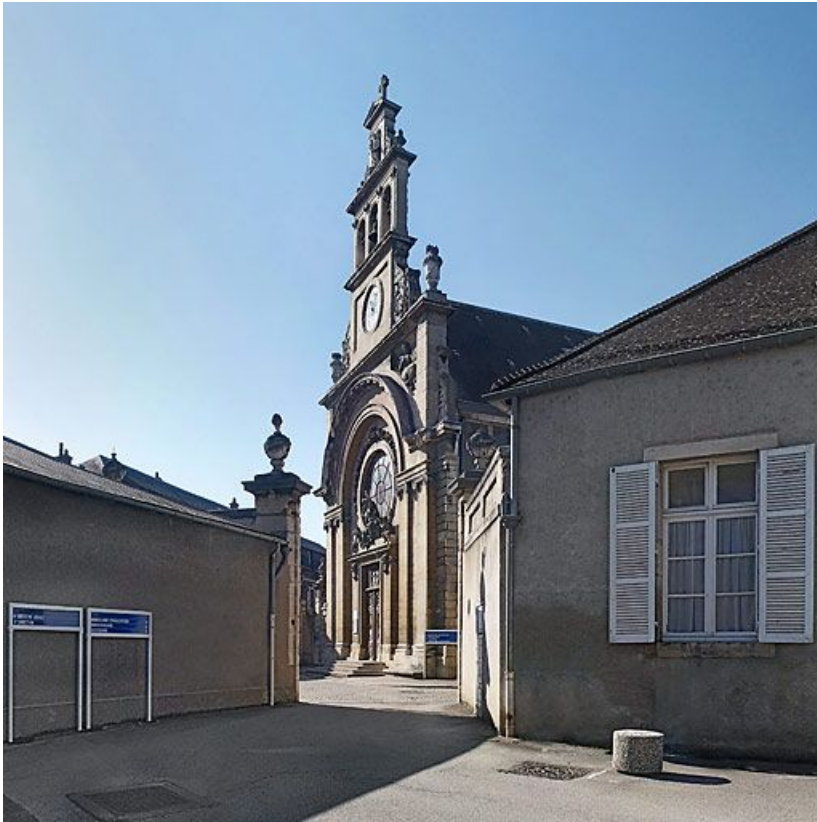
Façade de la chapelle vue depuis la cour antérieure droite. 21, Dijon Hôpital