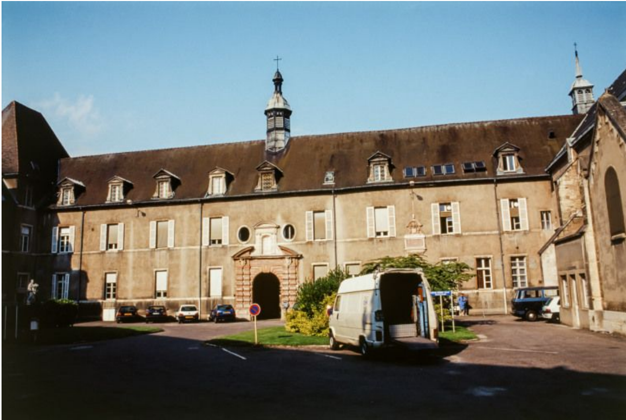
Cour au sud de la grande chapelle.