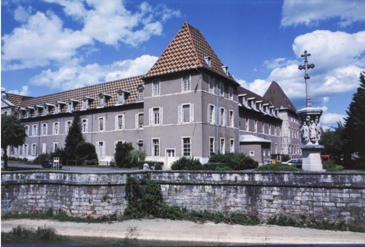
Vue prise du sud-ouest.