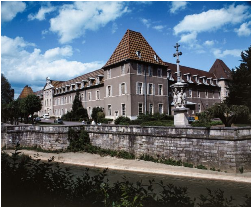
Façades postérieure (ouest) et latérale (sud). 21, Dijon Hôpital