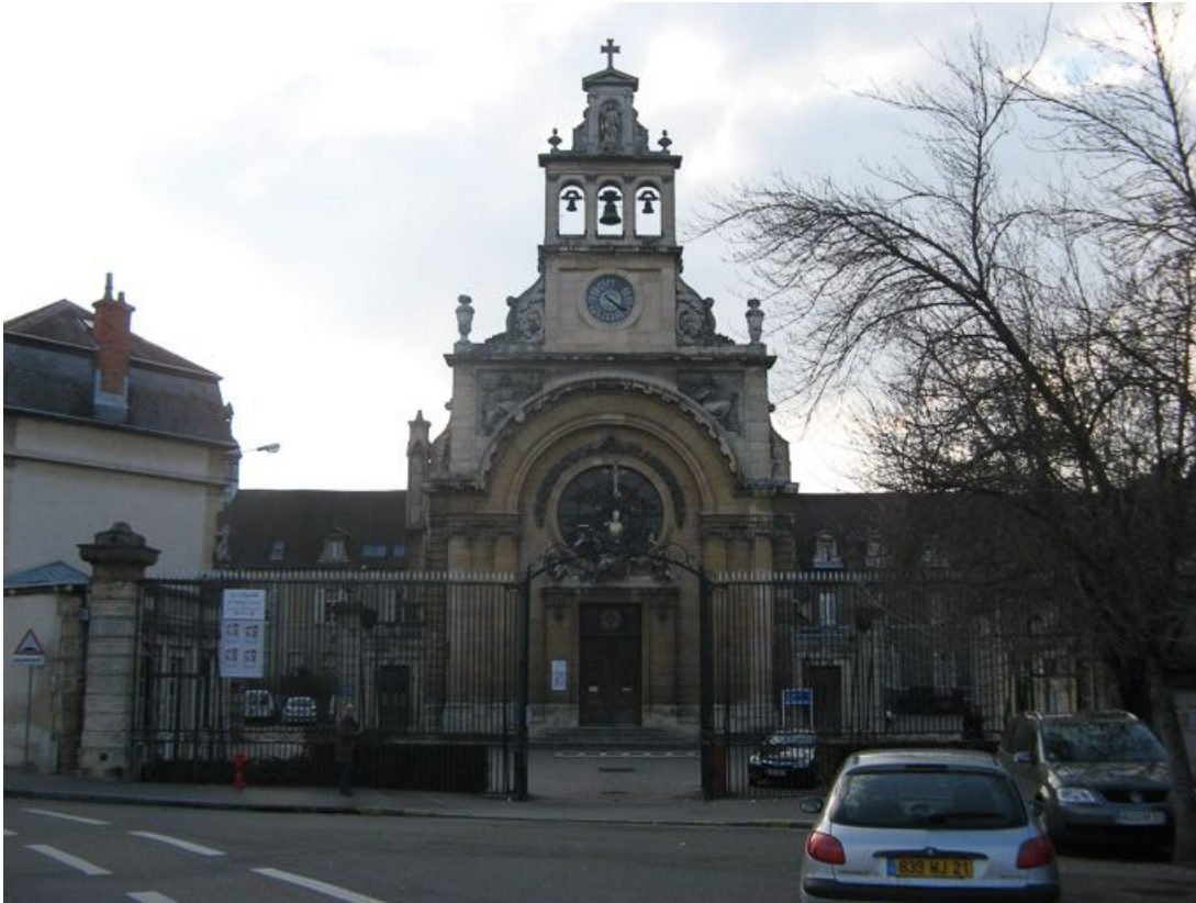
Vue de la chapelle.