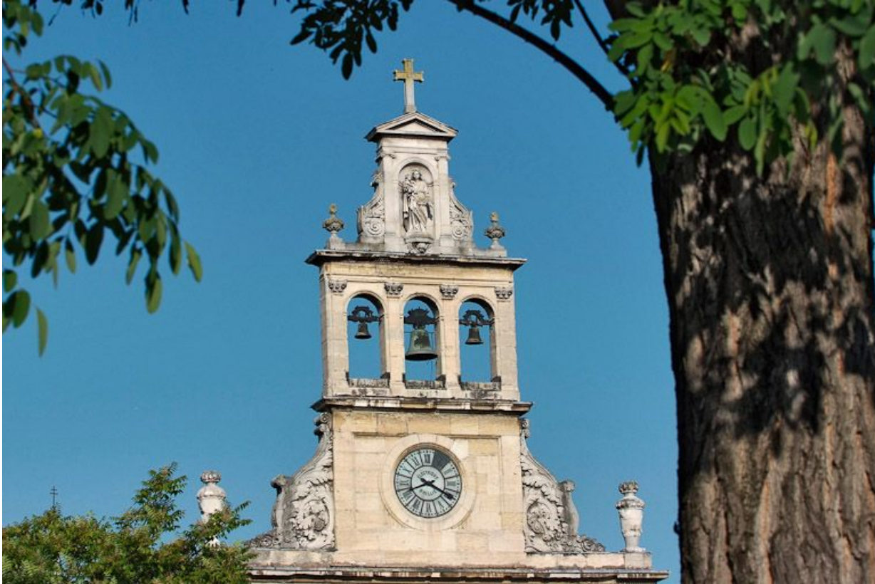
Couronnement de la façade de la chapelle.