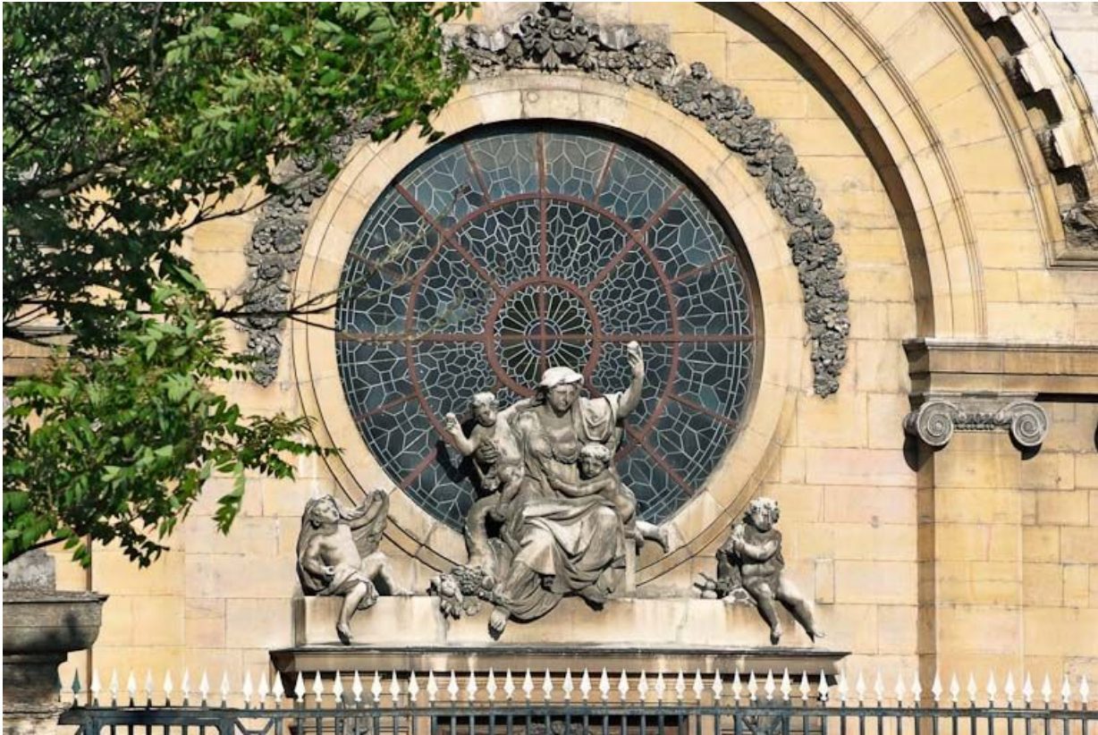
Façade de la chapelle, groupe sculpté : La Charité. 21, Dijon Hôpital