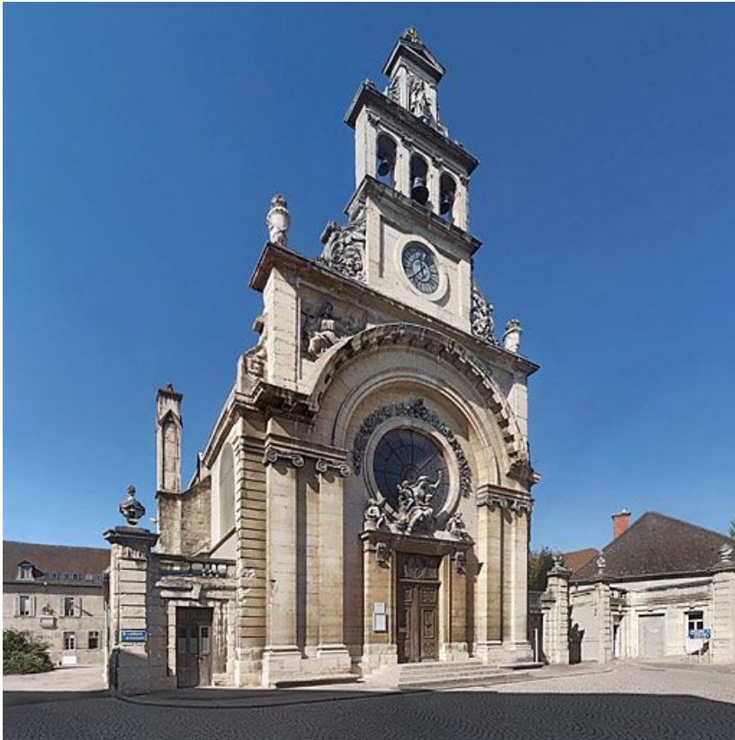
Façade de la chapelle.