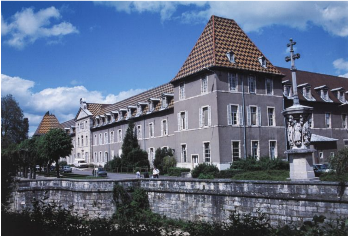
Façade postérieure (ouest) et croix de l'ancien cimetière.