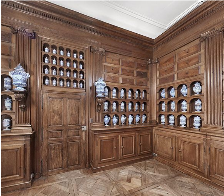
Apothicaire. 21, Dijon Hôpital